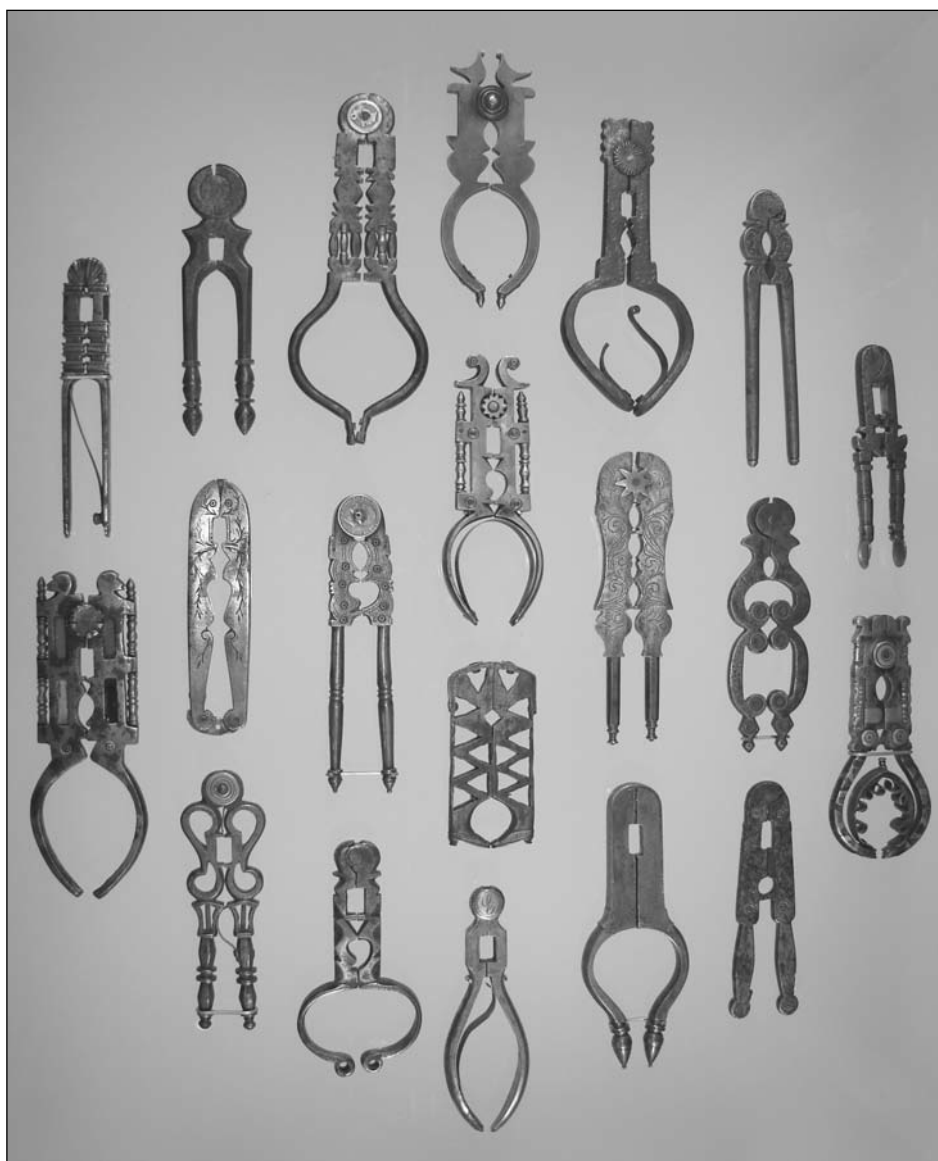
Foto 1. Conjunto de cascapiñones de diversas tipologías

El uso de estas pequeñas herramientas está ligado a una forma de consumo que no es la de mero ingrediente de receta culinaria. En los recetarios de Ruperto de Nola (1529) y Martínez Montaña (1611) los piñones se usan en onzas y libras, que requieren un método más expeditivo que el de partirlos uno a uno. De hecho el término cascapiñones alude al oficio de cascarlos y no a la herramienta. Sebastián de Covarrubias en su Tesoro de la lengua Castellana... (1611) añade que “era oficio de mozuelos locos y de poco asiento”. El viajero francés Jouvin en 1672 refiere que “... los piñones después de haberlos cascado y limpiado los llevan a las ciudades... para comerlos crudos”. Los piñones se cascaban con mazos de madera sobre piedras planas y se comercializaban mondados. También se tostaban, abriéndose una raja que facilitaba cascarlos con los dientes o apalancando en la rendija con un clavito con la punta aplanada (Foto 1).