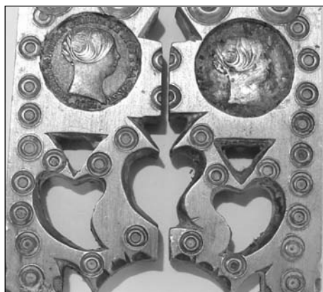
Foto 7. Triple corazón calado y monedas isabelinas. Bronce y plata (Col. Alarcos)

El desarrollo como pieza de ajuar y representación social es consecuencia del desarrollo económico que trae la desamortización de Mendizábal y la inyección monetaria que supone la explotación de terrenos baldíos y plantaciones de viña y olivar que requieren abundante mano de obra. Los cascapiñones reflejan esta bonanza económica. La fantasía, concepción estética y libertad creativa de los herreros se manifiestan de forma exuberante en la creación de estos pequeños utensilios, de manera que sobrepasan la mera funcionalidad y se convierten en depositarios de mensajes amorosos, como los de novia con su corazón calado o pájaros que se dan el pico; símbolos de riqueza con monedas de plata incrustada; alardes de ornamentación que llega incluso a los muelles. Incrusta lacre, plata, latón, alpaca; aplica cristales de colores; incorpora animales estilizados y convierte en celosías los brazos de los cascapiñones. Técnicamente los muelles de recuperación, que facilitan su uso, se esconden en la cabeza o lucen entre las patas como volutas enfrentadas, y se incorporan los muelles de gusanillo, de procedencia industrial, que junto al uso de resortes de muelle de reloj facilitan su manufactura a artesanos que no necesitan conocer la técnica de templeado y revenido del acero (Fotos 7-11).