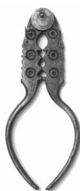
Foto 28. Cascapiñones con monedas de plata de Isabel II. 1855 (Museo Caro Baroja)