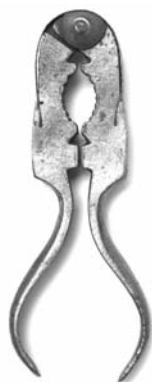
Fotos 26, 27. Cascapiñones de niño (Museo Caro Baroja)