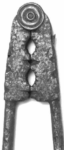
Foto 12. Detalle de cascapiñones de doble boca (Museo Caro Baroja)

El consumo de piñones como golosina y convite aumenta y da lugar a lucir estas pequeñas alhajas que reflejan un estatus social. Es más frecuente también en Navidades, Pascuas, día de las Cruces, San Antón, San Juan, fiestas patronales y romerías. Los procedentes de piñas verdes, llamados "en leche", se comían en caliente, tras asar las piñas para sacarlos, los 29 de junio, día de San Pedro, y los 15 de agosto, día de la Virgen. Existen cascapiñones con doble boca: la más cercana a la charnela, para los piñones "en prieto", cuya cáscara dura requiere más fuerza; la otra boca, más distanciada de la charnela, para los piñones "en leche", de cáscara más blanda y fácil de romper (Foto 12).