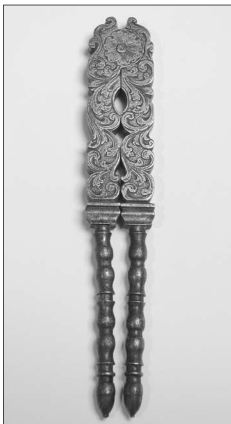
Foto 3. Cascapiñones cincelados y torneados. siglo XVIII. Hierro (Col. autor)

Un cascapiñón de hierro ricamente cincelado con la técnica y motivos propios de los arcabuceros de la Corte testimonia el consumo de piñones enteros, que había que cascar, en la sociedad urbana y cortesana del último tercio del siglo XVIII. Otro ejemplar (Museo del Traje, CE005696) datado entre 1776-1800 es de boj tallado y policromado. Ambas piezas son ejemplares de lujo. La de hierro es de patas rectas torneadas y sin muelle, tipología que procede del acial. La de boj, con muelle en cabeza, es del tipo pastoril que proviene de las tijeras de esquilar de resorte en cabeza, tijeras usadas ya por los iberos en el siglo IV a. de C. (Museo de Albacete. Yacimiento del Tesorico, Hellín) (Fotos 3 y 4).