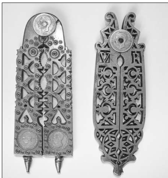
Foto 13. Izquierda. Piñonera de bronce calado con monedas de plata incrustadas. Doble boca y corazón calado. Derecha, piñonera de bronce calado en celosía con iniciales “V” y “R”, granadas y gran estrella (Col. Alarcos)

Los cascapiñones estudiados presentan características que permiten saber su destino: para los niños, de una longitud menor de 95 mm; de ajuar, cuando llevan el nombre o iniciales de la pareja; de novia, con un corazón calado y, a veces, con el nombre o iniciales de la novia; burgueses, grabados con motivos y técnicas propios de la orfebrería y armería, o de bronce calado en celosía y monedas de plata incrustadas; de maestría, de formas sofisticadas, técnica compleja y exuberancia decorativa; devotos, con motivos religiosos: cruz, cáliz, custodia, etcétera. La calidad de estas piezas se constata por las que han sobrevivido al uso constante durante generaciones. Es frecuente encontrar los muelles rotos y reparaciones que a veces cambian el muelle de cabeza por el de lengüeta al pie, o éste por el de arco al pie; también patas deformadas, y partidas en los de celosía de bronce (Fotos 13 y 14).