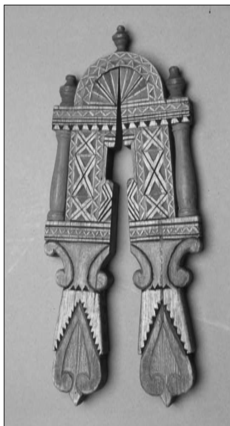
Foto 4. Cascapiñones tallados y policromados. Boj (Museo del Traje)

El consumo de piñones enteros o “en prieto”, y por ende el uso del cascapiñones, se difunde en paralelo por dos vías definidas por su tipología. La del acial –dos brazos rectos unidos por una charnela–, propio de la sociedad urbana, por la red radial de carreteras iniciada por Carlos III. Y la pastoril, hecho de una pieza de madera curvada que actúa como muelle de recuperación en cabeza, a través de las cañadas reales, donde las piñoneras de almez sirven de modelo a los herreros, como el ejemplar del museo del Traje (CE001866) y evolucionan gracias a la resistencia y versatilidad del hierro. Procedente de los alicates aparece una tercera tipología, cuyas patas curvas nacen del centro del cuerpo, con muelle en cabeza diferenciada, sujeto en sendas ranuras de lo que podríamos llamar hombros. En los ejemplares ricos el cuerpo, pequeño