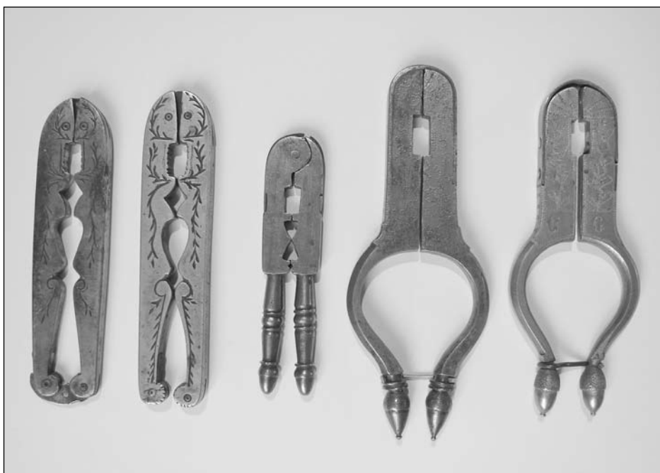
Foto 6. Derivados en hierro y bronce de la piñonera pastoril de izquierda a derecha: dos ejemplares de Mora, Toledo, el segundo de bronce con inscripción de propiedad en un costado y en el otro "Año D 1882. Echo en Mora" (sic); otro de niño en hierro con muelle encastrado en cabeza (roto); otros dos de patas curvas rematadas en bellotas, el segundo de bronce incluso el muelle