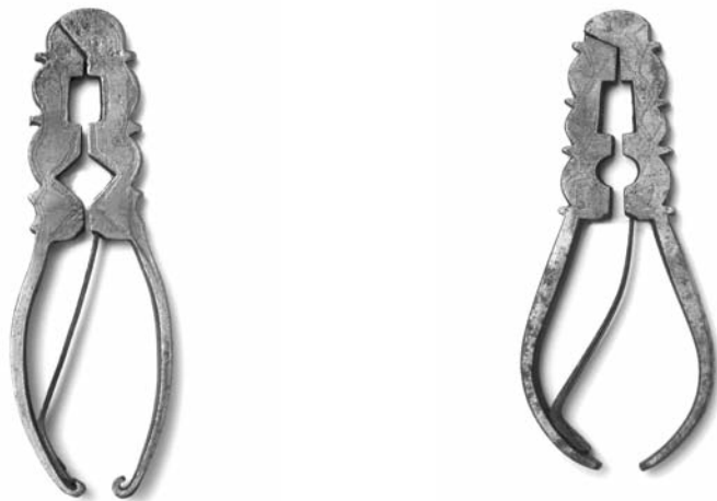
Fotos 22 y 23. Cascapiñones de lujo del taller de los “muelles recios” (Museo Caro Baroja)

timos, con dos piezas únicas de las tres conocidas. Los nueve ejemplares del museo navarro y los tres del Museo del Traje hacen el total de esta tipología en colecciones públicas (Fotos 22 y 23).