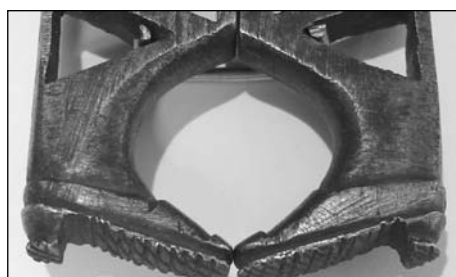
Foto 10. Zapatos en los pies de una piñonera. Hierro trabajado a lima (Col. Alarcos)