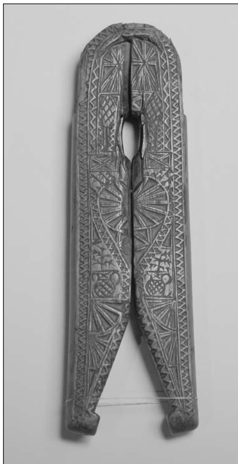
Foto 2. Cascapiñones pastoril. El corazón tallado indica que es regalo para la novia o esposa. Almez

El uso del cascapiñón supone una manera diferente de comercio y consumo. Cuándo empieza es difícil de dilucidar. Las fuentes dieciochescas no especifican si se comercializaban enteros, tostados o mondados. El Catastro de Ensenada (1751) dice que se dedican al comercio de piñones, como actividad secundaria, agricultores, yeseros y pastores. La intervención de los yeseros quizá este relacionada con el tostado de los piñones en sus hornos. La de los pastores explica la difusión del consumo del piñón entero junto a la piñonera, de madera de almez casi siempre. Los ejemplares de rica decoración tallada, al igual que otros enseres, cucharas, colodras, cajas de rapé, majaderos, polvoreras, etc., pasaban como obsequio al seno de la sociedad rural a lo largo de las cañadas de la Mesta. El Diccionario geográfico (1797) de Tomás López refiere que los piñones de los pueblos segovianos "suelen venderse a los manchegos y andaluces que pasan a Valladolid y otros que directamente vienen a cargar en 6 reales el celemín" (Foto 2).