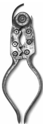
Fotos 29, 30, 31. Cascapiñones tipo alicate de diferentes talleres (Museo Caro Baroja)