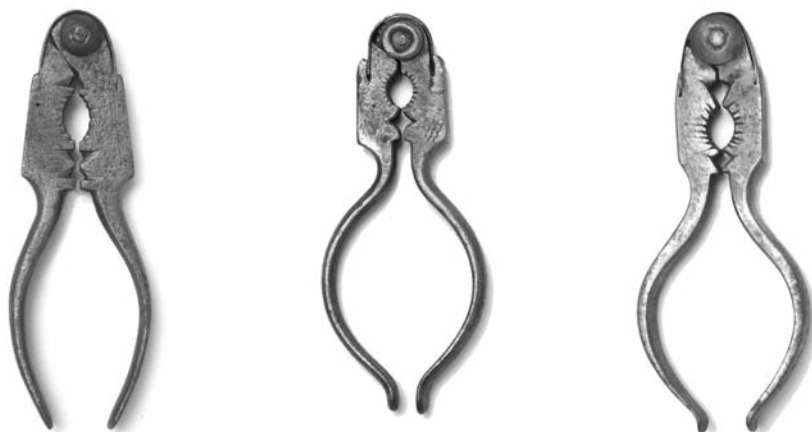
Fotos 36, 37,38. Cascapiñones de tipo alicate procedentes de diversos talleres (Museo Caro Baroja)