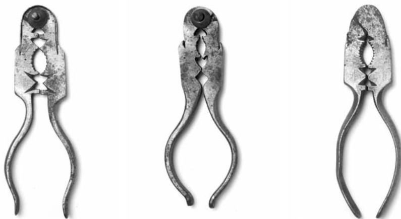
Fotos 42, 43, 44. Cascapiñones de tipo alicate procedentes de diversos talleres (Museo Caro Baroja)