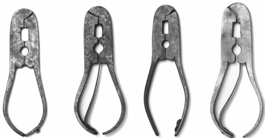
Fotos 16, 17, 18, 19. Cascapiñones del taller de los “muelles recios” (Museo Caro Baroja)

emparentados, de Cuenca (CE013566) y Albacete (CE013560), con charnela curva, adquiridos todos en 1952 (Fotos 16 a 21).