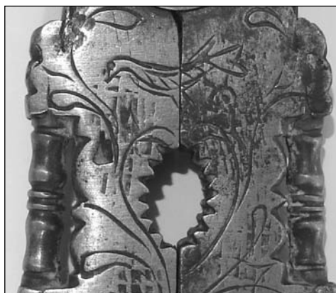
Foto 8. Pájaro posado en unas ramas. Hierro cincelado. Balaustres de bronce (Col. Alarcos)