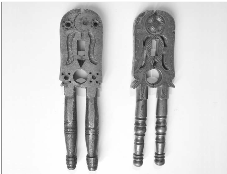
Foto 15. A la izquierda, cascapiñones de bronce de fundición en proceso de realización. Las patas con la superficie granulada y rebaba del molde de coquilla. El cuerpo, unido mediante la charnela limado con la boca y redoma calada bajo ella terminadas taladros decorativos en los extremos del cuerpo, y en el centro unas eses en proceso de calado mediante corrosión por ácido. A la derecha ejemplar acabado: patas torneadas, charnela con doble cubierta de cobre y latón, eses caladas y cuerpo cincelado en reserva con bellotas. Cantos decorados con iniciales de propiedad (Col. Alarcos)

muelles industriales, la fabricación de piñoneras es accesible a cualquier artesano del metal. Aparecen las piñoneras en bronce y se comercializan brazos de fundición que el artesano ajustaba, pulía, dotaba de muelle y ornamentaba (Foto 15).