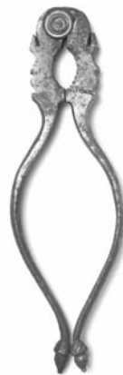
Fotos 32, 33. Cascapiñones tipo alicate de diferentes talleres (Museo Caro Baroja)