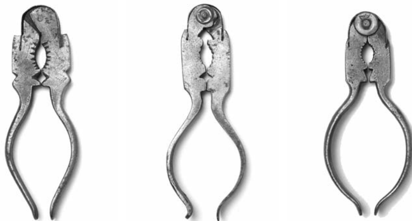
Fotos 39, 40, 41. Cascapiñones de tipo alicate procedentes de diversos talleres (Museo Caro Baroja)