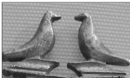
Foto 8. Copete con pájaros enfrentados. Hierro trabajado a lima (Col. Alarcos)