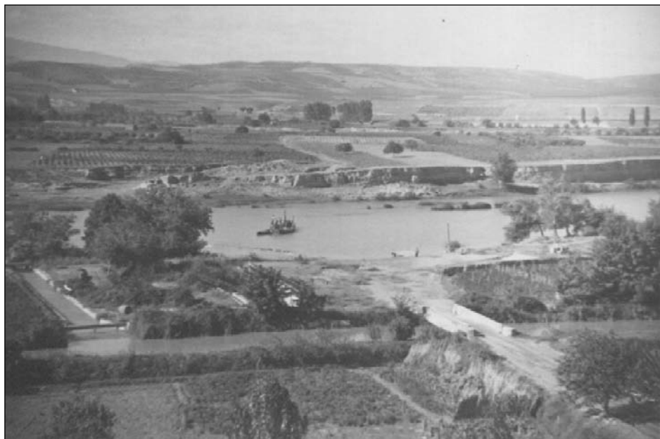
Foto 1. Antigua barca de Sartaguda en el Ebro

trevistas. Con ello pretendo recoger una serie de prácticas y elementos culturales derivados de la agricultura, junto con la visión de los encuestados sobre el mundo, cambiante, en el que viven.