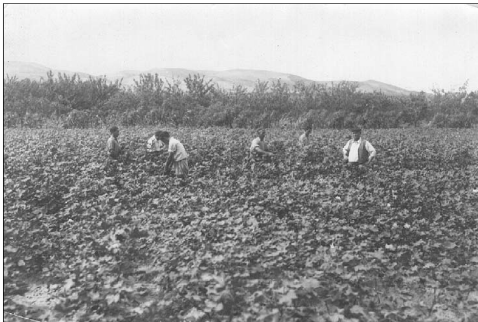
Foto 3. Recogida del algodón

Recientemente se ha impulsado el cultivo de la endivia por parte de un agricultor-empresario local. Sartaguda cuenta también con alguna de las empresas pioneras en Navarra en el cultivo de fruta ecológica.