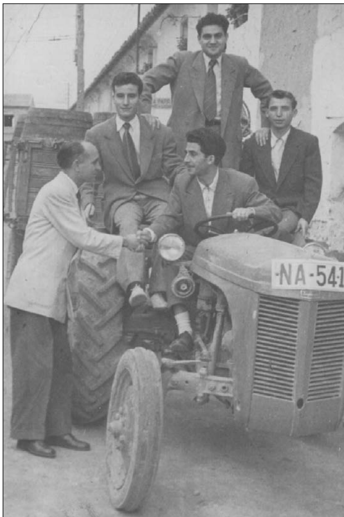
Foto 6. Cuadrilla en tractor

Los tractores llegaron a Sartaguda a finales de los cincuenta y para mediados de la década siguiente ya estaban totalmente implantados. Uno de los encuestados, de 51 años, recuerda haber visto algún carro tirado por bueyes en su infancia. Los tractores “lo cambiaron todo” (Foto 6). Dicen los dos encuestados de mayor edad que pasaron “sin cursillo previo de ganaderos [por las caballerías empleadas en la agricultura] a tractoristas”.