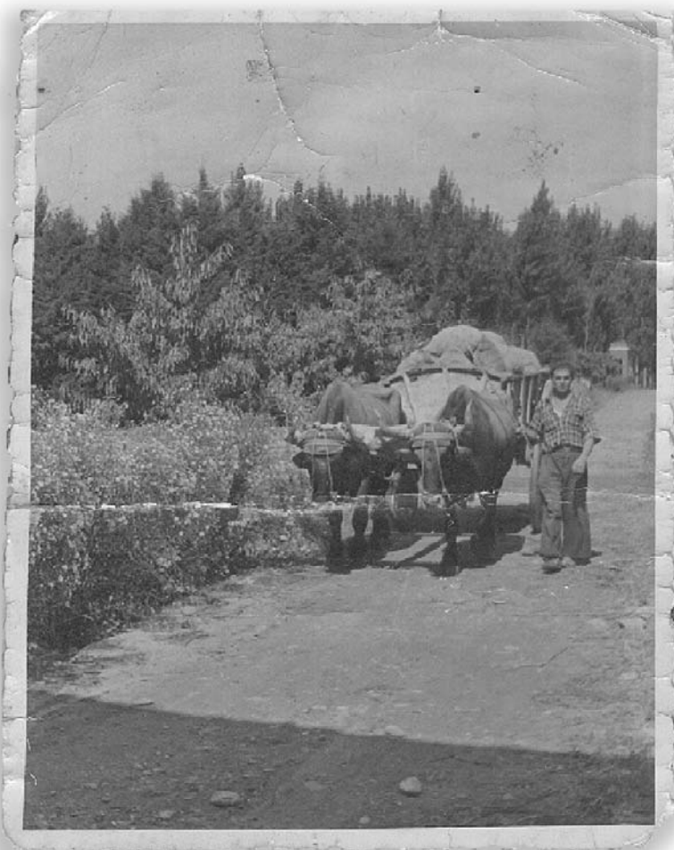
Foto 7. Carro de bueyes

A continuación se enumeran algunos de los aperos que se utilizaban y su función. Arados: con brabán y vertedera o mariposa. Servían para “desfondar” el suelo, labor que ahora se lleva a cabo con el tractor. Los “borrachos” servían para limpiar las cepas de una manera más fácil que con las azadas. Se usaban mazas de madera para “destolmar”, cosa que ahora hace el “rotabator” o rotor. Los encuestados remiten al museo etnográfico de Peralta para ver in situ una buena muestra de aperos y herramientas antiguas similares a las empleadas en Sartaguda. Resulta significativo de la época actual que los agricultores encuestados sean conscientes de la naturaleza museológico-etnográfica de las herramientas anteriores a la mecanización de la agricultura.