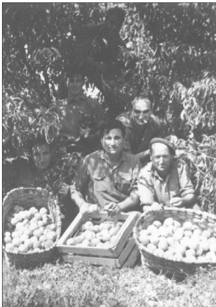
Foto 4. Recogida de fruta

alubias secas se “ponen” después de San Fermín; la recogida de la fruta se prolonga durante todo el verano (Foto 4).