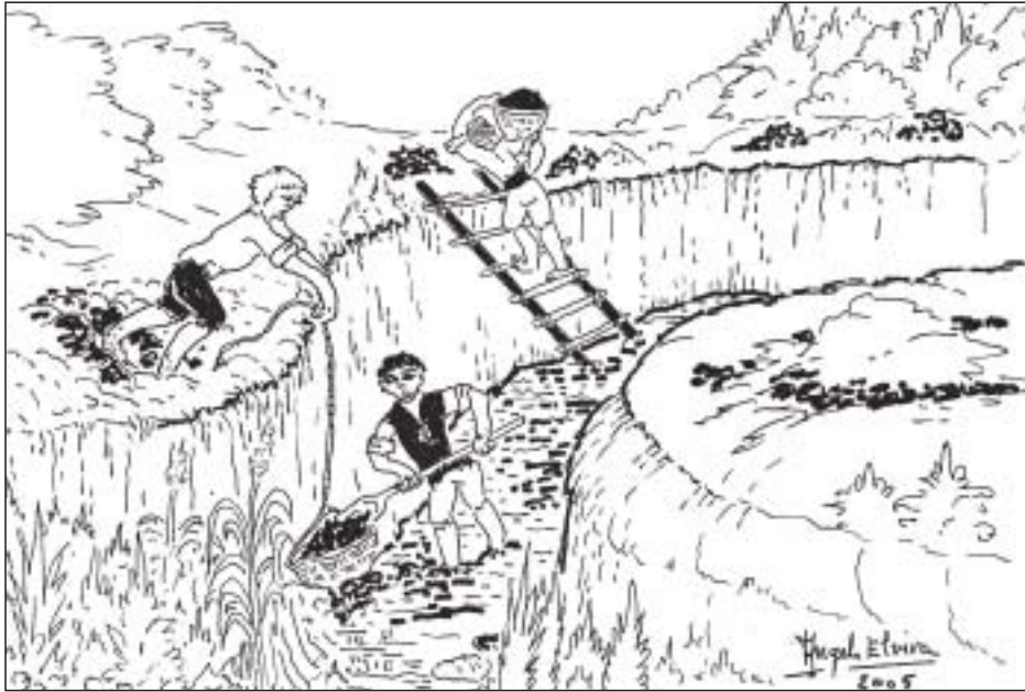
Limpia del río Molinar

274 reales por la conducción de 1.000 robos de pan metalenco al Palacio de Lerín, tres cargas de conducción, se hicieron desde Lodosa (1747).