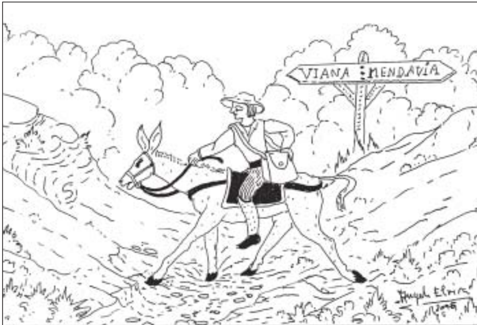
Correo de la villa