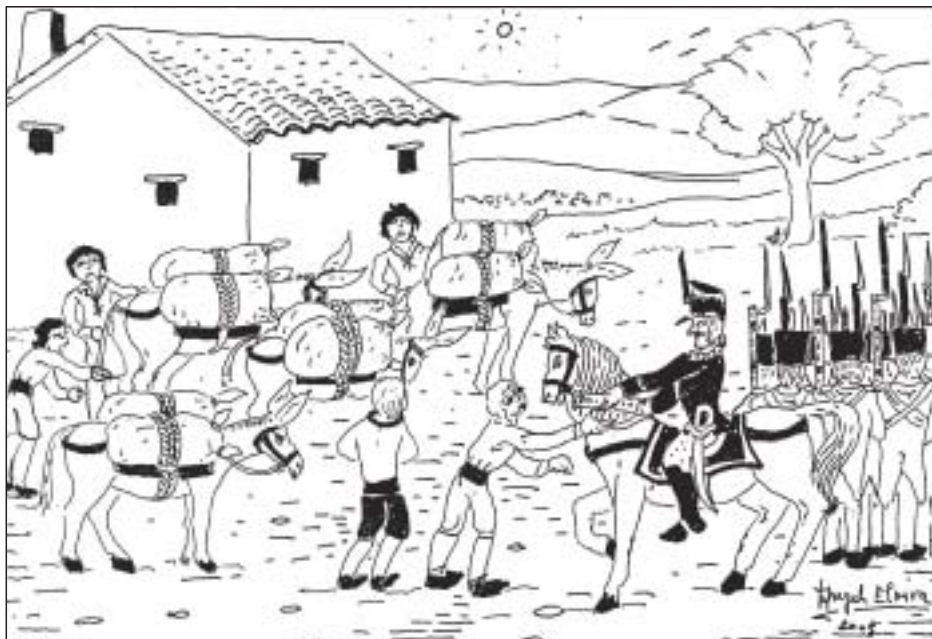
Trigo para las tropas francesas

350 robos los entregó el tesorero de la villa, los restantes, los tomaron unos soldados, que sin cuenta ni razón se introdujeron en el granero de la villa. No dieron bonos ni razones.