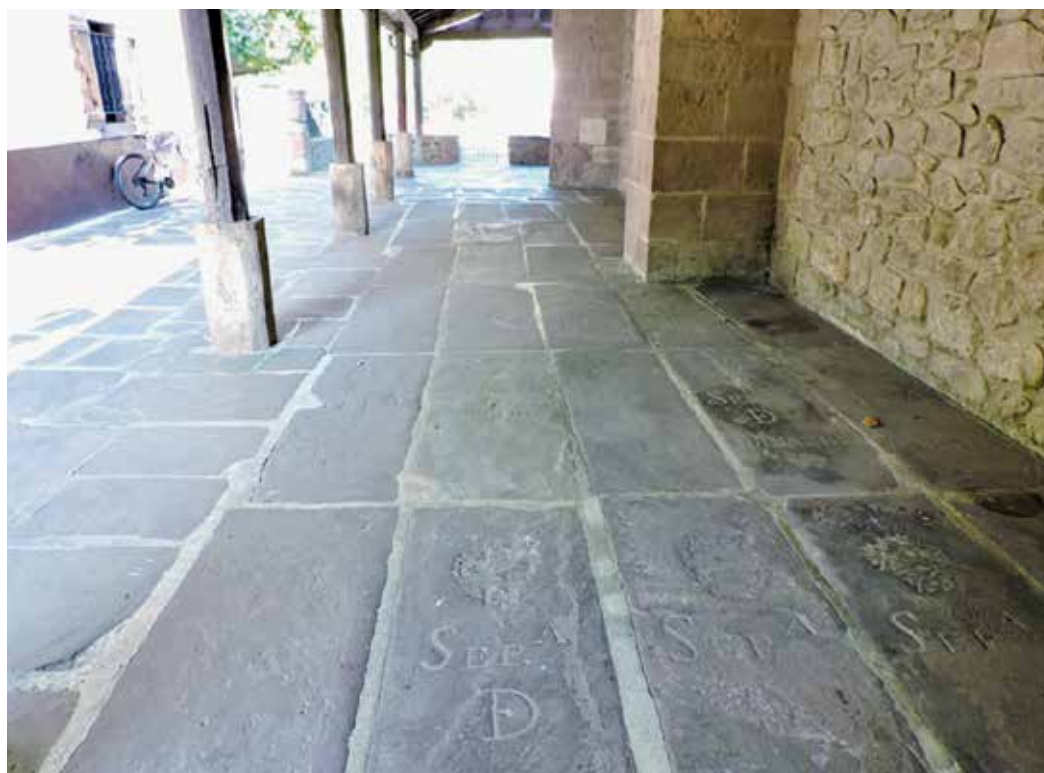
2. irudia. Eliz atariko irudi orokorra.

Hobiak familiarrak dira, etxe bakoitzekoa. Kasu gehienetan, gurutze latindar xume bat agertzen da goiko partean eta epigrafiak behekoan. Epigrafiak eta dekorazioak teknika ebakiaren bidez eginak daude. Hiru kasutan ( Aranaztarrena , Espelosin eta Auloa ), baina, epigrafiak erliebe lauan landurik dago. Baliteke pieza erliebedun hauek zaharxeagoak izatea, edo agian, maila sozioekonomiko hobekixeago erakustea. Apaingarri ezberdina agertzen da Sacerdotal izeneko hilobi lauzan, lore moduko irudi bat baitago beheko aldean. Dekorazioari erreparaturik, biziki deigarria suertatzen da gurutze guztiak berzizelkatuak daudela ikustea, sinbolo kristaua ezabatzeko asmoz. Gurutzeak egin eta geroagoko uneren batean gertatu behar izan zen, argi dago, eta zizelarekin egin zenez, ez dirudi gaur egungo ezabaketa izan denik.