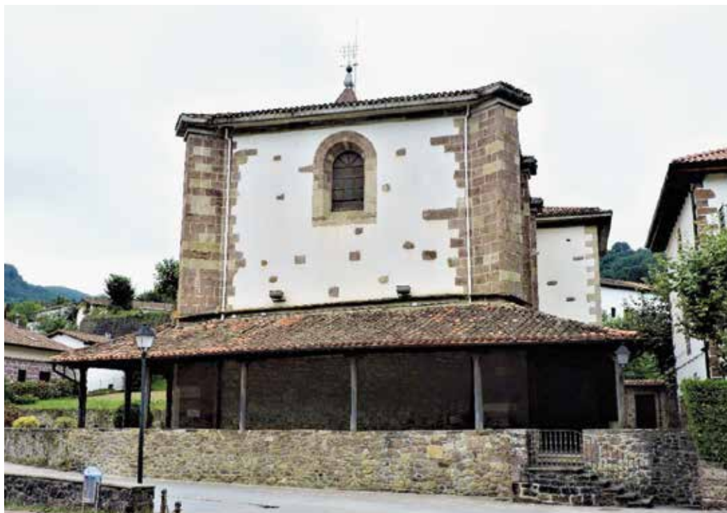
1. irudia. Sunbillako Done Joane Bataiatzailearen parrokia.

zen, lanak 1628an amaituz. 1861ean, bertze zabaltze bat izan zuen eraikinak, dorrea, gurutzadura, sakristia eta burualdea elizari gehituz. Orduko berritze lanetan, tenpluaren orientazioa aldatu zen, errekaaren gertutasuna ekiditeko. Elizako azken eraberritze lanak 1971. urtean egin ziren, hain zuzen ere, teilatua konpontzeko (García, 1989, 593-596. or.). Egun, San Tiburtzio eliza hondaturik badago ere, XIX. mendearen erdialdera artio gurtzarako erabili ziren bi elizak.