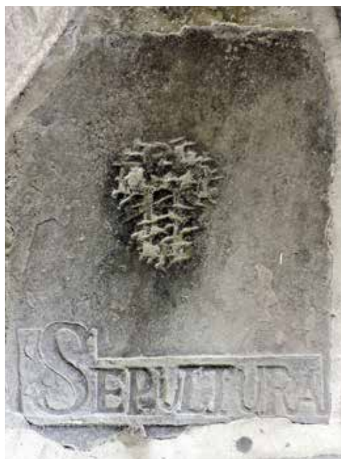
4. irudia. Erliebe lauan eginiko idazkuna.

Epigrafiaren antolaketa lerrorik gabekoa da, Aranaztarrena , Espelosin eta Auloa kasuetan izan ezik. Idazkunak gaztelaniaz idatzirik daude, Karolina letra larrian. Hala ere, lauzaz guztietan kaligrafia ez da kalitate berekoa eta zenbait kasutan letra modu traketsagoan idatzia dago ( Bastagillenea , Arrigaztelua , ...). Hizki handien artean hizki txiki bakan batzuk tartekatzen dira, g eta h , hain zuzen ere. Formula epigrafikoa xumea da eta hiru modutan idatzirik dago, funtsean oso antzekoak: SEP. /A DE + etxe-izena –formularik ohikoena dena–, SEPULTURA DE + etxe-izena, DE LA CASA DE + etxe-izena. Azken honetan, baina, ez dago jakiterik testuaren hasieran Sepultura hitza ote zegoen, Sepultura izenaren laburdura erabiltzen da kasu gehienetan eta hizki elkarketa bat ikus daiteke DE preposizioaren kasuan. Horrez gain, aipatu behar da Sacerdotal izeneko hilobia ez dela etxe baten izena, apezten hilobia baizik.