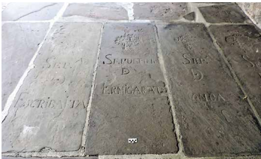
3. irudia. Hilobi-lauzak.

Epigrafiaren antolaketa lerrorik gabekoa da, Aranaztarrena , Espelosin eta Auloa kasuetan izan ezik. Idazkunak gaztelaniaz idatzirik daude, Karolina letra larrian. Hala ere, lauzaz guztietan kaligrafia ez da kalitate berekoa eta zenbait kasutan letra modu traketsagoan idatzia dago ( Bastagillenea , Arrigaztelua , ...). Hizki handien artean hizki txiki bakan batzuk tartekatzen dira, g eta h , hain zuzen ere. Formula epigrafikoa xumea da eta hiru modutan idatzirik dago, funtsean oso antzekoak: SEP. /A DE + etxe-izena –formularik ohikoena dena–, SEPULTURA DE + etxe-izena, DE LA CASA DE + etxe-izena. Azken honetan, baina, ez dago jakiterik testuaren hasieran Sepultura hitza ote zegoen, Sepultura izenaren laburdura erabiltzen da kasu gehienetan eta hizki elkarketa bat ikus daiteke DE preposizioaren kasuan. Horrez gain, aipatu behar da Sacerdotal izeneko hilobia ez dela etxe baten izena, apezten hilobia baizik.