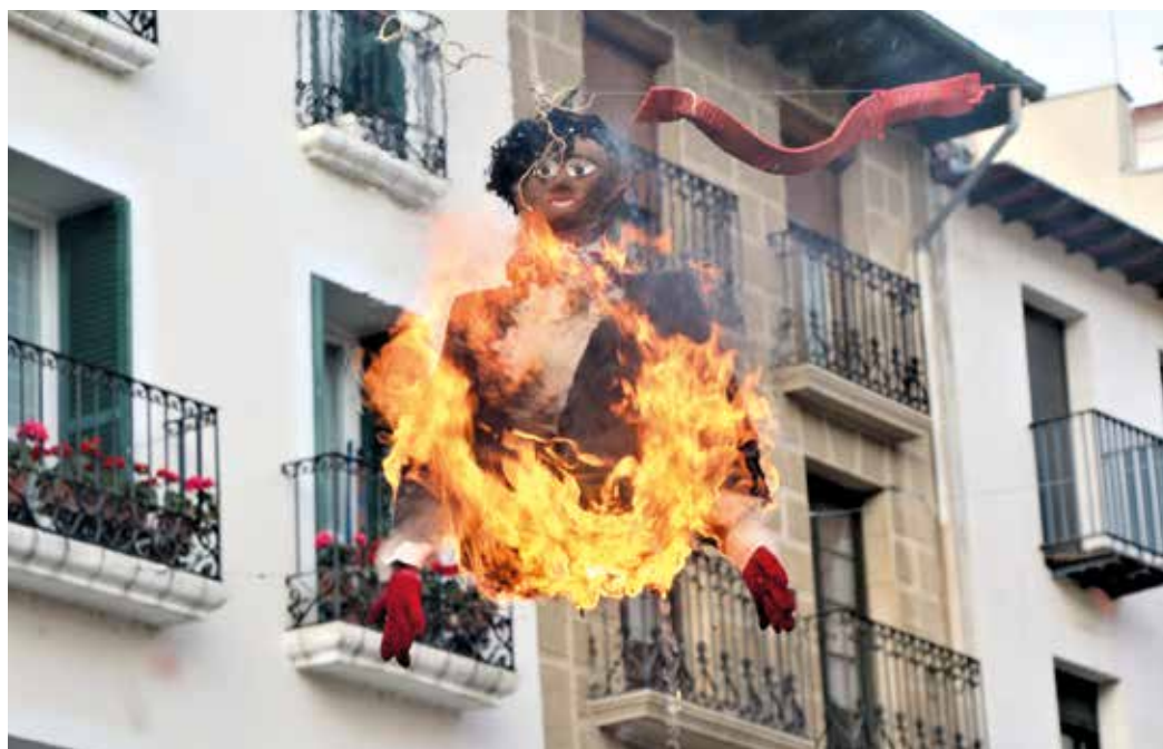
Figura 1. Judas es el mal personificado en un pelele de paja que es destruido mediante el fuego.

Es costumbre quemar los Judas en calles y plazas públicas cercanas a las parroquias. En Cabanillas dan muerte a Judas en el balcón de una casa cercana al ayuntamiento; En Estella-Lizarra en la plaza. En Los Arcos en un parque. En Murieta en el frontón junto a la iglesia. En Samaniego en un rincón de las paredes de la iglesia, en donde son visibles los sillares ennegrecidos desde hace décadas. En Moreda de Álava en la plaza de la Concepción con una larga soga, que va desde una casa señorial al cementerio de la iglesia de Santa María de Moreda. En otros lugares en una calle con una cuerda, que va del balcón de una casa al de la de enfrente.