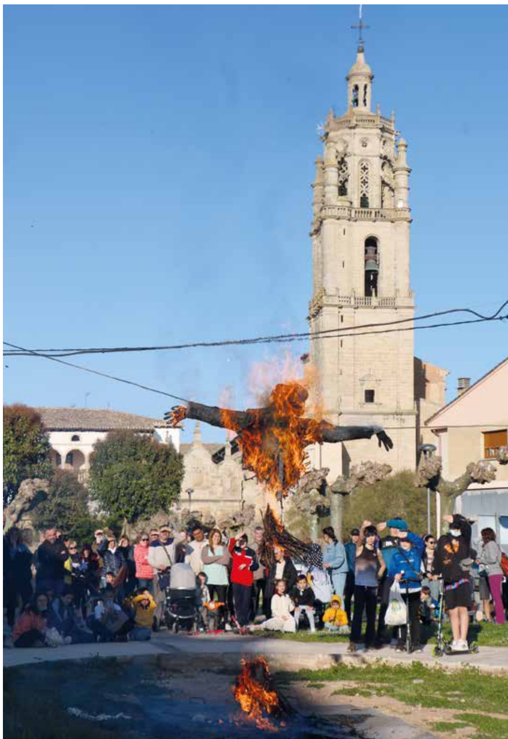
Figura 15. Quema del Judas en presencia de los vecinos y vecinas de Los Arcos.