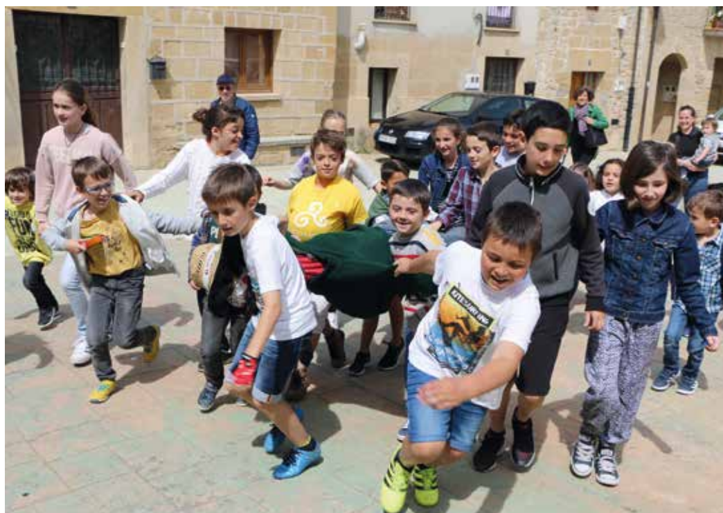
Figura 18. Paseo del Judas por los niños en Samaniego.

Judas, en forma de muñeco trajeado con corbata y sombrero, relleno de paja, escucha impasible la sentencia mientras permanece empalado en la punta de un árbol seco, plantado en las inmediaciones del antiguo palacio de la familia Samaniego. Los textos que los diferentes actores leen durante el juicio a Judas están muy bien trabados y poseen calidad literaria.