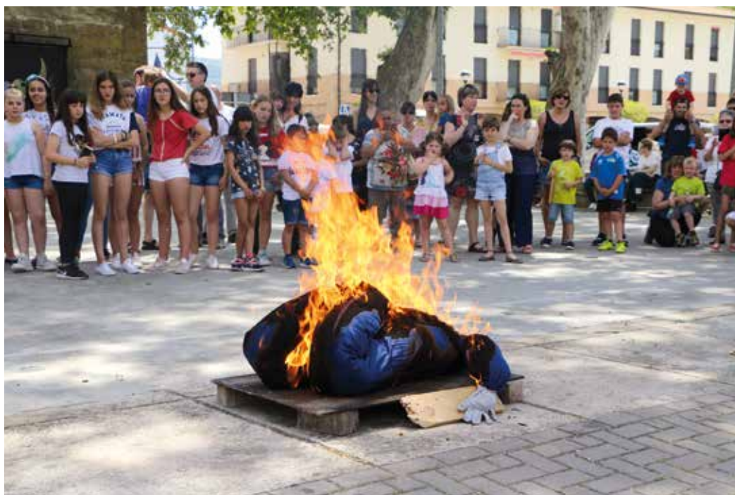
Figura 9. El Judas es quemado en Murieta a finales del mes de mayo.

alzamiento del mayo dando las órdenes precisas a los vecinos tiradores de la soga. El árbol a cierta altura lleva enganchada una larga soga que es tensada y tirada por numerosos vecinos que se encuentran al otro lado del frontón, en la calle San Esteban. Luego, para que quede sujeto con seguridad, es amarrado el tronco al paredón del frontón con una abrazadera.