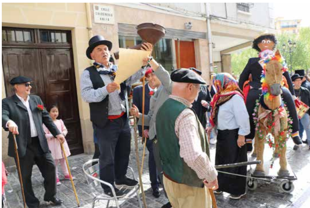
Figura 5. Bando leído en Estella en 2019.

Hoy Judas camina montado en un caballo de cartón con ruedas y el lugar donde se quema es la plaza de Santiago. Antes lo llevaban en un caballo de carne y hueso. El pasacalle de Judas suele acompañarse con la música de los gaiteros de Estella.