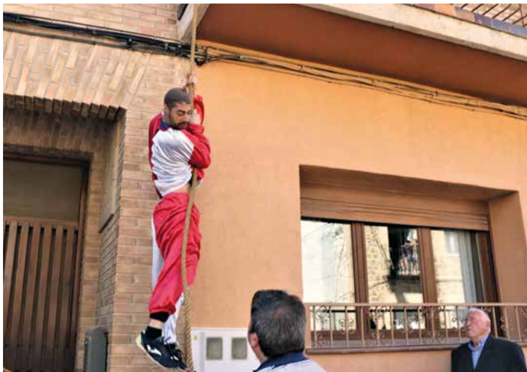
Figura 12. Judas fugándose en Cabanillas de una casa en la que se encontraba escondido.

A ambas orillas de la calle San Roque se agolpa el numeroso público que acompaña a la comitiva festiva hasta llegar a la casa consistorial. Durante el trayecto una docena de mozos vestidos de romanos (guardia pretoriana) calzan vistosas alpargatas de danzantes adornadas con hiladillos rojos, cruces rojas y flores con pétalos azules y rojos. Portan pantalón blanco, vestido tipo faldón verde, chaqueta verde y capa roja con ribetes dorados. Acompañan y protegen a las vestales. Estas arrojan al público caramelos.