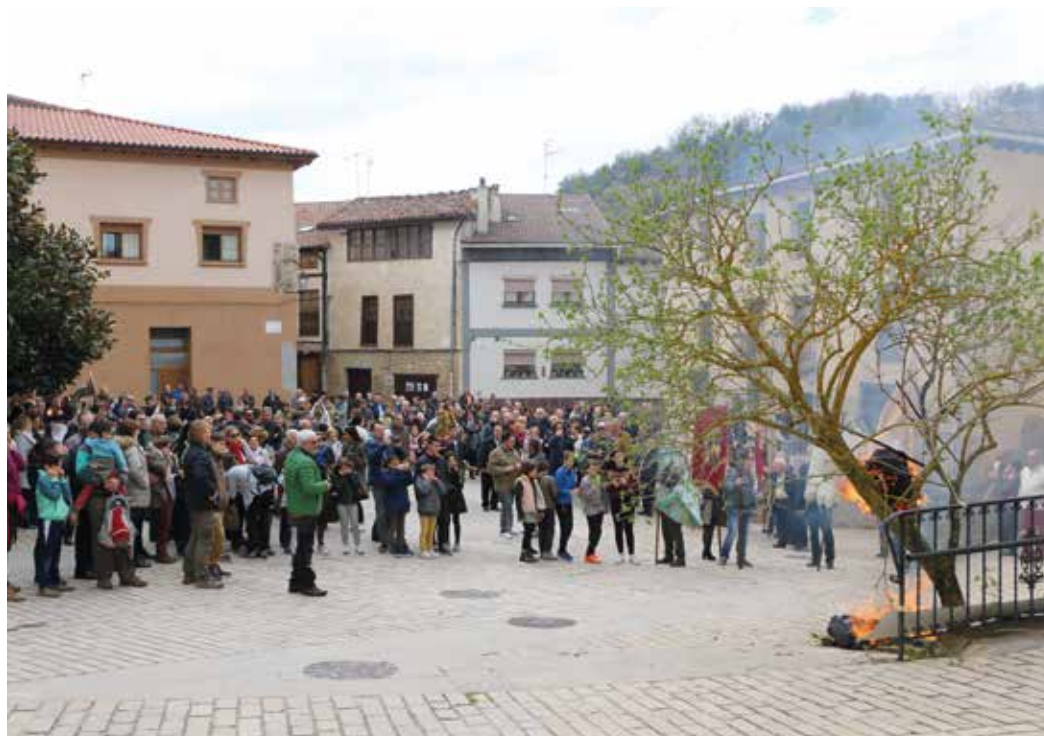
Figura 22. Los vecinos y vecinas de Salinas de Añana cumpliendo un año más con la tradición.

por escrito desde el año 1579. Organizaba el encuentro la cofradía de la Santa Vera Cruz e iban hasta el monasterio de San Juan de Acre, en donde celebraban la misa (Dantzariak, 1980).