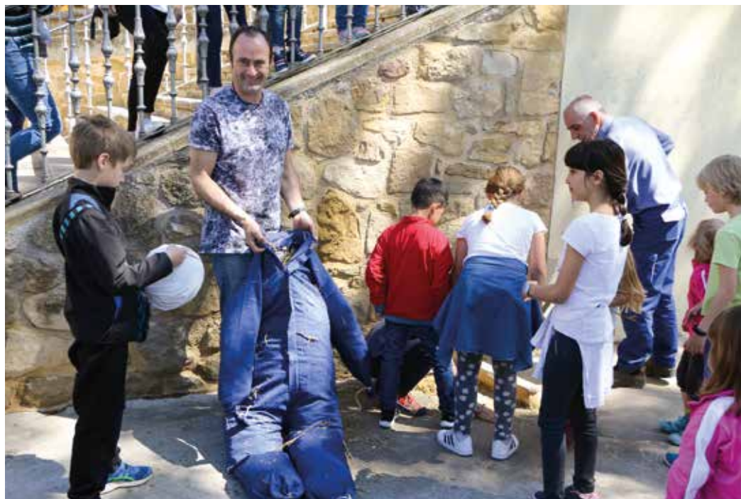
Figura 8. Los chicos y chicas de Murieta ayudan en la preparación del Judas.

una gran multitud de personas. Encabezan el traslado del árbol los niños que lo sujetan por la zona más delgada, seguidos de las personas mayores que lo sostienen por la zona más ancha, que es la de mayor peso. Los primeros llevan en volandas al tronco del árbol con los brazos levantados hacia arriba, mientras los segundos apoyan en sus hombros el pesado tronco.