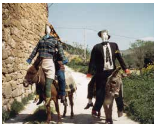
Figura 16. Paseo de los Judesos en Moreda de Álava.

Los moredanos queman dos muñecos, el Judas y la Judesa, mediante volteo. Para ello atan los cuerpos de los Judas con una cadena y ésta por ambos extremos va empalmada a unas sogas. La soga en un extremo va enganchada a un hierro, que se encuentra anclado en la pared de una casa señorial del siglo XVIII. Por la otra parte, la soga llega hasta el cementerio de la iglesia parroquial, en donde al final de las escalerillas de subida al templo se encuentran los jóvenes de la localidad.