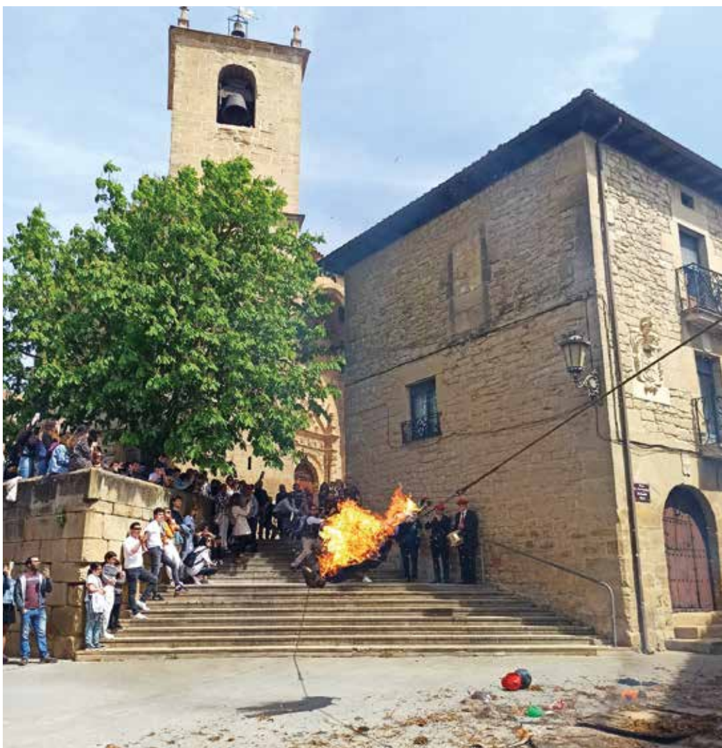
Figura 17. Quema mediante volteo de los Judas en Moreda de Álava.

Los jóvenes, una vez que están ardiendo los muñecos tras ser rociadas sus vestimentas con gasolina, tensan la cuerda y comienzan a bambolearla de un lado para otro dándole de vez en cuando vueltas completas. Judas convertido en una bola de fuego vuela ardiendo por el aire entre las casas. Los muñecos en su movimiento y volteo con el aire se consumen hasta quedar tan solamente el armazón o esqueleto de hierro de estos personajes. Esta forma de quemarlos tan original es espectacular y emocionante. A veces puede resultar peligrosa, ya que en alguna ocasión algún trozo de ropa o paja ardiendo ha caído sobre el público allí concentrado para ver el festejo.