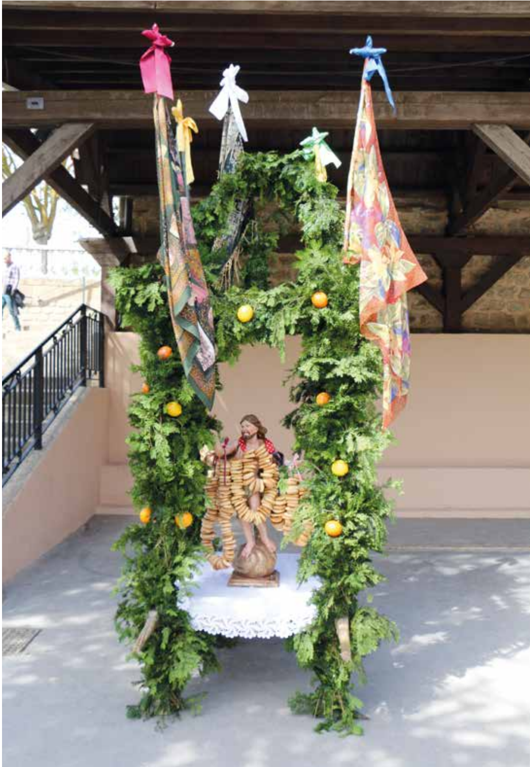
Figura 20. El huerto de Cristo resucitado en la quema de Judas en Samaniego.