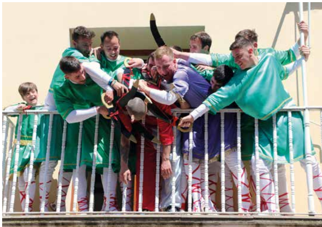
Figura 13. Captura y muerte de Judas en Cabanillas.

y ocurrencias de los mozos del pueblo que escenifican los distintos papeles del perseguido Judas y de los perseguidores soldados romanos.