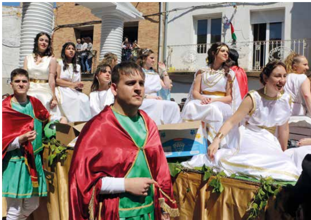
Figura 11. Cabanillas. Carroza con las vestales romanas custodiadas por la guardia pretoriana.

El Domingo de Resurrección la misa mayor y la procesión tienen lugar en la iglesia parroquial nueva de Nuestra Señora de la Asunción. Procesión de Pascua de Resurrección en donde se escenifica el encuentro de Jesús con su madre María, descubriéndole una niña la cara a la Virgen al retirarle el velo de luto. Estos actos tienen lugar a las once y media de la mañana.