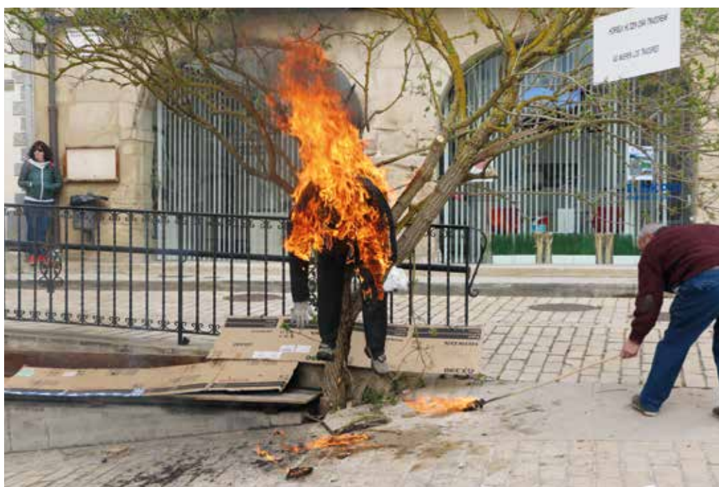
Figura 21. Quema de Judas en Salinas de Añana.

Judas en Salinas de Añana es colgado de un saúco verde cortado en el monte y trasladado a la plaza Mayor del Ayuntamiento. Un letrero que dice: «Así mueren los traidores» es colocado junto al pelele. El fantoche contempla el encuentro de las dos procesiones con las cruces parroquiales de Santa María de Villacones (actual parroquia) y de San Pedro (desaparecida), insignias, estandartes, pendones e imágenes de las dos iglesias que hubo en la villa en tiempos pasados. De este encuentro se tiene constancia