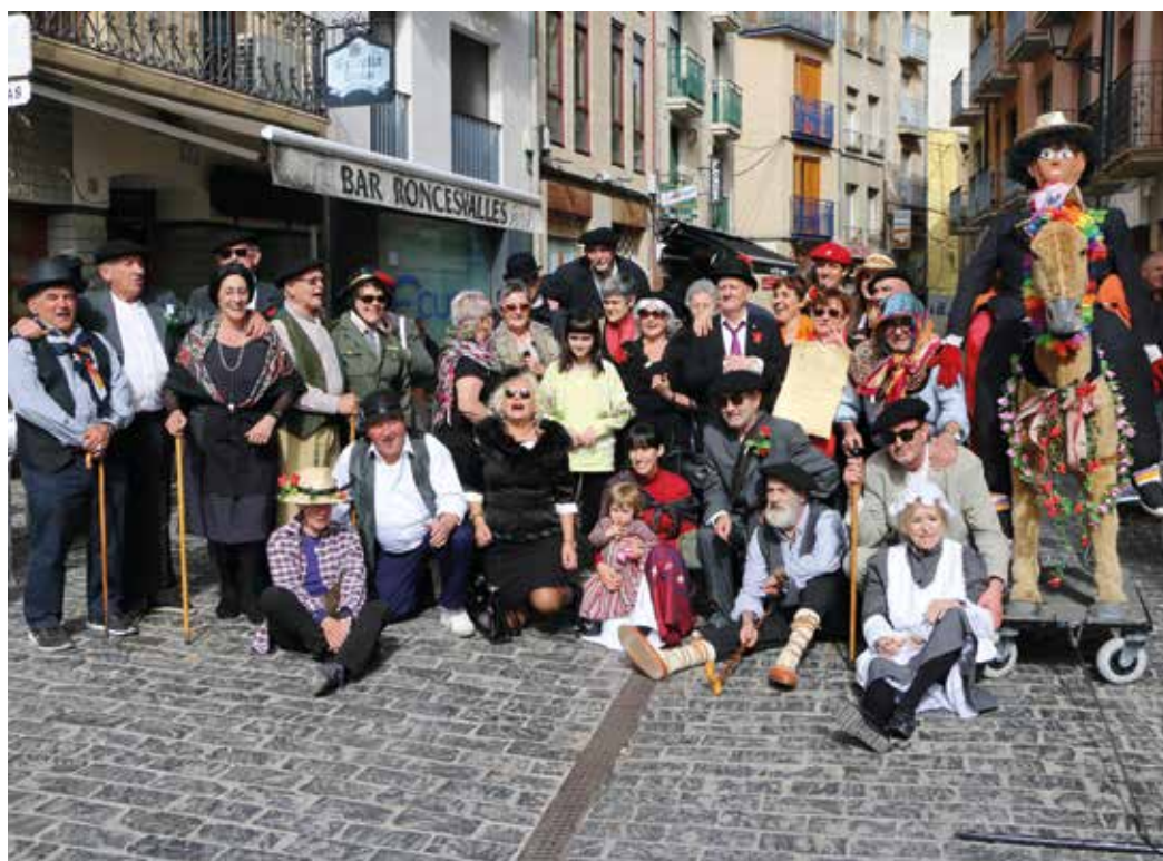
Figura 3. Paseo del Judas por las calles de Estella.

Una cuadrilla de amigos veteranos organiza el juicio y quema de Judas en Estella. Consiguió rescatar esta costumbre del olvido en el año 2009, tras más de medio siglo de inactividad debido a la muerte del hijo de una de las organizadoras en el año 1957. En esta época eran las mujeres quienes organizaban el Judas de Estella en la plaza de San Martín del barrio de San Pedro. Judas encarnaba a personajes avaros y maliciosos.