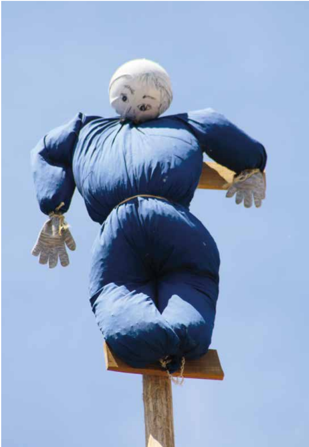
Figura 10. El Judas de Murieta en lo alto del mayo.