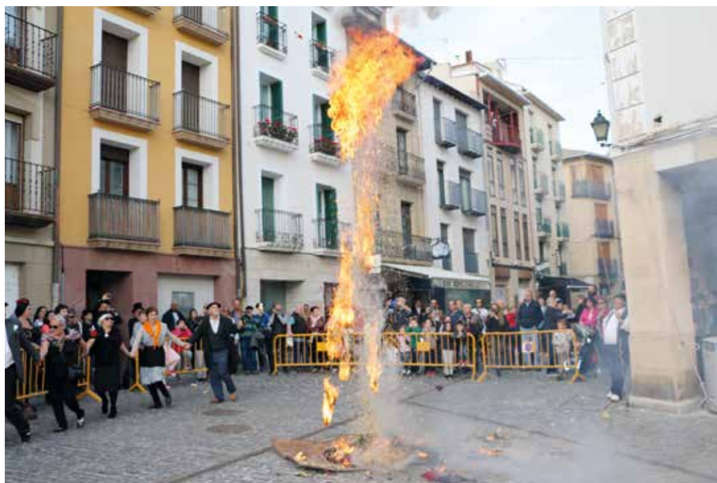
Figura 6. Quema del Judas en Estella.

hoguera, al vago y fandangón Judas Iscariote (personaje desvencijado y desaliñado) por traidor. No trajo nada, solo la desgracia. Un chirgo. Por todo ello, se ordena, que después de alrodiar la ciudad, zarandeado, vituperado y mofado, sea pasto de las llamas, es decir, chuscarrado y chamuscado. Que así sea. (Amén) 5 .