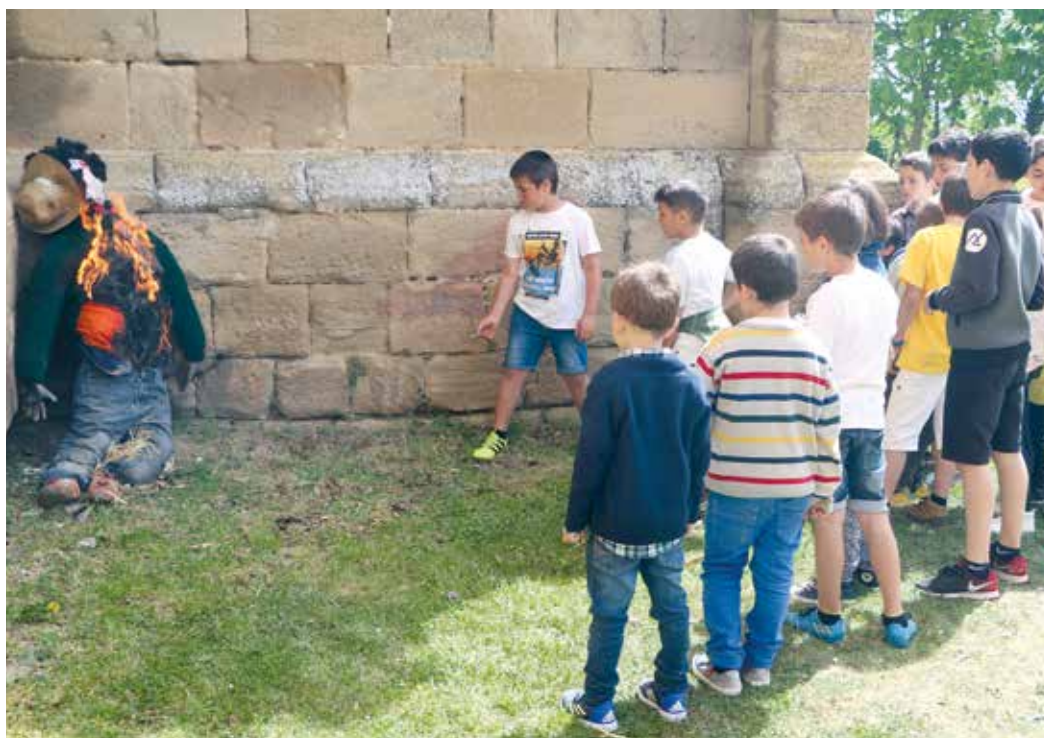
Figura 19. Niños de Samaniego arrojando petardos al Judas en llamas.

Judas es acusado de haber cometido todo lo negativo que haya ocurrido en el pueblo, como accidentes de circulación, tormentas y pedriscos dañadores del viñedo, bajos precios pagados de la uva por parte de las bodegas, incendio de pabellones agrícolas, jóvenes sin trabajo, carestía de la vida, robos, gamberradas, etc. A cada una de las acusaciones el fiscal pregunta a los presentes: «¿A quién se lo achacaremos?». El pueblo responde: «¡A Judas!» 10 . De Samaniego se conserva una sentencia del año 1921. Dicho escrito la califica como sermón burlesco.