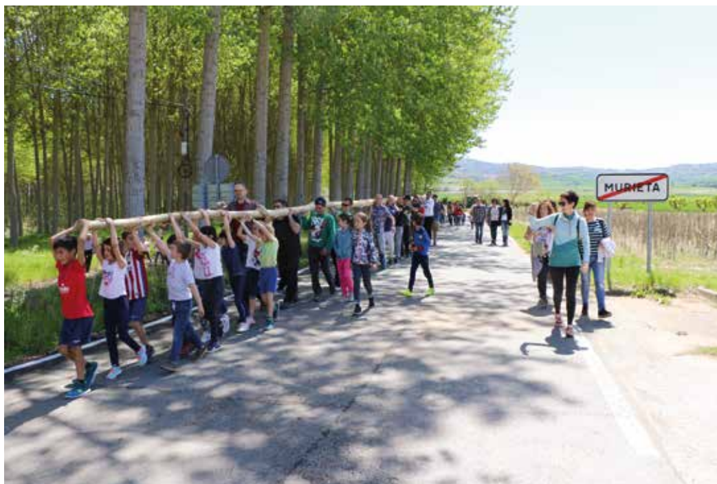
Figura 7. Llevando al frontón el chopo-mayo en el que se colocará al Judas de Murieta.

Confeccionado el muñeco, Judas queda solo y en silencio tumbado en el suelo del frontón. La chiquillería y gente adulta acude hasta una cercana chopera sita en la margen derecha del río Ega para transportar el mayo hasta el frontón municipal. La forma de llevar el árbol al pueblo es cargárselo entre todos a hombros. Para ello se necesita