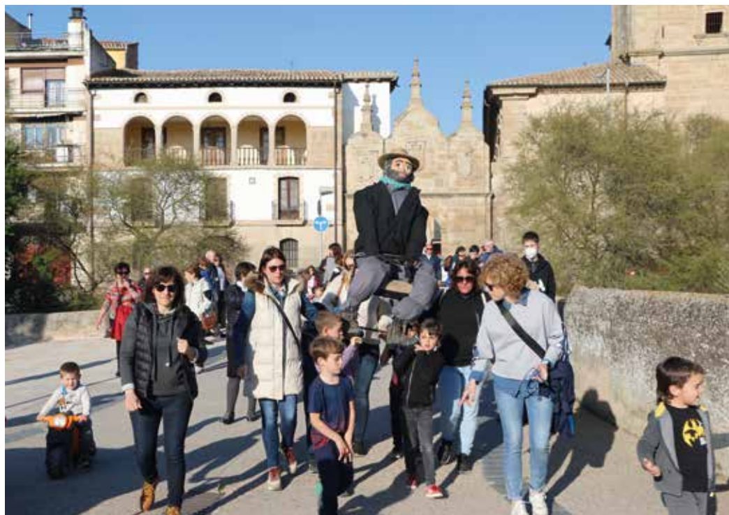
Figura 14. La chavalería de Los Arcos pasea a Judas por las calles de la localidad.

La mocería lo pasea subido en unas andas, atado a una silla vieja, como si llevaran en procesión a un santo encima de una peana. Los jóvenes gritan al muñeco: «Judas Iscarioooté, no comerás calboootés. Judas traidooór no cómeras calboootés. Judas traidooór irás al paredooón» (calbotes son judías negras o pintas) (Hermoso de Mendoza, 2004).