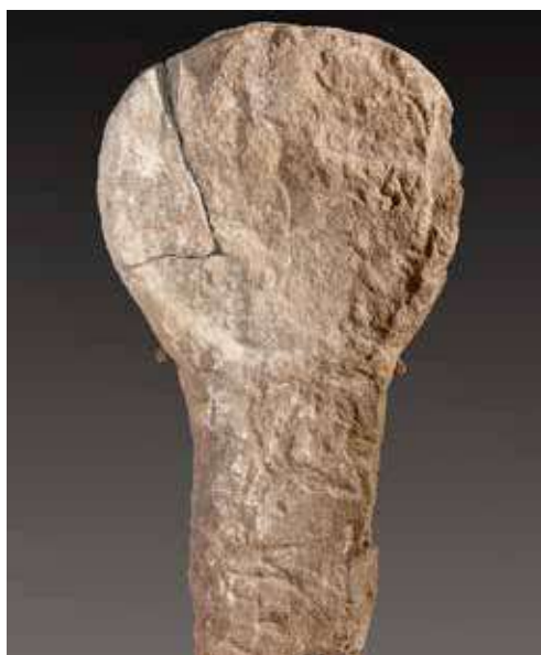
Figura 22. Lizoain. Estela sin ornamento.