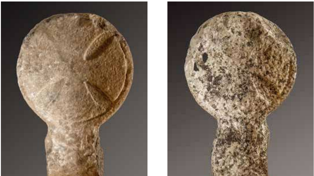
Figura 6. Mendióroz/Mendiorotz. Cruz de brazos curvos y remate convexo en ambas caras.