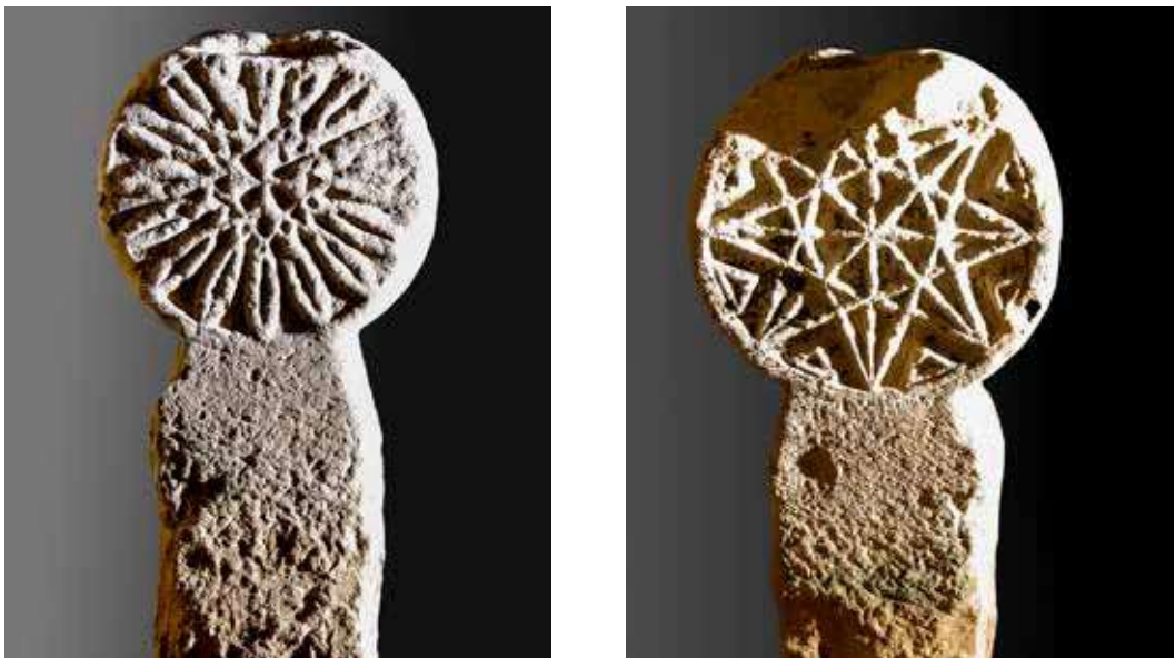
Figura 28. Lizoain. Anverso: flor de dieciséis pétalos cuyo centro está formado por una pequeña cruz griega de brazos curvos en el centro. Reverso: estrella de ocho puntas con bisectrices y adornos en los sectores.