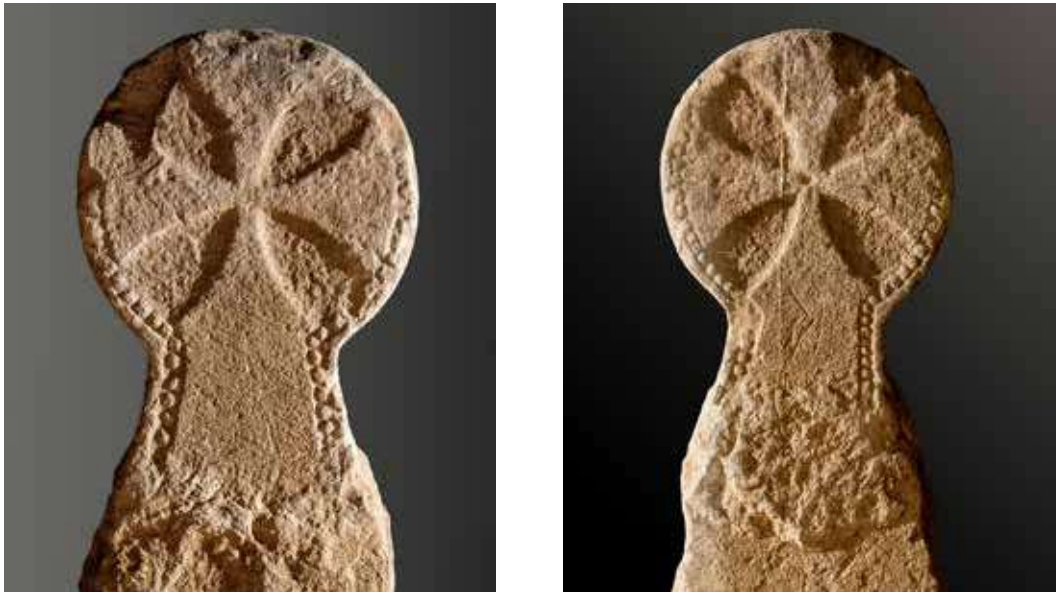
Figura 27. Lizoain. Cruz griega de remate convexo bordeada por bolitos que se proyectan desde el disco hasta el pie.