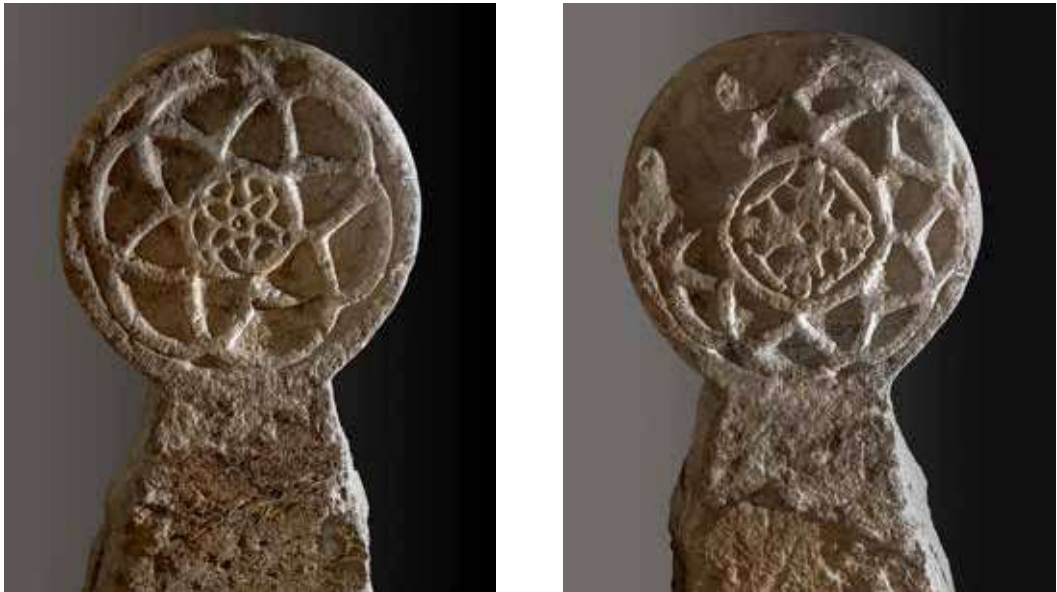
Figura 11. Lizoain. Anverso: estela geométrica con estrella de seis puntas y flor de seis pétalos en su interior. Reverso: estrella de ocho puntas con cruz griega inscrita en un círculo central.