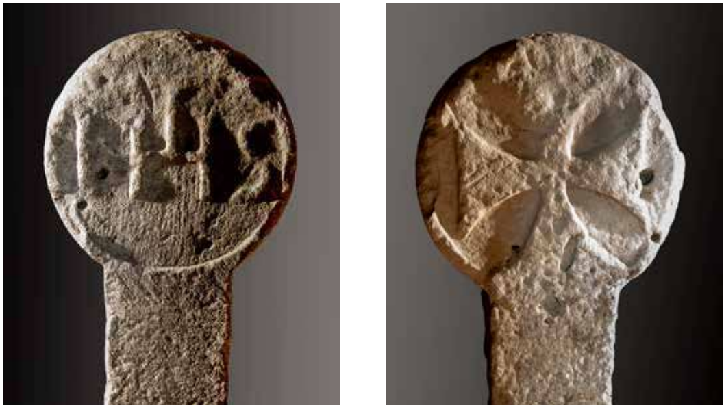
Figura 12. Lizoain. Anverso: monograma de Cristo: IHS ( Jesus Hominum Salvator / Jesús Salvador de los hombres). Reverso: cruz griega de brazos curvos y remate cóncavo.