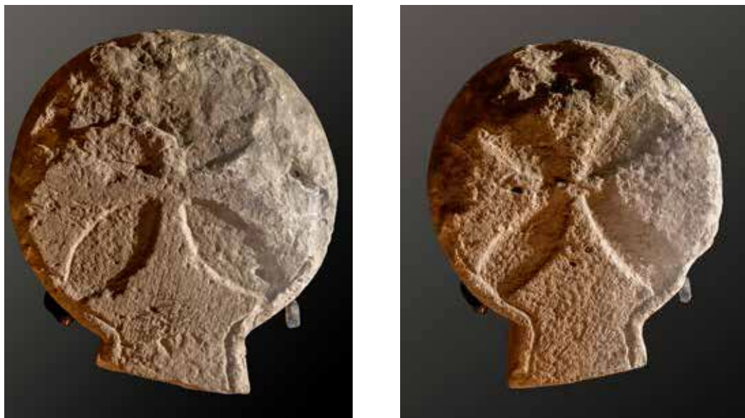
Figura 31. Redin/Erredin. Estela sin pie con ambas caras representando una cruz griega de remate convexo.