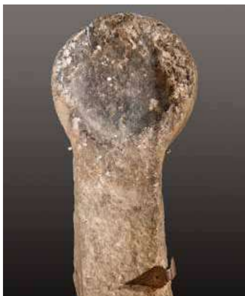
Figura 42. Lerruz/Lerrutz. Estela sin ornamento.