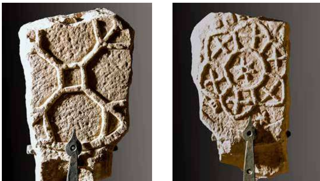
Figura 25. Lizoain. Anverso: cuadrado central del que irradian cuatro líneas diagonales. Reverso: estrella de seis puntas en el centro rodeada por un círculo y seis pentágonos con motivos astrales.