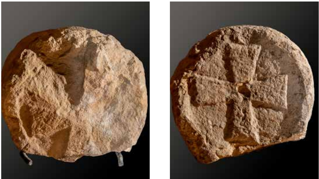
Figura 24. Lizoain. Cruz griega de brazos rectos que se ensanchan hacia los extremos.