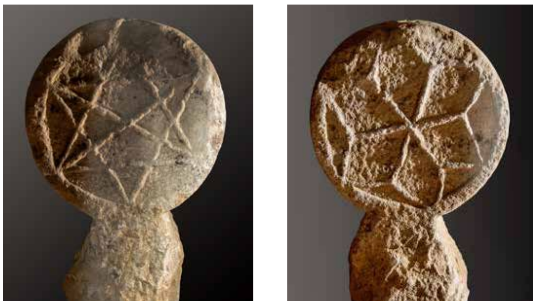
Figura 14. Lizoain. Anverso: estrella de seis puntas con bisectrices. Reverso: estrella formada por seis figuras romboidales unidas en el centro.