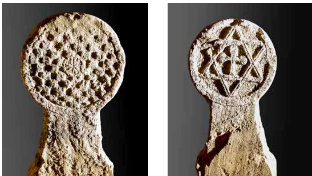
Figura 8. Mendióroz/Mendiorotz. Anverso: ajedrezado con disco central formado por dos círculos concéntricos y en su interior siete radios. Reverso: estrella de seis puntas con cruz griega apomada en su interior.