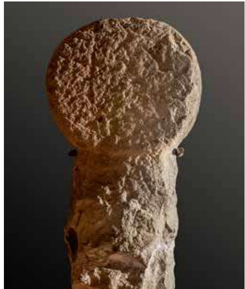
Figura 39. Zunzarren/Zuntzarren. Anverso: cruz griega de brazos rectos formada por dos líneas paralelas que forman un cuadrado en el centro.