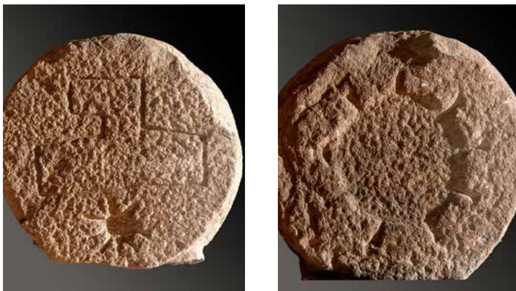
Figura 53. Eugi. Anverso: estela sin pie con un símbolo astral y un dibujo que puede representar una herramienta de corte. Reverso: círculo astral.