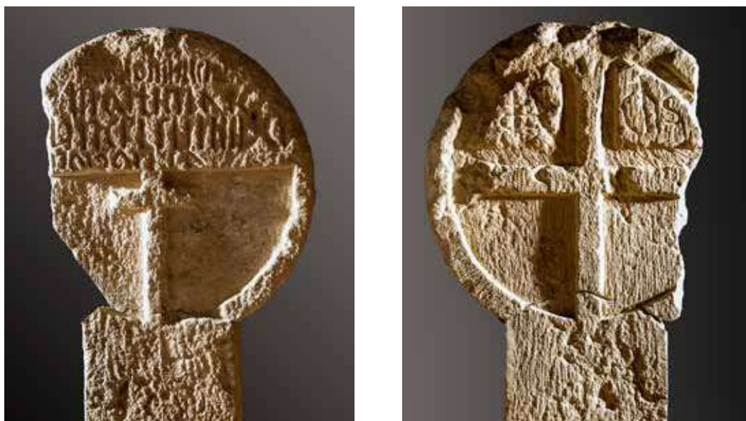
Figura 21. Lizoain. Estela encontrada al abrir la ventana central de la antigua iglesia de San Miguel de Lizoain, hoy Centro Cultural «Elizar». Anverso: abundante texto pendiente de descifrar y una cruz latina. Reverso: cruz griega con dos monogramas de Cristo (IHS) enmarcados en los cuadrantes superiores de la cruz.