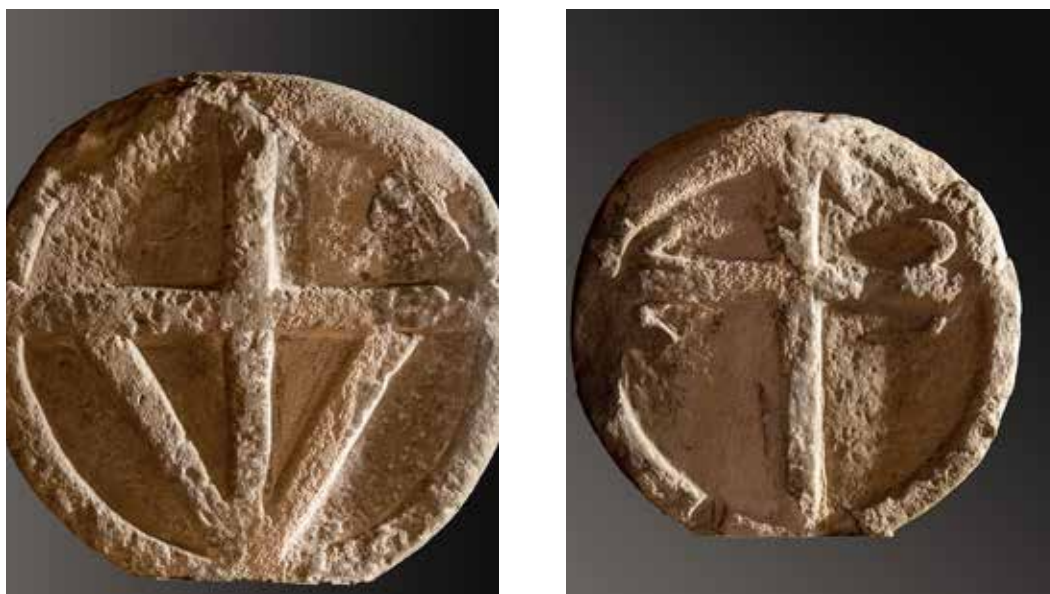
Figura 26. Lizoain. Anverso: cruz con travesaños en forma de ancla, símbolo de esperanza según San Pablo. Reverso: cruz latina de extremos adornados en forma de flor de lis.