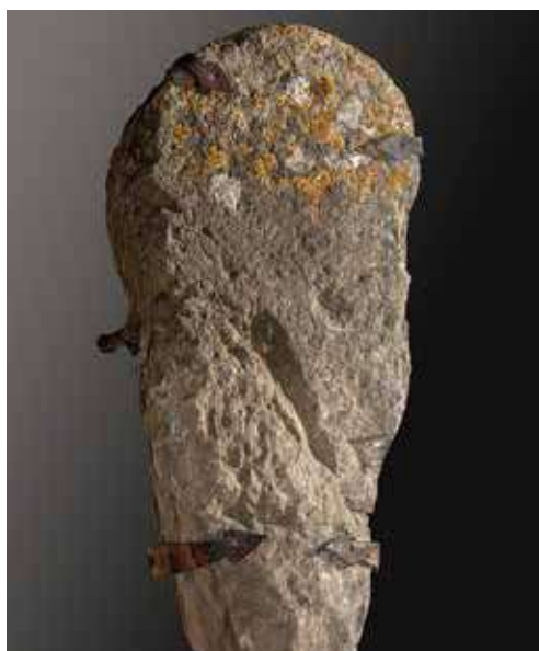
Figura 48. Oscáriz/Ozkaritz. Estela sin ornamento