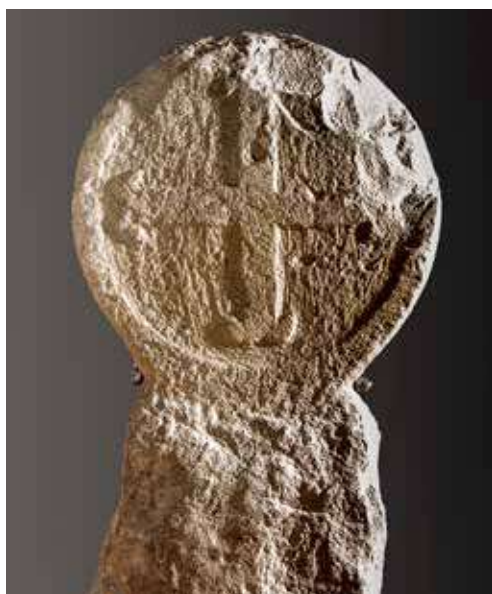
Figura 30. Redin/Erredin. Estela con cruz griega de remate ancorado.