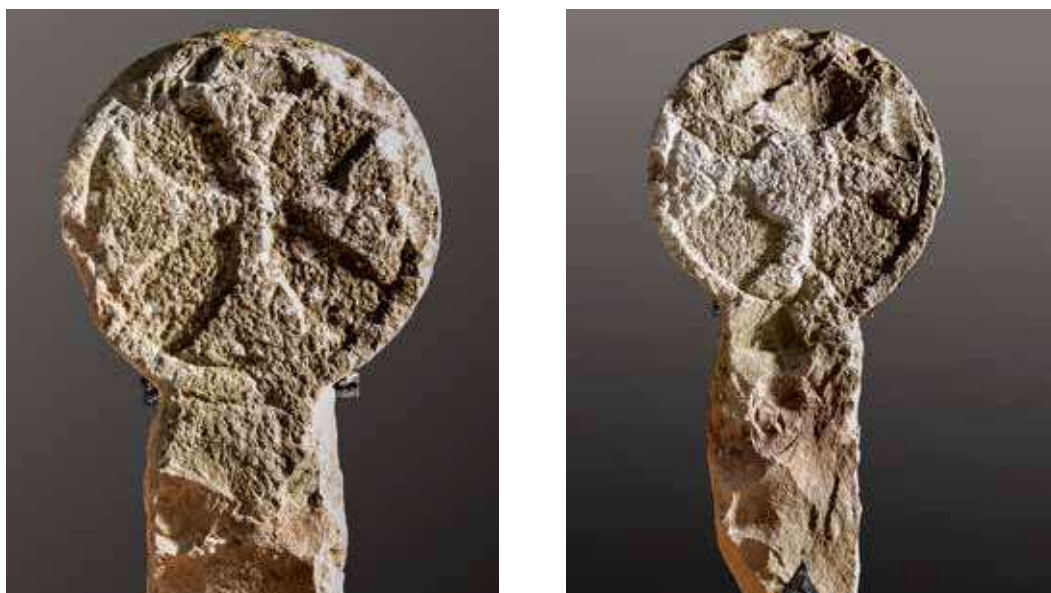
Figura 33. Zalba. Anverso: cruz griega de brazos curvos y final convexo. Reverso: cruz griega con nimbo central, brazos rectos y ensanchamiento triangular en los extremos.