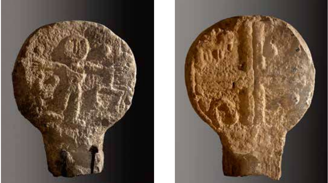
Figura 1. Janáriz/Janaritz. Anverso: estela con representación de una figura humana. Representa a San Pedro con las llaves del cielo en su mano derecha. En la mano izquierda, una balanza propia de San Miguel en lo que los expertos llaman psicostasis. Reverso: cruz griega con elementos del oficio de herrero en los cuadrantes.