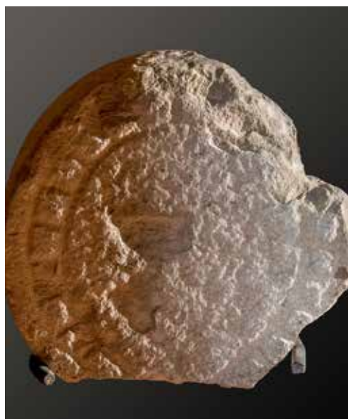
Figura 4. Mendióroz/Mendiorotz. Cruz latina incisa con líneas que irradian hacia el exterior.