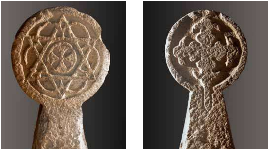
Figura 2. Janáriz/Janaritz. Anverso: dibujo geométrico señalando la estrella de David con cruz griega inscrita. Reverso: cruz griega procesional florentina.