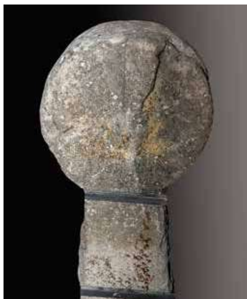
Figura 38. Zunzarren/Zuntzarren. Anverso: cruz griega lobulada. Reverso: orla perimetral y en el campo rueda de ocho radios.