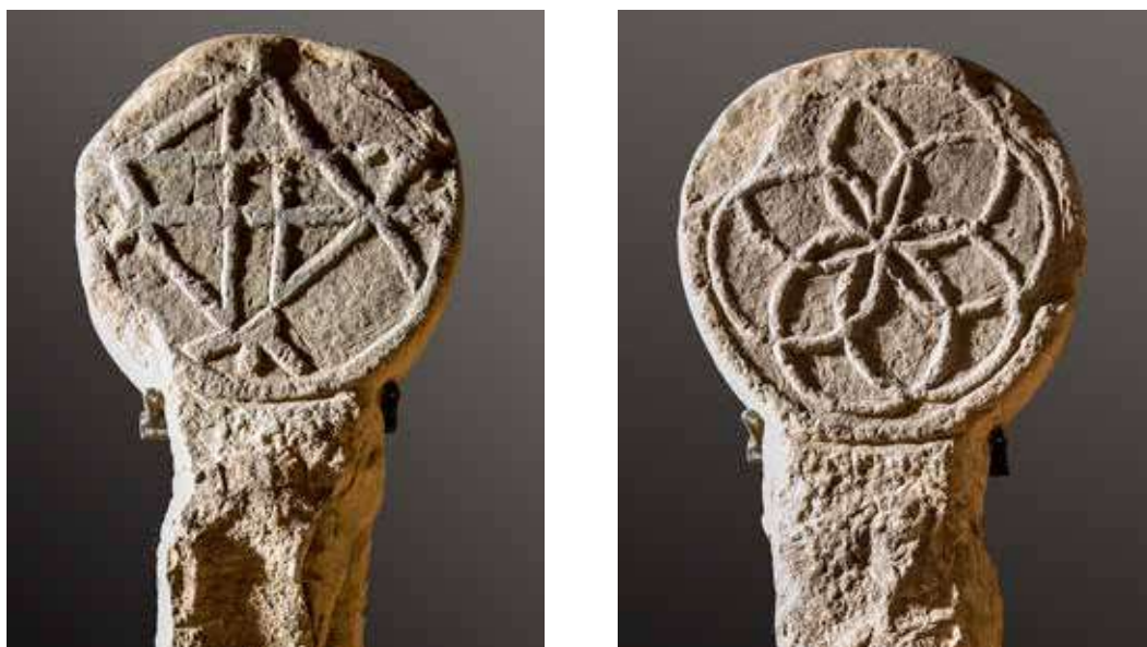
Figura 29. Redin/Erredin. Anverso: estela con dibujo geométrico de difícil interpretación. Reverso: estrella de ocho puntas.