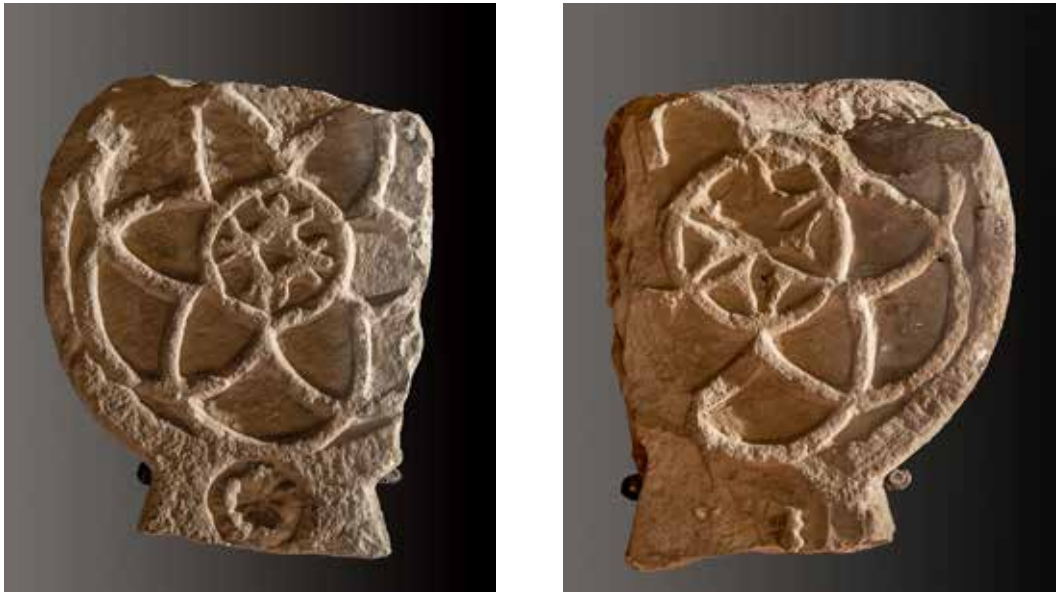
Figura 23. Lizoain. Estela con dibujos geométricos en ambas caras.