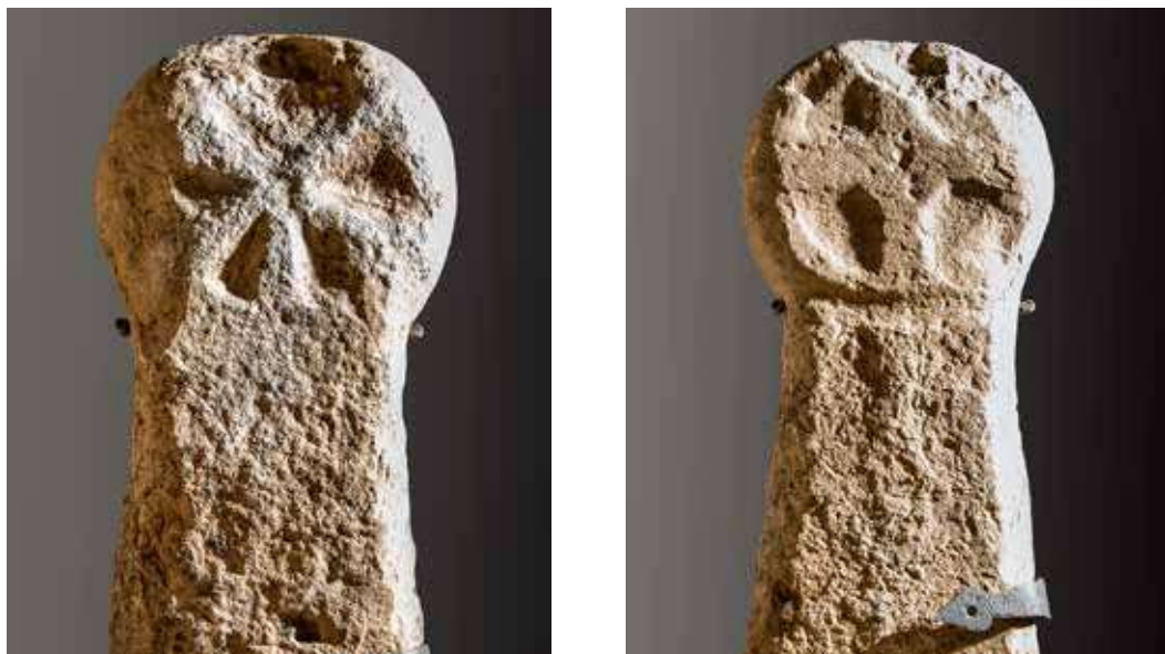
Figura 7. Mendióroz/Mendiorotz. Anverso: orla perimetral y flor de seis pétalos. Reverso: cruz griega con rombo central y ancorada en sus extremos.