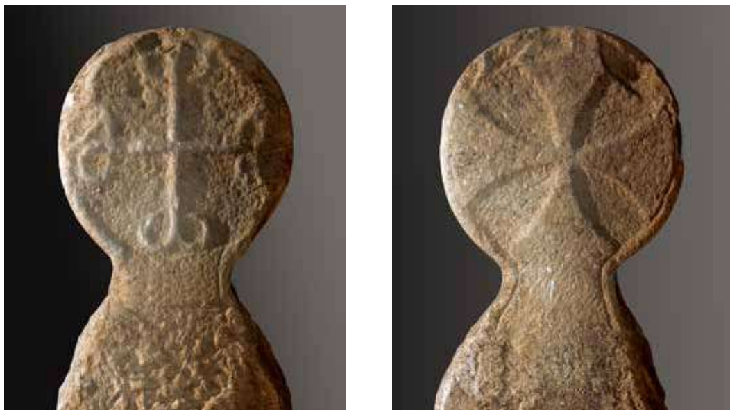
Figura 19. Lizoain. Anverso: cruz griega de brazos muy finos y final ancorado. Reverso: cruz griega de brazos curvos con orla se extiende también al pie.