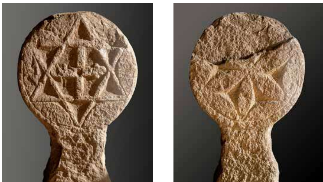
Figura 20. Lizoain. Anverso: estrella de seis puntas con cruz griega adornada con hexágono interior. Reverso: flor de seis pétalos rodeada de orla formada por otros seis pétalos.