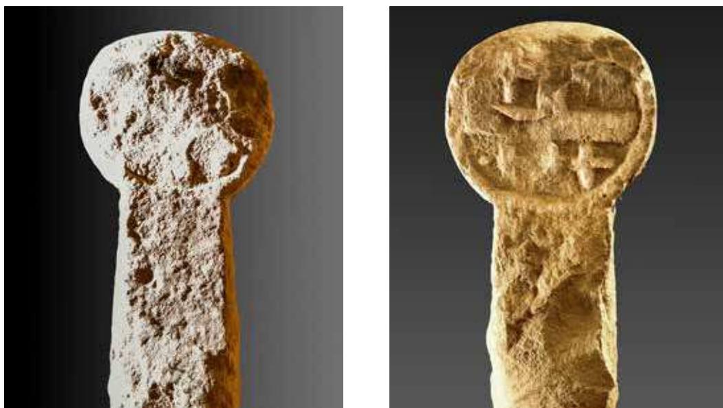
Figura 50. Urricelqui/Urritzelki. Anverso: cara deteriorada. Reverso: cruz griega recta con cruces en los cuadrantes.