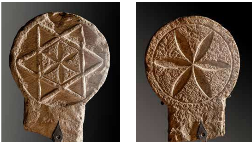
Figura 45. Beortegui/Beortegi. Anverso: estrella de seis puntas con flor de seis pétalos en el hexágono central. Reverso: flor de seis pétalos con orla circular.