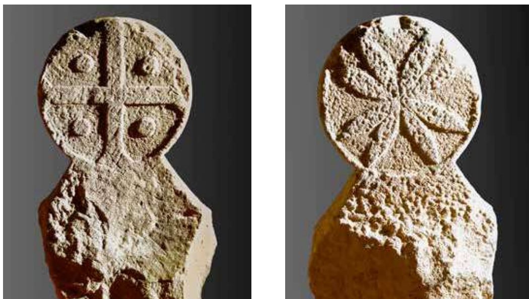
Figura 46. Beortegui/Beortegi. Anverso: cruz griega con bolos en los cuadrantes. Reverso: flor de ocho pétalos inscrita en orla circular.