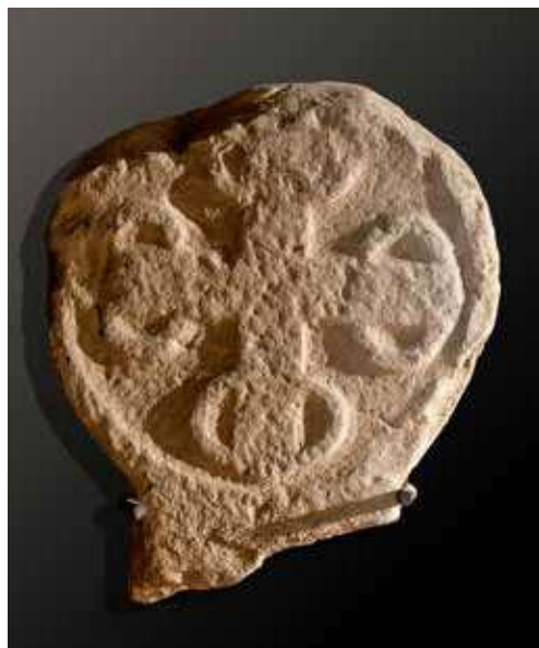
Figura 44. Lerruz/Lerrutz. Anverso: cruz griega formada por cinco círculos más un círculo que los rodea. Reverso: cruz griega de brazos rectos con final apomado.