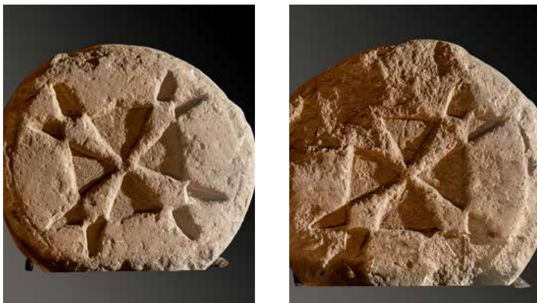
Figura 41. Lerruz/Lerrutz. Cruz griega en aspa rodeada por un cuadrado en ambas caras.