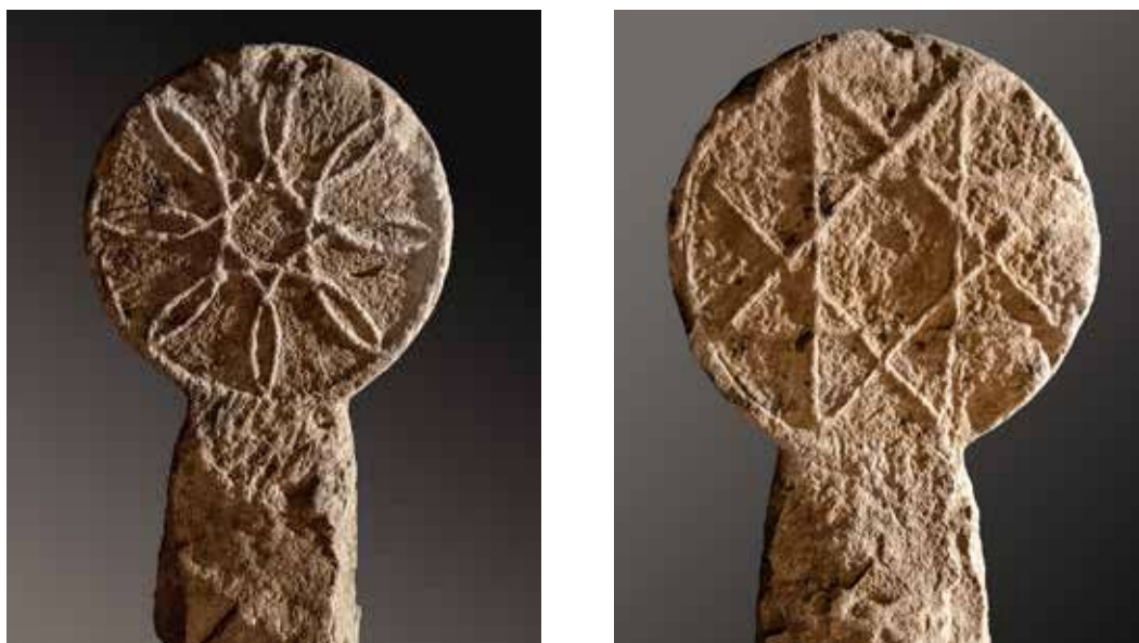
Figura 13. Lizoain. Anverso: flor de ocho pétalos formados al entrelazar arcos de circunferencia. Reverso: estrella de ocho puntas con bisectrices.