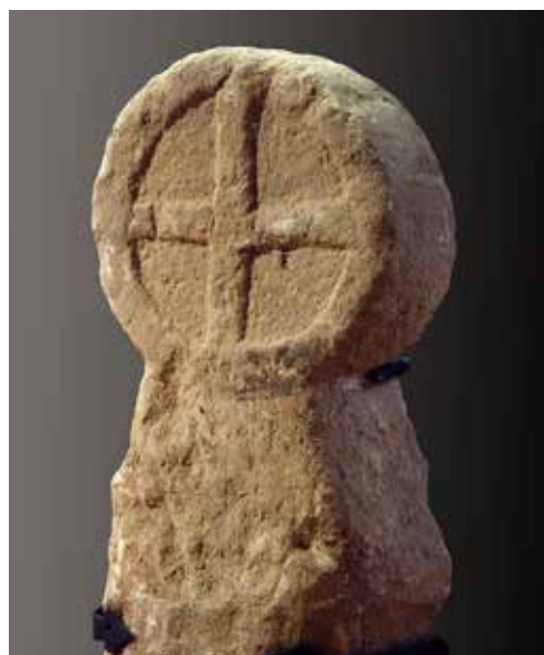
Figura 54. Torralba del Río. Cruz griega inscrita en orla circular que representa la eternidad.