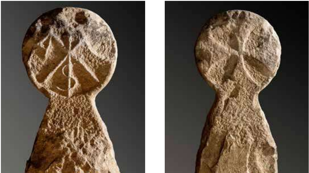
Figura 17. Lizoain. Anverso: crismón: primeras letras del nombre de Cristo en griego más las letras alfa y omega (desaparecida) simbolizando el principio y el fin de todo lo creado. Reverso: cruz griega de remate convexo.