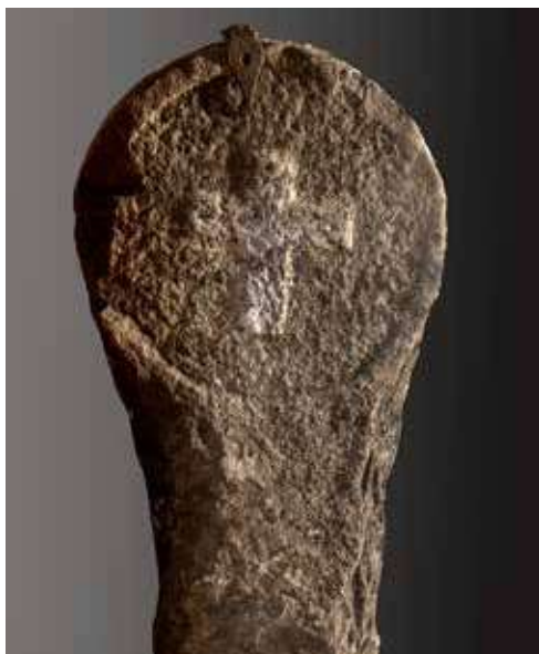
Figura 51. Eugi. Estela con una cruz latina de brazos rectos, inscrita en el círculo.