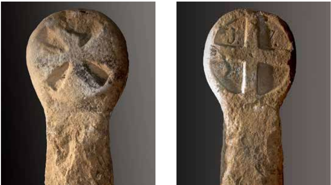
Figura 18. Lizoain. Anverso: cruz de brazos curvos y final convexo. Reverso: cruz griega de brazos rectos paralelos y letras mayúsculas en los cuadrantes superiores (J-Y).