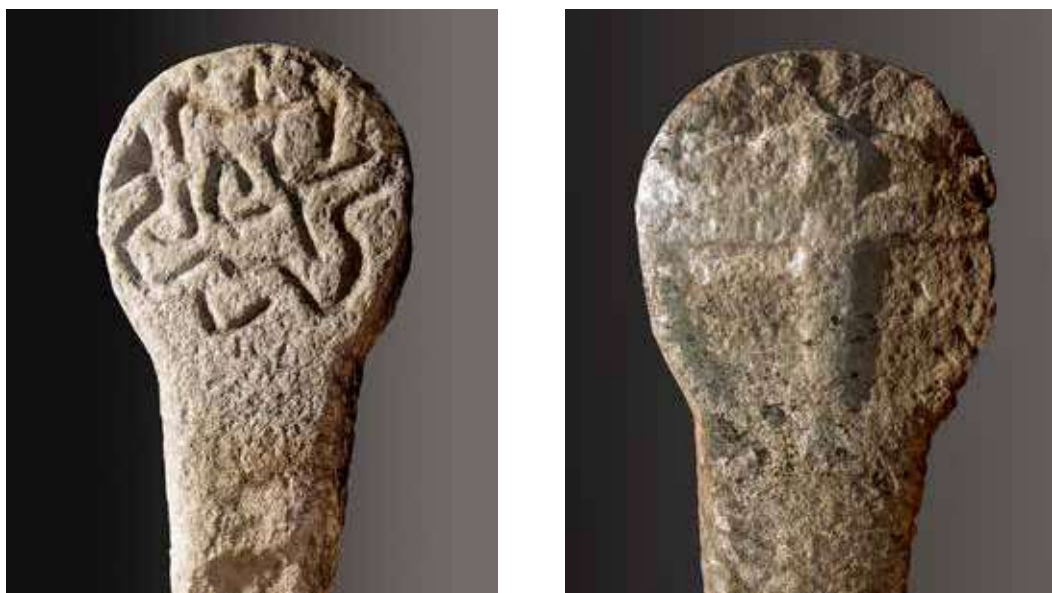
Figura 47. Oscáriz/Ozkaritz. Anverso: estela con dibujos geométricos de difícil interpretación. Reverso: cruz griega inscrita en orla circular.