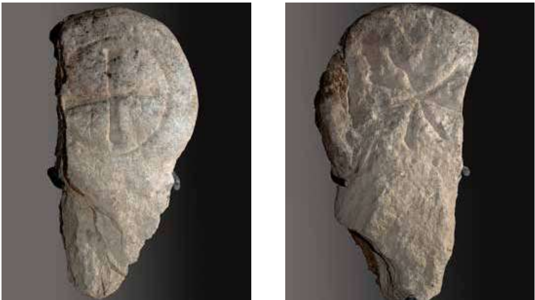
Figura 10. Leyún/Leiun. Cruz griega inscrita en un círculo solar con motivos astrales en los cuadrantes.