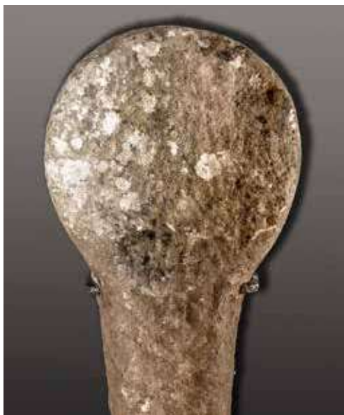
Figura 35. Zalba. Estela sin ornamento.