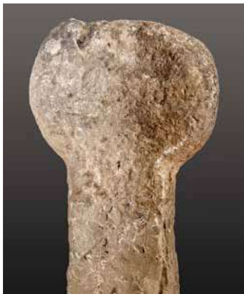
Figura 43. Lerruz/Lerrutz. Estela sin ornamento.