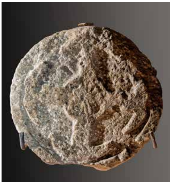
Figura 3. Mendióroz/Mendiorotz. Cruz griega con círculo central (con estrella de seis puntas en el interior) y extremos ancorados.