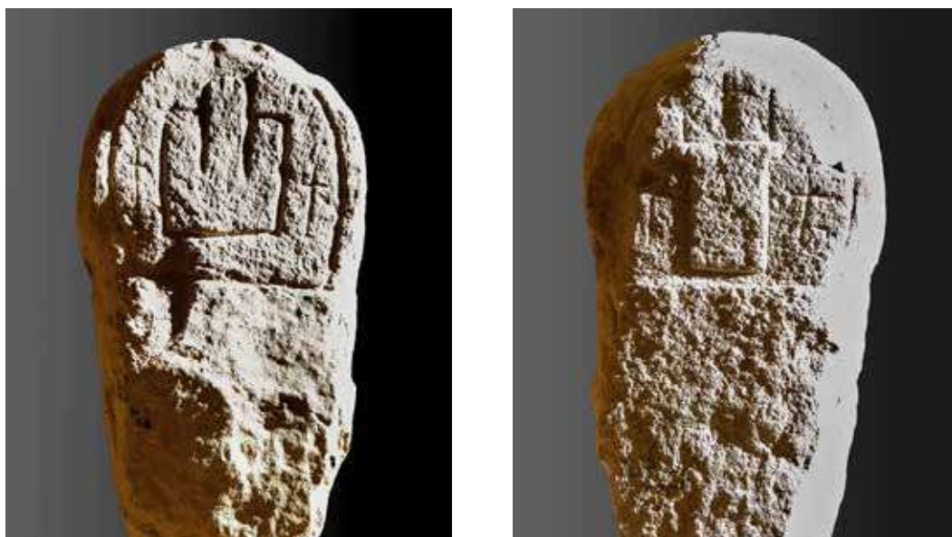
Figura 49. Urricelqui/Urritzelki. Anverso: castillo almenado con una cruz a cada lado. Reverso: arco de medio punto en que está inscrito un altar en relieve y, sobre él, la cruz.