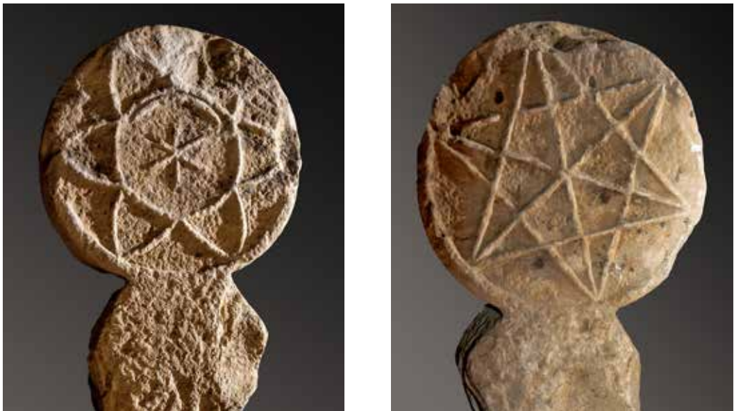
Figura 16. Lizoain. Anverso: motivo astral en el centro, rodeado por un círculo y por seis arcos apuntando al exterior. Reverso: estrella de seis puntas con sus bisectrices.