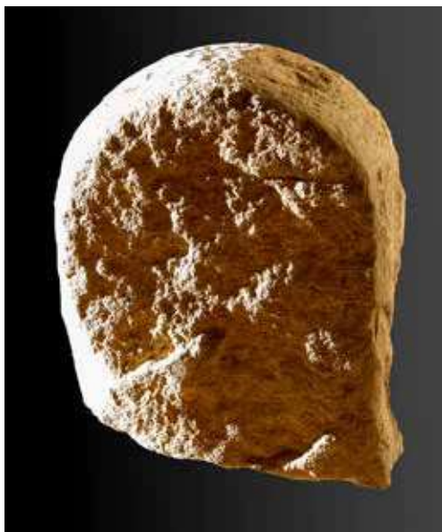
Figura 36. Zalba. Estela sin ornamento.