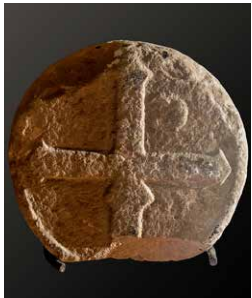
Figura 40. Lerruz/Lerrutz. Anverso: estela sin pie con monograma de Cristo (IHS, Iesus Hominum Salvator ). Reverso: cruz griega apuntada.