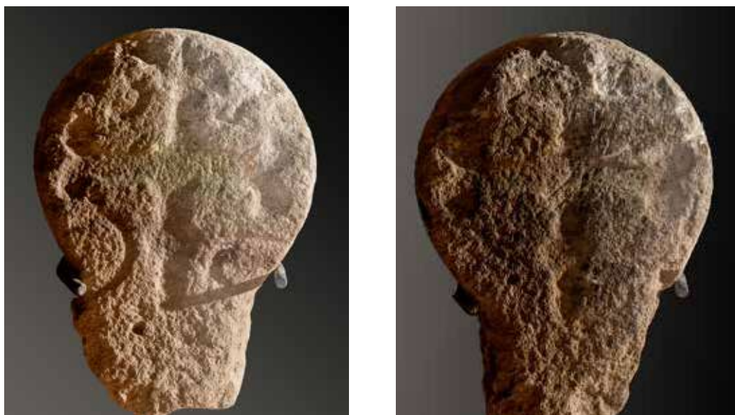
Figura 34. Zalba. Cruz griega de brazos bilobulados.