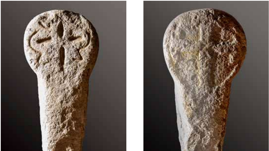
Figura 5. Mendióroz/Mendiorotz. Anverso: difícil interpretación. Reverso: cruz latina ancorada.