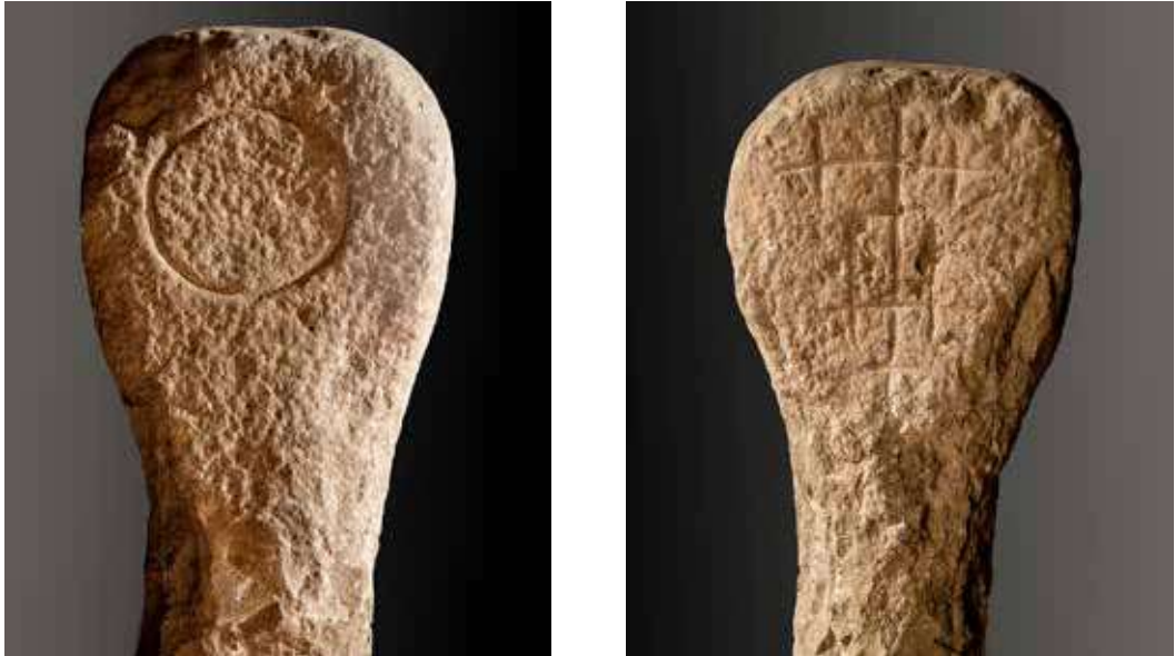
Figura 15. Lizoain. Anverso: círculo solar. Reverso: cruz recruzada varias veces de manera irregular.