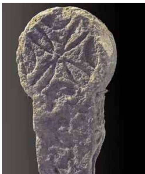
Figura 37. Zunzarren/Zuntzarren. Cruz griega de brazos curvos y final cóncavo.