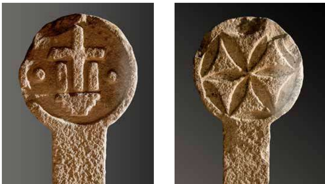
Figura 32. Redin/Erredin. Calvario inscrito en círculo y flor hexapétala.