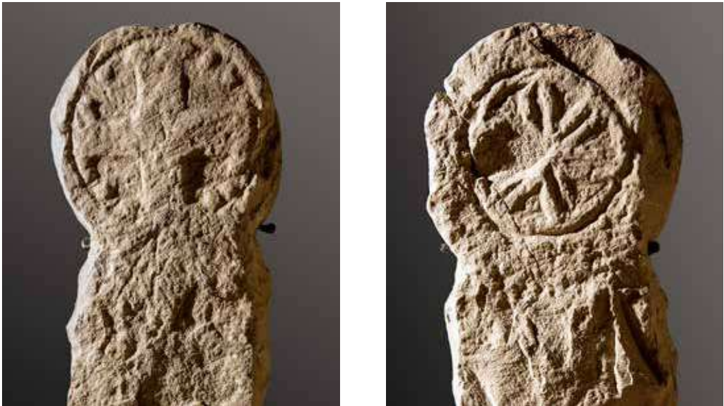
Figura 9. Leyún/Leiun. Anverso: estela con cruz griega ancorada con bolas en los cuadrantes. Reverso: flor de seis pétalos enmarcados en un círculo.