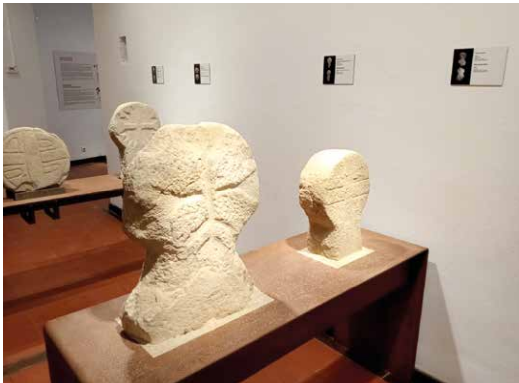
Figura 3. Estelas discoideas medievales.

de la accesibilidad. En Navarra existen dos leyes forales que concretan y legislan sobre aspectos relativos a la accesibilidad. La primera ley aprobada en este sentido fue la Ley Foral 12/2018, de 14 de junio de Accesibilidad Universal y posteriormente se aprobó la Ley Foral 1/2019, de 15 de enero, de Derechos Culturales de Navarra.