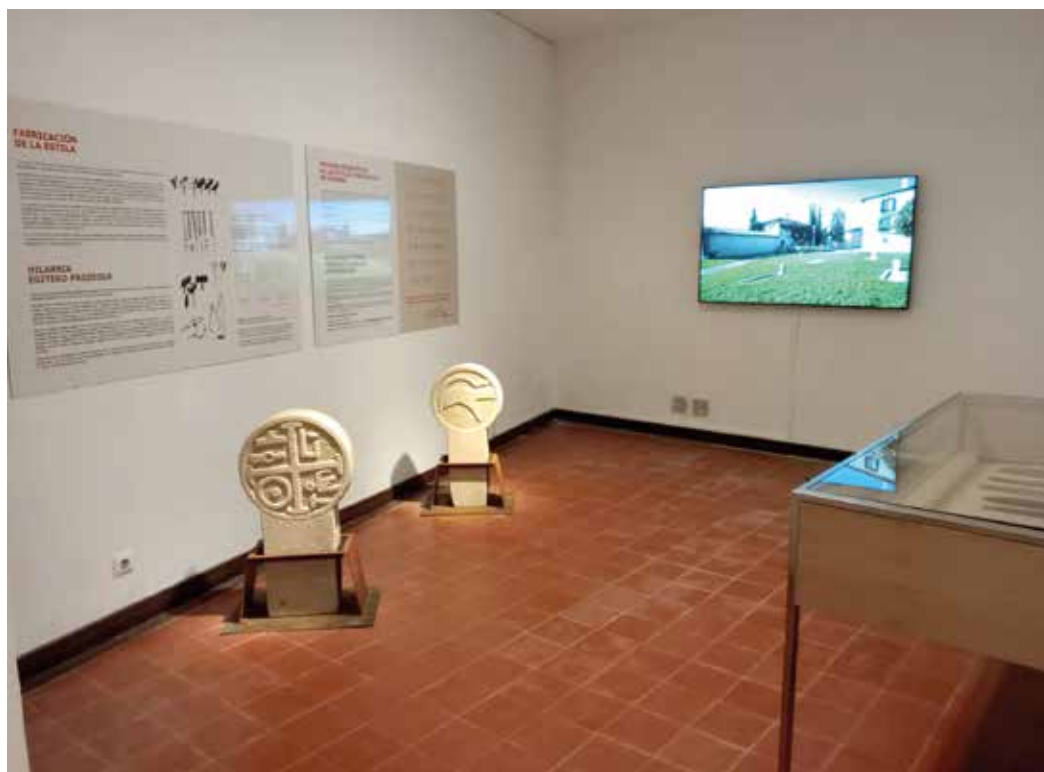
Figura 4. Facsímiles en la sala audiovisual.

Para que los objetivos planteados puedan consumarse es imprescindible plantear un plan de viabilidad que garantice la permanencia del equipamiento. El Ayuntamiento ha mostrado su implicación en el proyecto dotándolo económicamente y de personal para que pueda estar abierto al público en un horario apropiado para uso y disfrute por parte de la ciudadanía. Un plan anual de actividades propuesto por el comisariado completará la oferta y finalmente se solicitará al Gobierno de Navarra la declaración de Colección Museográfica Permanente como punto de partida desde el que proponer nuevos objetivos.