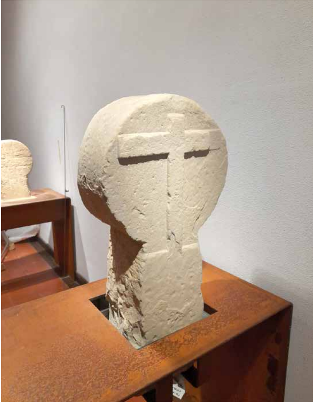
Figura 2. Estela discoidea medieval en el proceso de montaje.

Asentada en un discurso científico la exposición pretende mover además a la reflexión sobre las diferentes actitudes del ser humano ante la muerte a lo largo de la historia hasta nuestros días (desde una perspectiva local, pero con una temática