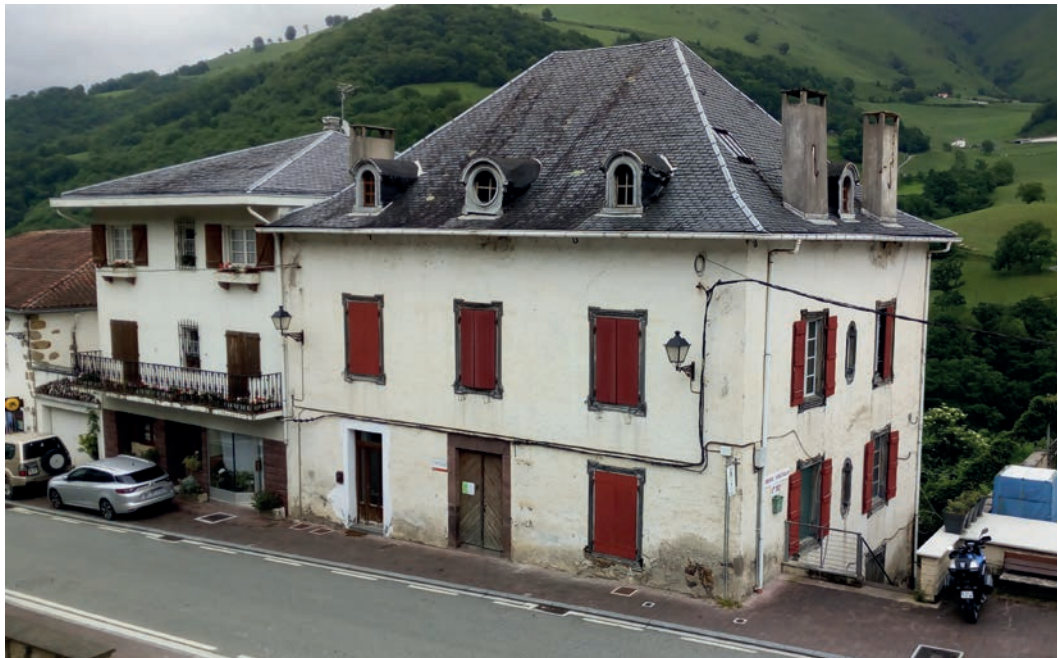
1. irudia. Luzaideko Seroren Etxea eraikina, erakusketa gelak eta turismo bulegoa edukiko dituen. Egilea: Suberri Matelo Mitxelena.

Testuinguru honetan Luzaideko herriak bere ondarea gizarteratzeko beharra sumatu zuen. Horrela, Aranzadi Zientzia Elkartearen laguntzaz, udalaren jabetzakoa den Seroren Etxea eraikinean erakusketa zentro bat eta turismorako informazio puntu bat gauzatzeko proiektua martxan jarri zuten. Proiektu horretan eraikinean gauzatzeko hiru gune nagusi edo ardatz daude: herriko ondarea jorratuko duen erakusketa gela bat, 778an Karlomagno eta baskoien arteko gudaren inguruko erakusketa gela bat, eta amaitzeko, turismo bulegoa. Antropologia Kulturala-Etnografia ikastaroa, beraz, aipatu dugun herriko ondarearen erakusketa horrekin dago erlazionatuta.