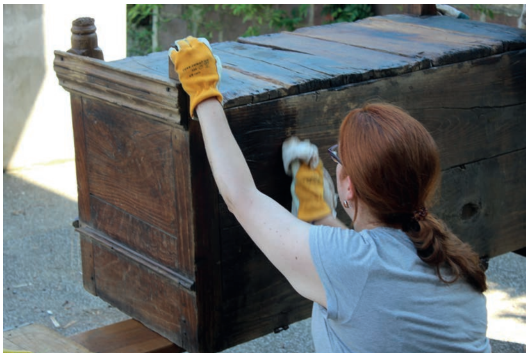
4. irudia. Kutxa bati argizaria ematen. Egilea: Suberri Matelo Mitxelena.

Objektu horiek guztiak, ondoren, etiketatu eta herrira eramaten ziren Udalak utzitako Argiola lokalera. Lokal horretan arratsaldean beste lan mota bati ekiten zitzaion. Objektu guztiak, bere nolakotasuna eta materialei erreparatuta, atondu egiten ziren; kontuan hartu behar da pieza asko ganbara edo ukuiluetan aurkitu ditugula, eta beraz zikinik zeudela edo erakusteko modu ezegokian. Eginiko lanean artean dago hautsa kentzea, lixatzea, argizaria ematea, konpontzea, objektu hautsiak batzea... Lan hauek ikasleek burutu zituzten ere, eta pieza bakoitzaren nolakotasunak eta erabilerak hobe ezagutzen lagundu zuten. Egindako garbiketak eta atonketak, ondoren, pieza bakoitzaren fitxan apuntatu dira pieza aurretik eta ondoren nola zegoen jakin ahal izateko.