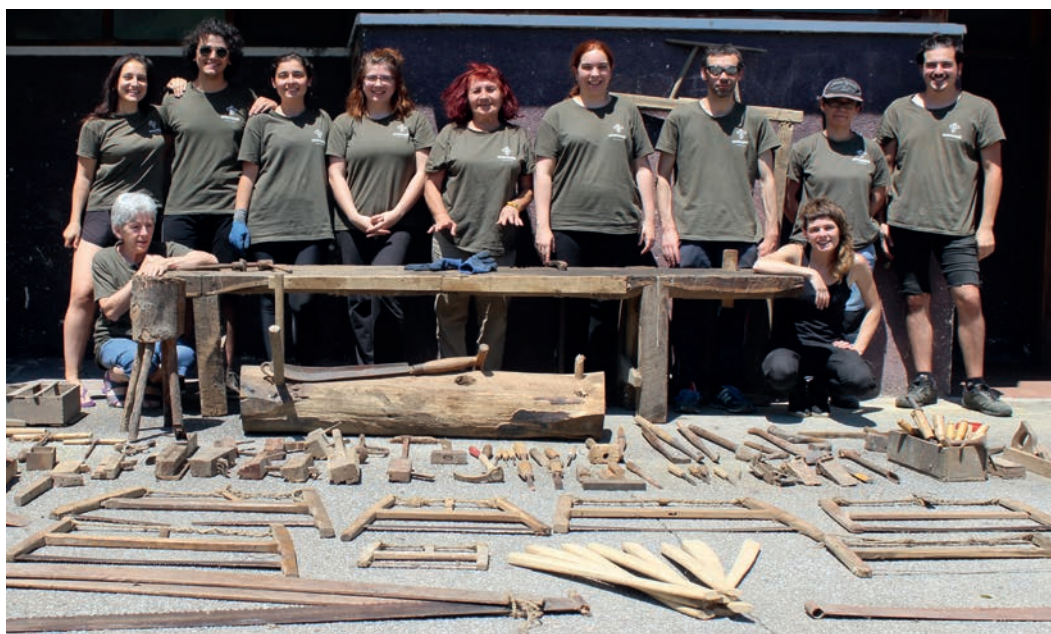
8. irudia. Ikastaroko ikasleak eta jasotako tresna batzuk. Egilea: Suberri Matelo Mitxelena.

Bereziki esan dezakegu sukaldeko tresnak eta lanbideekin erlazionaturiko tresnak izan direla gehiengoa, azpimarratu behar delarik Eskalapineile ofizioari buruz baturiko objektuak, bildumaren herena izan direlako (150 objektutik gora). Lanbide hau galduta badago ere, ongi jasota dago Juan Garmendia Larrañagaren «El eskalapineilia de Valcarlos» lanean, eta bilketa honi esker bertan aipatzen eta agertzen diren prozesu eta tresnak fisikoki dokumentatzea eta deskribatzea lortu da.