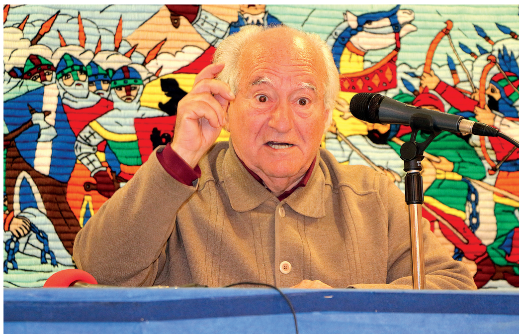
Figura 5. Conferencia en el VIII Centenario de la Fundación de Viana (2019).