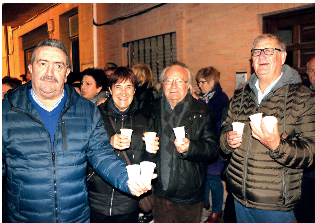
Figura 2. Celebrando la fiesta de san Felices de Viana con familiares y amigos.

La revista Cuadernos de Etnología y Etnografía de Navarra , de la cual fue director, vio publicados gran parte de sus muchos trabajos: Las estelas discoideas de Sangüesa (1978), Las chozas de piedra con cúpula en Viana (1979), Estelas discoideas en Viana (1980), Dos interesantes estudios de etnografía canaria (1982), Los pozos y el comercio de la nieve en Viana y Aras (1982), Aspectos históricos y etnográficos de un libro manuscrito sangüesino (1987), La gaita en Viana, siglos XVII-XX (1988), La fiesta de toros en Sangüesa (1989), Danzantes y gaiteros en Sangüesa (1990), El abastecimiento de nieve en Sangüesa (1600-1926) (1992), Ritos de protección en Sangüesa. Conjuros y saludadores, el agua y la cabeza de San Gegoerio (1993), Artesanos y artesanía del hierro en Sangüesa (1994), Dos nuevas estelas discoideas en Sangüesa (Navarra) (1995), La alimentación en Sangüesa (1996), El juego de la pelota en Sangüesa (1997), La fiesta del Corpus en Sangüesa (1997), Ritos funerarios en Viana (2001), San Sebastián, patrón de Sangüesa. Culto, arte y tradición (2002), Nuestra Señora de Rocamador de Sangüesa: Culto, arte y tradición (2004), Religiosidad popular en Viana (2005), Viana celebra los acontecimientos de la monarquía (2007), Juegos infantiles en Viana (2008), Gastronomía y alimentación en Viana (2009), Los toros en Viana, siglos XVI-XVII (2010), El juego de la pelota en Viana (2013), En Viana se juega al billar en el siglo XVII (2015) y Fiesta de San Felices en Viana (2016).