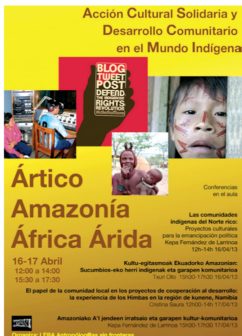
Figura 5. Seminario del año 2013.

Para potenciar los puentes intelectuales y logísticos entre, de un lado, el campo de la investigación/acción etnográfica y, de otro, el binomio asociativo universidad/cooperación al desarrollo, Lera ejecutó durante el curso académico 2015-2016 el proyecto Investigación/acción etnográfica para la implementación de un título universitario específico en Trabajo Social Comunitario Amazónico . Lo financió MAEC-AECID (Ministerio de Educación y Ciencia – Agencia Española de Cooperación al Desarrollo) dentro del Programa de Investigación para el Desarrollo. Los detalles de esta investigación se han expuesto en varios foros, así como en una revista propia Lekuko paperak 2 .