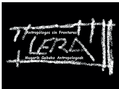
Figura 1. Logotipo de Lera-Ikergunea.

La dimensión indigenista de Lera: Mugarik Gabeko Antropologoak ha estado marcada por su participación directa en dos proyectos de gran significación cultural en la Amazonía ecuatoriana. Uno fue el denominado Fortalecimiento de la cultura cofán en los medios de comunicación local de la Amazonía ecuatoriana FOCAD K2-005. Lo sufragó –tras concurso público– la Dirección de Cooperación al Desarrollo del Gobierno Vasco. El proyecto se inició en junio de 2006. Concluyó en 2008.