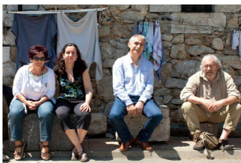
Figura 6. Miembros de Lera-Nafarroa: Mugarik Gabeko Antropologoak.

Cuando la fundación de Lera sus promotores se propusieron afrontar el reto de combinar los estudios de antropología social con la acción cultural de corte comunitario. Son ya veinte años de experiencia teórico-práctica. La investigación/acción etnográfica ha sido la herramienta de trabajo.