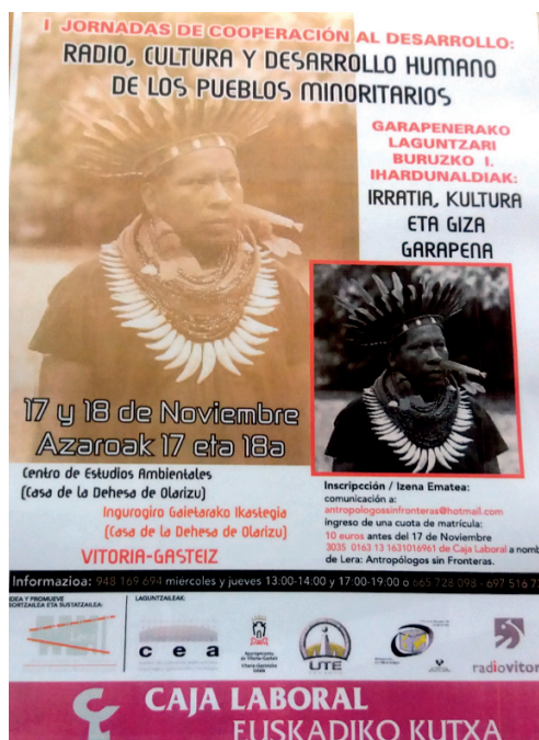
Figura 2. Primeras jornadas de cooperación al desarrollo.

Los dos últimos convenios se firmaron para facilitar que cuatro estudiantes de esta Escuela pudieran participar en la experiencia durante cuatro meses consecutivos en la Amazonía, lo que, a su vez, equivalía a la convalidación de la asignatura Prácticas de Trabajo Social. Lera organizó en Vitoria en 2006 un coloquio internacional con los participantes principales del proyecto. Discurrió durante dos días y lo sufragaron Radio Vitoria y la Oficina de Cooperación al Desarrollo del Ayuntamiento de la capital alavesa. Tituladas como I Jornadas de Radios Indígenas y Desarrollo Socio-comunitario, tuvieron lugar en el Centro de Estudios Ambientales Olarizu del Ayuntamiento de Vitoria.