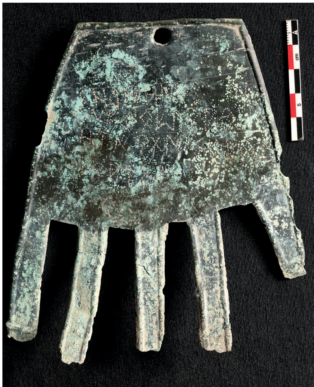
Figura 1. Dorso de la mano con su inscripción, antes de la limpieza del verano de 2023.

Se trata de una lámina de bronce en forma de mano diestra esquemática de tamaño natural, lisa en la parte correspondiente a la palma y con indicación de las uñas en la parte del dorso (fig. 1). En el centro del extremo cercano a la muñeca presenta una perforación, probablemente producida al clavar la pieza sobre un soporte blando, ya que la barba producida por el clavo existe solo en el lado no expuesto a la vista.