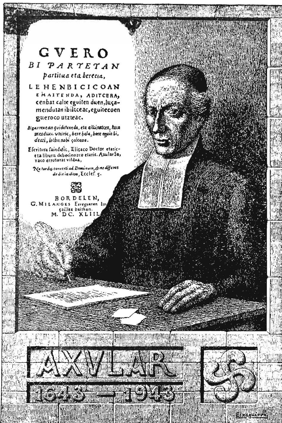
Retrato imaginario de Axular