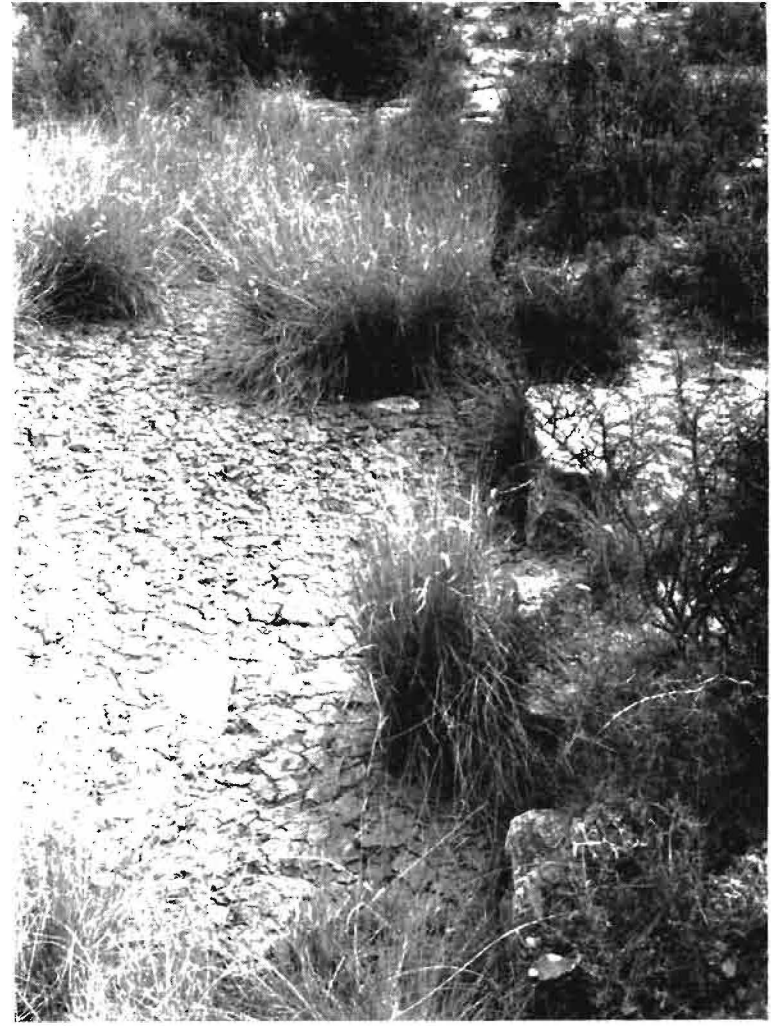
Hic sunt "lapide more antique structure defixi". (Monte Muga Imaz.)