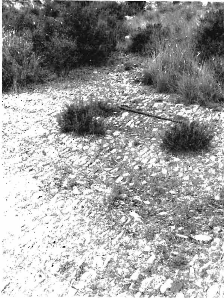
Otro estanque o era de las salinas, con pavimento enmorrillado. (Monte Muga-Imaz.)