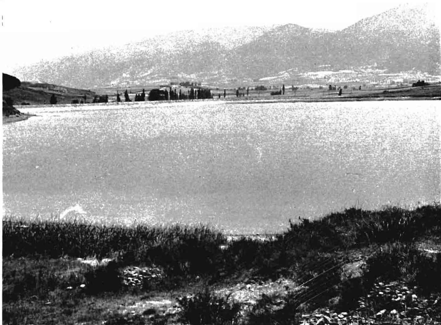
Morea de Beriain.