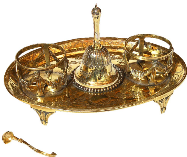
Figura 2. Salvilla y campanilla.