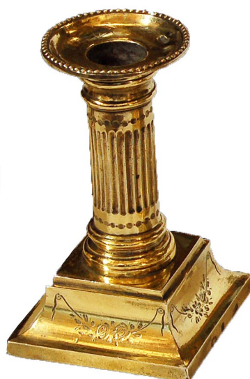
Figura 3. Candelero.

tal estilizada, Heredia (1992, p. 118) sostiene que podría existir otro gemelo de este, probablemente referenciando la pareja que se encuentra en el Museo Franz Mayer de México, mientras que la escritura de donación de Manuel Ascorbe deja claro, sin lugar a dudas, que dona únicamente un ejemplar.