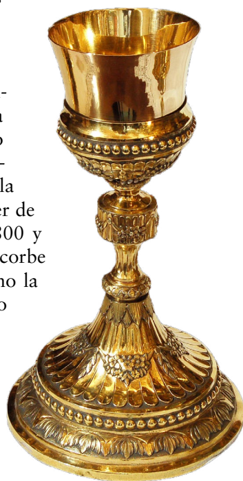
Figura 1. Cáliz.