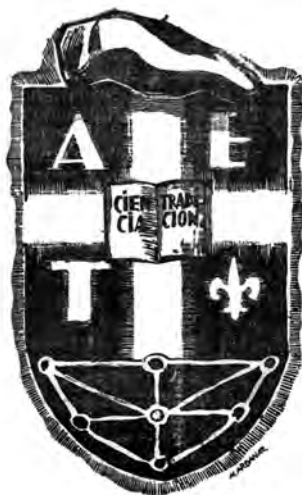
Figura 7. Escudo de la AET, igualmente diseñado por Nicolás Ardanaz. Semanario a.e.t.

Para el redactor jefe, Navarra debe recuperar su «plena independencia en el orden político», lo que debe incluir los principales aspectos del autogobierno, es decir, impuestos, las aduanas «que cerraban la frontera tanto con Francia como con el resto de España», tributación voluntaria al poder central, rechazo de las imposiciones exteriores o «pase foral», tribunales propios y exención de servir en el Ejército, recordando, de paso, que las últimas Cortes de Navarra –1828/1829– fueron administrativamente las «más fecundas» –número 6, del 2 de marzo–. Frente a esta reintegración foral plena, los estatutos de autonomía en marcha solo son, de acuerdo con este autor, «una concepción liberalesca de unas falsas libertades regionales», por lo que «un carlista no debe hablar nunca de Estatutos sino de Fueros» 28 .