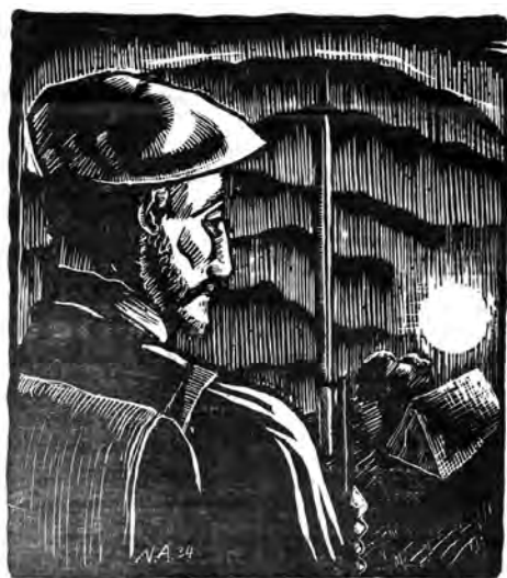
Figura 5. Una de las ilustraciones de Nicolás Ardanaz reproducidas por la publicación, en este caso reflejando a un carlista haciendo guardia ante un tradicional paisaje campestre. Semanario a.e.t.

anarquía más espantosa –se pregunta–, ¿qué podemos esperar de ellos el día que sean Poder?». Más adelante, el artículo «Cólicos» (sin firma) vincula la campaña que está realizando Acción Popular por la Ribera con los «propietarios corraliceros», a los que responsabiliza del paro obrero en el agro navarro. Los «corraliceros», según afirma, en su mayor parte están afiliados al partido de Gil Robles.