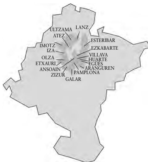
Figura 4. Ubicación de las comarcas y valles situados en el «corazón» de Navarra donde la organización del Requeté estaba directamente vinculada a la organización liderada por Jaime del Burgo. Infografía del autor

Durante el primer semestre de 1934, además de las maniobras en el monte, el Requeté de Pamplona, junto a los grupos que se estaban organizando en otras zonas de Navarra, realizó varias «demostraciones de fuerza», destacando el mitin en el Euskal Jai el 25 de febrero y el del 20 de mayo en Sangüesa, aunque su verdadera consagración como «ejército carlista» tuvo lugar en marzo de 1935 con motivo del centenario de la muerte de Zumalacárregui frente a la basílica del Puy, en Estella. Según relata Antonio Lizarza, formaron más de tres mil boinas rojas –sin uniforme debido a una expresa prohibición gubernativa–, destacando, «como en todas partes, por su grado de instrucción y organización, el Requeté de Pamplona» y, de forma expresa, el esfuerzo organizativo realizado por Del Burgo, Ozcoidi, Millaruelo, Sanz Orrio y Silvanio Cervantes (Lizarza, 1986, p. 61). Sin lugar a dudas, se puede afirmar que cuando Antonio Lizarza asume la