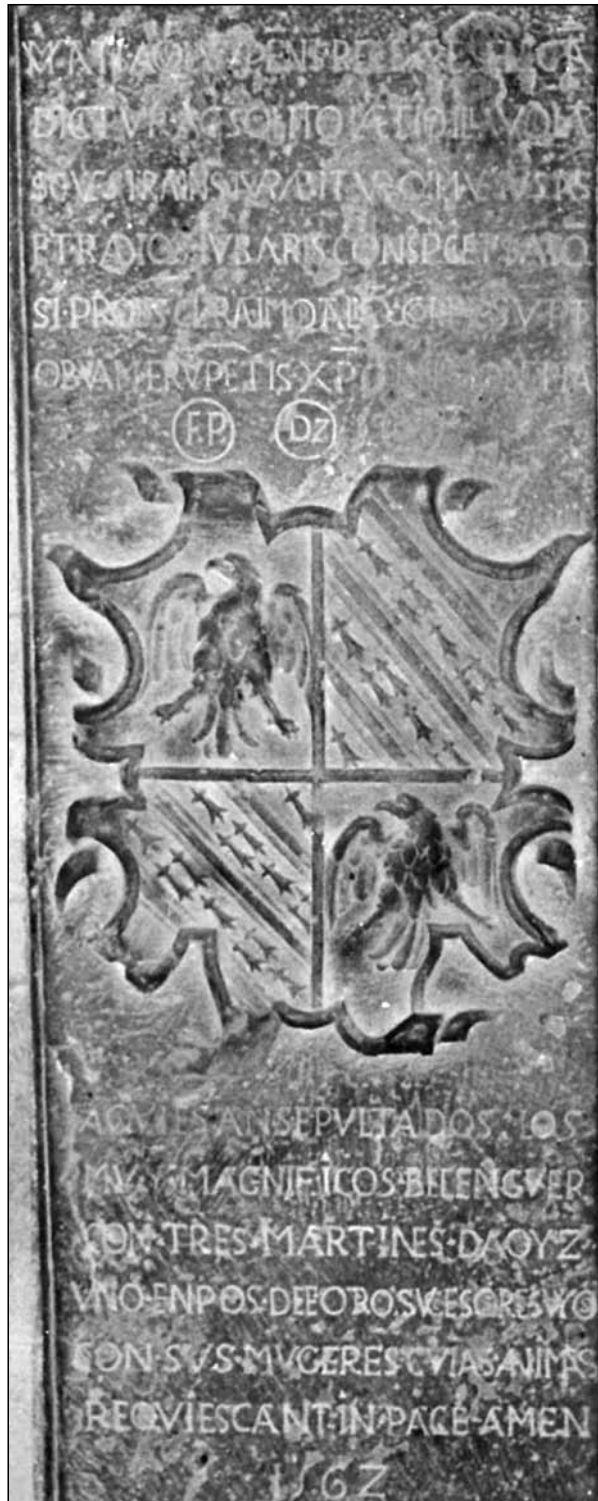
Foto 1. Lápida Sepulcral de los Aoiz (1562). Iglesia del Crucifijo de Puente la Reina