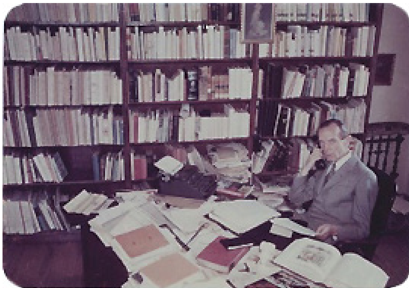
Figura 2. En su despacho de la Universidad Iberoamericana de México, D. F.