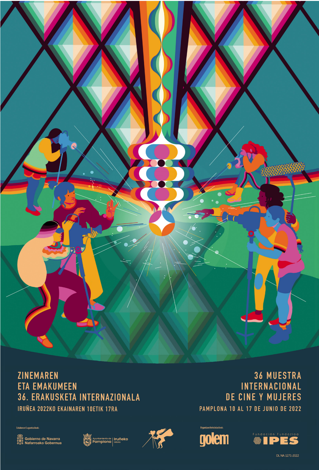
Figura 5. Cartel de la XXXVI edición Muestra Internacional de Cine y Mujeres de Pamplona.