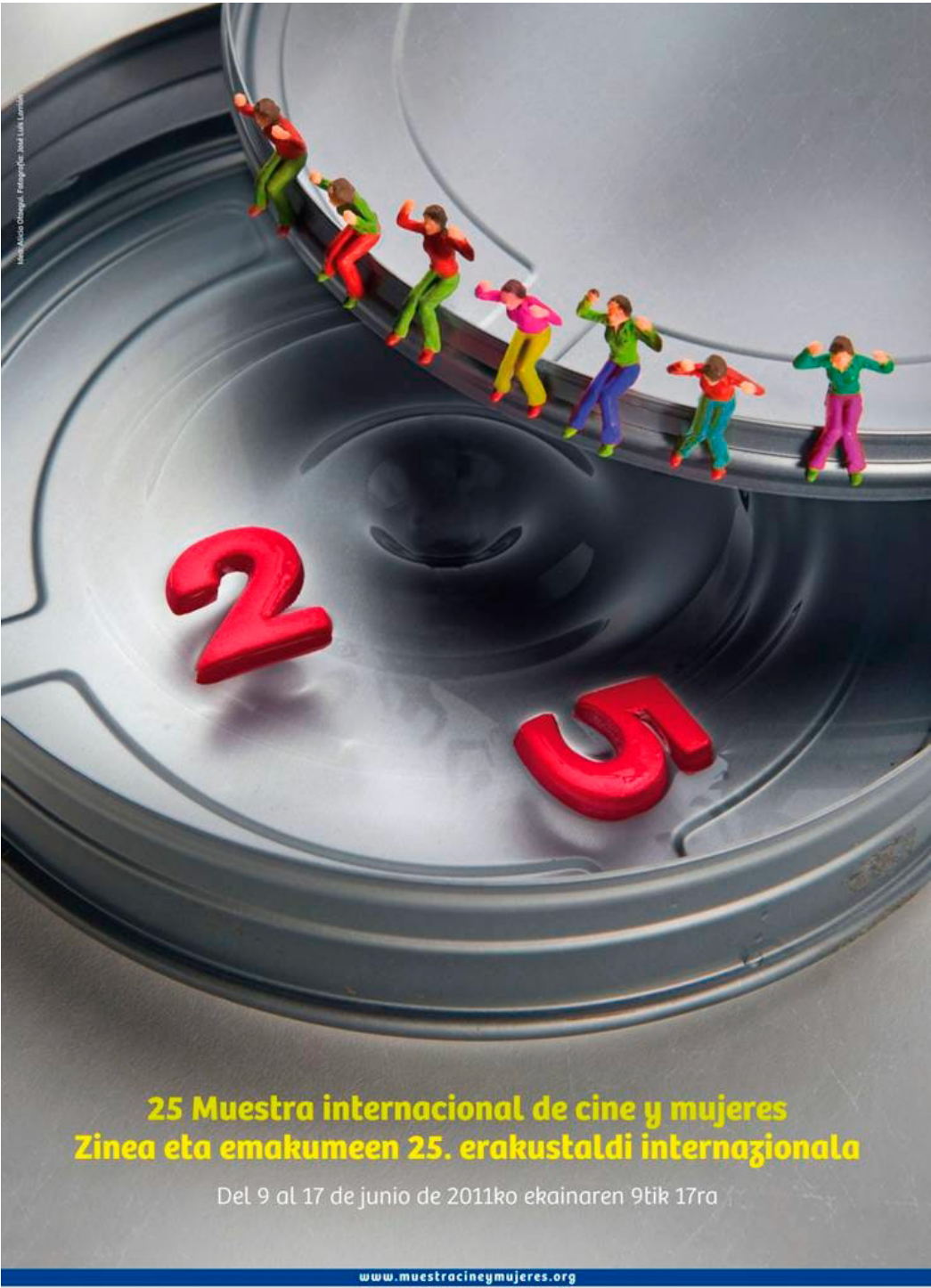
Figura 3. Cartel de la XXV edición Muestra Internacional de Cine y Mujeres de Pamplona.