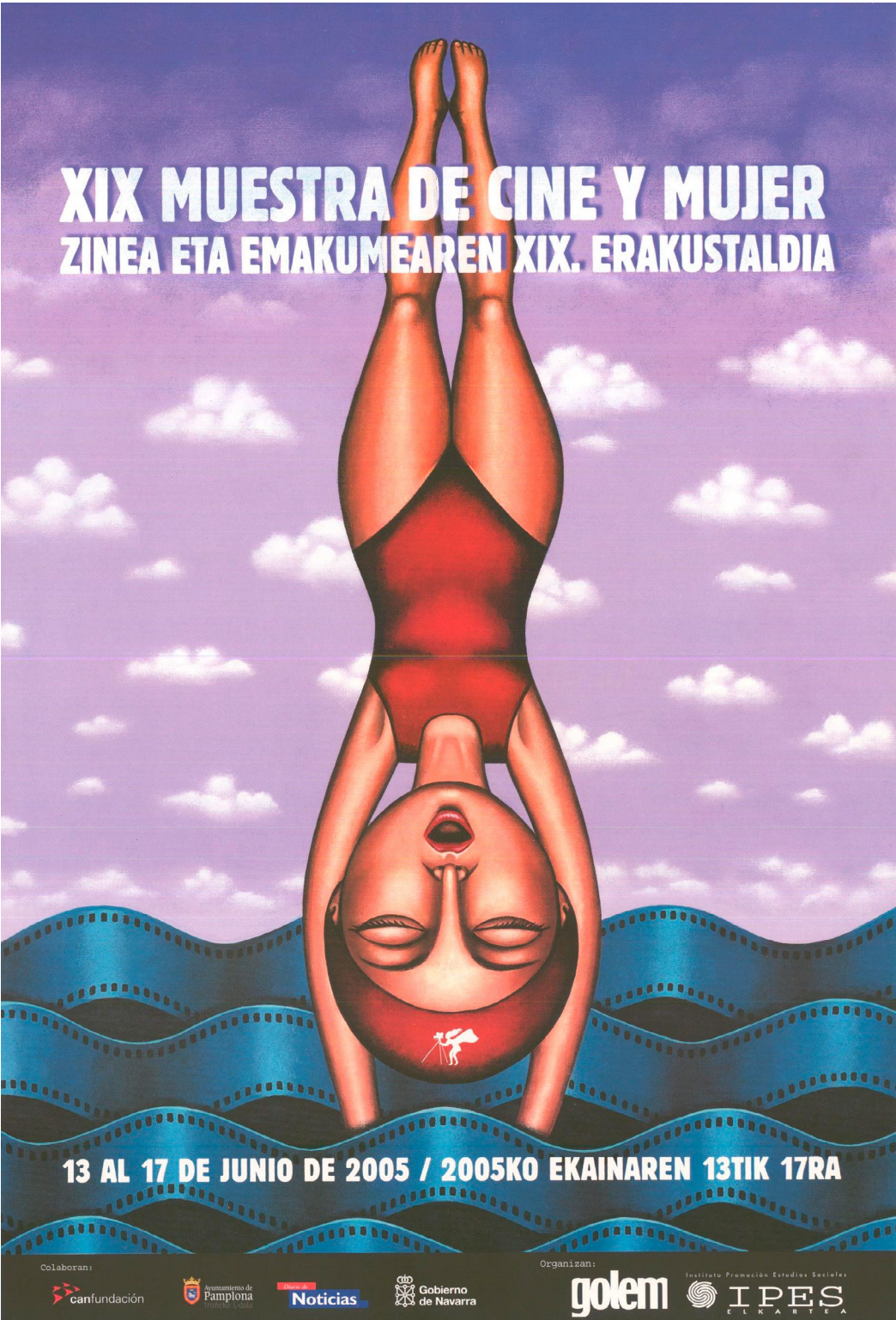
Figura 2. Cartel XIX edición Muestra Internacional de Cine y Mujeres de Pamplona.