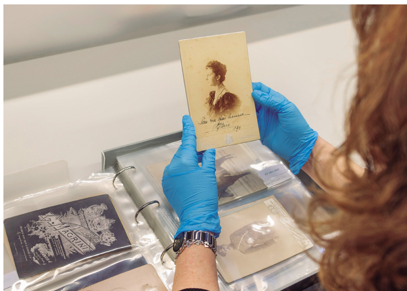
Figura 2. Centro de Documentación del Museo del Carlismo. Estella-Lizarrá.