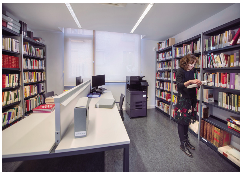
Figura 1. Centro de Documentación del Museo del Carlismo. Estella-Lizarraga.

investigación y documentación sobre el Carlismo y, por extensión, sobre movimientos revolucionarios y contrarrevolucionarios y su contexto histórico que tuvieron lugar durante los siglos XIX y XX» 2 .