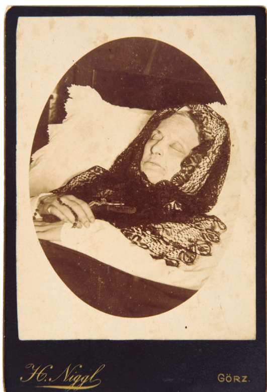
Figura 3. Fotografía posmortem de María Beatriz de Austria-Este, princesa de Módena, madre del pretendiente carlista Carlos de Borbón y Austria-Este, realizada en Gorizia, Italia, el 18 de marzo de 1906.

IA 018. Fondo documental Josep Carles Clemente (1935-2018), periodista y escritor, fue vicesecretario del Consell del Partí Carlí de Catalunya y secretario de prensa del Partido Carlista entre otros cargos dentro del Partido Carlista. Cercano a la figura de Carlos Hugo de Borbón-Parma (1936-2010), participó en la década de los setenta en el denominado proceso de clarificación ideológica que postuló a esta formación política como un partido socialista, autogestionario y federal (Madariaga, 2023, pp. 1141-1145). Entre los años 2003 y 2007, Clemente entregó parte de su archivo y biblioteca junto con algunas piezas históricas de su propiedad al Partido Carlista para que formaran parte de las colecciones del Museo del Carlismo de Estella-Lizarra, pero solamente una de las ocho entregas realizadas por el propietario llegó finalmente al museo 6 . La documentación recibida se compone de 862 boletines informativos de diferentes corrientes carlistas (1907-2003), 63 carteles (1969-2002), una cromolitografía de Jaime III (1911), 18 cajas normalizadas con artículos y recortes de prensa sobre carlismo (1900-1981) y 102 revistas (1935-2002).