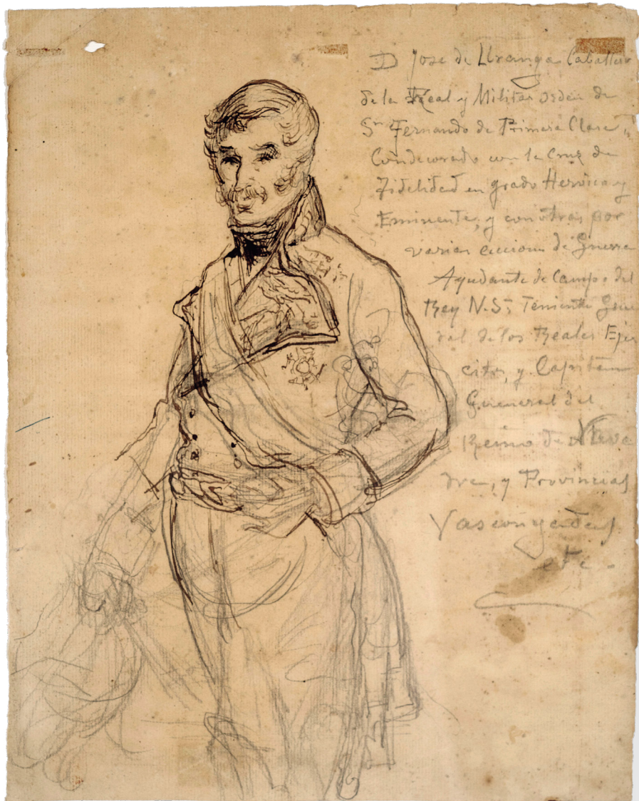
Figura 7. Boceto preparatorio del retrato del general José Ignacio Uranga realizado hacia 1905 por su nieto, Pablo Uranga. CDMC. Fondo familia Uranga Azpiri.

última Guerra Carlista (1872-1876). Contiene tres carpetas con documentación de procesos de justicia militar por desertión, insubordinación, espionaje, robo, lesiones o asesinato y un listado de los presos de la cárcel de Estella en 1875.