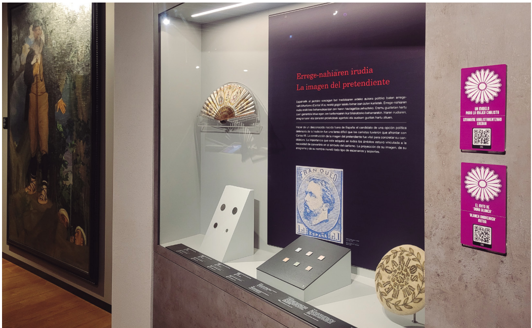
Figura 9. Exposición permanente del Museo del Carlismo. QRs integrados del proyecto Mujeres y Carlismo .