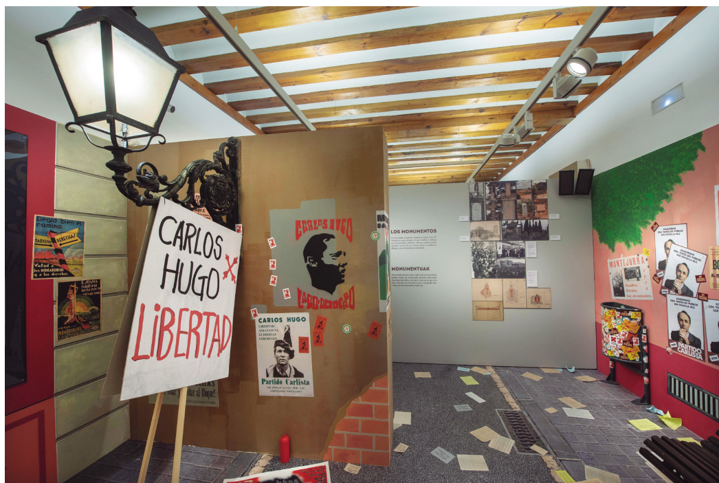
Figura 10. Exposición temporal Las Voces de la Causa. Propaganda y difusión del Carlismo. Ambientación realizada con copias de documentos obrantes en el CDMC.