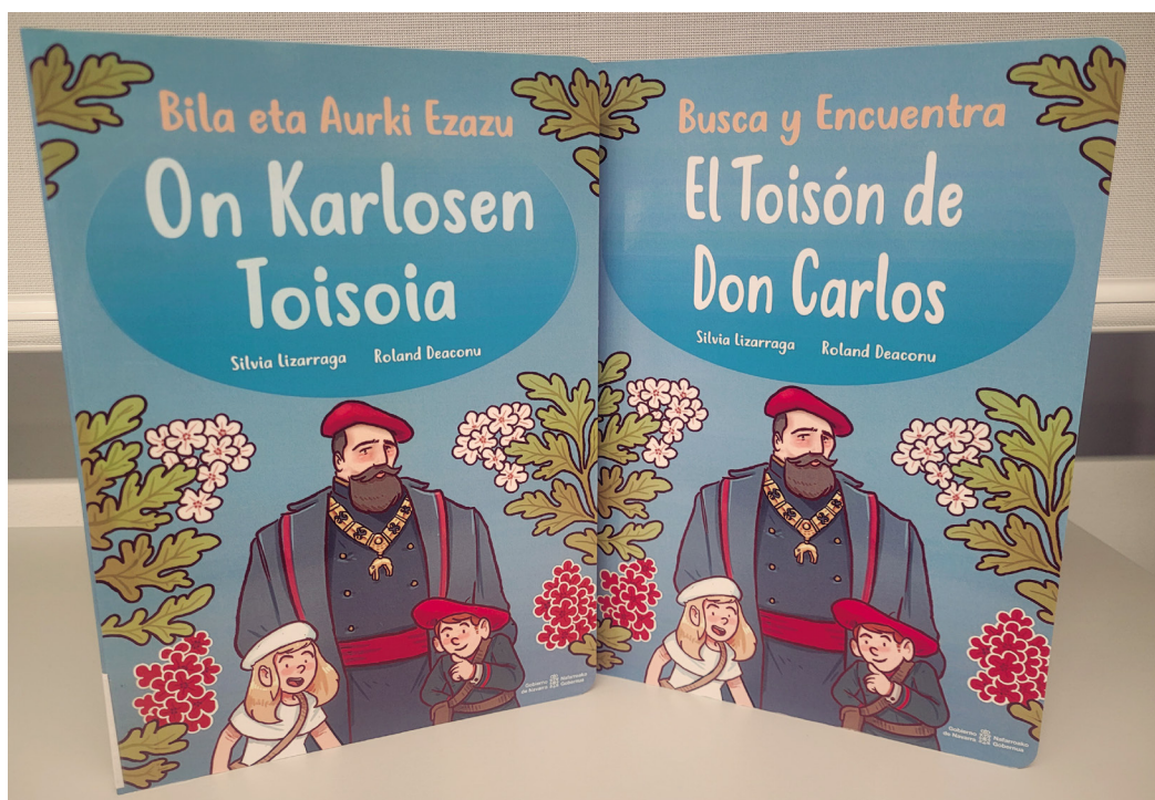
Figura 11. Publicación Noche en el Museo del Carlismo (2021).

carlismo. Del CDMC también han surgido los libros destinados a público infantil El Toisón de Don Carlos (2020), Noche en el Museo del Carlismo (2021) y Un tesoro carlista en Estella (2024) que son la base para la creación de talleres artísticos, cuentacuentos y ginkanas que el museo organiza coincidiendo con periodos no lectivos. También es labor del CDMC la coordinación de la página web del museo y la cesión de imágenes tanto a instituciones como a particulares que desean ilustrar sus trabajos con imágenes tanto de las piezas como los documentos custodiados por el Museo del Carlismo.