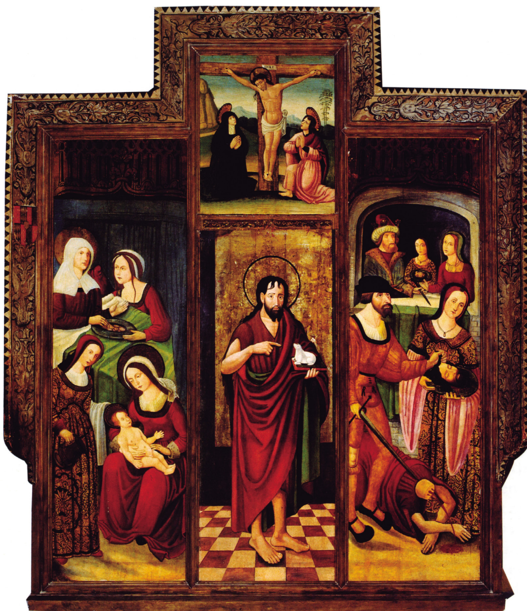
Figura 1. Retablo de San Juan Bautista, c. 1530. Museo de Navarra.

en 1970 (fig. 2), obra de Jerónimo Vallejo Cósida, pintor aragonés y asesor artístico de Hernando de Aragón, y en el coro alto se dispuso una sillería de madera de nogal que talló Bernal de Gabadi entre 1589 y 1591.