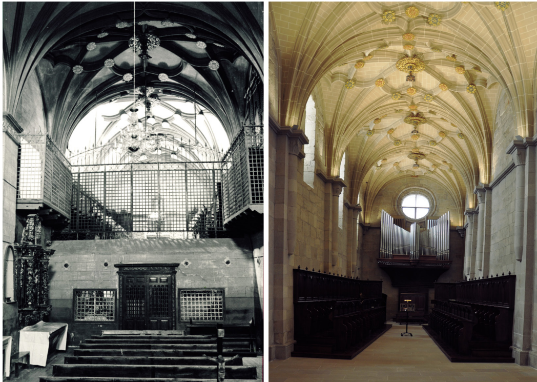
Figura 5. Nave de la iglesia abacial con el coro alto y el coro de las conversas, que desaparecieron tras la reforma iniciada en 1970.

heredado de sus predecesoras, habitado ininterrumpidamente desde su fundación a mediados del siglo XII hasta nuestros días.