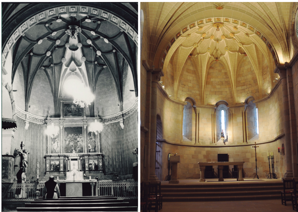
Figura 4. Cabecera de la iglesia con el retablo renacentista de la Dormición de la Virgen, anterior a 1970, y el presbiterio en la actualidad.

superior y la inscripción que conmemoraba el abovedamiento financiado por él. Así, las monjas recuperaron la austeridad propia del Císter, saliendo a la luz el ábside románico, al eliminar los contrafuertes añadidos en el siglo XVI, bajo los que se ocultaban estelas funerarias discoideas (hoy conservadas en el museo), y la mesa del altar original situada bajo el retablo mayor renacentista, pieza que fue retirada, conservándose únicamente en este espacio la imagen gótica de la Virgen de Nuestra Señora de la Calidad (siglo XIV), y la silla abacial de madera renacentista procedente de la sala capitular (fig. 4). Las religiosas también modificaron el espacio interior del templo suprimiendo el coro de las conversas y el coro alto, retirando los bienes muebles allí existentes, y disponiendo a los pies de la nave una sola sillería de coro de roble (1972) en la que todas las cistercienses se emplazan para celebrar la liturgia, además de un órgano nuevo (2001) (Tarifa, 2012, pp. 39-51) (fig. 5).