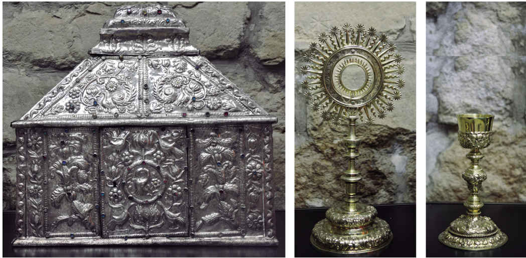
Figura 17. Arqueta eucarística, ostensorio y cáliz barrocos.