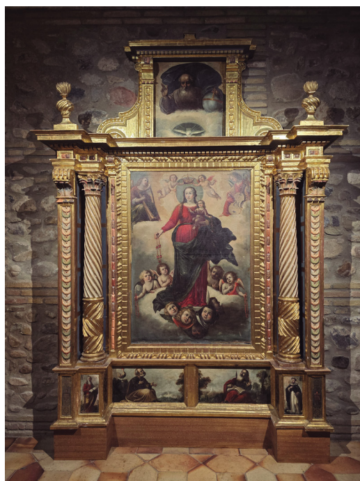
Figura 13. Retablo de Nuestra Señora del Rosario.

relicarios barrocos y joyas, algunas pertenecientes al ajuar de la Virgen de la Cama, titular del monasterio, como cruces pectorales, medallas relicarios, rosas de pecho, broches, cadenas, piochas, lazos, sortijas, o pendientes, pertenecientes a los siglos XVI-XVIII, algunas estudiadas por Miguéliz (2018), que recientemente se han retirado a la espera de poder habilitar otro expositor para mostrarlas.