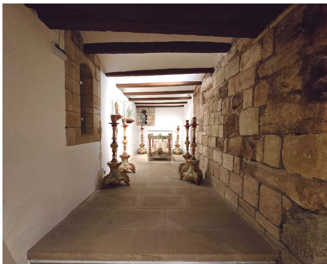
Figura 10. Sala III del museo.