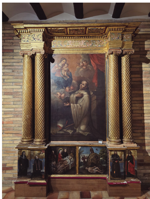
Figura 12. Retablo de San Bernardo.