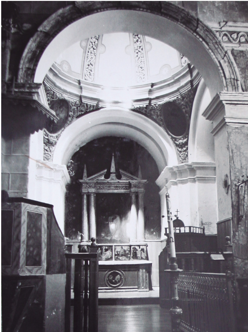
Figura 3. Capilla de San Bernardo con el retablo barroco del titular, antes de la reforma de 1970.

privadas de sus posesiones, hacienda y rentas, por lo que tuvieron serias dificultades económicas para hacer frente al mantenimiento del complejo monacal, que a principios del siglo XX amenazaba con desplomarse.