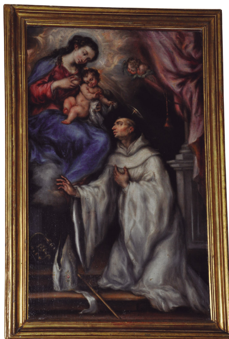
Figura 19. San Bernardo reconfortado por la Virgen.

El museo también ha cooperado con otras agrupaciones, como Astrolabio Románico, con una visita guiada al monasterio y el museo programada en mayo de 2015 para los miembros de esta asociación especialmente interesados en el conocimiento del