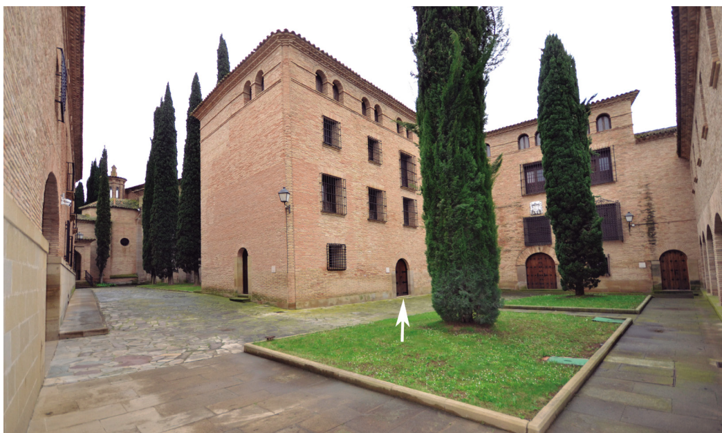
Figura 7. Acceso al museo del monasterio de Tulebras.

La parte del monasterio destinada a museo quedó conformada por tres dependencias contiguas, que ofrecen un total de 170 m 2 de exposición. La entrada y salida al mismo se encuentra en la fachada occidental del edificio que da al patio interior, nada más acceder al complejo monacal, facilitando el ingreso de todos los visitantes, al no existir barreras arquitectónicas, ya que está en la planta calle, y no interfiriendo, por otro lado, en la forma de vida de retiro espiritual propio de las monjas que habitan el cenobio, al quedar la visita fuera de las zonas propias de clausura (fig. 7).