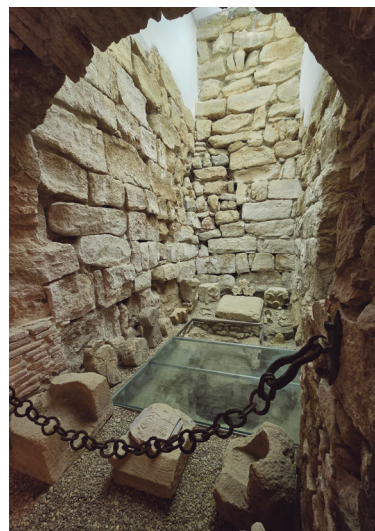
Figura 11. Torre romana integrada en el espacio expositivo del museo.