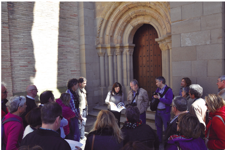
Figura 21. Visita de Astrolabio Románico. Mayo de 2015.