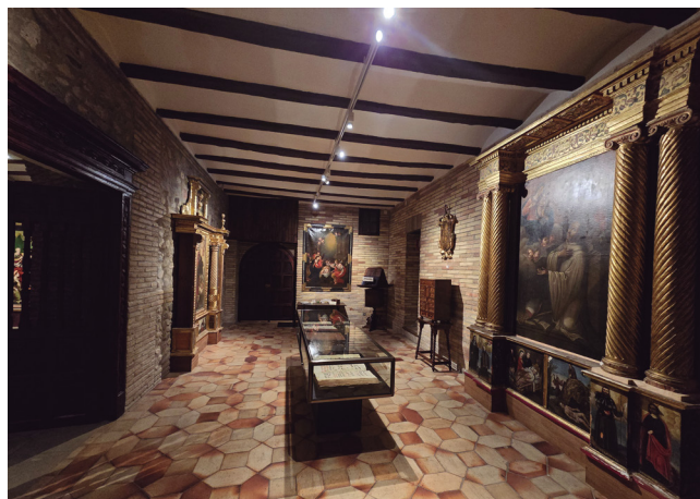
Figura 8. Sala I del museo.