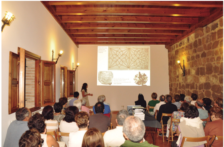
Figura 20. Conferencia en una de las salas del monasterio. Agosto de 2015.