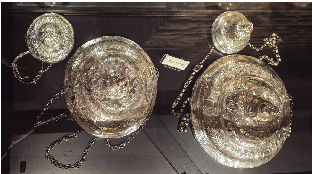
Figura 16. Lámparas votivas.

Asimismo, sobresalen dos lámparas votivas de plata ejecutadas en 1613, obra del platero tudelano Felipe Terrén, con las marcas estampadas de la ciudad de Tudela y la del artista que las ejecutó (TE/RREN), decoradas con motivos geométricos y vegetales, donadas por la abadesa Leonor de Gante y Egüés y la monja María Jordan (fig. 16). También se muestran tres sacras de plata parcialmente doradas, de estilo rococó, de la segunda mitad del siglo XVIII, de original formato de águila bicéfala coronada, que eran elemento obligado en el altar desde el Concilio de Trento.