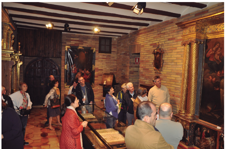
Figura 22. Visita de la Asociación de Amigos de la Catedral de Tudela. Septiembre de 2017.