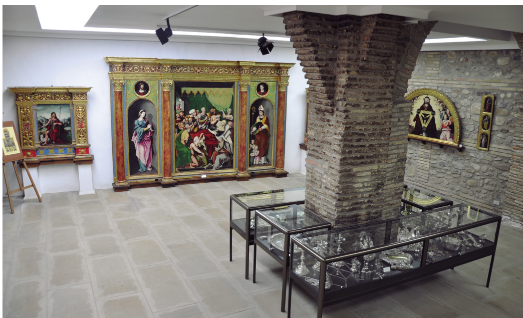
Figura 14. Vista general de la sala II con las tablas del retablo mayor de la Dormición.