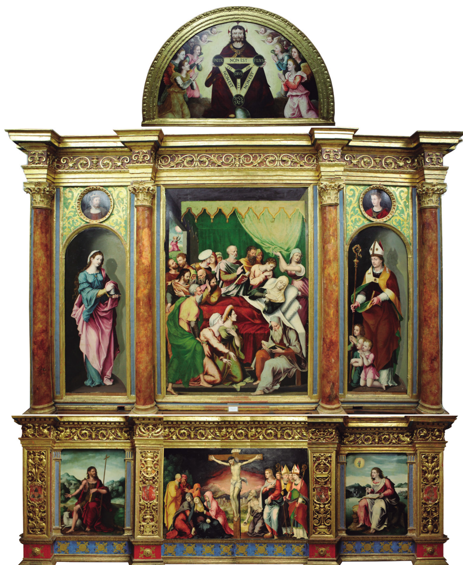
Figura 15. Composición con la disposición originaria del retablo de la Dormición de la Virgen. María Josefa Tarifa Castilla.

En distintas vitrinas de cristal se exhiben algunas de las piezas de plata que conforman una interesante y variada colección de ajuar litúrgico de distintas épocas y estilos (Orbe, 2001, pp. 49-55; Tarifa, 2012, pp. 111-112), como una naveta de fines del siglo XVI, palmatorias del siglo XVII, vinajeras de la segunda mitad del siglo XVIII, un puntero del siglo XVII, un pequeño acetre de hacia 1600 de cuerpo cilíndrico con su hisopo, un incensario de la segunda mitad del siglo XVI, varios cálices de plata dorada de los siglos XVII y XVIII, relicarios barrocos, dos báculos, uno de ellos labrado en Zaragoza en la primera mitad del XVII, y otros tres báculos más pequeños que adornan la escultura de san Bernardo, y la cruz procesional del siglo XVII.