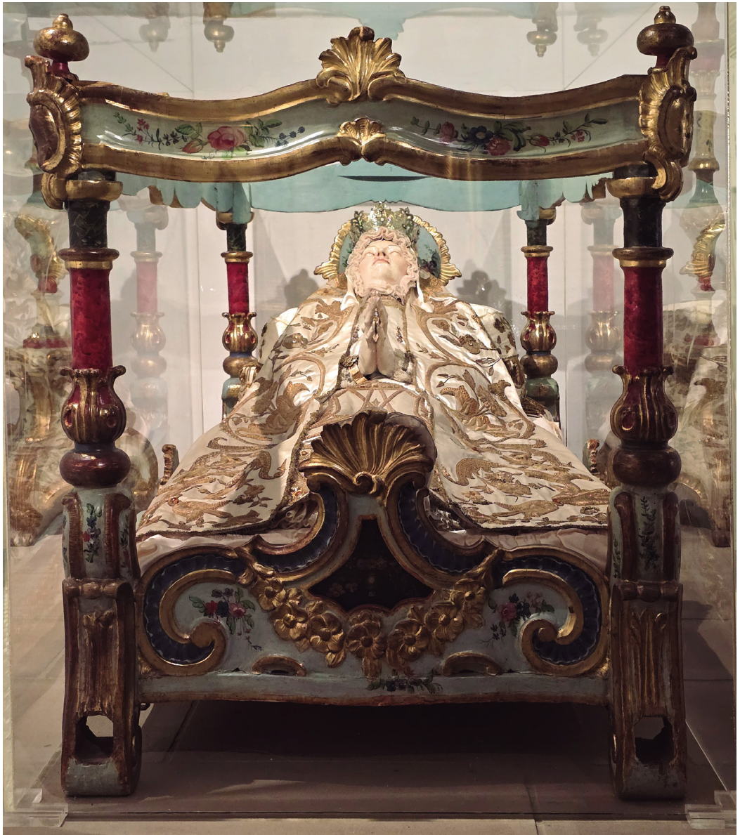
Figura 18. Virgen de la Cama.

Además de la visita guiada por las diferentes salas del museo, también está a disposición de los interesados un folleto con la descripción detallada de las piezas expuestas en diferentes idiomas (español, euskera, inglés y francés) y en la tienda se pueden adquirir las últimas publicaciones dedicadas monográficamente al estudio histórico-artístico de este monasterio.