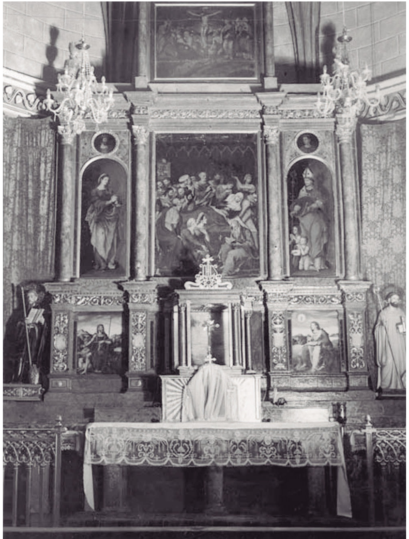
Figura 2. Retablo de la Dormición de la Virgen, de Jerónimo Vallejo Cósida, en la cabecera de la iglesia abacial.

Horaa y Jerónimo Baquero. A mediados del siglo XVIII se acometió la renovación del palacio abacial, la hospedería y otros espacios, como la capilla de san Bernardo que fue cubierta con una cúpula con linterna decorada con yeserías de profusa vegetación, acorde a los gustos del barroco, al igual que la dotación artística que recibió formada principalmente por retablos pictóricos, como los de san Bernardo (fig. 3), san Benito y Nuestra Señora del Rosario.