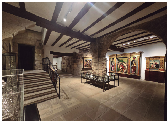
Figura 9. Sala II del museo.

Esta dependencia comunica en el muro sur directamente con la sala III, un espacio estrecho de 7,40 metros de largo por 2,45 metros de ancho y 2,40 metros de alto debido a la proximidad de la torre romana, de suelo y paredes pétreas (fig. 10). Desde esta sala y a través de un estrecho pasillo se llega a los restos de la torre romana pétreo del siglo I, de 6,90 m de largo por 4 m de ancho y altura máxima de 4,50 m, con una abertura en el suelo de medio metro sobre la que se colocó un cristal blindado, un espacio que fue descubierto a raíz de las obras de restauración iniciadas por las monjas en 1970 (fig. 11).