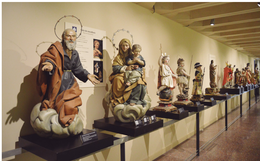
Figura 6. Sala de escultura del Museo de Tudela.

Entre las piezas expuestas sin quitar importancia al resto, destacamos el grupo escultórico de Santa Ana con la Virgen niña y San Joaquín. Las piezas, datadas a comienzos del siglo XIX, están realizadas en madera policromada y su autor fue Ramón Amadeu, maestro imaginero catalán. Iconográficamente, se representa a Santa Ana como persona adulta llevando en su regazo a la Virgen niña. Su esposo, San Joaquín completa la escena. Son imágenes de bulto redondo y su perfección formal enlaza con el academismo propio del estilo Neoclásico, dejando a un lado la exageración cromática más propia de la etapa barroca anterior.