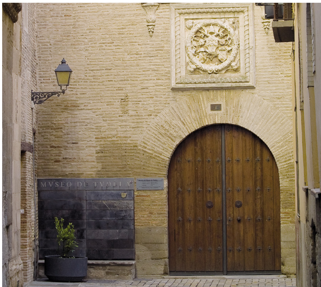
Figura 1. Fachada principal del Palacio Decanal.

En el primer cuarto del siglo XVI, Don Pedro de Villalón y Calcena (Fuentes, 1946, pp. 512-530) aparecerá en el escenario religioso-cultural tudelano convirtiéndose en la figura clave para entender el Palacio Decanal y su contexto (Ochoa Larraona, 2017, pp. 411-433). Fue camarero pontificio y protonotario apostólico del papa Julio II, quien le concedió el deanato de Tudela aumentando sus privilegios. Su figura viene a reflejar el prototipo de príncipe renacentista, culto, amante del lujo, acaparador de dignidades y promotor de obras artísticas (García Gainza, 2000, pp. 53-69). De su mano se introdujo el estilo renacentista en Navarra (Tarifa Castilla, 2011, pp. 7-34), con la realización del coro de la Catedral de Tudela (García Gainza, 2005, pp. 213-217). Es en este periodo cuando se produce la mayor ampliación del palacio (Ochoa Larraona, 2017, pp. 433-436), que, con grandes modificaciones, lo convertirán en la casa principal de la ciudad y lugar de acogida de reyes y papas. Entre estas modificaciones destaca especialmente la decoración plateresca de tradición italiana apreciada en las ventanas de la fachada y en el escudo de alabastro que preside la entrada principal, donde aparecen las armas del deán junto con las del papa Julio II.