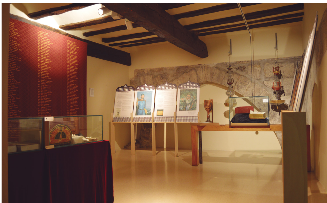
Figura 14. Sala de la cultura judía. Claustro de la Catedral de Tudela.

tos sagrados de la liturgia hebrea, hasta piezas arqueológicas procedentes de la judería nueva, todas ellas acompañadas de la información adecuada. No nos olvidamos de la popular manta de Tudela. Este tapiz, toma como referencia el documento que contiene una nomina completa o padrón compuesta por los cabezas de familia judíos bautizados en 1498 que en 1510 pactaron el pago de un tributo a la corona con objeto de garantizar su inmunidad ante la actuación inquisitorial.