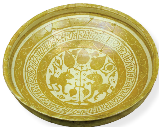
Figura 5. Ataifor de loza dorada islámico (siglos XI-XII) Procedente de la excavación realizada en la Calle Cortapelaire (Tudela) en el año 1987. Depósito de Gobierno de Navarra. Expuesto en la sala de arqueología del Museo de Tudela.

Los materiales se encuentran expuestos en tres vitrinas de cristal, con una adecuada iluminación cenital, siguiendo un discurso de manera cronológica que se apoya en paneles explicativos y gráficas de los yacimientos arqueológicos. Además, a cada pieza le acompaña una cartela específica donde se detalla el nombre, la cronología y la procedencia.