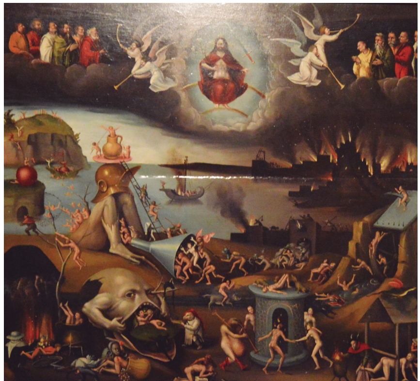
Figura 10. Tabla del Juicio Final. Autoría desconocida, relacionada con la escuela de «El Bosco» (siglo XVI). Procedente de la Catedral de Tudela. Expuesto en la sala de pintura del Museo de Tudela.