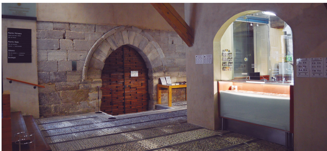
Figura 2. Zaguán del Museo de Tudela.

Este espacio es el nexo de unión del resto de las salas. Como punto de recepción de los visitantes, es también el lugar de venta de entradas, de artículos variados y bibliografía referente al museo y a la catedral. Se trata de un espacio abierto que propicia la acogida, a través de la atención del personal y la información necesaria para una visita de calidad. Aquí, de forma conjunta, el visitante puede acceder a una serie de vídeos accesibles, con audio, a través de códigos QR, que también aparecen de forma singularizada en cada sala específica. Incluso se ofrecen folletos explicativos en tres idiomas (castellano, inglés y francés) con información de las diferentes salas expositivas.