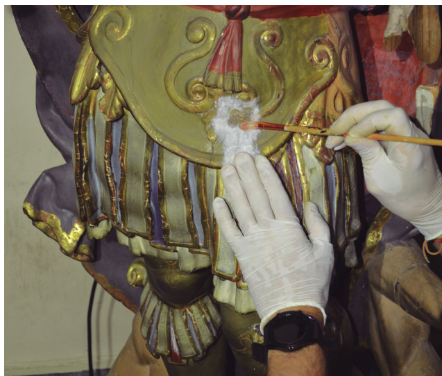
Figura 16. Proceso de restauración (año 2021) de la escultura de San Miguel (siglo XVII). Procedente de la Catedral de Tudela. Expuesta en la sala de pintura del Museo de Tudela.

Una vez realizado el inventario y en la medida que el tiempo lo permite, se procede a la catalogación y recopilación documental de cada una de las piezas.