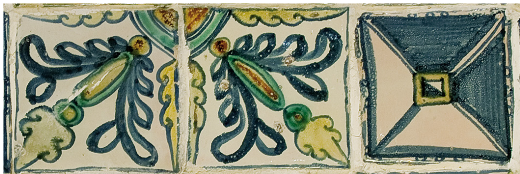
Figura 3. Fragmento paño de azulejería (siglo XVIII). Procedente de la Iglesia de San Nicolás de Tudela (Capilla de la Virgen de los Remedios). Taller de alfarería de Villafeliche.

Esta zona nos presenta en uno de sus paramentos murales un paño de cerámica del siglo XVIII del alfar de Villafeliche (Zaragoza) procedente de la antigua iglesia de San Nicolás de Tudela, que destacamos entre otras obras también de interés en este espacio.