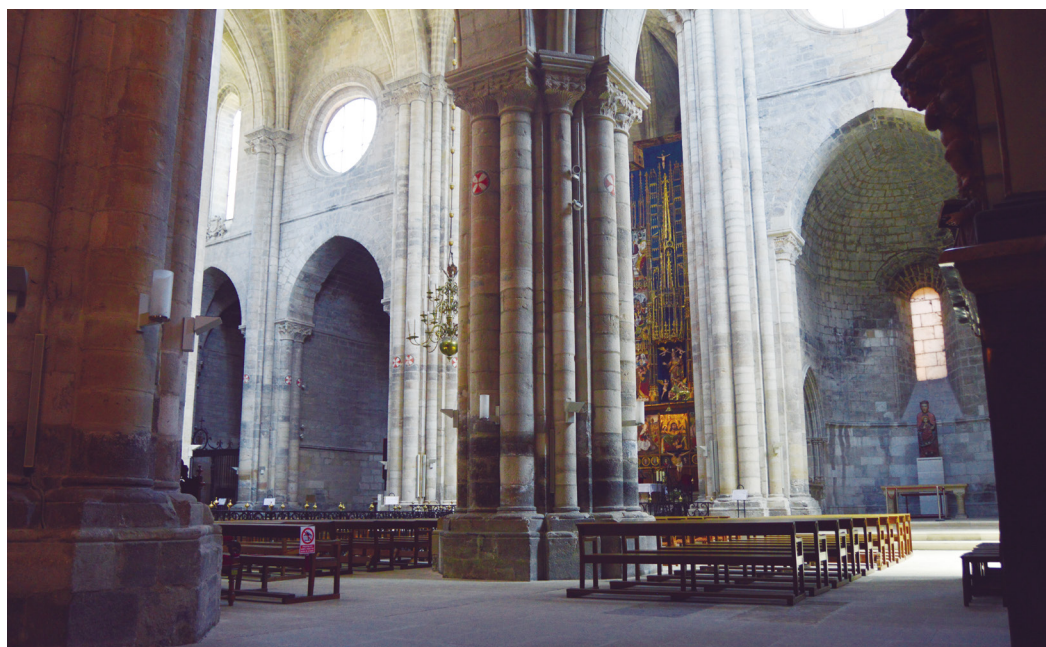
Figura 15. Vista interior de la Catedral de Tudela.

nacional en el año 1884. Para atender al servicio religioso y al mantenimiento del templo se le dotó de un cabildo.