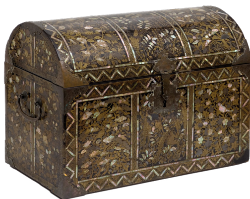
Figura 8. Arca Namban (1580-1630) Kyoto (Japón). Proveniente de la Catedral de Tudela. Expuesto en la sala de retablos, orfebrería y ornamentos del Museo de Tudela.

Entre las piezas expuestas, destacamos unas arcas de época Namban 5 creadas en Japón en el siglo XVI. Llegaron a occidente para formar parte de las colecciones de la realeza y de la nobleza, otras fueron donadas a conventos e iglesias, convirtiéndose en relicario o arca eucarística del jueves santo. Son piezas realizadas en Japón pero al gusto europeo con gran profusión de adornos florales e incrustaciones de nácar sobre superficies de madera lacada, utilizando exclusivamente la variante del Makie plano (VV.AA, 2013, p. 441) 6 . Respecto a la exportación de estas piezas tuvieron una importante contribución los misioneros jesuitas 7 .