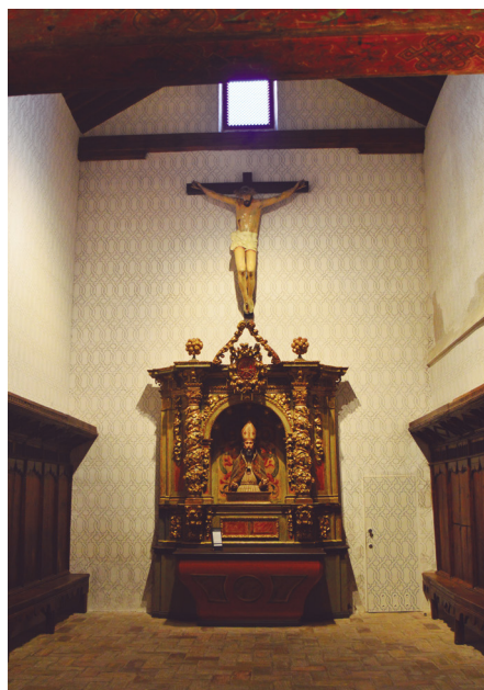
Figura 13. Capilla de San Dionís (siglos XIII-XIV). Claustro de la Catedral de Tudela.

espacio que comunica la zona claustral con el templo. Tuvo uso funerario en época medieval. En la actualidad se exponen diferentes piezas arqueológicas, parte de ellas procedentes de la antigua Mezquita Mayor de Tudela (del siglo IX al XI) y ajuares funerarios encontrados en varios enterramientos hallados en las excavaciones arqueológicas durante la última restauración del templo (2002-2006). Cada pieza está acompañada de su cartela explicativa y un panel didáctico informa al visitante del contenido de la sala.