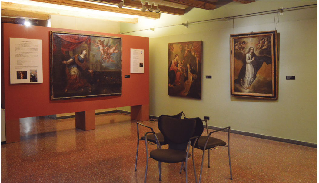
Figura 9. Sala de pintura del Museo de Tudela.