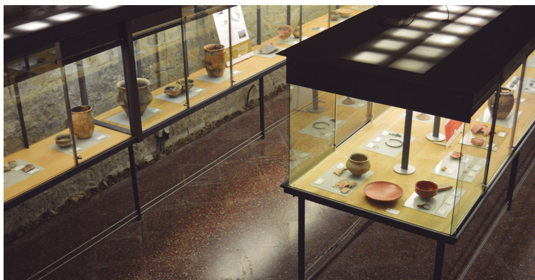
Figura 4. Sala de arqueología del Museo de Tudela. Fotografía: Museo de Tudela.

Desde el zaguán se accede a la bodega medieval del palacio, uno de los espacios más antiguos desde el punto de vista constructivo. La piedra sillar, bien escuadrada en grandes bloques, configura una gran bóveda de cañón generada por la prolongación de un arco de medio punto a lo largo de un eje longitudinal. Podemos disfrutar de las marcas de cantero labradas en estas superficies pétreas. Tras la creación del museo, este espacio es la sala de arqueología, donde se muestran piezas que van desde la Prehistoria hasta la Época Medieval. Todas ellas proceden de la Ribera de Navarra.