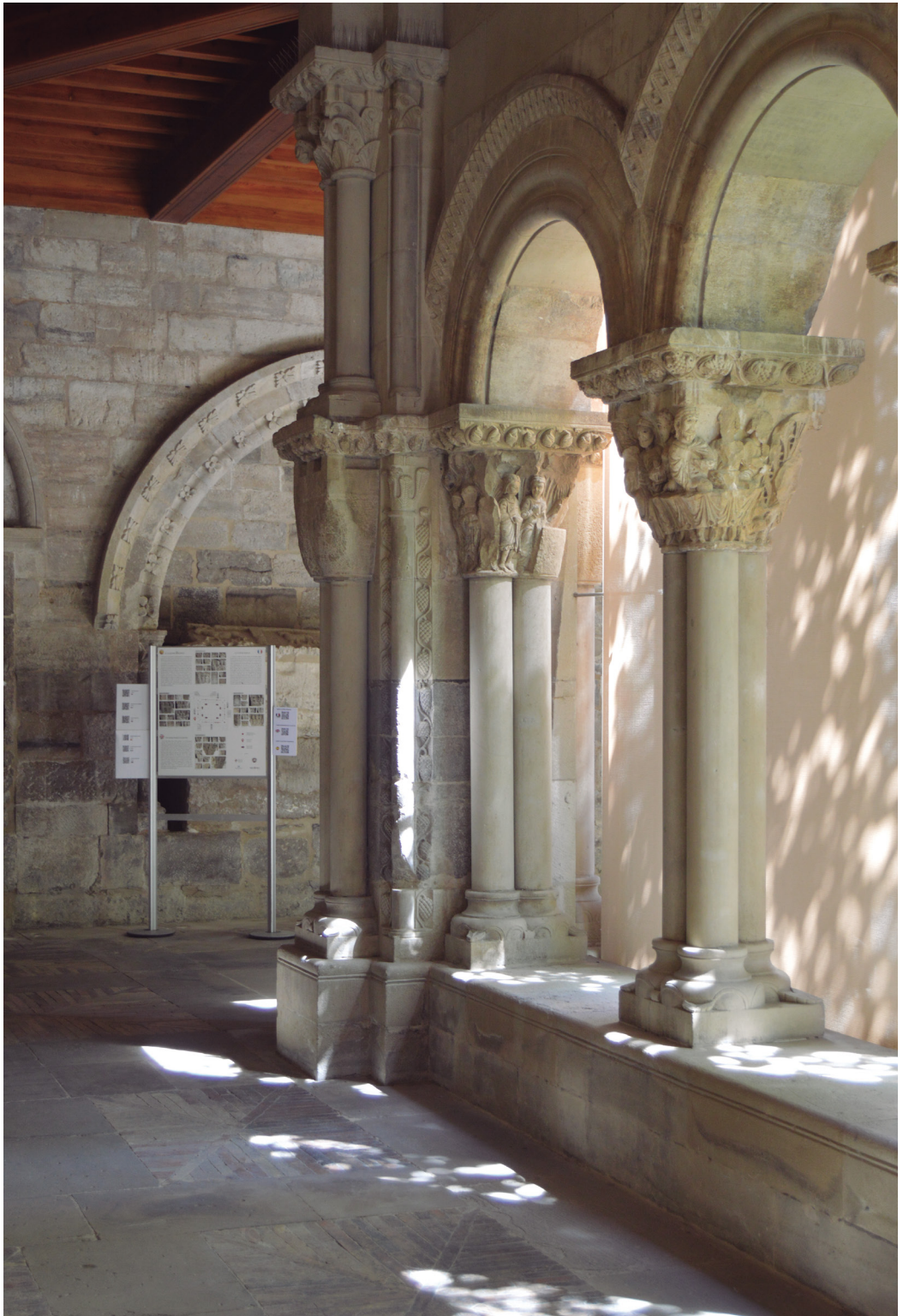
Figura 11. Claustro románico de la Catedral de Tudela (siglo XII).