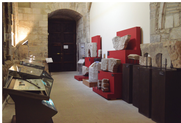
Figura 12. Sala del tránsito. Claustro de la Catedral de Tudela.