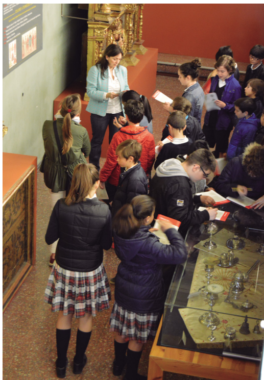
Figura 18. Visita escolar en el Museo de Tudela.

grabación de imágenes de la catedral, claustro y museo en diferentes programas culturales para cadenas de TV autonómicas, nacionales y extranjeras, es habitual año tras año, así como a través de particulares y asociaciones. La promoción y difusión más directa se efectúa a tour operadores, agencias de viaje, empresas de actividades turísticas y oficinas de turismo. Se mantienen las publicaciones propias 17 del museo ya editadas en años anteriores, para su venta y entrega in situ .