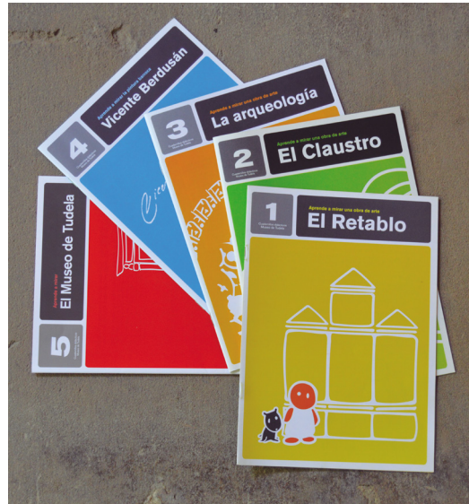
Figura 17. Cuadernillos didácticos para actividades escolares creados por el Museo de Tudela.

A lo largo de estos años, el museo ha atendido a numerosos investigadores: historiadores, historiadores del arte, arqueólogos, periodistas, conservadores... Se han tramitado numerosas autorizaciones para fotografiar piezas del museo para trabajos particulares, de investigación universitaria y divulgativos a nivel nacional e internacional. La publicación de estos estudios se incluye en el fondo de nuestra biblioteca.