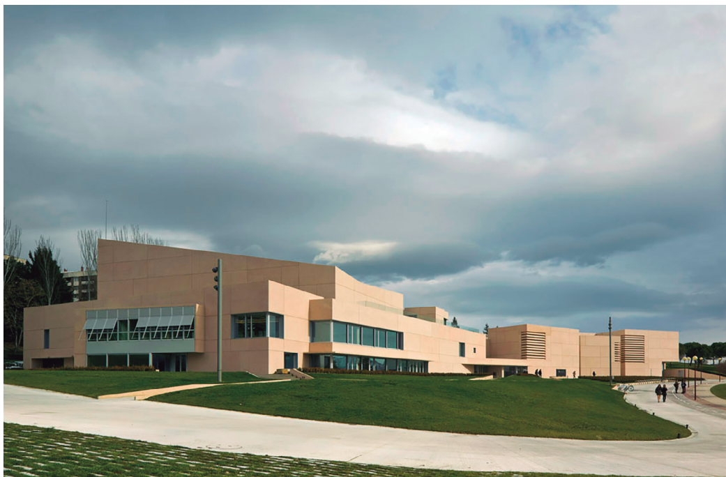
Figura 1. Museo Universidad de Navarra.

Han sido varias las denominaciones con la que se ha conocido a la colección desde su nacimiento hasta la actualidad: Legado Ortiz Echagüe, Fondo Fotográfico Universidad de Navarra. Fundación Universitaria de Navarra y Museo Universidad de Navarra, nombres que han ido reflejando su evolución, parejo también al incremento de los fondos que la integran. Así, partiendo de las cerca de 1350 fotografías y 28800 negativos, además de otros materiales intermedios, donados por José Ortiz Echagüe en 1981, en la actualidad la colección está formada por cerca de 24 000 positivos fotográficos, 250 000 negativos y 1500 piezas de otras artes, como pintura, escultura, dibujo, grabado, videoarte e instalaciones. Sin embargo, estas cifras son cambiantes, ya que se trata de una colección viva que sigue creciendo con la incorporación de nuevas piezas y que es utilizada para el estudio y la comprensión del fenómeno artístico a través de la investigación y el desarrollo de proyectos académicos. Esto sirve de base para el desarrollo de residencias artísticas en las que los autores contemporáneos establecen un diálogo con los artistas que les precedieron.