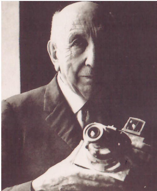
Figura 2. José Ortiz Echagüe. Autorretrato.