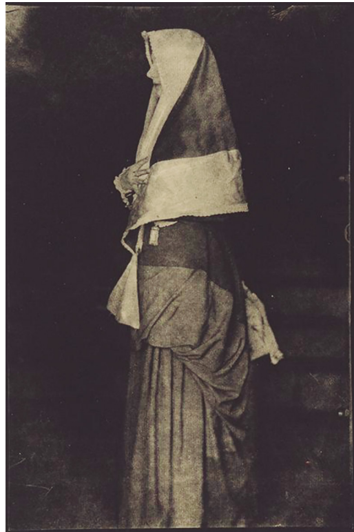
Figura 3. José Ortiz Echagüe. Roncalesa . Carbón directo sobre papel fresón. 1916-1930.

la que se analizaba su vida y obra dentro del contexto fotográfico y artístico español, estudiando también sus vínculos con la fotografía internacional.