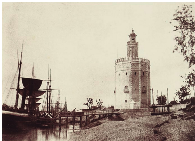
Figura 4. Louis de Clercq. Seville. La tour de l'Or . 1859.