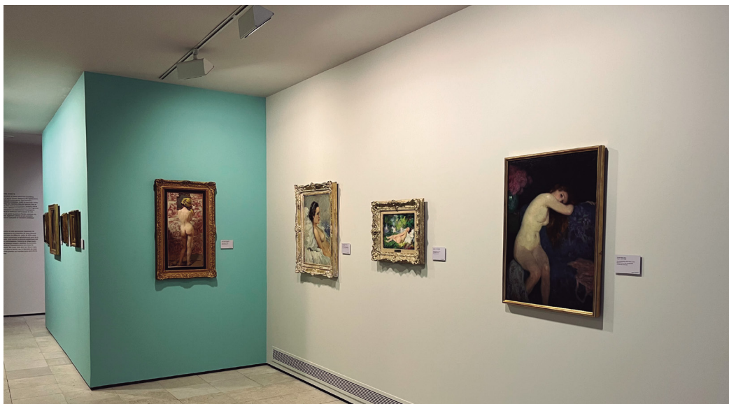
Figura 8. Fotografía de la sala «Desnudos».