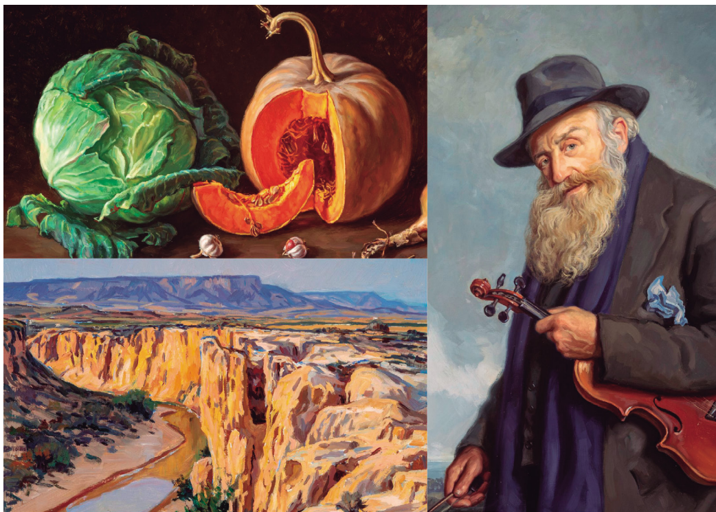
Figura 11. Detalles de obras de la sala.