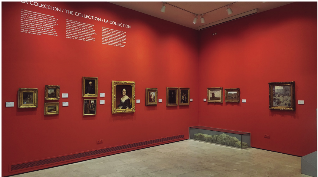
Figura 4. Fotografía planta baja.

Comienza la visita al MMSAM en la planta baja, donde está su entrada, y se visualiza lo que va a ser el contenido museístico: esa variada colección de pintura de la segunda mitad del siglo XIX, de diferentes artistas y tendencias. Románticos retratos, paisajes modernos y rupturistas de la pintura más académica, neoclasicismo comparado con pinceladas sueltas propias de movimientos cercanos a la vanguardia, sin llegar nunca a ella. Personajes de diversos extractos sociales miran a la persona visitante que, inertes en el tiempo transmiten su mundo y ese tiempo en el que fueron retratados.