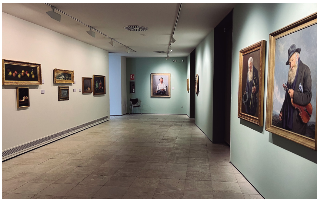
Figura 10. Fotografía de la sala «César Muñoz Sola».

La pareja de retratos «Músico ambulante» y «Músico mendicante» son una buena representación de la maestría de César Muñoz Sola a la hora de captar la esencia de la persona retratada, que trasciende sobre lo físico.