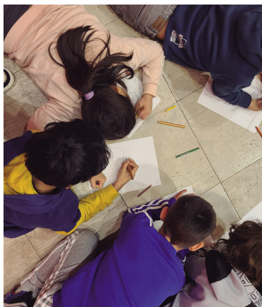
Figuras 12 y 13. Visitas guiadas y actividades pedagógicas con alumnado escolar.

El papel del museo en la vida cultural de la ciudad es esencial y ayuda a democratizar el acceso a la cultura, concepto interesante, que lleva inherentes temas como la innovación, flexibilidad, participación, la accesibilidad, sostenibilidad y la inclusión.