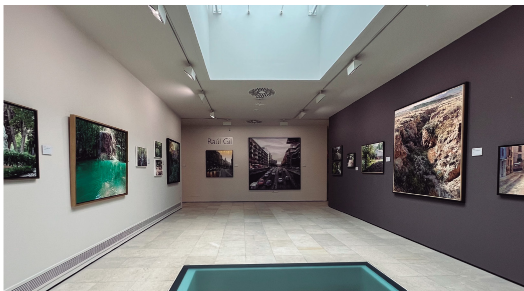
Figura 9. Fotografía la sala de exposiciones temporales.

La pareja de retratos «Músico ambulante» y «Músico mendicante» son una buena representación de la maestría de César Muñoz Sola a la hora de captar la esencia de la persona retratada, que trasciende sobre lo físico.