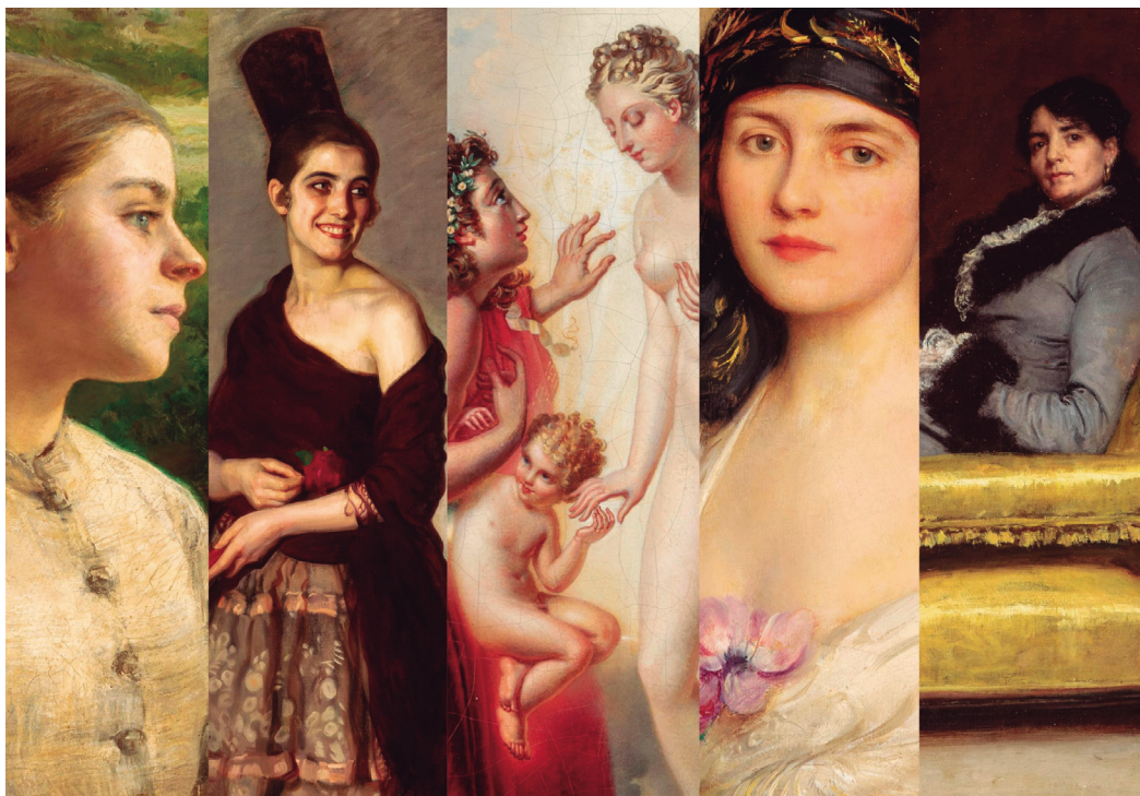
Figura 14. Detalles de mirada de la colección.