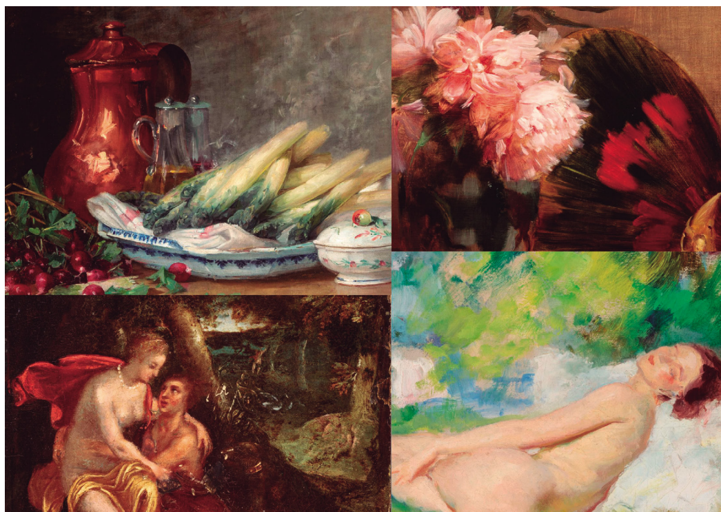
Figura 7. Detalles de obras de la sala.

Dentro del género, la pintura de flores constituye una especialidad ampliamente cultivada y su carácter decorativo se superpone al inicial carácter mimético.