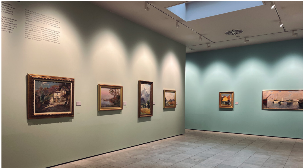
Figura 5. Fotografía de la sala paisajes.

Unos de los autores favoritos de César Muñoz Sola, era el pintor francés Alexandre Nozal (1825-1929), de quien se exponen en esta sala tres paisajes, inspirados en espacios campestres y entornos rurales cercanos al artista, en los que capta la luz y la atmósfera con estilo realista y dotados de gran detalle y emoción.