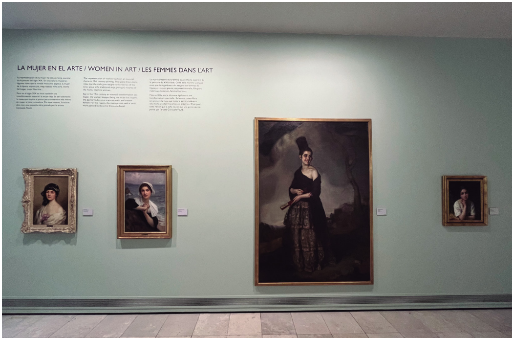
Figura 6. Fotografía de la sala «La mujer en el arte».

Esta sala, presidida por una pequeña obra pintada por la artista francesa Consuelo Fould (1862-1927), destacada pintora de su época, no solo aparece la mujer que inspira al maestro. El discurso museográfico se centra un entorno donde la mujer es la protagonista de esa historia olvidada.