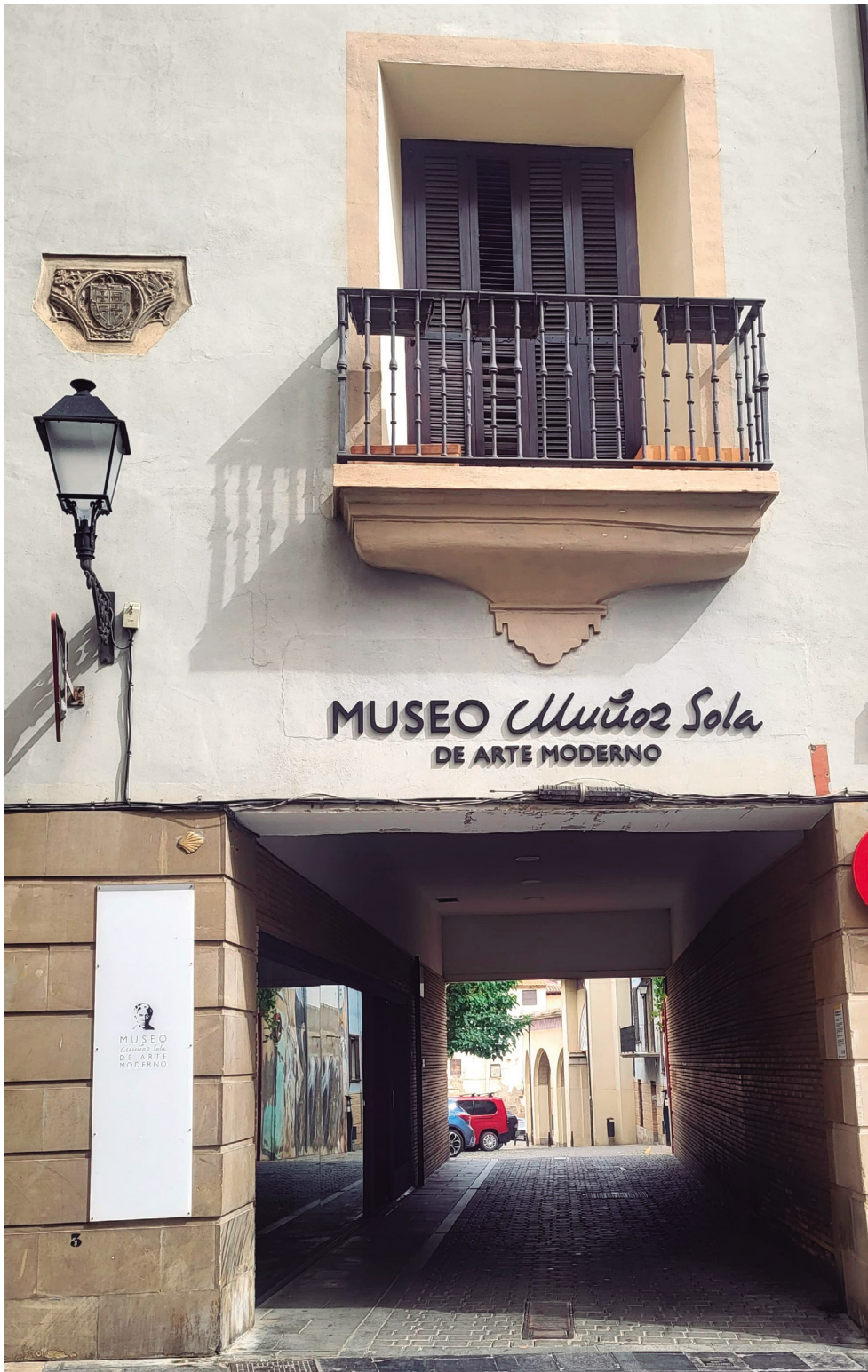
Figura 1. Fachada del MMSAM en la Plaza Vieja.