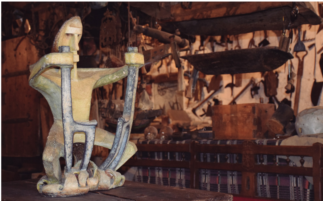
Figura 4. Interior del Museo Etnográfico del Reino de Pamplona. Autora Elur Ulibarrena Herce.