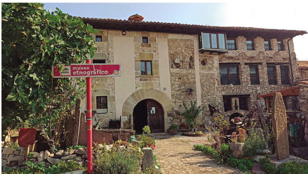
Figura 5. Casa Fantikorena, sede del Museo Etnográfico del Reino Pamplona. Autora Elur Ulibarrena Herce.

Es un caserío tradicional construido en 1641, de 200 m 2 de planta. Está formado por planta baja más dos alturas y conserva su nombre original, inicialmente documentado como Juantikorena, y que posteriormente derivó a Fantikorena.