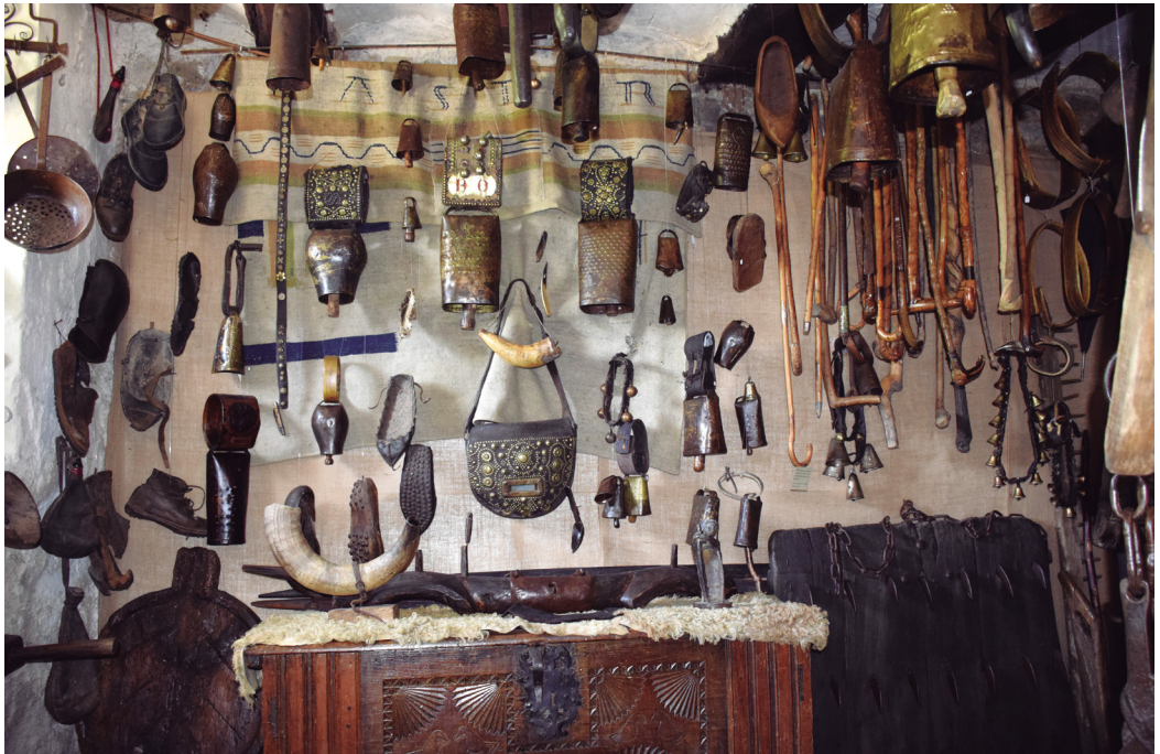
Figura 8. Exposición permanente del Museo Etnográfico del Reino de Pamplona. Autora Elur Ulibarrena Herce.