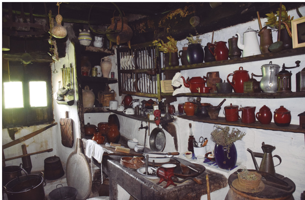
Figura 9. Exposición permanente. Cocina del siglo XVII. Autora Elur Ulibarrena Herce.

consumidor. Se abordan temas de actualidad como la soberanía alimentaria, el uso de transgénicos, la producción ecológica, el consumo de productos locales y se pretende sensibilizar hacia cuestiones relacionadas con la sostenibilidad y el consumo responsable que respondan a la tercera cuestión (hacia dónde vamos).