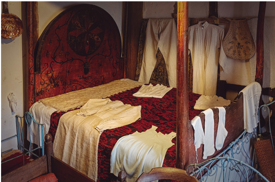
Figura 6. Exposición permanente. Habitación principal.