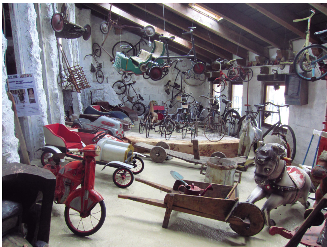
Figura 10. Exposición permanente. Sala de Juegos y Juguetes. Autora Elur Ulibarrena Herce.

En la sala de las ciencias surgen temas de actualidad (hacia dónde vamos) como el negocio de la industria farmacéutica, el uso de animales para la realización de pruebas en laboratorios, la ética de los sistemas de reproducción asistida, las pandemias etc. En la siguiente sala (ocio) el tema más recurrente es el de las nuevas tecnologías, la dependencia que nos generan y cómo han cambiado nuestras vidas en las últimas décadas.