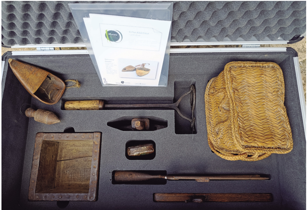
Figura 12. Caja didáctica de los oficios. Museo Itinerante. Autora Elur Ulibarrena Herce.

Las principales bases pedagógicas del proyecto, centradas en el potencial educativo de los objetos para el aprendizaje del pasado son (Museo Etnográfico del Reino de Pamplona, 2024):