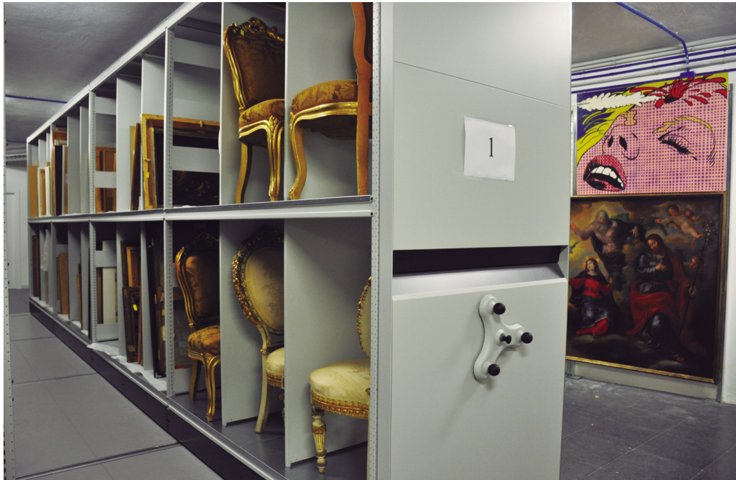
Figura 10. Nuevo mobiliario de almacenaje en almacén sótano (2018).