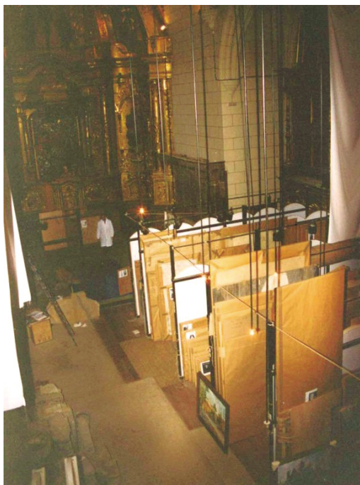
Figura 8. Almacenamiento provisional de obras en la Capilla (1985-1994).