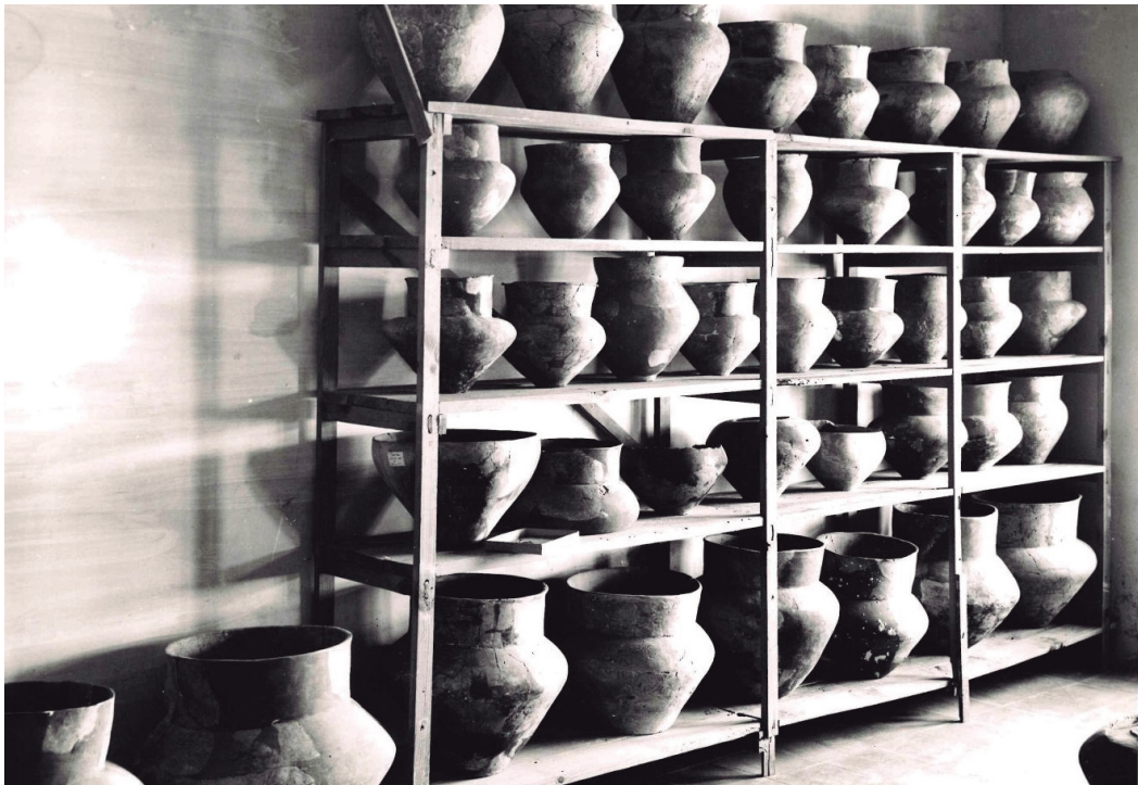
Figura 7. Almacén situado en la cuarta planta antes de la reforma.

Los llamados espacios de reserva, esto es, donde se almacenan los bienes culturales que no están expuestos en las salas de los museos, son también una parte fundamental para garantizar otra de sus funciones primordiales: la conservación. La existencia y transformación de estos espacios en el Museo de Navarra va de la mano de la evolución que ha sufrido tanto el propio edificio como la estructura departamental en la que se inserta la institución. Como edificio que se ha adecuando para otros usos distintos a los que tenían lugar en su función original como hospital, no ha podido tener una estrategia de almacenamiento planificada de partida. Además, la particularidad de ser un edificio histórico y con limitaciones en sus intervenciones arquitectónicas, hace del diseño de estos espacios algo aún más complejo. Los almacenes, como la colección, también han ido creciendo y han tenido que aprovechar cualquier espacio considerado adecuado para albergar piezas, siempre garantizando que estén en las mejores condiciones posibles.