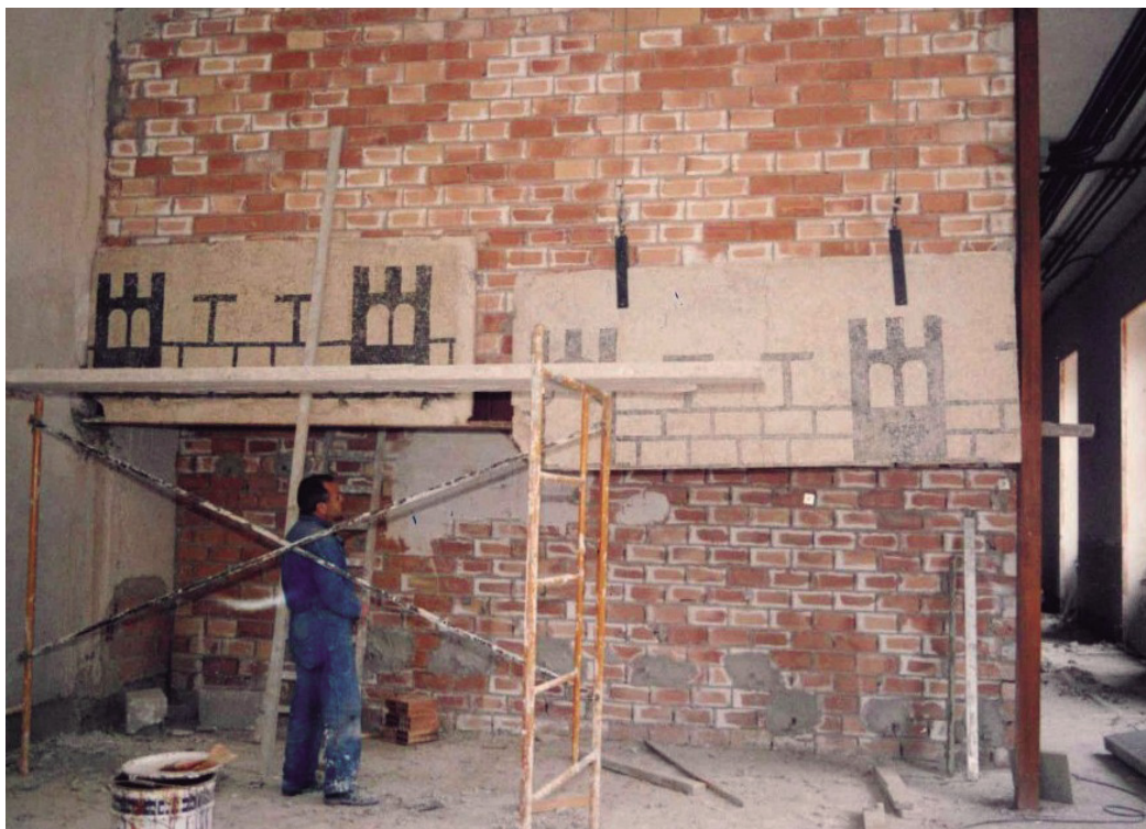
Figura 2. Colocación del mosaico durante las obras de reforma 1986-1990.