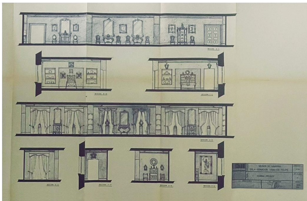
Figura 3. Plano de alzados para el proyecto de las salas Legado Felipe.

En 1978 ingresa en el Museo un conjunto de 309 bienes conocidos como el Legado Felipe (Diputación Foral de Navarra, 1978) 9 . La documentación lo describe como diversos objetos consistentes en: cuadros, porcelana y bandejas de plata, así como «los demás objetos que por su contenido artístico sean adecuados para el museo» (Diputación Foral de Navarra, 1978).