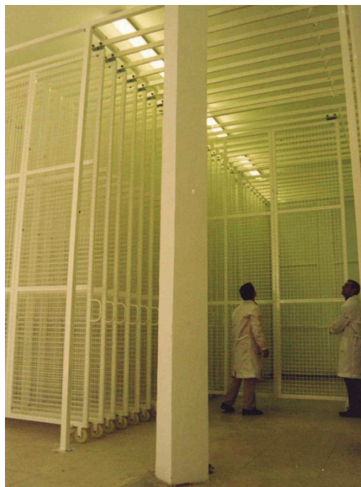
Figura 9. Instalación de los peines en el nuevo espacio de almacenamiento (1994).

Otra fecha importante fue cuando en 2017 salieron los últimos elementos pétreos que se almacenaban en el sótano y que, como ya se ha comentado, desde 2003 a efectos administrativos correspondía al Servicio de Patrimonio Histórico su gestión, por lo que se trasladaron al almacén de Fondos de Arqueología del Gobierno de Navarra (Museo de Navarra, 2017). Esto liberó una parte importante de ese espacio, que además estaba ocupado con muchos elementos museográficos, con publicaciones descatalogadas y otros artículos en desuso, que también fueron retirados en ese momento. Fue la oportunidad para hacer un nuevo proyecto de almacenaje. Se dotó de un mobiliario específico para el almacenamiento de bienes culturales (compactos, estanterías, rejillas y planeros) y, aprovechando los trabajos de digitalización de la colección que implicaban movimiento de piezas para su fotografiado, toma de datos y revisión del estado de conservación, se hizo una reordenación de piezas que estaban en otros espacios para agruparlas según su naturaleza física o necesidades de conservación. Una de las decisiones que se tomaron pensando en la mejora de las piezas y que se fue extendiendo al resto de almacenes fue el evitar, en la medida de lo posible, que las obras permanecieran embaladas, para poder así facilitar las revisiones oculares que se hacen periódicamente dentro de las tareas correspondientes a la conservación preventiva.