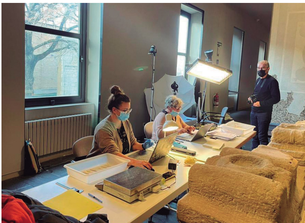
Figura 6. Trabajos de digitalización de las piezas de época romana en 2021.

En 2022 se finalizaron los trabajos de fondos correspondientes a las piezas de épocas prehistóricas y romana que habían comenzado en 2021 con dos contratos de asistencia técnica a especialistas en la materia.