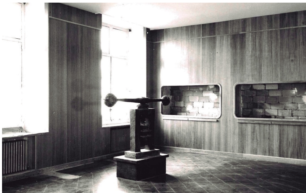
Figura 4. Prensa de volante durante el montaje de la sala de numismática en 1975.

El origen de la colección numismática también está en la actividad desarrollada por la Comisión de Monumentos Históricos y Artísticos de Navarra. Aunque no se sabe la relación detallada, se conoce la existencia de una sección dedicada a la moneda en el Museo Artístico-Arqueológico que se instaló en la Cámara de Comptos. También se sabe que piezas emblemáticas como la prensa de volante procedente de la Ceca de Pamplona, o varios de los excepcionales útiles de acuñación que se conservan ya estaban en posesión de la Comisión desde el siglo XIX (Tabar, 2001).