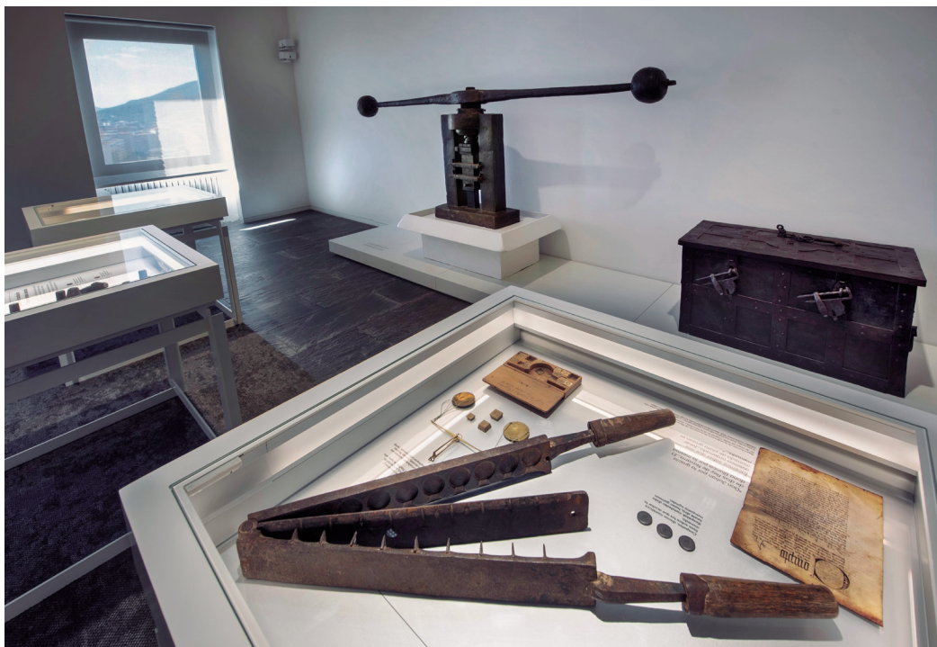
Figura 5. Prensa de volante en la actual sala de La moneda en Navarra.

Desde esos orígenes, los fondos han ido aumentando, hasta llegar a las más de 15.000 piezas que se conservan en la actualidad, abarcando una cronología que va desde la Edad del Hierro hasta la incorporación del euro. Sin embargo, lo que la define y la hace excepcional, es contar con una colección de moneda acuñada por el Reino de Navarra y, como algo casi único en el mundo, los troqueles o cuños que se utilizaron para su acuñación.