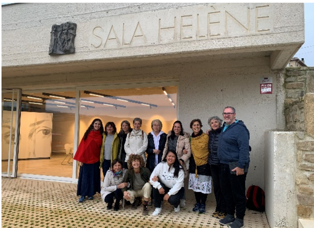
Figura 6. Sala Helène.

con atención a grupos diversos con actividades vinculadas al Centro Henri Lenaerts, y a la oferta de iniciativas culturales del Valle de Guesálaz.