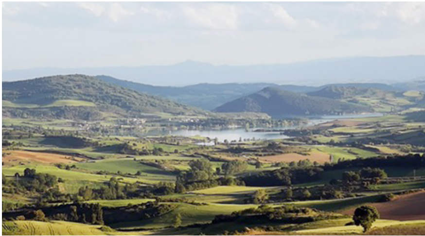
Figura 2. Valle de Guesálaz (Asociación Betilore).