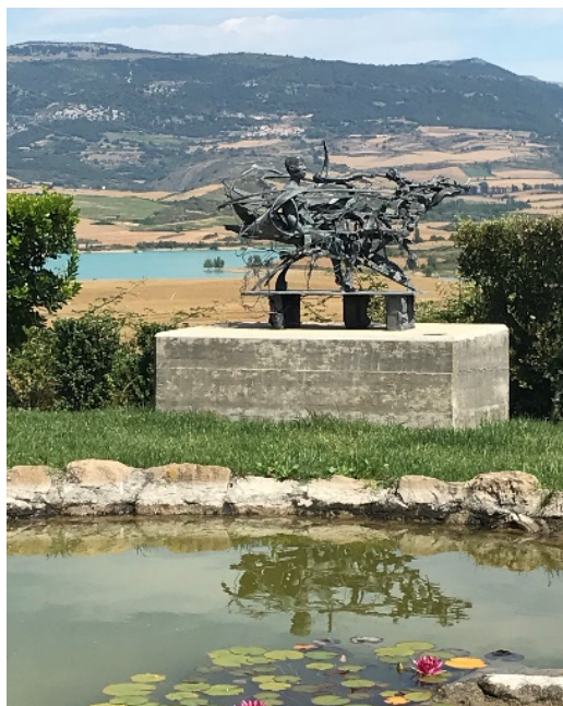
Figura 4. Siglo XX.

Forma parte de una serie de dibujos, tapices y piezas más pequeñas. En esta escultura el ser humano se encuentra enredado en una maraña que, como resultado de los tiempos acelerados en los que vive, le va confundiendo. La rapidez de los acontecimientos le dificulta para tener ritmos y espacios para la atención y el cuidado, y esto supone fragmentación y ruptura, problemas físicos y mentales que generan sufrimiento. Al hombre de siglo XX le falta parte del cerebro, de los ojos y del corazón. Situada en el Jardín bajo, ofrece la posibilidad de conectar los flujos de datos, las redes líquidas de comunicación, y