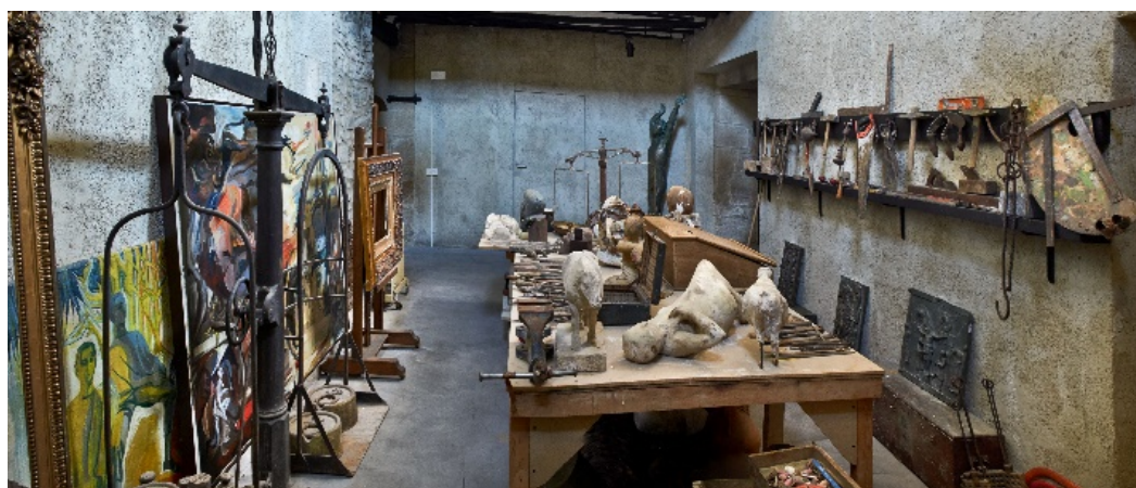
Figura 5. Taller de Henri Lenaerts.

La espiritualidad 16 en estos espacios no es dogmática ni institucional, no se refiere a las creencias o a la moral: es una búsqueda libre, experimental, profundamente corporal, sensorial y terrenal. Lenaerts, trabajaba en su taller (fig. 5), practicaba yoga y meditación diariamente en su habitación donde encontramos miniaturas indias, acuarelas, objetos rituales, libros y dos autorretratos de Helène Derèe.