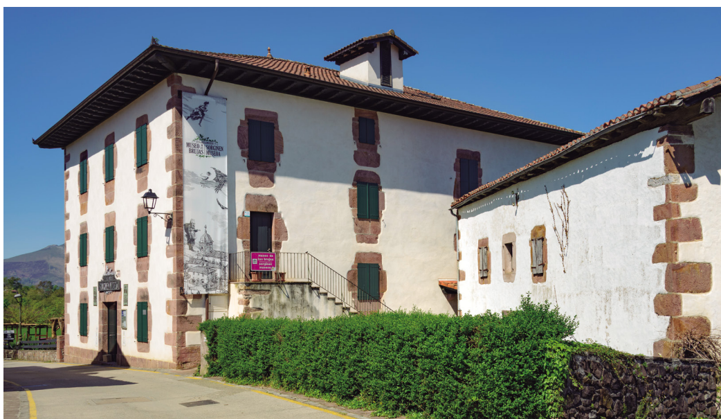
Figura 1. Imagen exterior del Museo de las Brujas de Zugarramurdi. En las placas de la fachada puede leerse: «Logroño y Zugarramurdi celebran su reencuentro en paz y democracia cuatrocientos años después del Auto de Fe Inquisitorial contra las brujas de Zugarramurdi que tuvo lugar en Logroño. Zugarramurdi, 27 de marzo de 2010».

El Museo se inauguró el 20 de julio de 2007 colocando un Eguzkilore en la puerta, un tradicional elemento protector cargado de simbolismo. Ese día se estrenaba una instalación museográfica desde el convencimiento de que el interés general iba a trascender la mera exposición permanente y conscientes del esfuerzo que requeriría la creación de iniciativas que dinamizaran el museo, que le dieran vida .