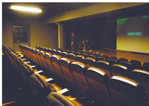
Figuras 2 y 3. Mostrador de atención y auditorio en la planta baja.