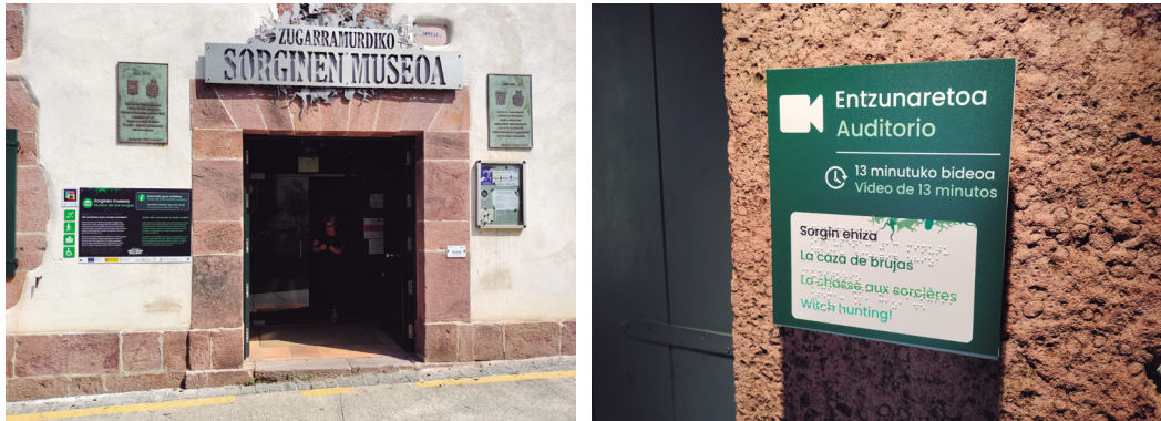
Figuras 8 y 9. Imágenes que muestran la nueva cartelería accesible instalada.

Con la mirada puesta en el futuro, la accesibilidad universal es uno de nuestros principales objetivos tanto en el diseño de materiales, como en las visitas o en la información que proporcionamos. Para la fecha en que este artículo vea la luz, habremos culminado ya la transformación de la oficina de turismo, ofreciendo un entorno adaptado en el acceso al Museo también.