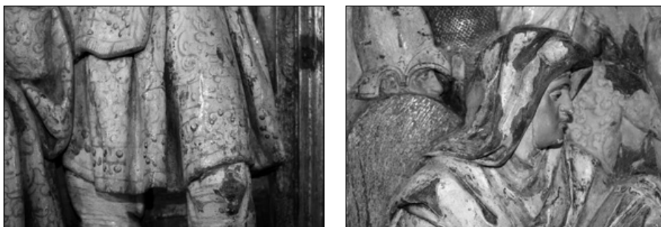
Figuras 4 y 5. Detalles de la policromía del retablo de Itsasondo.

con imitaciones de piedras contrahechas y perlas. Las columnas ornamentan sus capiteles en rojo y azul con escamados y estofados y, tras ellas, subientes de cogollos trepan ocupando todo el espacio disponible tras las columnas. Los fondos de las cajas se cubren con arabescos y follajes vegetales a los lados, dejando sin policromar la sombra de las imágenes, ya que al ser un lugar que quedaba oculto tras la talla no era habitual su ejecución. En arquitrabes, frisos y otros espacios de buenas dimensiones se emplean roleos vegetales flanqueando cartelas correiformes. Hay que destacar en toda la decoración vegetal la ausencia de niños y pájaros que jueguen entre las ramas, habituales en estas fechas y que conforman lo que conocemos como «papeles de todas colores» o brutescos.