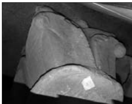
Figura 15. Capitel procedente de San Nicolás de Sangüesa. Museo de Navarra, Pamplona, n.º inv. 28.

los depósitos del Museo de Navarra se conserva un capitel de grandes dimensiones (n.º inv. 28; fig. 15), que probablemente rematará una columna adosada a un pilar interior, el cual se cree procedente de la propia iglesia de San Nicolás de Sangüesa. Este capitel presenta una decoración vegetal muy esquemática a base de grandes hojas en las esquinas de las que cuelgan unas bolas y que recuerda fuertemente el tipo de hoja que utiliza el tercer taller de Echano, sobre todo la representada en el lado oriental del capitel C12 (fig. 14