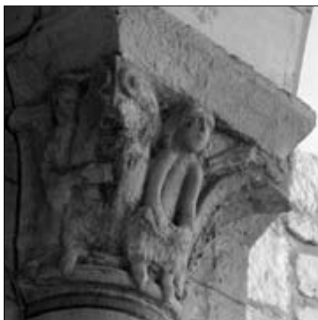
Figura 20. Capitel sur del arco triunfal de Saint-Aubin.

(figs. 14 y 20). En los tres lugares, la cesta que les acompaña presenta a un individuo sentado en la cara principal con las manos colocadas de forma muy rígida sobre el regazo, flanqueado por dos gruesas hojas bajo unos caulículos que acaban en volutas en las esquinas del capitel, y con sendos individuos en los laterales que señalan con la mano extendida hacia el personaje central.