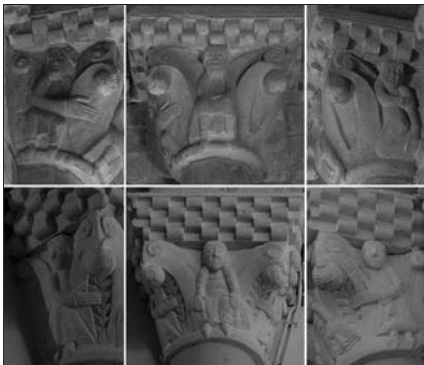
Figura 14. Comparación del capitel norte del arco fajón occidental de Echano (C12) (arriba) con capitel norte del arco triunfal del ábside sur Sarbazan (abajo).