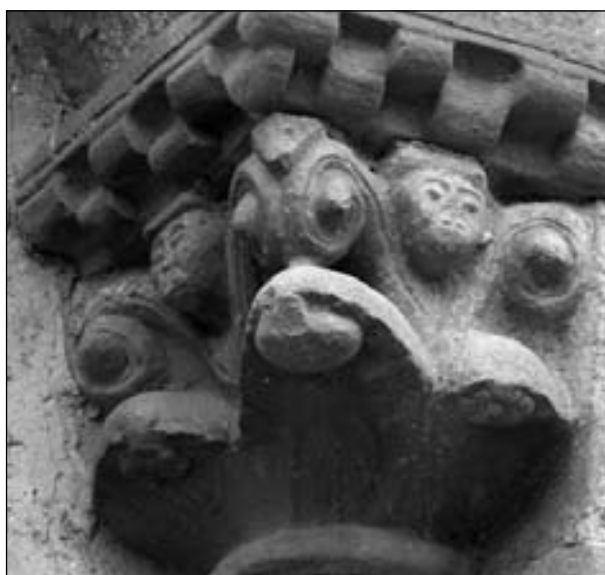
Figura 5. Capitel de la ventana sur del ábside de Echano (C2).

Sin abandonar este análisis meramente formal, de cara a poder elaborar una hipótesis sobre las fases constructivas del edificio, resulta esencial plantearse a qué taller pertenecen los capiteles de las ventanas del ábside y si todos los canecillos del ábside y el muro norte fueron ejecutados por el mismo grupo de artistas.