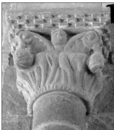
Figura 3. Capitel del lado norte del arco triunfal de Echano (C8).