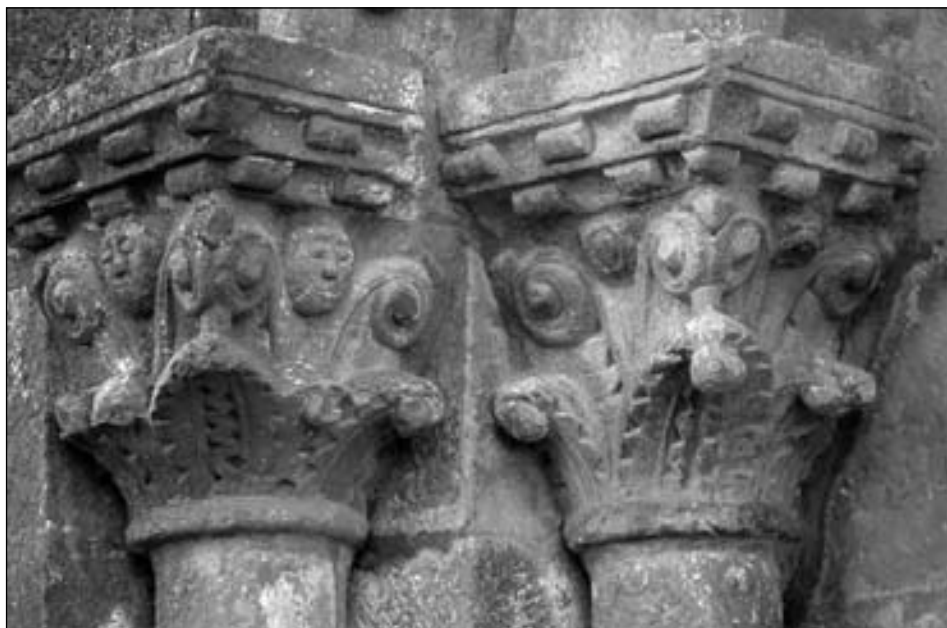
Figura 7. Capiteles del lado este de la portada de Olleta.

Martín de Orísoain 12 . Su grado de afinidad estilística y compositiva es tal que no resulta arriesgado hablar de un taller o círculo estilístico local, propio de la Valdorba. La iglesia de Santo Cristo de Cataláin también cuenta en su interior, concretamente en el lado norte del arco triunfal, con un capitel vegetal que presenta unas características similares, pero su labra, bastante más fina, parece denotar la mano de un artífice diferente, más dotado. Todas estas piezas presentan, al igual que en Echano, el pequeño vástago que une los caulículos con la parte superior del nivel inferior, así como hojas con bordes dentados. El uso de un cilindro para conectar los dos niveles de vegetación no es una solución autóctona de la Valdorba, pues se puede apreciar, por ejemplo, en el capitel de las águilas, atribuido al denominado de forma genérica «taller del maestro Esteban» 13 , procedente de la portada occidental de la catedral de Pamplona (Museo de Navarra, n.º inv. MN 4275) (fig. 8), y en capiteles de la portada oeste de San Saturnino de Tolosa (fig. 9), de la girola de la catedral de Santiago de Compostela (fig. 10) y del interior de San Isidoro de León. Martínez de Aguirre ha señalado como este vástago fue copiado en las iglesias de la Valdorba, y cita en concreto Echano y Cataláin 14 . Martínez Álava indica que