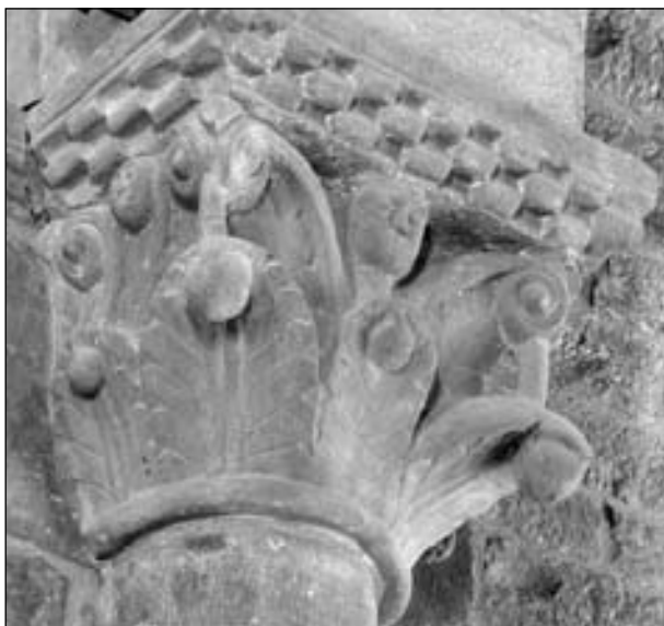
Figura 6. Capitel sur del arco triunfal de Echano (C7).

parten cabeza y que muestran sus fauces 10 . Las fieras de la cara central están colocadas de forma simétrica, de pie con sus cuartos traseros en el centro de la cesta y sus cabezas en las esquinas. Tienen alargadas patas que se apoyan en el astrágalo y sus colas, como suele ser habitual en la representación de este tipo de felinos en el románico, pasan entre sus patas traseras para elevarse por delante de la parte posterior de su cuerpo. Sendos rostros humanos, muy esquemáticos, se disponen en cada una de sus caras, entre los caulículos que decoran la parte superior. Parece que esta pieza se podría inspirar en modelos tolosanos presentes en la catedral de Pamplona, de la cual se conserva en los depósitos del Museo de Navarra un capitel con leones (n.º inv. 56) que, con la excepción de los rostros humanos, presenta claros paralelismos con la cesta de Echano.