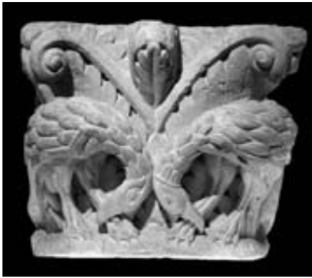
Figura 8. Capitel procedente de la portada occidental de la catedral románica de Pamplona (Museo de Navarra, Pamplona).