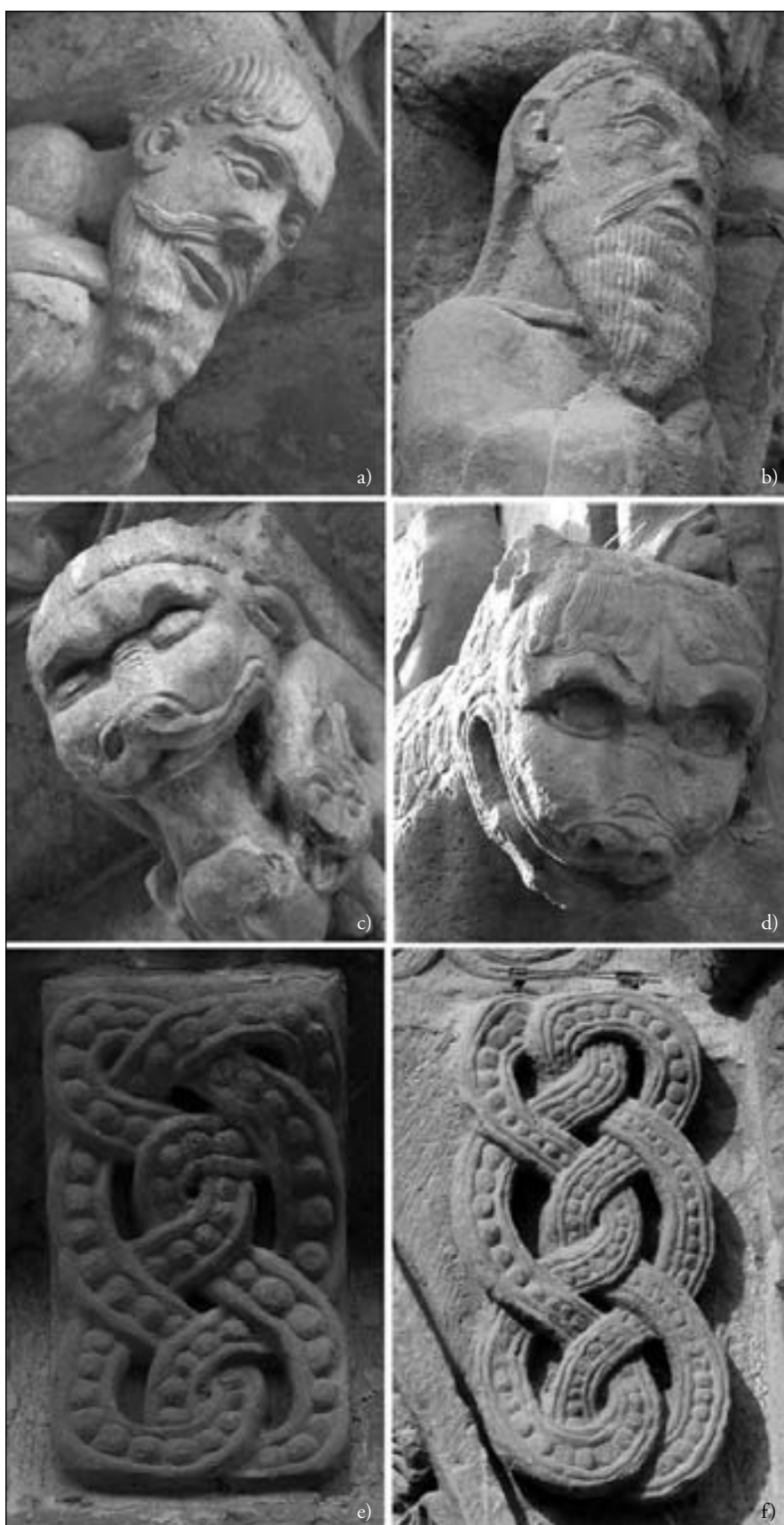
Figura 2. Comparación de canchillos de Echano (a, c y e) con piezas de la portada de Sangüesa (b, d y f).