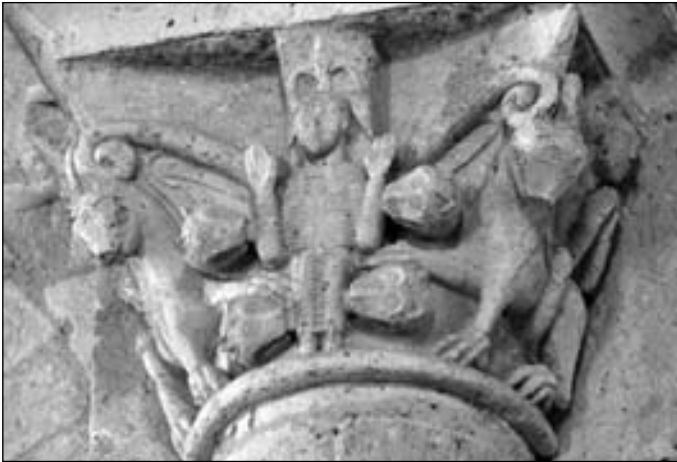
Figura 21. Capitel con Daniel en el foso de los leones en Santa María de Moirax.

do esta posibilidad nos movemos exclusivamente en el peligroso y arriesgado terreno de la elucubración.