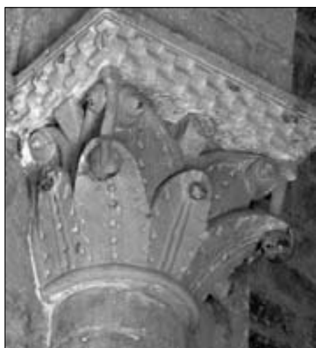
Figura 11. Capitel norte del arco fajón oriental de Echano (C10).

San Saturnino de Tolosa (tribuna y deambulatorio), Santa Fe de Conques, San Miguel de Hildesheim (Alemania), Germigny-L'Exempt (Cher), Tolva (Huesca), San Esteban de las Dorigas (Asturias), varios edificios de los condados catalanes –donde es especialmente frecuente–, como la seo de Urgel (claustro y portadas de acceso a este y norte), Santa María de Covet (portada e interior), San Saturnino de Tavèrnoles, San Martín Sarroca o el palacio episcopal de Barcelona, sin olvidar algunos ejemplos navarros, como la portada de la Magdalena de Tudela o los muy cercanos capiteles de la portada de la iglesia de Santiago de