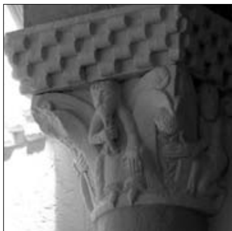
Figura 17. Capitel sur del arco triunfal del ábside sur de Sarbazan.