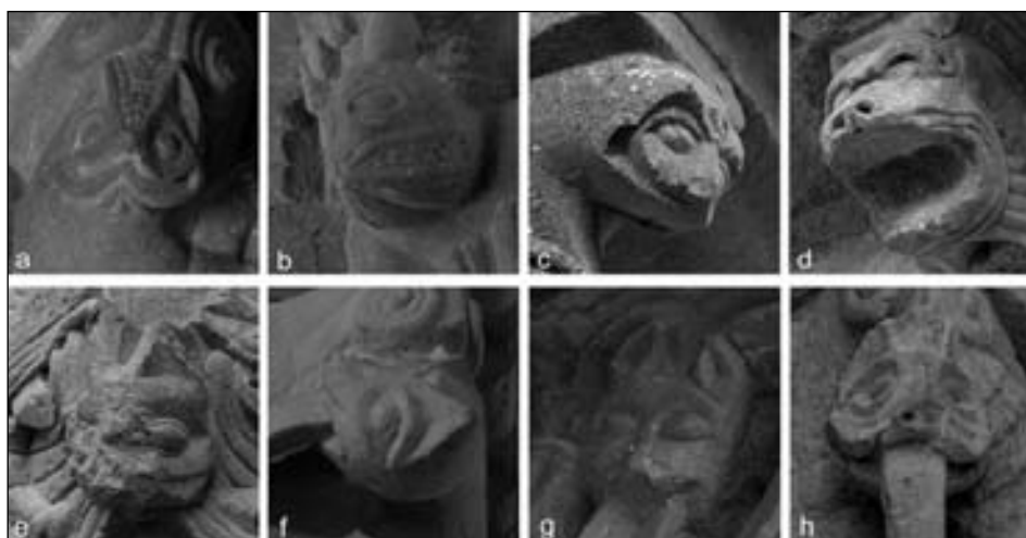
Figura 4. Comparación de las cabezas de leones: a. Capitel arco fajón occidental de Echano (C11). b. Capitel arco triunfal de Echano (C8). c. Canecillo sobre la portada de Echano (38). d. Canecillo muro norte de Echano (26). e. Capitel portada de Echano (C14), f. Capitel de Sarbazan. g. Canecillo ábside de Echano (L1). h. Capitel de Saint-Aubin.

ejecutados por el mismo taller que trabajó en la portada y en los canecillos de su tejazoz queda confirmada por la simple comparación de la figura 4a con las 4c y 4e. Del resto de estilemas que tienen en común ambos ámbitos hablaremos más adelante.