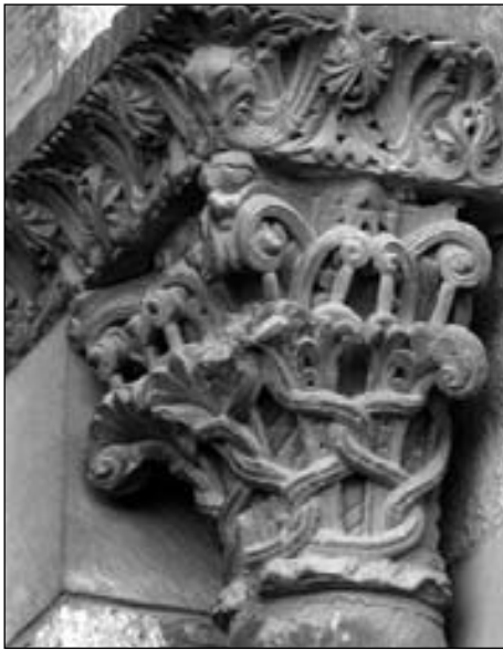
Figura 9. Capitel de la portada oeste de San Saturnino de Tolosa.