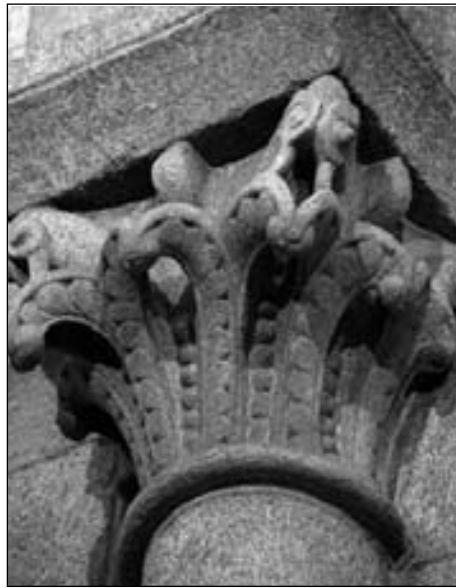
Figura 10. Capitel de la girola de la catedral de Santiago de Compostela.

este elemento está también presente en los capiteles de Olleta y hace extensiva a ellos la vinculación con la seo pamplonesa 15 . Los capiteles C7, C9 y C10 del interior de Echano (figs. 6 y 11) presentan en el espacio comprendido entre los caulículos y la parte superior del registro vegetal inferior una decoración de hojas paralelas que también está presente en el capitel pamplonés de las águilas, lo cual refuerza la idea de que estamos ante una derivación de estilemas de origen tolosano que llegan a la Valdorba como consecuencia de la influencia que tiene en su entorno próximo el edificio más importante de la región, la catedral de Pamplona.