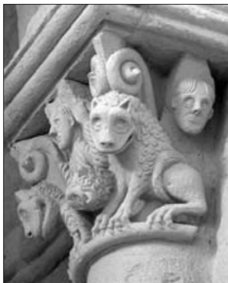
Figura 22. Capitel con Daniel en el foso de los leones en Saint-Pierre-aux-Liens en Engayrac. Figura 23. Capitel con Daniel en el foso de los leones en Cénac-et-Saint-Julien.