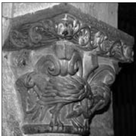
Figura 18. Capitel de la cripta de la iglesia de San Esteban de Sos del Rey Católico.

principal y uno en el capitel C16). En las caras laterales sendos individuos señalan con sus desproporcionadas manos, como en el capitel del arco triunfal, al personaje central. Lo curioso es que uno de ellos, como en la iglesia navarra, también está arrodillado y cogiéndose la pierna con una mano. No faltan en esta pieza otros elementos que ya hemos comentado, como la bola decorada colgando de las hojas o la particular estructura de estas.