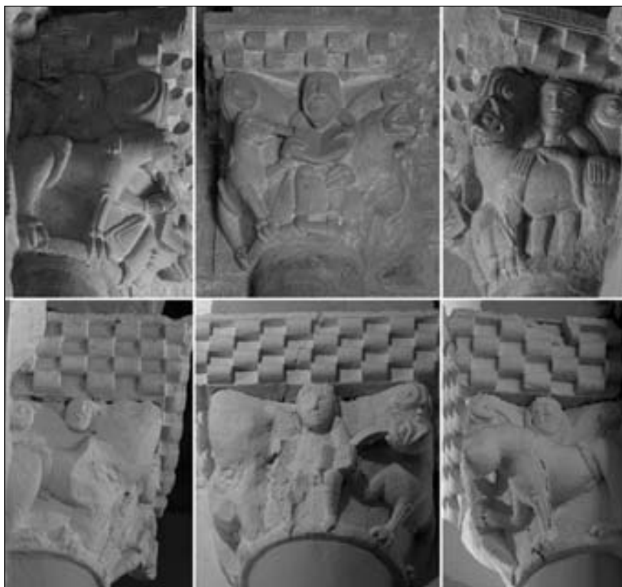
Figura 13. Comparación del capitel sur del arco fajón occidental de Echano (C11) (arriba) con capitel de Sarbazan (abajo). Daniel en el foso de los leones.