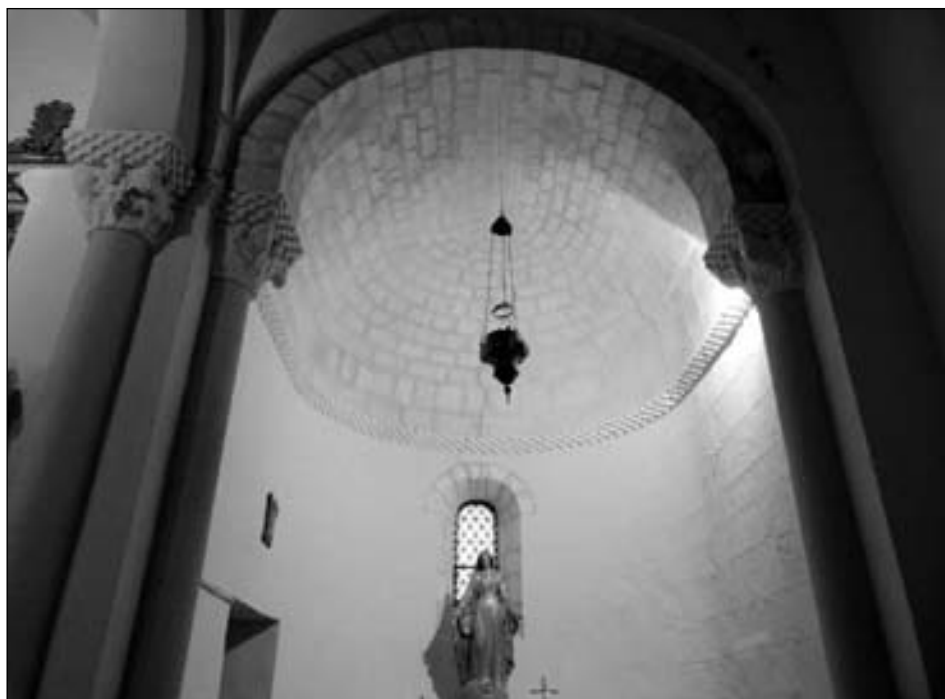
Figura 16. Interior del ábside sur de San Pedro de Sarbazan.

También el capitel norte del arco triunfal del ábside sur de Sarbazan (fig. 14 abajo) presenta una composición muy próxima a la del capitel septentrional del arco fajón occidental de Echano (C12). En el mismo un personaje imberbe, con flequillo, vestido con túnica larga y calzado, se encuentra sentado con sus manos apoyadas en las rodillas ocupando la cara principal de la pieza. En los laterales dos personajes de pie, también sin barba y con túnica larga, lo flanquean y señalan con sus desproporcionadas manos, en un gesto que recuerda mucho al individuo de la cara norte del capitel de Echano (ver comparación de ambas piezas en fig. 14). Asimismo, resulta llamativo que la singular ornamentación de las bolas de las esquinas del capitel C12 de Echano, de la que no hemos encontrado paralelos relevantes, se encuentre también en el capitel aquitano. Las hojas de las esquinas en el capitel de Sarbazan tienen una estructura formada por dos franjas verticales lisas que determinan un espacio central que queda cubierto por una planta de cuyo tallo salen de forma simétrica varias parejas de hojas. Esta es la misma configuración de las hojas del capitel C12 de Echano, con la diferencia de que en este la parte central está sin decorar. Se trataría de un nuevo indicio para suponer, como ya hemos propuesto, que la pieza navarra quedó inacabada.