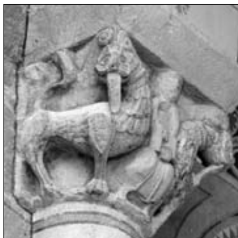
Figura 19. Capitel norte del arco triunfal de Saint-Aubin. Daniel en el foso de los leones.