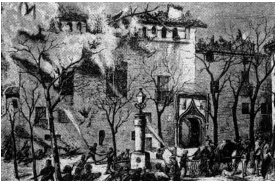
Figura 17. Incendio del Palacio de Mossen Sorrell en Valencia . Xilografía.