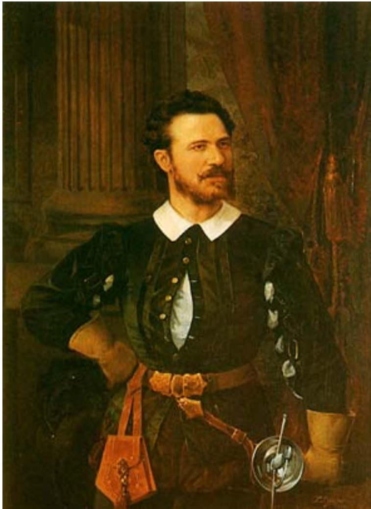
Figura 4. Retrato de Julián Gayarre (1883). Ayuntamiento de Pamplona.