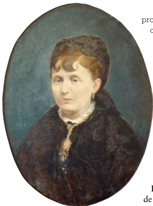
Figura 6. Retrato femenino . C. 1880. Óleo/lienzo. 63 x 46 cm.

propia de los cuadros de asunto religioso. Puede seguirse con facilidad el procedimiento utilizado por Asenjo para la plasmación del personaje, que no es otro que la utilización de una imagen previa del retratado, con toda probabilidad una fotografía, la misma que utilizó Arturo Carretero y Sánchez para el grabado aparecido en La Ilustración Española y Americana , en su número correspondiente al 15 de marzo de 1880 (Molins, 2009, pp. 653-681).