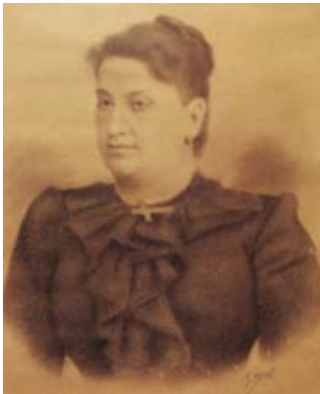
Figura 14. Dama . c. 1890. Carboncillo/papel. 70 x 50 cm.

La escena aparece bastante estática y con un colorido excesivamente apagado, pero no deja de recordar, siquiera lejanamente, las escenas de playa de los alumnos de Salustiano Asenjo, realizadas una generación posterior, como son las obras de Cecilio Plá o del gran Sorolla. El cuadro, en definitiva, resulta de gran interés histórico y estético. Además, esta obra conserva en el reverso un papel con una poesía dedicada al propietario del cuadro 16 .