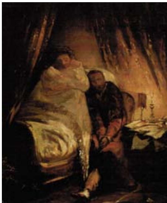
Figura 12. Noche en vela . Óleo/lienzo.

violinista en su casa de París en la cual se observa, al fondo y colgado en la pared, este cuadro de Asenjo (2009).