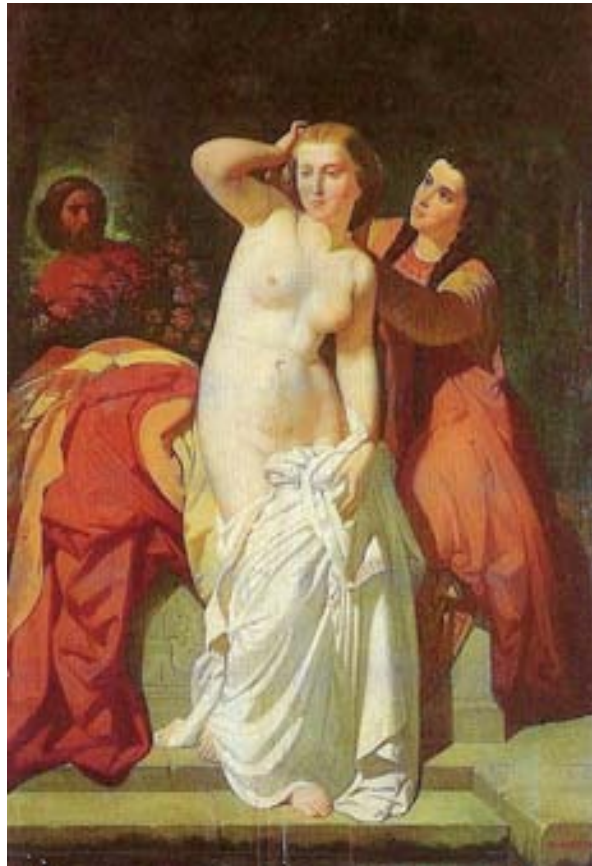
Figura 9. La Cava saliendo del baño . Óleo/lienzo. 131 x 89 cm.

del baño 9 (fig. 9), realizado en fecha indeterminada entre 1856 y 1876. Se trata de una copia de la obra de Isidoro Lozano 10 . Urricequi habla de ella así: