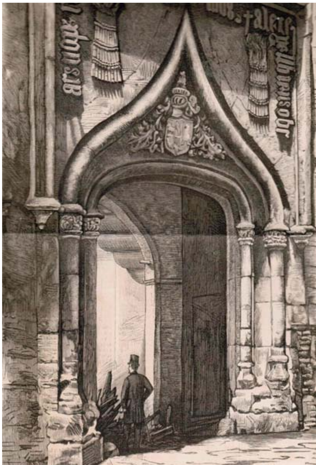
Figura 16. Ruinas del Palacio de Mossen Sorrell en Valencia, portada principal. Xilografía.