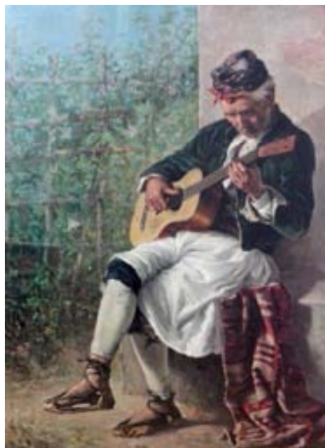
Figura 11. Campesino valenciano tocando la guitarra . 96 x 70 cm. Óleo/lienzo.