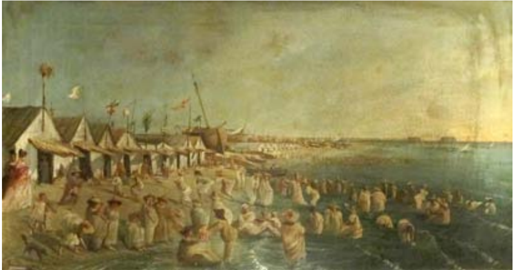
Figura 13. Escena de playa . Óleo/lienzo. 55 x 90 cm.