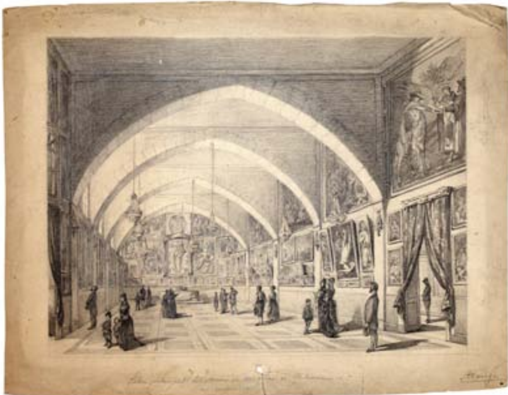
Figura 15. Salón Principal del Museo de pinturas de Valencia . 1880. Lápiz/papel.

plonesa ( Artistas navarros , 2014, n.º 15). Se trata de un dibujo al carbón, de dimensiones considerables, y que representa el retrato de una mujer de mediana edad, presentada de busto. Resulta una obra correcta y dentro de la estética decimonónica de la época.