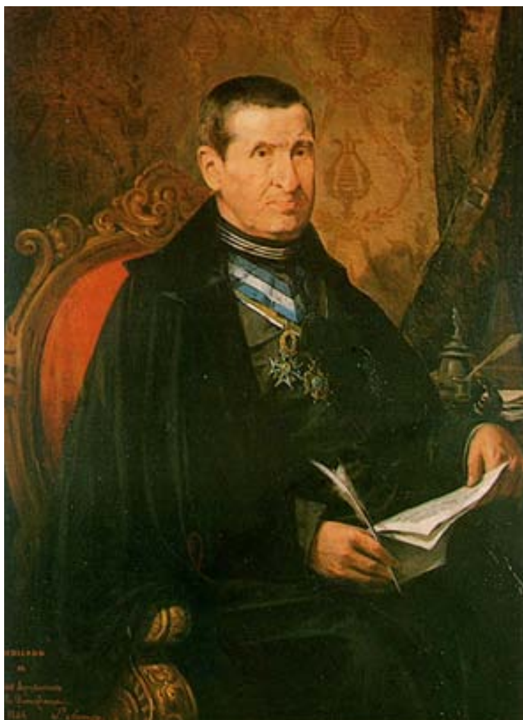
Figura 5. Retrato de Hilarión Eslava (1884). Ayuntamiento de Pamplona.

retratos de Pablo Sarasate y de Julián Gayarre (fig. 4), encargados al pintor en 1882 y fechados en 1883. El ayuntamiento pagó al autor por dichas obras la cantidad de diez mil pesetas (Urricelqui, 2007). De Pablo Sarasate existe otro retrato en el Conservatorio de Valencia, este representando al violinista de busto (Ruiz de la Cuesta, 12 de enero de 1992). El año siguiente, 1884, Salustiano Asenjo regaló como agradecimiento a la Corporación pamplonesa el retrato de Hilarión Eslava (Hernández, 1978, p. 113) (fig. 5). José Luis Molins enjuicia así el retrato de Sarasate: