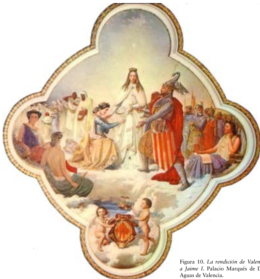
Figura 10. La rendición de Valencia a Jaime I . Palacio Marqués de Dos Aguas de Valencia.