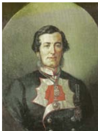
Figura 8. Retrato del Conde de Ripalda. Óleo/lienzo. 85 x 67 cm.