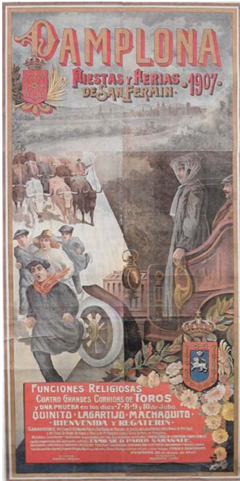
Figura 10. Cartel de San Fermín de 1907. Ayuntamiento de Pamplona.