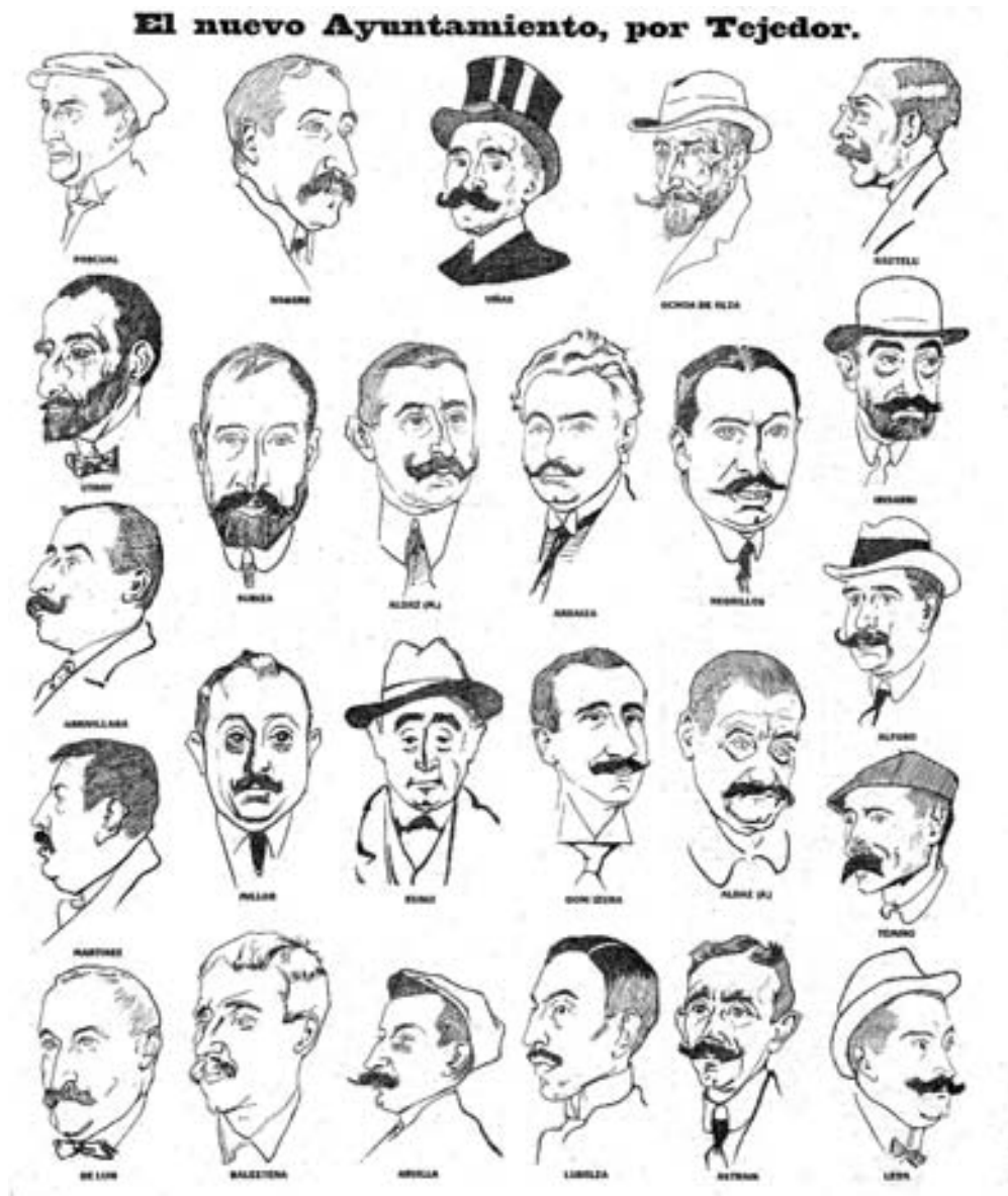
Figura 14. Nuevo Ayuntamiento de Pamplona. Portada Diario Navarra , 31/12/1911.

La temática (Muruzábal, 2016, p. 61) de los dibujos publicados en Diario de Navarra presenta un poco de todo, caricaturas, dibujos humorísticos, dibujos de mayor sentido estético, apuntes rápidos y sintéticos, etc. Podemos estructurar los siguientes apartados temáticos, de los que insertamos algún ejemplo destacado: