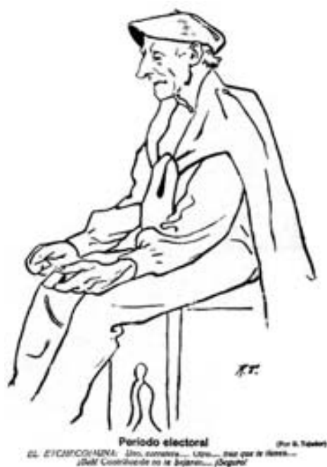
Figura 18. Período electoral. Diario de Navarra , 19/12/1920.

ahí puede verse los propios temas. Entendemos que la colección es digna de darse a conocer, marca un auténtico hito en la prensa navarra de dicha época y sirve para otorgarle al autor un lugar relevante entre los dibujantes e ilustradores navarros del siglo XX.