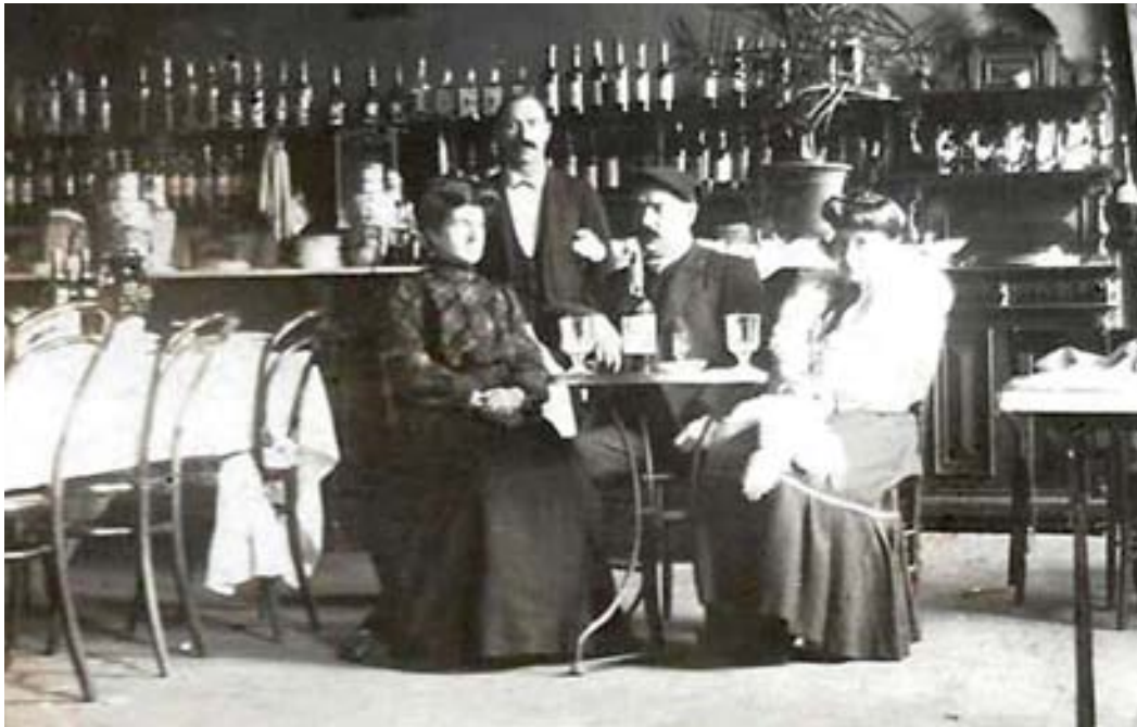
Figura 2. La fonda de la estación en los años veinte.

Por lo tanto, la familia estuvo unida a dicho negocio casi noventa años, con lo que se hizo muy popular y querida en Pamplona (fig. 2).