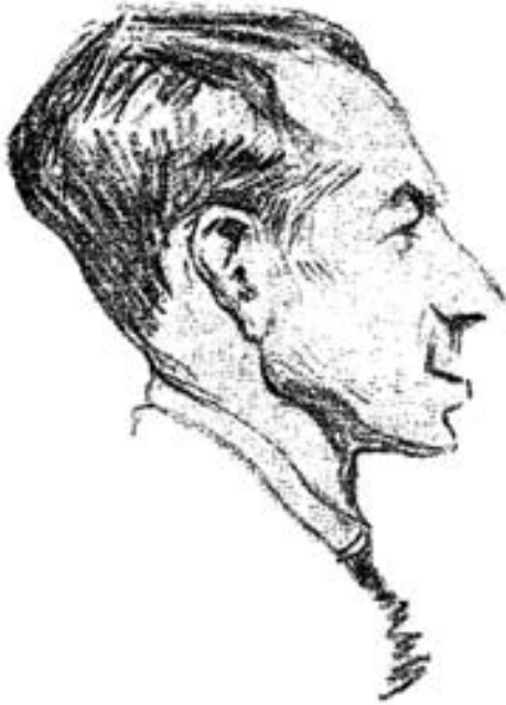
Retrato del pintor por R. Tejedor