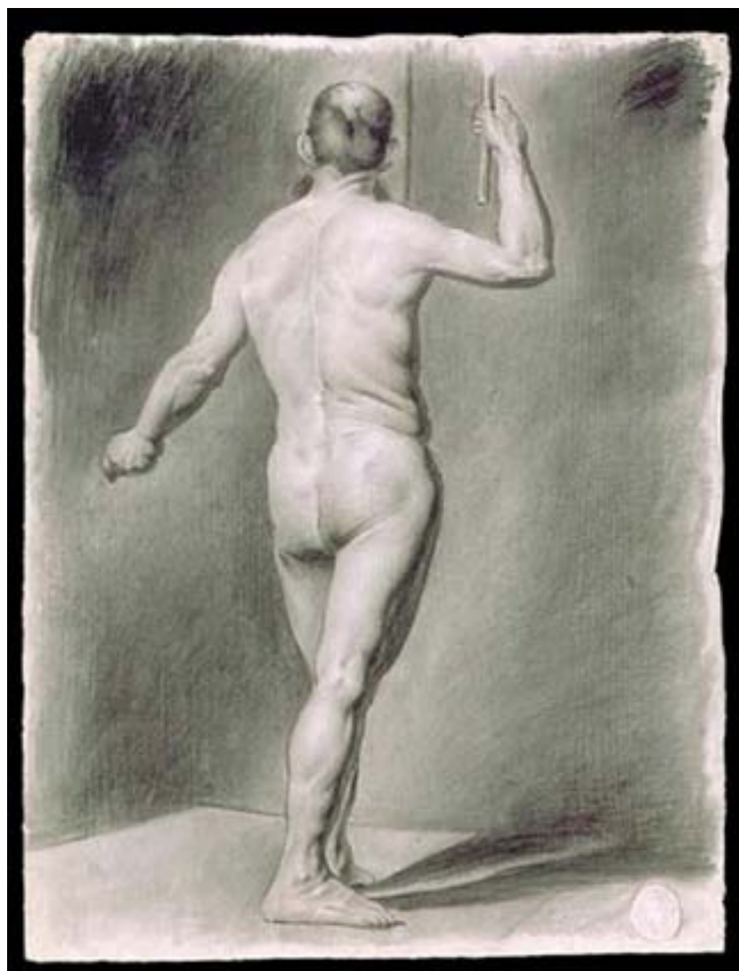
Figura 12. Academia . Carboncillo/papel, 63 x 48 cm. Universidad de Madrid.