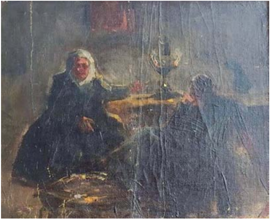
Figura 11. Abuelas en interior (1900-05). Óleo/tela, 20,5 x 25,5 cm. Colección particular.

sus características en un apartado anterior. Omitimos, por lo tanto, mayores referencias a dichas obras.