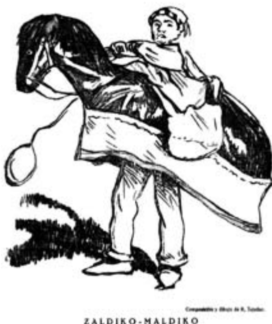
Figura 17. Zaldiko de San Fermín. Diario de Navarra , 08/07/1923.