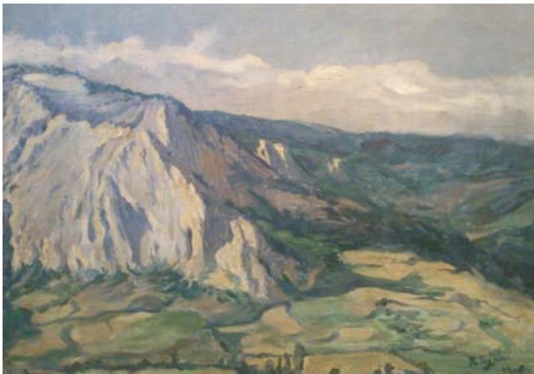
Figura 4. Monte Balerdi (1906). Óleo/lienzo, 40 x 55 cm. Colección particular.