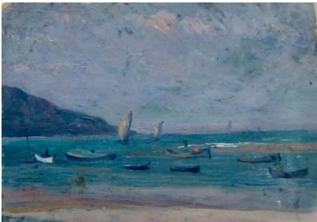
Figura 5. Costa Vasca (1900 -10). Óleo/tabla, 15,5 x 21,5 cm. Colección particular.