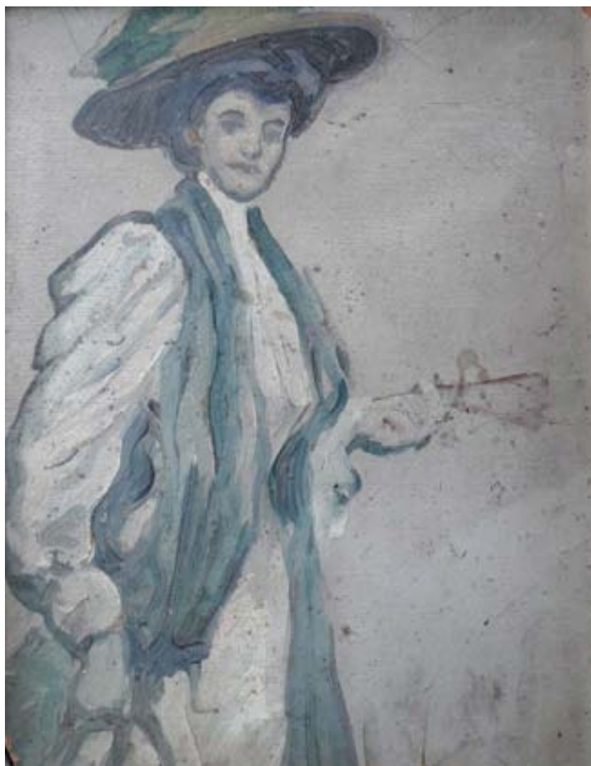
Figura 8. Sagrario . Óleo/lienzo, 21 x 16 cm. Colección particular.

el cuadro titulado Abuela María Paz , un óleo en lienzo con unas medidas de 62 x 48 cm (fig 7). Tenemos dudas de la fecha de ejecución de la obra. No obstante, dado que representa a una señora de edad avanzada, y teniendo en cuenta que la abuela M. a Paz falleció en 1914, no nos extrañaría que el cuadro pudiera fecharse en torno a 1910. La figura se presenta de perfil, con un excelente estudio del rostro y entronca perfectamente con el retrato realista español.