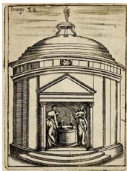
Figura 3. Vincenzo Cartari. Imagines Deorum (ed. Francofurti, 1687). Vesta .

En este contexto general de luz y oscuridad, el predicador convierte la iglesia de la Enseñanza en un nuevo templo de Vesta, a la que los antiguos consideraban antorcha viva y luz primera, pero que a su vez denominaban negra por el color de sus vestiduras, de manera que su luminosidad sobresale todavía más por contraste. Se remite para ello al libro VI de los Fastos de Ovidio 8 y a las Imagines Deorum de Cartari en su apartado dedicado a Vesta, a quien define como diosa del fuego perpetuo que no se extingue por acción de sus dos vestales que custodian el templo 9 (fig. 3). A partir