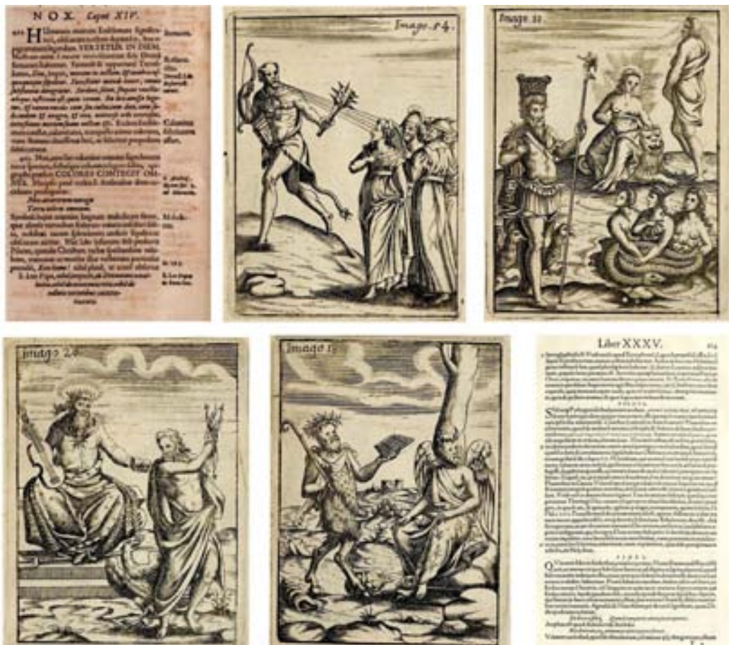
Figura 8. Secuencia emblemática en la Oración panegyrica a el Grande Apóstol de Navarra San Saturnino (Pamplona, 1735) de Isidoro Francisco Andrés.

La consulta de otros sermones, aprobaciones y censuras de Isidoro Andrés nos llevará a responder a tal cuestión. De esta manera, comprobamos cómo en la oración panegírica a san Saturnino predicada en 1735 en Pamplona se suceden referencias a Valeriano (s. p. dedicatoria al monasterio de La Oliva como refrendo de la piedad y caridad de sus monjes; p. 16, la mano como símbolo de la fe que introdujo el santo en los corazones