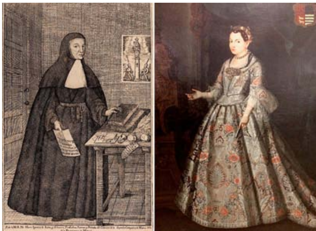
Figura 1. María Ignacia Azlor y Echeverz. Grabado de la Relación histórica de la fundación de este convento de Nuestra Señora del Pilar , México, 1793; y Anónimo, Retrato , s. XVIII, col. particular.

la tierra con las más sustanciosas producciones, y el fuego con lentas actividades», en un canto a los cuatro elementos.