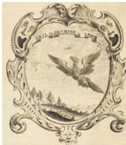
Figura 6. Filippo Picinelli. Mundus Symbolicus (ed. Coloniae Agrippinae, 1687). Aquila .