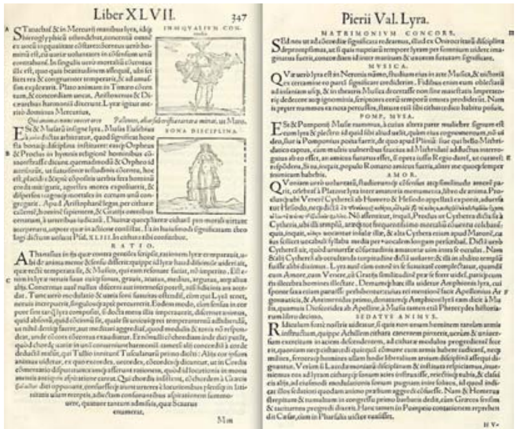
Figura 7. Pierio Valeriano. Hieroglyphica (Basilea, 1566). Lyra .

La alusión a Jesús Sacramentado lleva a Isidoro Francisco Andrés a recordar que es la Eucaristía un banquete que nos une a Cristo en la comunión. Según recoge la Escritura, era antigua costumbre solemnizar con música los banquetes, de manera que se alternasen en ellos la satisfacción al gusto y el recreo al oído («Y en sus banquetes hay arpas y vihuelas, tamboriles y flautas, y vino», Is 5,12). No menos ocurre en el banquete eucarístico, por cuanto «Eucaristía» es, en anagrama puro, «Cítara de Jesús» ( Eucharistia Cythara Iesu Anagram ). ¿Y qué instrumentos suenan en el banquete de este día en el templo tudelano? Afirma el cisterciense que suenan gustosamente dos liras, pues según refiere Valeriano (1556, 347v), la lira fue símbolo de la concordia matrimonial (fig. 7). Las dos religiosas son esposas de Cristo que suenan como liras en la profesión de sus votos, componiéndose de cuatro cuerdas el concierto de su observancia: pobreza, obediencia, castidad y clausura; todas «se escuchan con tanto placer del Sacramentado esposo, que tienen es este día su mayor recreo» ( Oración doctrinal , 1745, pp. 32-33).