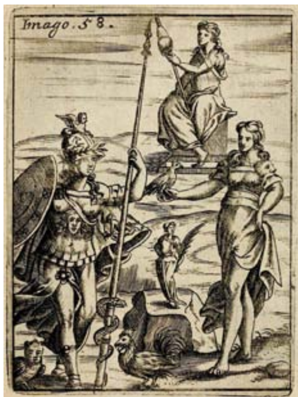
Figura 5. Vincenzo Cartari. Imagines Deorum (ed. Francofurti, 1687). Minerva.

los Himnos de Homero, quien en el Himno a Afrodita señala que Atenea/Minerva enseña a todos los demás 14 ; de la Descripción de Grecia de Pausanias; y de las Imágenes Deorum de Cartari (1581, p. 245), quien considera a Minerva inventora de las artes propias de las mujeres como hilar, tejer y coser; y por tal motivo los griegos le erigieron una gran estatua de madera en la que figuraba sedente sobre un sitial, portando una rueda en sus manos; y los romanos tenían por costumbre, en las fiestas celebradas en su honor, que los dueños convidasen y sirviesen a sus criados, en señal de gratitud por los trabajos domésticos que realizaban durante el año y de los que la diosa fue inventora (fig. 5).