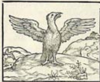
Figura 4. Pierio Valeriano. Hieroglyphica (Basilea, 1566). Phoenix .