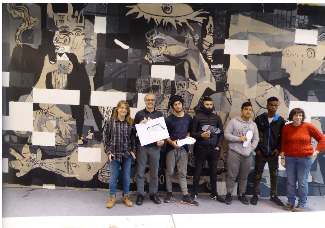
Figura 4. Jóvenes de la Fundación Ilundáin con el mural del proyecto «Gernika». Museo Universidad de Navarra. Fotografía reproducida con autorización.

el mural a modo de puzzle y diseñado una caja especial para contenerlo. La experiencia fue tan exitosa que van a repetir con un proyecto similar, esta vez denominado «Kandinsky», en el que están camino de duplicar el número de inscritos (F. Echarri, comunicación personal, 20 de julio y 30 de agosto, 2018; Museo Universidad de Navarra, s. f.).