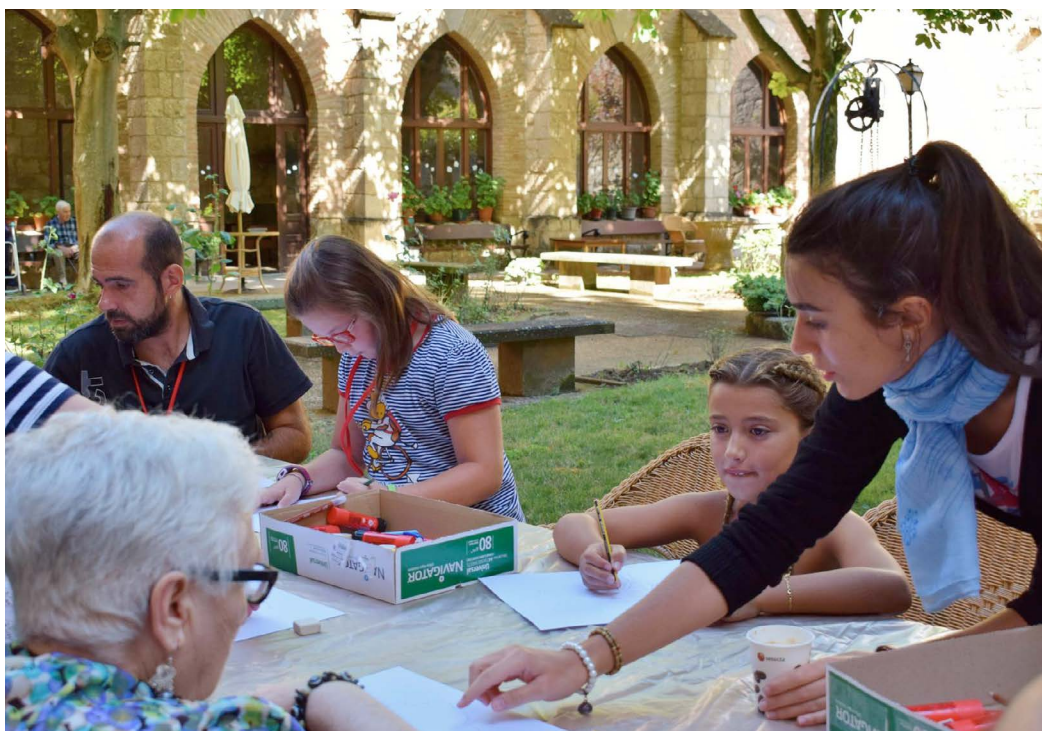
Figura 3. Taller de Todos somos artistas. Museo Gustavo de Maeztu.