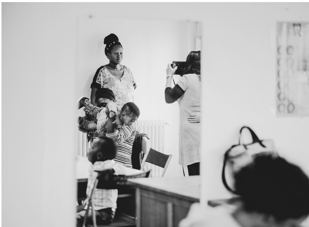
Figura 2. Participantes en La identidad de los pueblos en femenino .

por la empresa especializada Bakeola. A efectos del presente texto, lo más interesante es que, para la realización de una experiencia piloto con el tercer taller, dirigido a adolescentes de entre quince y diecisiete años («¡Nuestro compromiso! La paz») el Museo contactó con el Instituto de Educación Secundaria Tierra Estella. Más concretamente, en la prueba, que se llevó a cabo en diciembre de 2017, participó un grupo del programa de mejora del aprendizaje y el rendimiento (PMAR). Este programa se caracteriza por reunir a escolares con problemas en los estudios y contextos personales, familiares y sociales complicados.