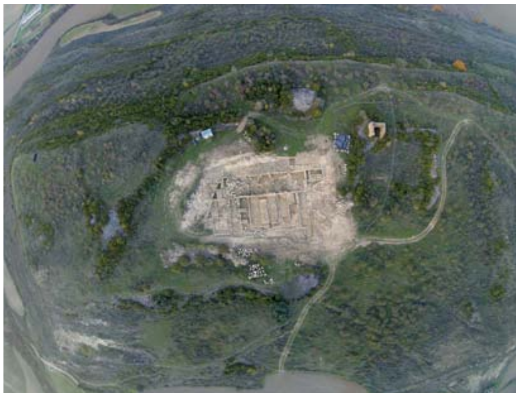
La excavación a vista de pájaro.

global y, al margen de algunas estructuras marginales del sector occidental que parecen un tanto desligadas del diseño ordenado y racional, criptopórtico, distribuidores laterales y recintos centrales del area forman parte de un proyecto urbanístico previo (fase I) modificado de manera más o menos sustancial a lo largo de los siglos, especialmente en la segunda mitad del siglo I d. C. (fase II) y la primera mitad del siglo II d. C. (fase III).