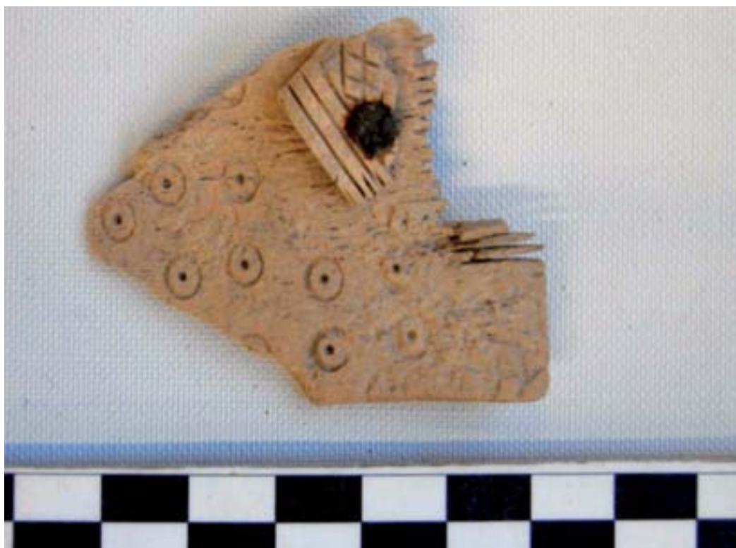
Peine de hueso.

Solamente en dos ocasiones ha podido reconocerse un cierto espacio de uso interno: una de estas estructuras pudo utilizarse como redil de ganado, mientras que en otro de los casos la actividad antrópica documentada tuvo lugar una vez amortizado el propio recinto con una colmatación de derrubios, y consistió en la excavación de una pequeña fosa rellenada posteriormente con tierra carbonosa y ceniza. El lote de material mueble relacionado con esta unidad de relleno ofrece algunas pautas cronológicas interesantes puesto que contiene una hebilla de bronce arriñonada con decoración de líneas incisas y un fragmento de peine de hueso delicadamente decorado con círculos, rayas paralelas y reticulado, asimismo incisos, que otorgan a esta actividad posterior a la colmatación de los recintos un terminus post quem fijado en los siglos IV-V d. C.