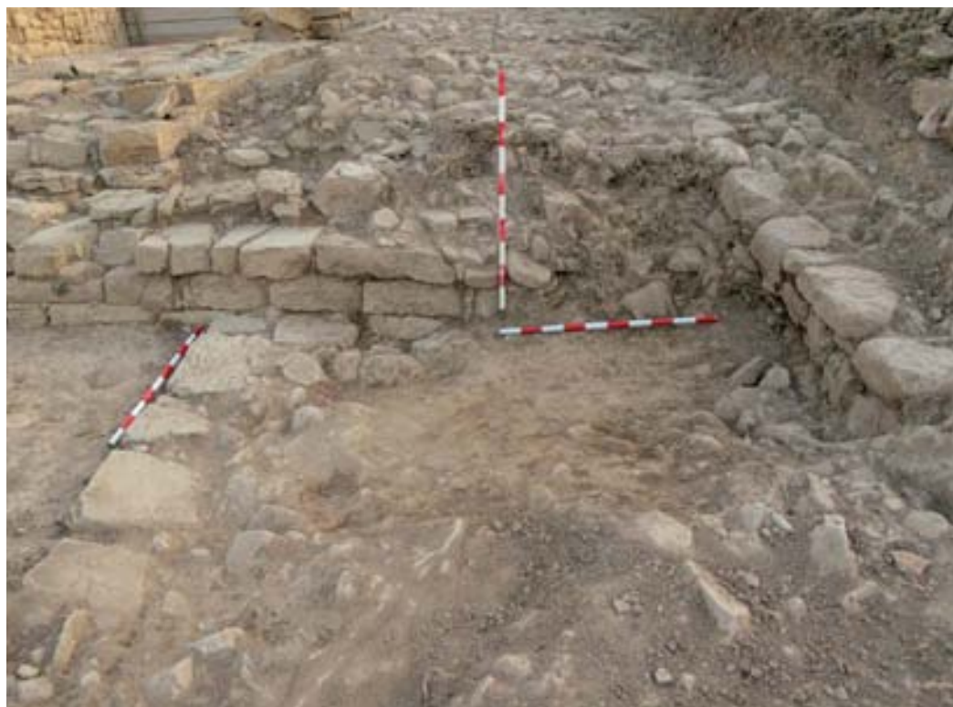
Colmataciones de derrubios asociadas a estructuras tardoantiguas.

la excavación colmatando tramos de la crujía y solapando parcialmente las interfaces de destrucción de sus muros perimetrales, favorecida su dispersión por el buzamiento acusado de la ladera del cerro.