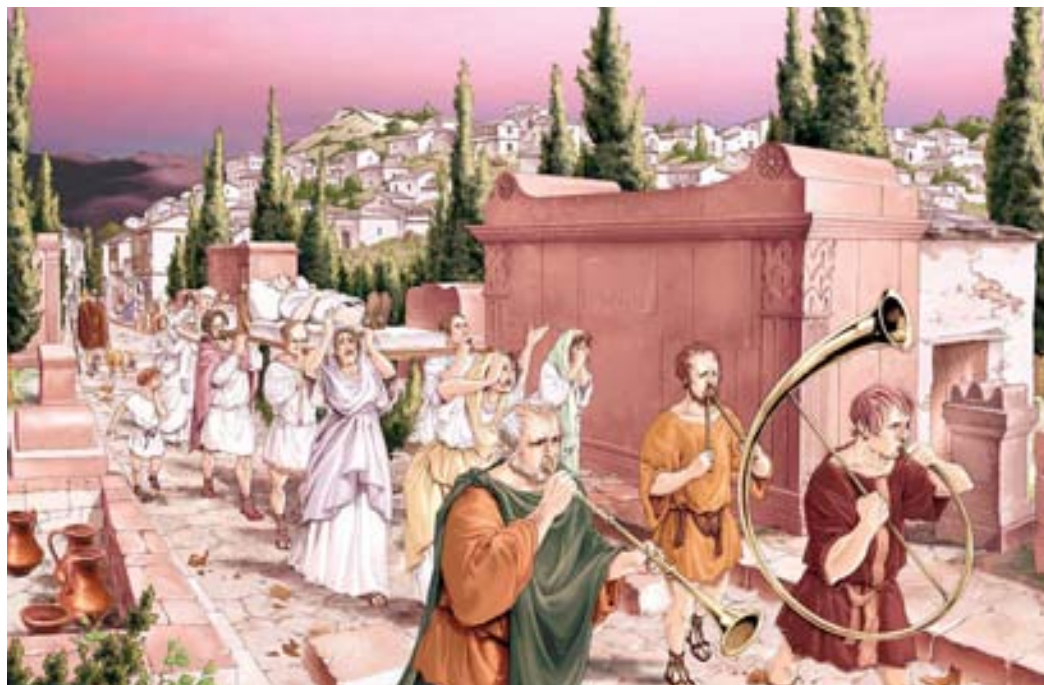
Recreación de cortejo fúnebre en la necrópolis de Santa Criz con la ciudad al fondo. A la derecha interpretación del recinto funerario I y estela de Piculla y a la izquierda urna cineraria (tumba 11). (J. L. Landa).

La factura de los elementos epigráficos, arquitectónicos y decorativos ofrecen rasgos de la influencia del arte romano, tanto hispano como galo, de la tradición prerromana así como de elementos propios de maestros de la urbs y de la artesanía local, lo que pone de relieve la receptividad de la población, tan visible de manera especial en su onomástica. Algunos de los hallazgos de este espacio cementerial aluden a la presencia de soldados en la ciudad sumándose así estas evidencias a las estudiadas en el entorno del foro.