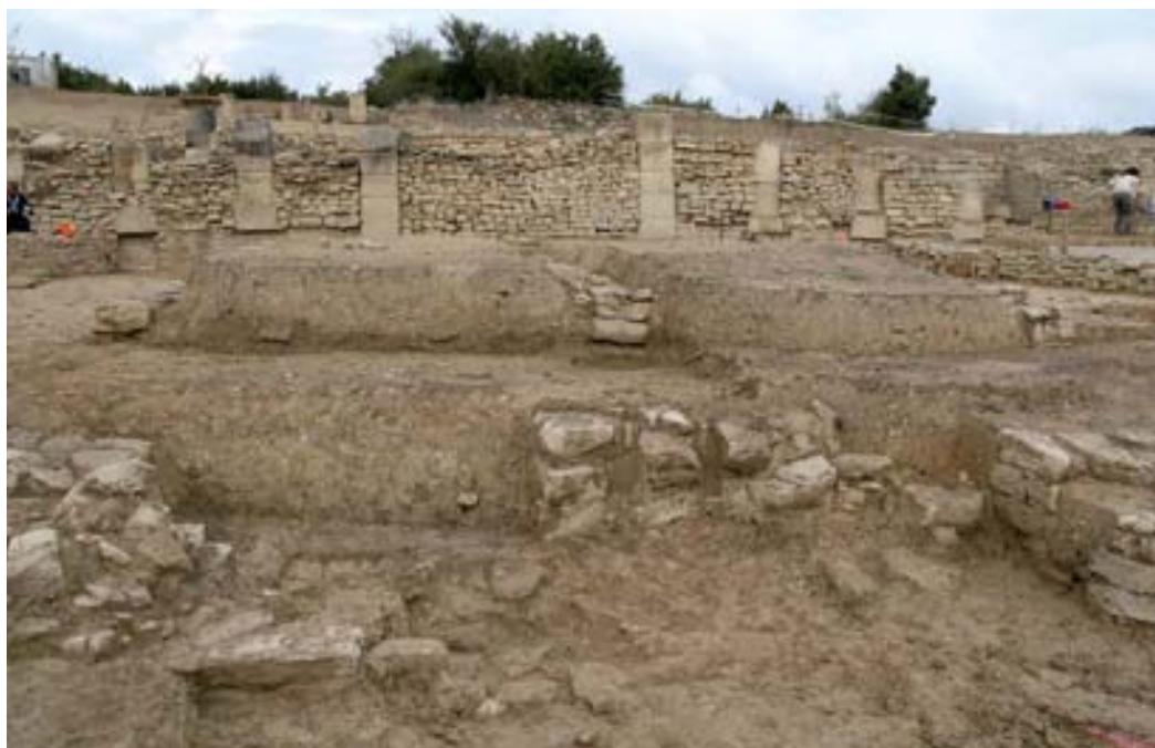
Extremos meridionales de RA ( horrea ).

sustentación del tabulatum a modo de pegollos para favorecer la conservación del grano. Sin embargo, lo limitado de la intervención no ha permitido refrendar la hipotética repetición de elementos semejantes a lo largo de los RA. En cualquier caso, y tal como se ha constatado en otras excavaciones españolas como es el caso de Ilipa , se podía prescindir de este tipo de estructura sobreelevada cuando se almacenara el grano ensacado (Salido Domínguez, 2013: 133).