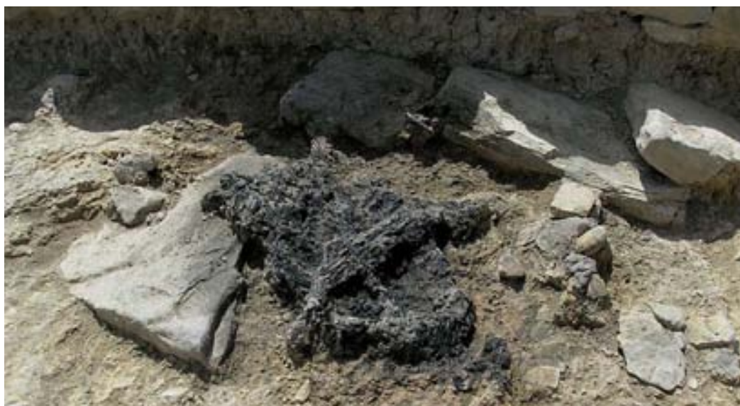
Recinto funerario I. Troncos carbonizados seguramente relacionados con un silicernium (nivel inferior).

recinto se han podido registrar cuatro hiladas en el muro norte del monumento y dos hiladas en el muro sur, sin que se haya detectado entre los mampuestos ningún resto material que pudiera servir de unión o trabazón. Las labores de excavación en la zona aneja no han permitido documentar elementos arquitectónicos que den pautas sobre la altura de estos paramentos, ni si hubo otro sistema de alzado erigido sobre los mismos (por ejemplo de madera, clavos) o que hagan presumir la existencia de una cubierta (tegulas, lajas). Tampoco tenemos evidencias de vanos o de otro modo de acceso a su interior. Al exterior las cuatro paredes estuvieron decoradas con pintura mural y, aunque estas no han sido todavía restauradas, algunos de sus fragmentos permiten afirmar que en su parte oeste se utilizó el color rojo, algo habitual en este tipo de edificios, y que la parte norte ofreció al viandante sencillos motivos vegetales de colores variados (verde, amarillo y rojo) seguramente enmarcados entre líneas. No existen indicios de este enlucido dentro del recinto. Entendemos por estas circunstancias que se trata de una estructura similar al recinto funerario II y que como este ha de adscribirse a la tipología de «monumentos indeterminados» o de «recintos acotados».