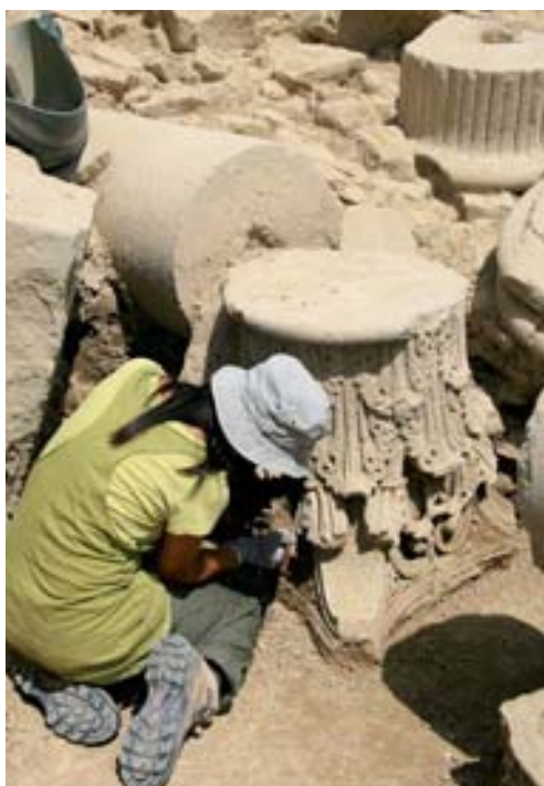
Proceso de excavación de capitel corintio.

El nivel de tierra de abandono que selló el derrumbe masivo y que ha podido seguirse a lo largo de todo el criptopórtico a unas cotas muy similares constituye, especialmente en la mitad oriental del mismo, el soporte de otro tipo de actividades verdaderamente difíciles de concretar dado su grado de arrasamiento y sobre todo el carácter provisional o secundario estimado para ellas. La mayor parte consiste en muros toscos conservados en precario y elaborados con elementos reutilizados. Cuando estas estructuras se levantaron, el criptopórtico había acusado de manera muy radical el proceso de ruina de modo que algunos de sus tramos se disponen sobre cotas muy arrasadas de sus elementos principales (GEM2, pilares centrales, cierre oriental). Tampoco se han conservado, en el caso de que los hubiera, depósitos de actividad ligados a ellas. Estas pautas formales descritas del conjunto de estructuras