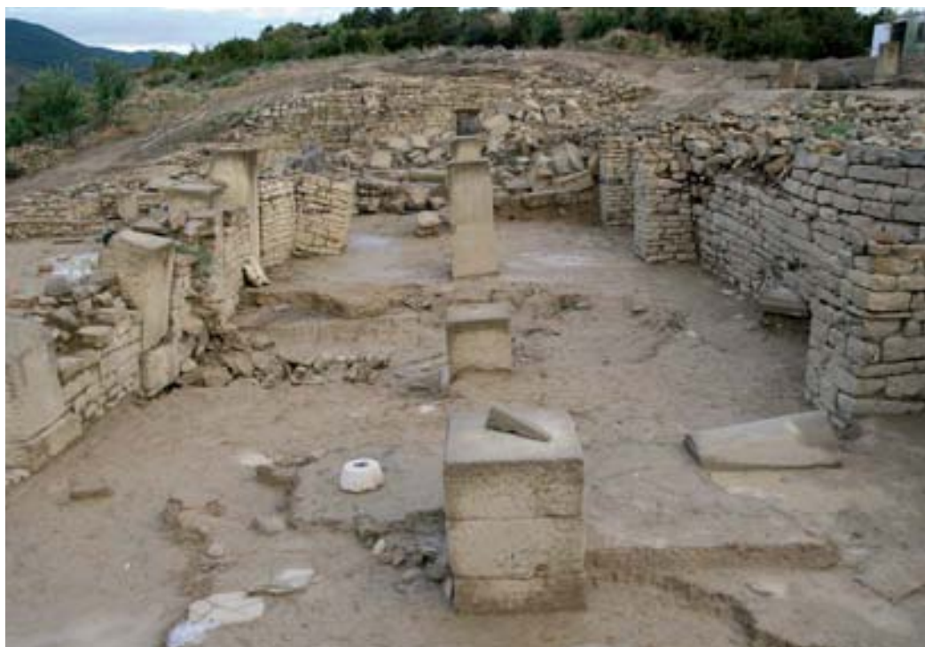
Sistema de contrafuertes en el interior del criptopórtico.

La cota de circulación, a falta de evidencias de solado de cualquier tipo (no ha aparecido ni material pétreo ni latericio, tampoco hormigón ni otros morteros endurecidos, como tampoco se ha exhumado unidad ninguna de tierra batida que pudiera ejercer esta función de suelo) se relaciona con la fina capa de cal detectada en los dos sondeos efectuados en el interior de este recinto y en las zanjas de drenajes excavadas durante la obra civil de consolidación, que nos indica una cota mínima para el nivel de circulación de -4,48.