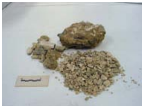
Recinto funerario I. Urna cineraria y contenido óseo conservado en la misma, correspondientes a la tumba 11-nivel IV.

Así, entendemos que el recinto funerario I acogió las sepulturas de doce personas miembros de una misma familia. El hallazgo de un fragmento epigráfico, seguramente perteneciente a la cartela que exhibía el mausoleo hacia la vía sepulcral, hace alusión al nomen Calpurnius . La monumentalidad y la ubicación de dicho edificio indican que esta familia formaría parte de la elite de la ciudad, tal vez emparentados con los Calpurnii documentados en el cercano yacimiento de Camporeal (ERZ n. 41) y con esta Calpurnia de Andelo (CIL II, 2967) cohabitando con miembros de la gens Aurelia ( vid supra ) y Valeria , el nomen más frecuente relacionado hasta el momento con este lugar.