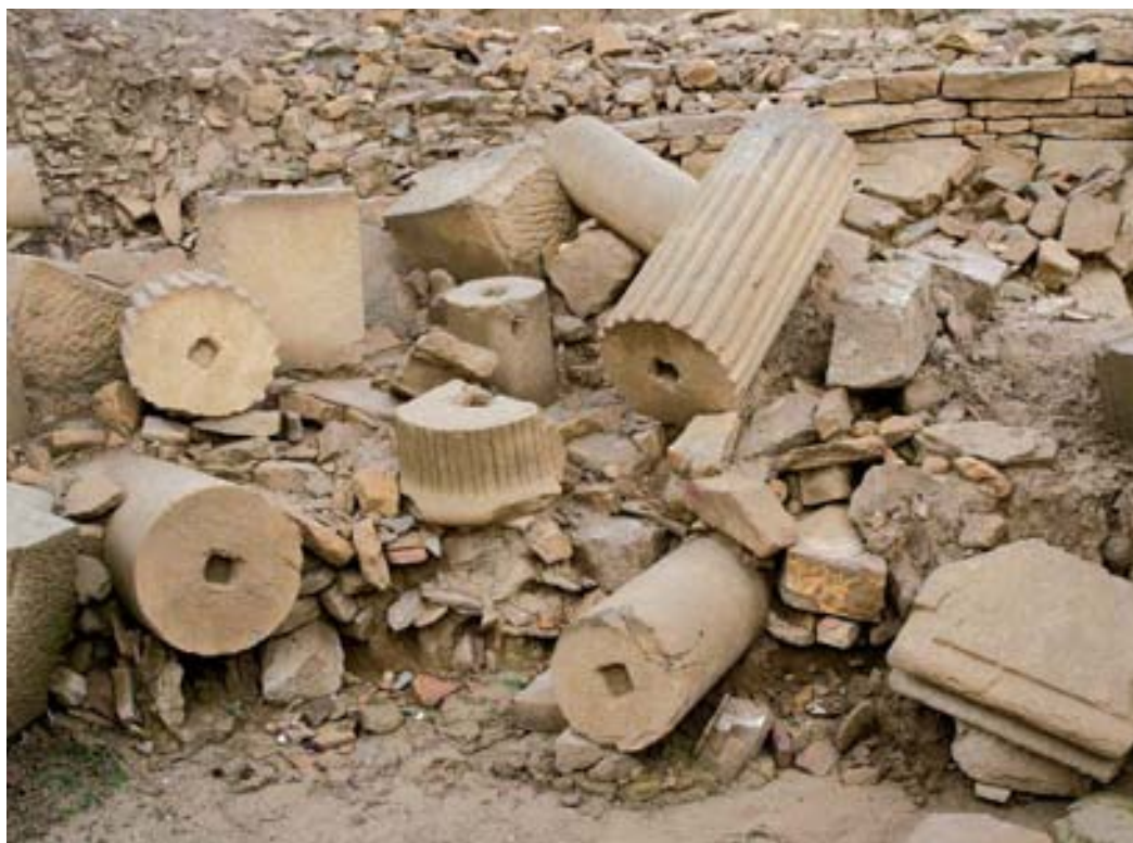
Sección parcial del derrumbe masivo del criptopórtico.

Además de estos ejemplares significativos, la unidad también está conformada por los derrumbes de sus propios elementos portantes: muros perimetrales, pilares centrales y contrafuertes, que, en el caso de ofrecer un grado alto de fiabilidad sobre su ubicación original, han sido restituidos en el proceso de puesta en valor. El material mueble asociado a estas unidades ha resultado ciertamente escaso y poco concluyente, consistiendo en pequeños lotes de fragmentos cerámicos minúsculos y muy rodados de producciones diversas, aunque priman los hallazgos de TSH y vasijas engobadas. El monetario descubierto también ha sido muy escaso, ofreciendo las piezas encontradas una cronología del último tercio del siglo II, siglo III (acuñadas en Roma entre los años 164-166, 222-235 y 268-270).