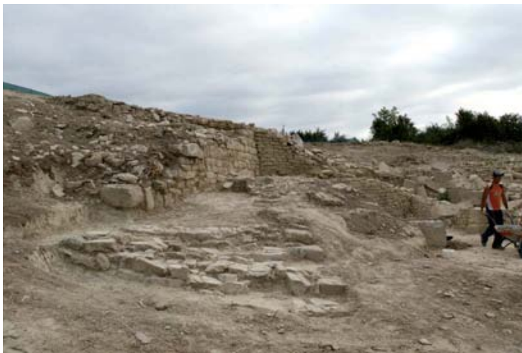
GEM1 y estructuras asociadas.