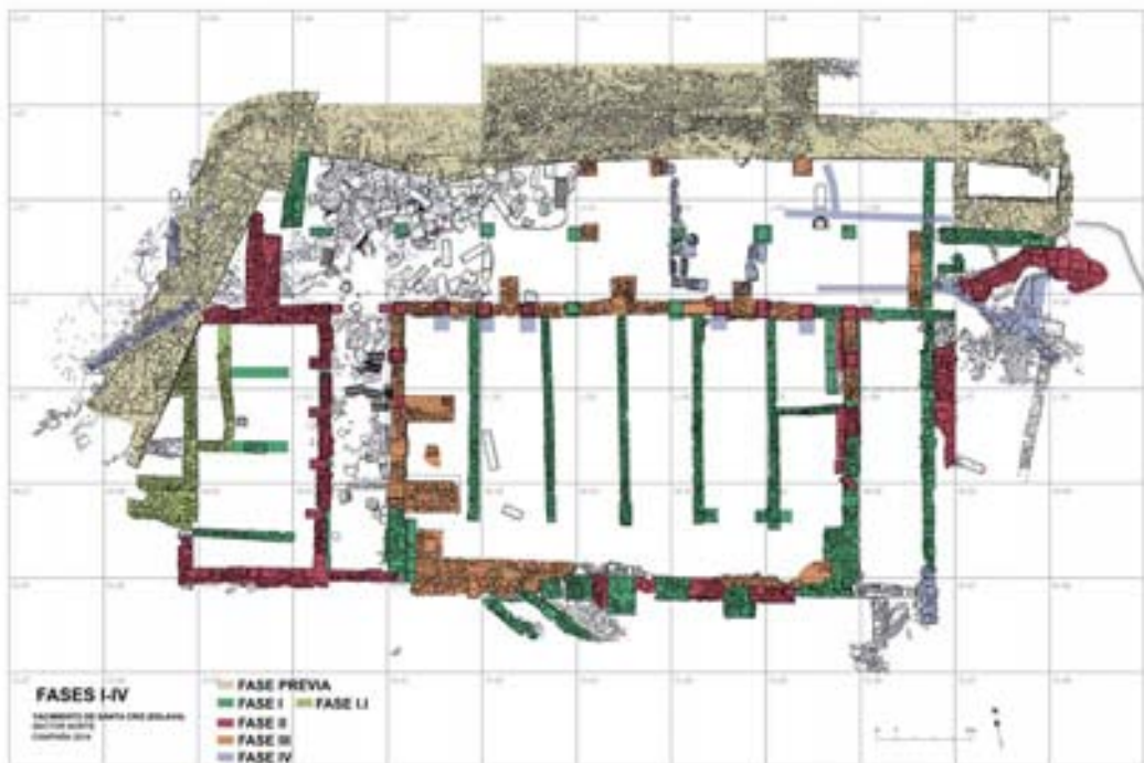
Planimetría. (Iñaki Diéguez Uribeondo).