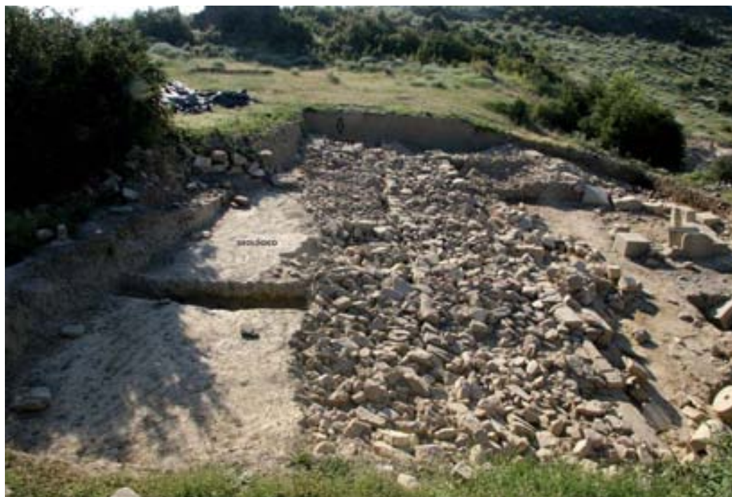
GEM2 y drenaje anexo.

La relación que GEM1 establece con GEM2 a nivel de interfaces es confusa, puesto que la actividad positiva y negativa llevada a cabo en el punto de confluencia dificulta una lectura precisa. Son ciertas, como ya se ha señalado, las particularidades de GEM1 con respecto al resto del espacio urbanizado, sin embargo, aconsejados por otros aspectos como la funcionalidad de ambos grupos estratigráficos, los sistemas constructivos empleados y las relaciones que establecen con el resto de elementos y depósitos con los que ambos se encuentran relacionados, es posible plantear que estos dos grandes elementos se erigieran próximos en el tiempo pero obedeciendo a momentos de obra sucesivos, como paso previo y necesario para la configuración de un espacio de uso a media ladera. Su construcción implicó un esfuerzo de preparación notable puesto que supuso alterar el perfil natural del cerro, excavando el sustrato geológico para alcanzar la cota requerida (-2,96 en el extremo suroeste de GEM1, -4,50 en la base de GEM2).