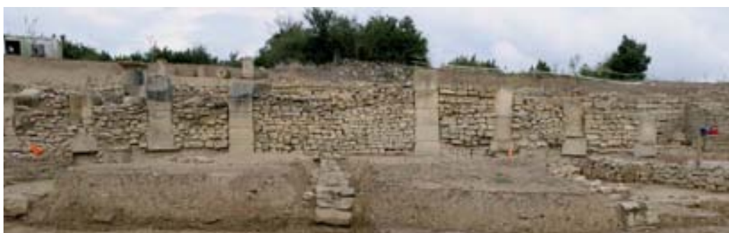
El criptopórtico. Detalle de GEM4.

por haber sufrido especialmente una serie de alteraciones, reformas y añadidos que le confieren un aspecto formal distinto al resto del muro sur rompiendo de algún modo la cadencia relativamente armónica de encadenados y entrepaños adoptando, entre otras circunstancias constructivas, un intercolumnio más reducido e incluso irregular en este sector, unas dimensiones también menores del volumen de los encadenados de sillar y unas dimensiones de fábrica de mampostería diferentes que ligan directamente su devenir al del complejo sector occidental de la excavación apenas intervenido salvo a cota de sus principales interfaces.