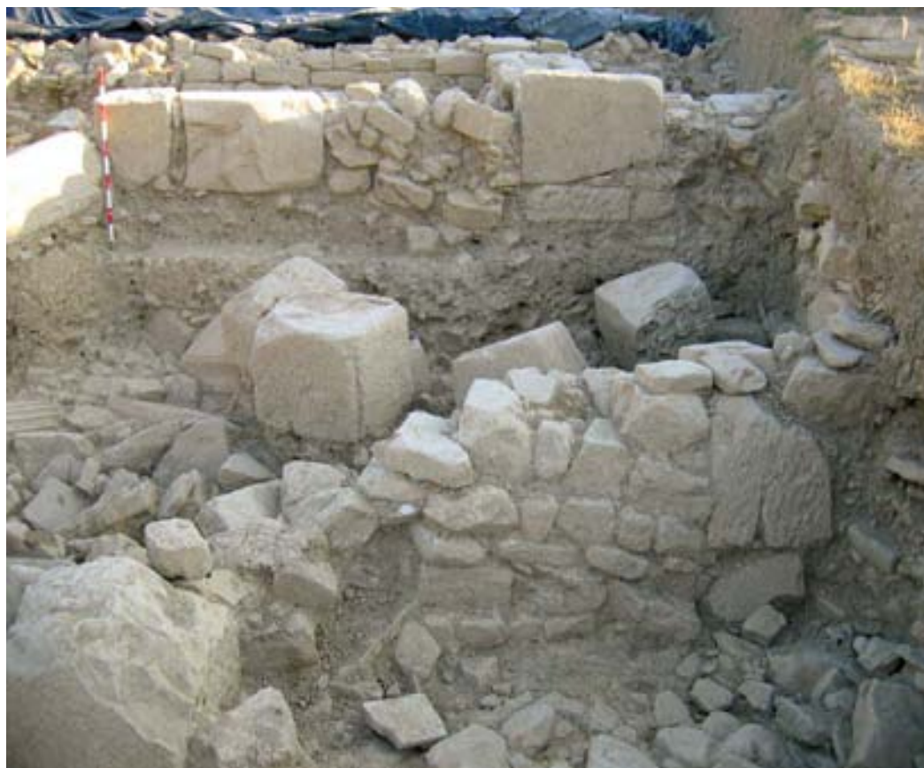
Estructuras tardoantiguas sobre el derrumbe masivo del criptopórtico.

siglos, siguió un largo tiempo de abandono, colmatación posterior y sellado. Fueron estos aportes erosivos que incrementaron la cota del edificio prácticamente hasta la coronación primitiva de sus muros los que siguieron ofreciendo oportunidades de aprovechamiento, completando así un ciclo dilatado desde su primera urbanización hasta las últimas evidencias de actividad de casi cinco siglos de existencia viva.