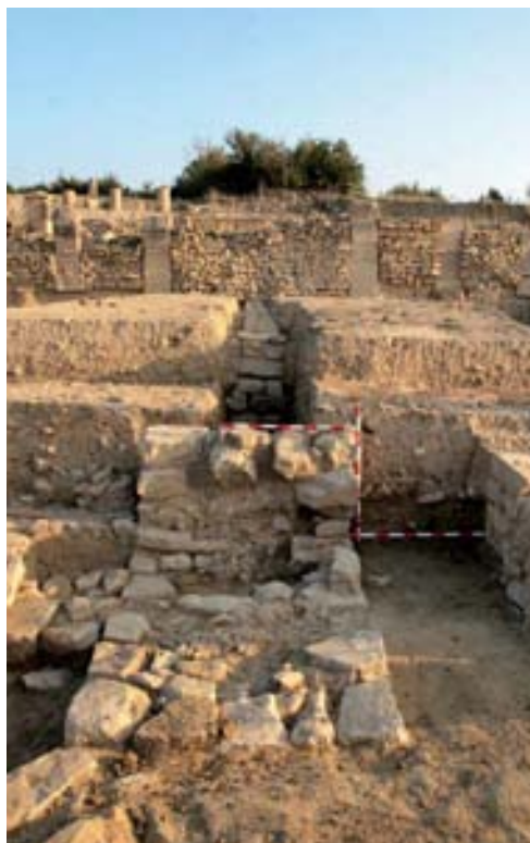
Zapata aislada del cierre sur.

La hipótesis funcional que se baraja con respecto a estos habitáculos se orienta hacia el ámbito de los horrea . Ya su propia orientación y ubicación en los alrededores del espacio forense estaría en coherencia con lugares de almacenaje de bastimentos o incluso con la venta directa de mercancías. Estos recintos poseen unas dimensiones útiles y grosores de fábricas concordantes con las comunes en los horrea hispanos. Asimismo, es reseñable en este sentido el hallazgo de unas estructuras cuadrangulares de 0,73 m x 0,73 m, adosadas a la cara interna de los muros, que podrían interpretarse como elementos de