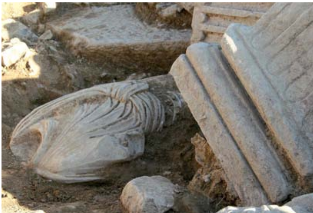
Exhumación del personaje togado.