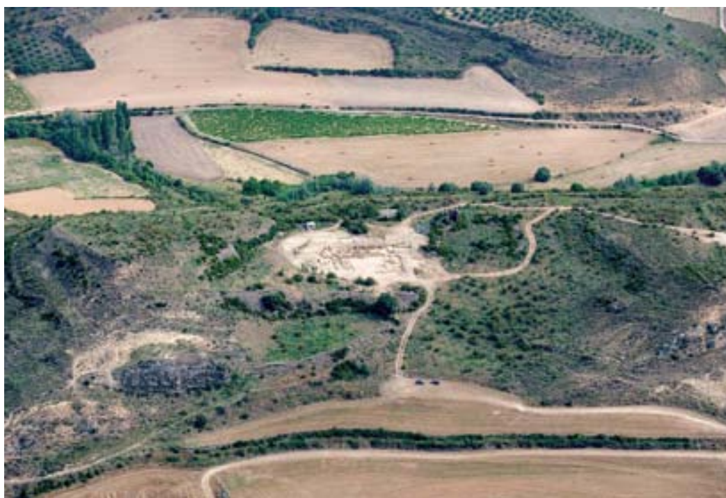
Emplazamiento de la excavación en el conjunto del yacimiento.

La intervención sistemática llevada a cabo en las inmediaciones del espacio forense de la civitas apenas si alcanza el 1% del espacio total estimado para el conjunto de la ciudad romana (en torno a las trece ha), y afecta topográficamente a la parte central del cerro delimitada por dos altozanos a este y oeste.