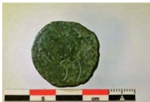
Moneda con contramarca del águila.