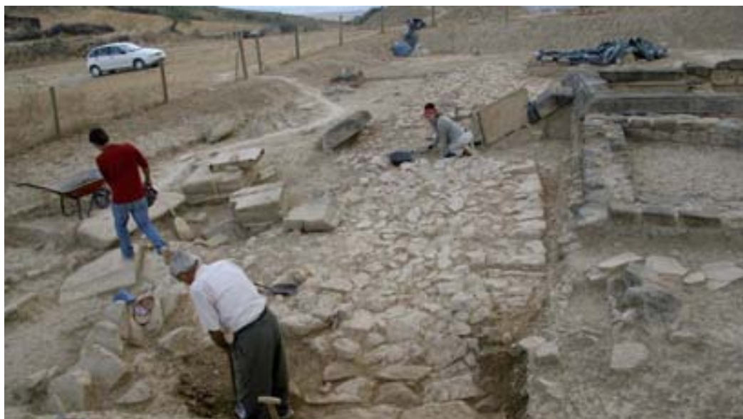
Proceso de excavación en la vía sepulcral. Campaña 2007. A la izquierda restos arquitectónicos monumentales y a la derecha, delante del recinto funerario I, las cornisas.

Las labores de excavación sistemática permitieron recuperar delante de la construcción, sobre la vía, varios elementos arquitectónicos que por su cercanía ponemos en relación con este edificio que nos ocupa: tres sillares con decoración en esquina que encajan entre sí y representan una columna acanalada coronada por capitel corintio, casi la totalidad de la cornisa moldurada que coronaba el edificio, un balthus con decoración de hojas de piña, el frontal de dos pulvinos y un fragmento epigráfico de tipo monumental, a modo de bloque para encastrar, con las letras ]ALP[ en capital quadrata . A modo de hipótesis y desconociendo si entre los sillares decorados en esquina y la cornisa se sostenían otros elementos, podemos considerar que la altura total del edificio rondaría los 3 m, 3,64 m incluyendo el podio (0,60 m, podio; 0,33 m, planta moldurada; 2,13 m, altura de la esquina de opus quadratum ; 0,30 m, cornisa; 0,28 m, pulvino). La totalidad de la estructura se ha realizado sobre piedra local de tipo arenisca (calcarenita), detectándose restos de enlucido junto a la fábrica de mampostería, en el interior de su mitad sur.