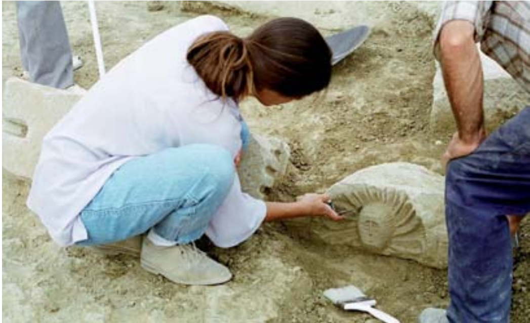
Frontal de pulvino con alargamiento lateral hallado en 1996 que fue escogido como logotipo para representar al yacimiento.