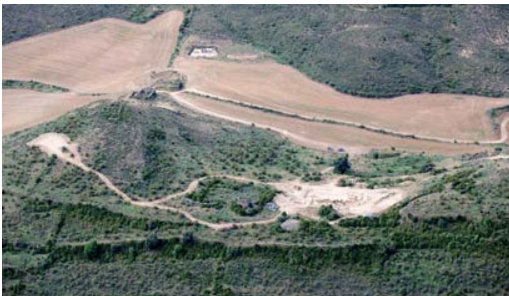
Vista aérea de Santa Criz (2014). En la parte superior la parcela en la que se ubica la necrópolis vista desde la ciudad.