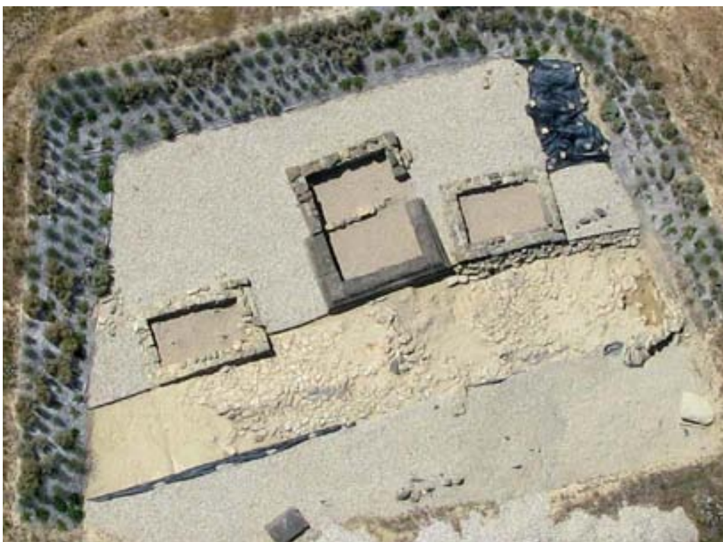
Vista aérea del Sector B, necrópolis. Superficie excavada hasta 2006.