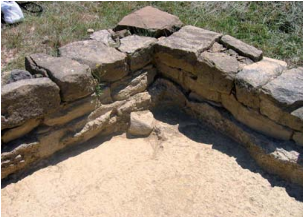
Revestimiento de estuco en el interior del recinto funerario 1.