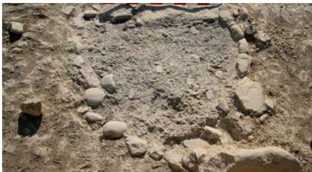
Sepultura «a cielo abierto». Nivel de cremación abierta hacia el este, delimitados por cantos y señalizada (tumba 25).

En el entorno de estos monumentos funerarios, sobre el suelo de uso y sin orden pre-fijado, se recuperan ocho sepulturas individuales que no están circunscritas a ninguna estructura arquitectónica. Son tumbas de tamaños comprendidos entre los 0,60 m y 0,90 m que presentan manchas carbonosas y evidencias de huesos quemados que son delimitadas por anillos de cantos rodados o pequeñas piedras de tamaño regular sobre las que se levantaría una cubrición de tierra a modo de túmulo. Junto a los restos óseos se recuperan fragmentos de cerámica, chinchetas, clavos, escorias de hierro y huesos de animal sin quemar procedentes de los banquetes funerarios. Aunque solo se ha realizado el análisis paleoantropológico de tres de ellas, los resultados muestran la presencia de ambos sexos, un varón y dos mujeres de edad adulta. Da la casualidad de que el único ajuar, una cuenta de collar de hueso y una pequeña espátula o cincel similar a estos destinados al uso cosmético, corresponde a una de estas segundas (tumba 23). Solo en un caso se han conservado vestigios de señalización (tumba 25), a modo de cipo de piedra. No contamos con evidencias que puedan ofrecer una cronología clara para estos enterramientos si bien su presencia sobre el trayecto de la vía sepulcral podría ser indicio de una disposición tardía.