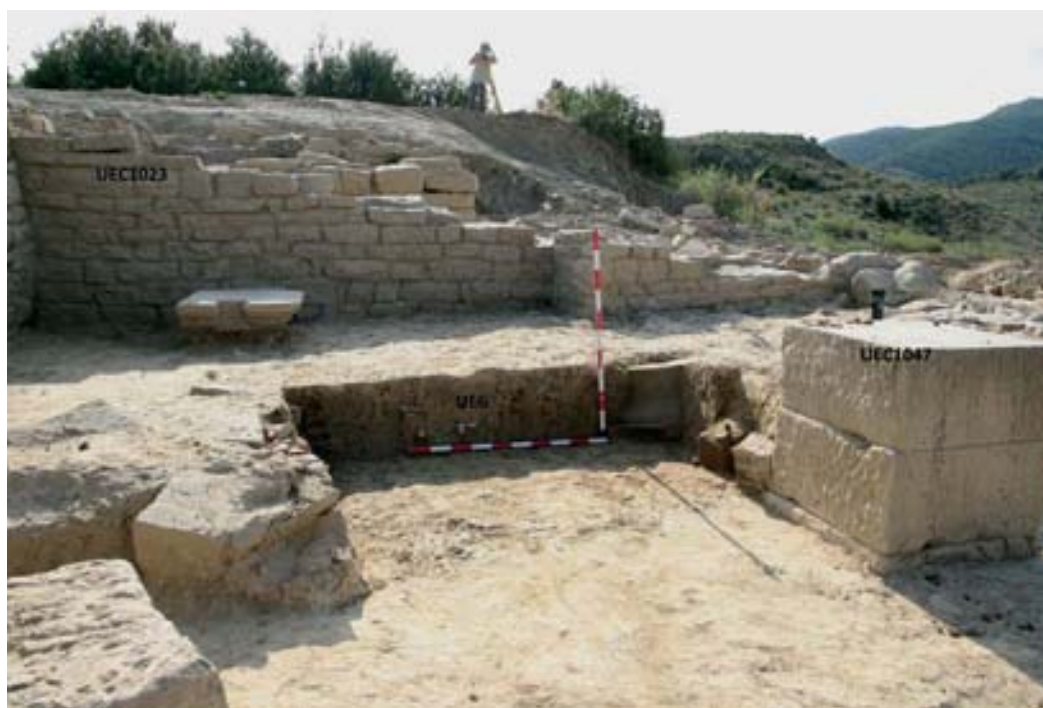
Criptopórtico. Nivel de abandono.