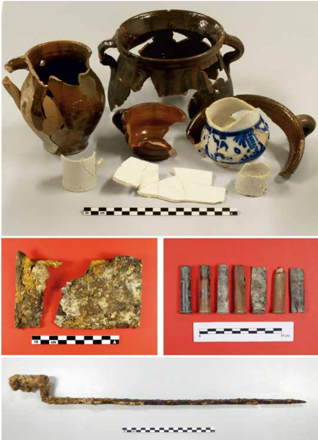
Figura 2. Imagen inferior, bayoneta recuperada en Arandigoyen. El resto de materiales fueron recuperados en Villatuerta.