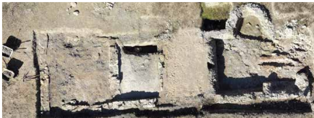
2. irudia. 2020ko indusketa kanpainen zehar ateratako aire argazkia.

Orotara 2020ko indusketa kanpainen 47m 2 -ko eremua indusi da, termen eraikinaren hegoaldeko bi gunetan, hain zuzen ere. Induskatutako eraikineko guneen deskribapena errazte aldera, hegoaldeetik iparraldera zenbakitzea erabaki da; horrela, hegoaldereneko espazioari 1 zenbakia esleitu zaio, 2.a opus caementicium -eko zorua duenari, 3.a opus spicatum lurzorukoari eta 4.a gune handienari (absidearenari, alegia).