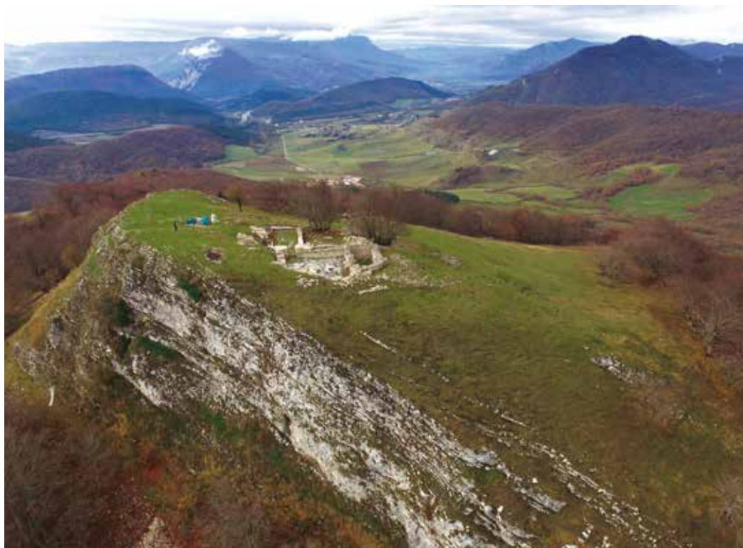
Figura 1. La cima del monte Arriaundi (Larunbe) y al fondo el valle de la Sakana. Josu Erviti, 2020.

Simultáneamente se procedió a la búsqueda sistemática de datos documentales en todos los archivos susceptibles de contener información, en concreto el Archivo General de Navarra, el Archivo Diocesano de Pamplona y el Archivo Municipal de Cendea de Iza.