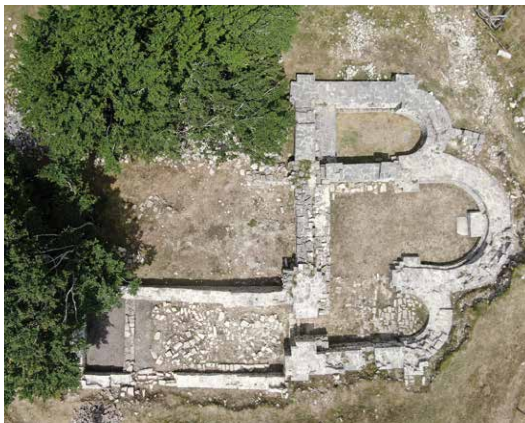
Figura 3. Vista aérea de la planta del monasterio de Doneztebe (Larunbe). Josu Erviti. 2020.

Gracias al interés y el voluntariado de la comunidad de Larunbe se han podido lograr una serie de hitos hasta la fecha sin respuesta: el emplazamiento del monasterio de Doneztebe o San Esteban de Larunbe y/o Juslapeña, la evolución histórica en la toponimia del lugar y la planta de un monasterio inédita en la historia de la arquitectura del románico en Navarra.