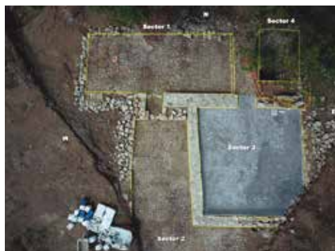
Figura 5. Sectores.

Como parte final se procedió a una limpieza de las estructuras y a una consolidación posterior, la cual era necesaria dado el interés de mantener la superficie abierta.