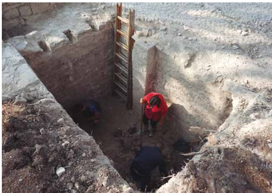
Figura 1. Excavación del depósito bodega del fuerte.