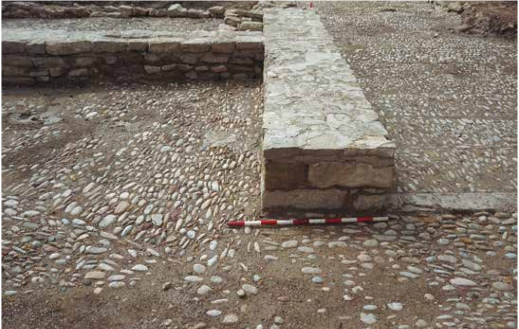
Figura 10. Estructura del fuerte consolidada.