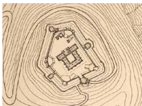
Figuras 2 y 3. Planos del castillo en detalle.