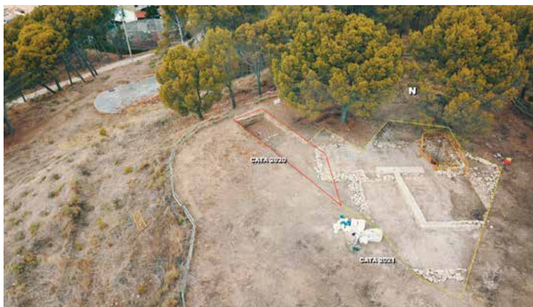
Figura 4. Superficie abierta en la campaña 2021.