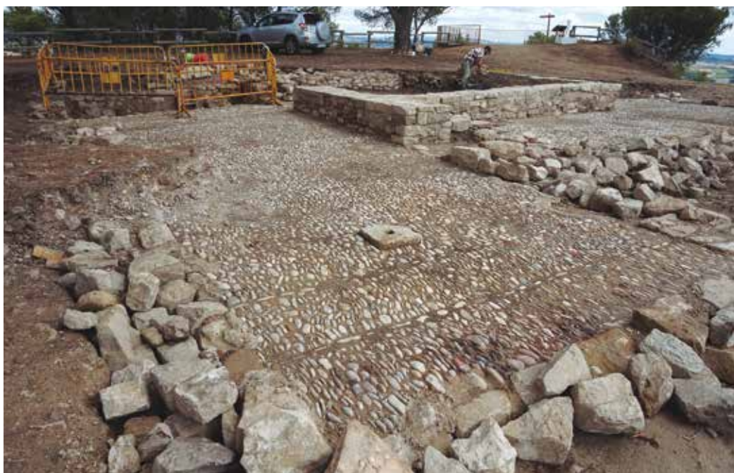
Figura 9. Estructura del fuerte consolidada.

Otro de los objetivos, el del estudio de la evolución del yacimiento se realizará a posteriori. La campaña 2019 ayudó a conocer la estratigrafía y comprobar que todo se compone de una sucesión de rellenos que alcanzan varios metros de profundidad. Es necesario por tanto clarificar primero el espacio y por último volver a incidir en el estudio.