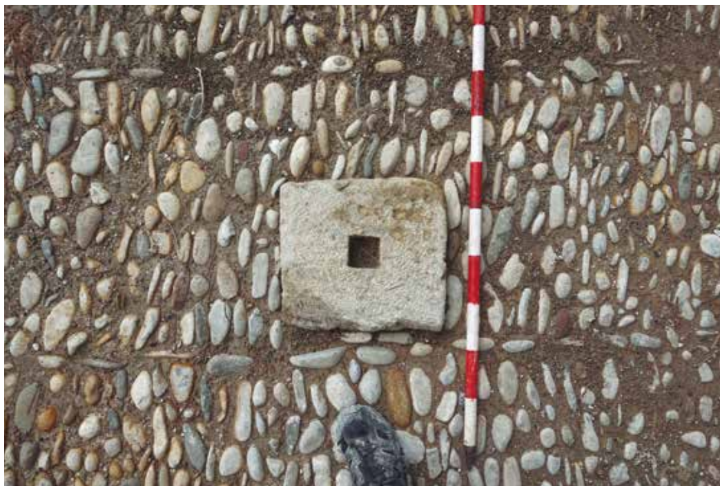
Figura 8. Detalle del apoyo de columna.