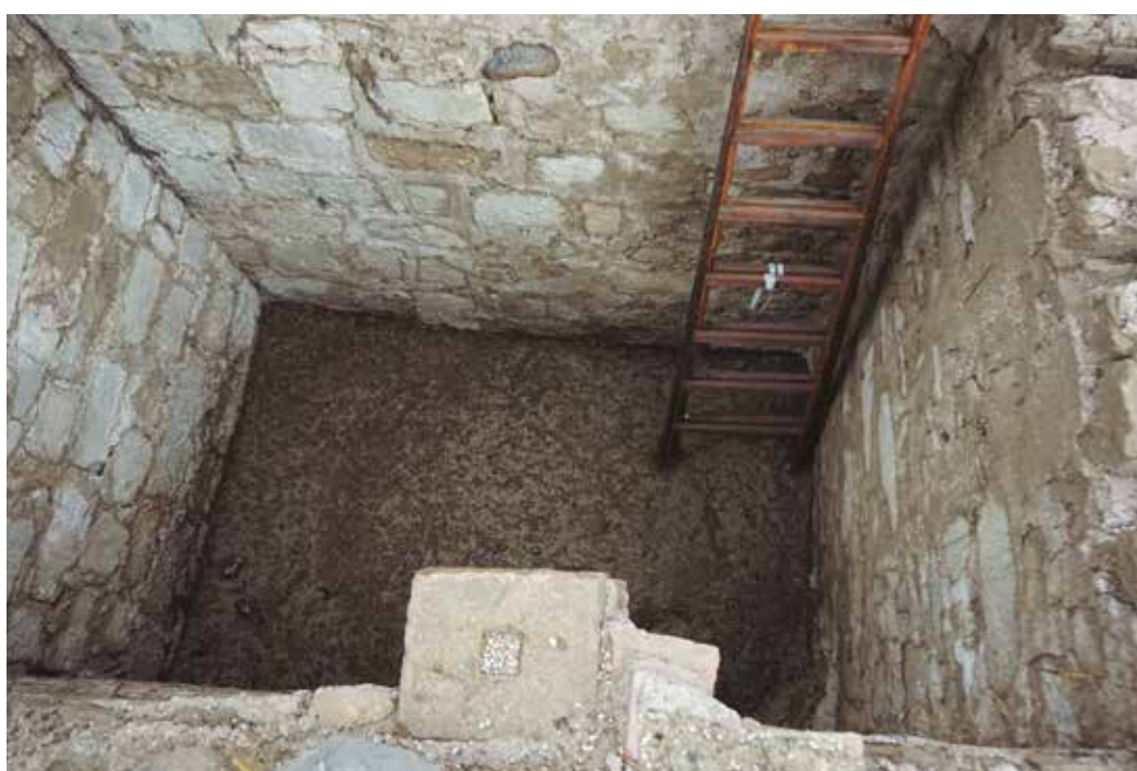
Figuras 6 y 7. Zona de bodega, antiguo depósito. Medidas de la bodega: 278 cm por 200 cm y una profundidad hasta el suelo visible de 210 cm. Es posible que en el espacio original se llegara a los 270-300 cm por lo menos.