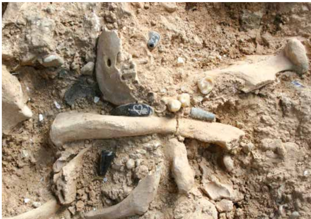
Figura 2. Anillo y cuenta de azabache. Enterramiento 276.

El mayor logro de la investigación ha sido el descubrimiento de la existencia de una fase nueva de la iglesia, entre los siglos XVI y XVIII, cuando anteriormente se pensaba que la iglesia medieval era la que se derribó para construir la actual en 1733.