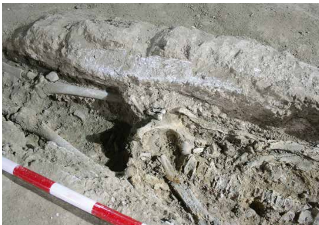
Figura 1. Huellas del ataúd blanco en el enterramiento 268.

tierra de los laterales hay manchas blancas de la pintura del ataúd. Presenta algunos huesos del pie y la mano con zonas pulidas por rozamiento ante la falta de cartílago; brazo derecho en posición alargada; brazo izquierdo ligeramente plegado con la mano en el pubis.