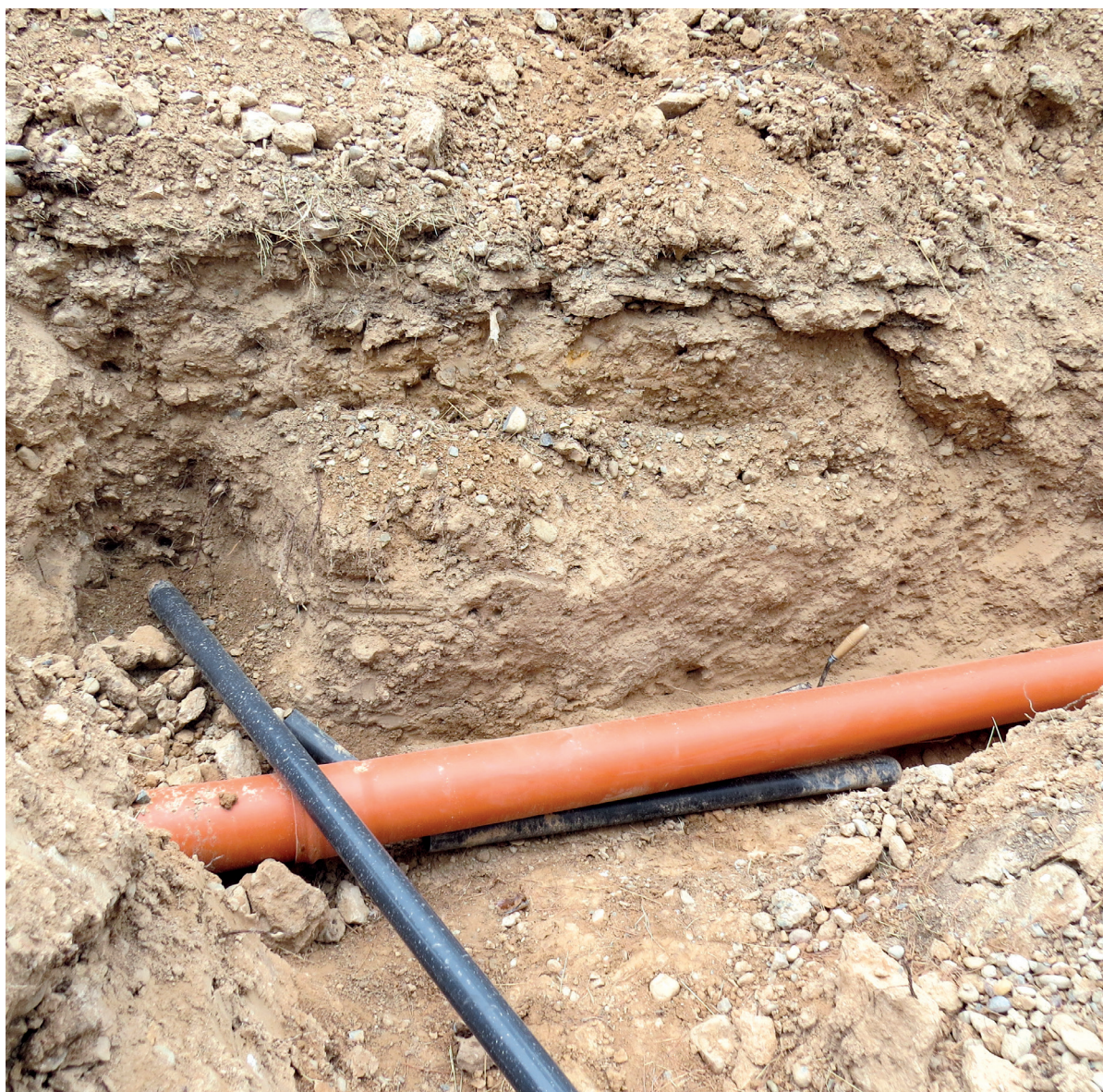
Figura 3. Nivel arqueológico destruido por la obra con abundante material cerámico.

ya que se habían vuelto a colmar con tierra algunas partes de la misma. Además, también se constató la apertura de zanjas laterales que fueron colmatadas antes de nuestra llegada, por lo que no pudieron ser inspeccionadas. Es en estos lugares, en los que incluso nos encontramos con la propia excavadora aparcada sobre los montones removidos, dónde más mate-