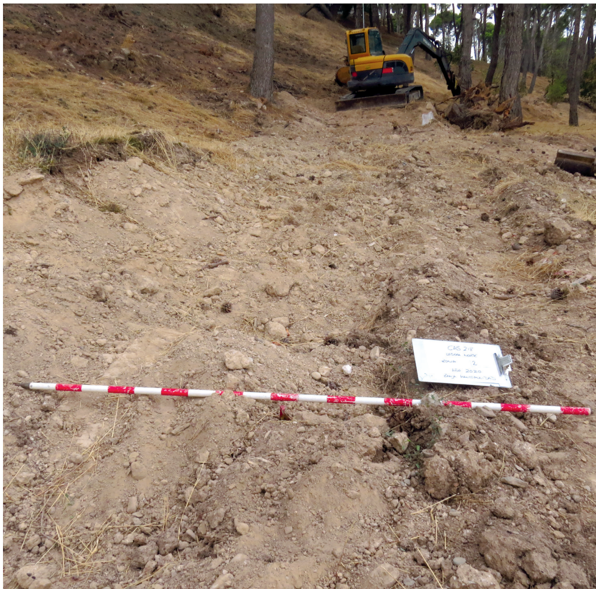
Figura 4. Zonas cubiertas de la zanja principal con excavaciones laterales secundarias.

De los trescientos metros lineales, individualizamos cuatro zonas principales (fig. 1) en las que se recuperaron restos y otras cinco zonas en las que la acumulación era menor.