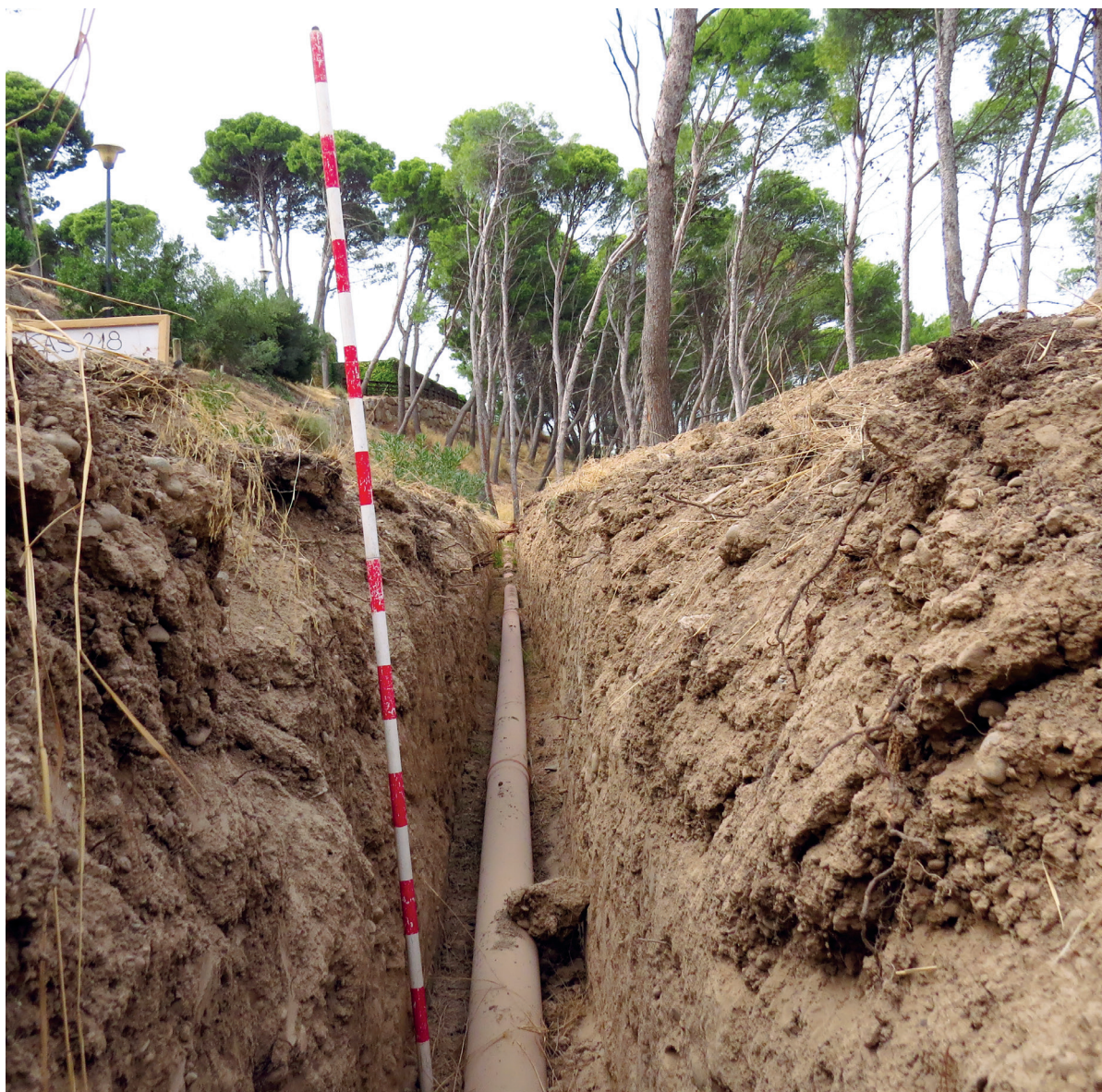
Figura 2. La zanja en la zona más profunda alcanzada que pudimos observar.

Siguiendo las indicaciones del Servicio de Patrimonio Histórico de la Dirección General de Cultura-Institución Príncipe de Viana inspeccionamos la zona visualmente para poder constatar la destrucción de los niveles arqueológicos e hicimos una recogida del material arqueológico extraído de la zanja. Los materiales recuperados que presentamos en este estudio