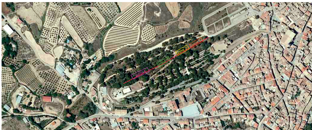
Figura 1. El Cerro del Romero de Cascante y la zona afectada por la obra.

La intervención consistió en la revisión de la zanja ya excavada previamente mediante pala excavadora. La obra consistía en un corte lineal de unos 300 metros de largo (fig. 1), 40-80 cm de ancho dependiendo de los tramos y una profundidad que alcanzó hasta 1,40 metros (fig. 2). Las obras de excavación y de introducción de las tuberías correspondientes ya se habían realizado cuando nos personamos en la zona, por lo que únicamente se pudo constatar la destrucción de niveles arqueológicos y posibles estructuras por parte de la Mancomunidad de aguas de Fitero, Cintruénigo y Cascante, que realizó la obra sin ningún tipo de autorización formal por escrito por parte de ninguna autoridad pública (fig. 3). Por ello fue esta organización la responsable de la destrucción de parte de este bien del patrimonio arqueológico navarro.