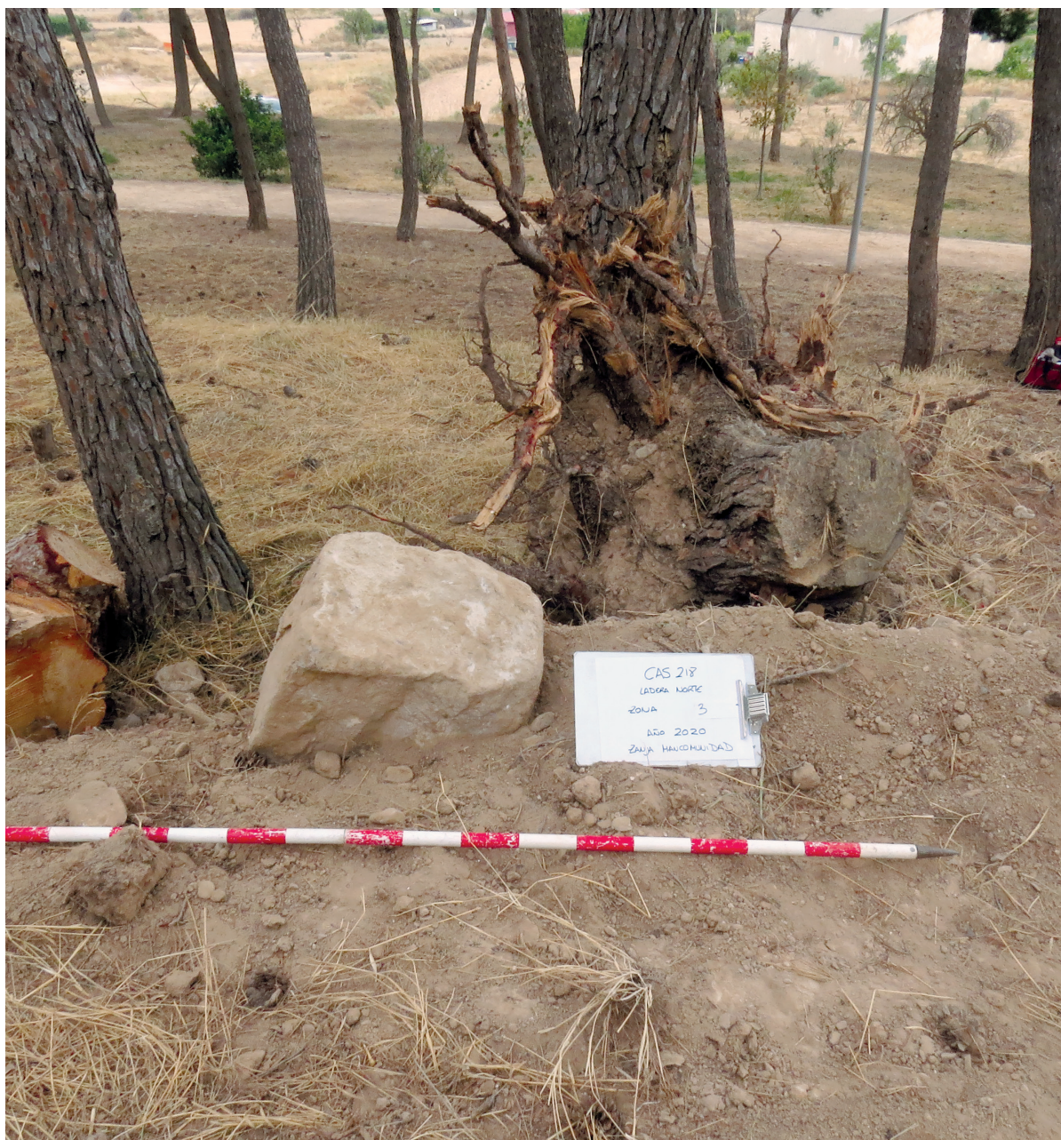
Figura 5. Sillares de arenisca extraídos de la zanja.

de Cascante, nos pidió que hiciésemos el trabajo necesario para poder cerrar esta zona por el riesgo que suponía para los y las visitantes del parque. La supervisión consistió en revisar los cortes de la zanja. Limpiarlos y pudimos ver