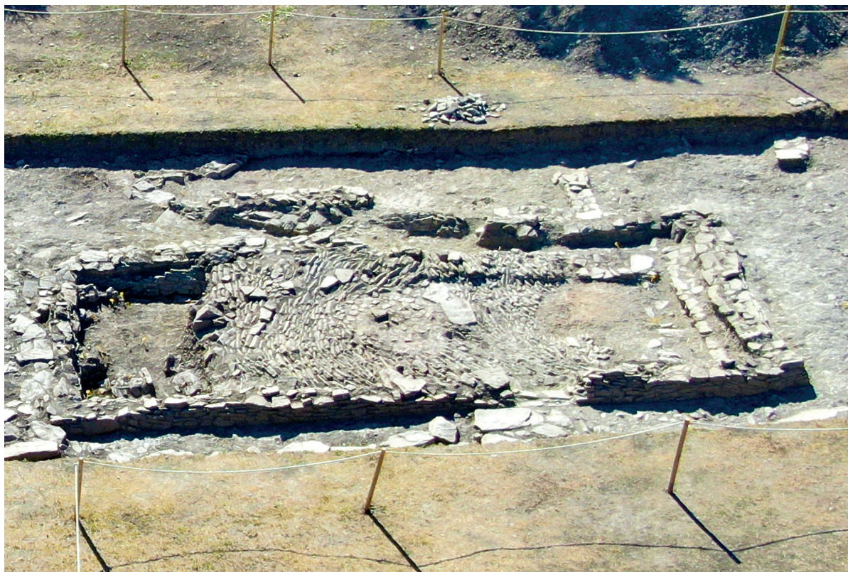
Figura 1. Imagen de la excavación del poblado de Irulegi.

Las características de los restos de la vivienda 3000 hallados al norte de la vivienda 6000, son similares a la anterior, aunque sea preciso subrayar el hallazgo de un hogar de morfología circular rodeado por un suelo adoquinado algo atípico, el cual aparece en casi toda la superficie de la estancia principal. El edificio interpretado como vivienda muestra en su lateral oriental el vano de una entrada, orientada hacia la vía principal que discurre anexa a la misma.