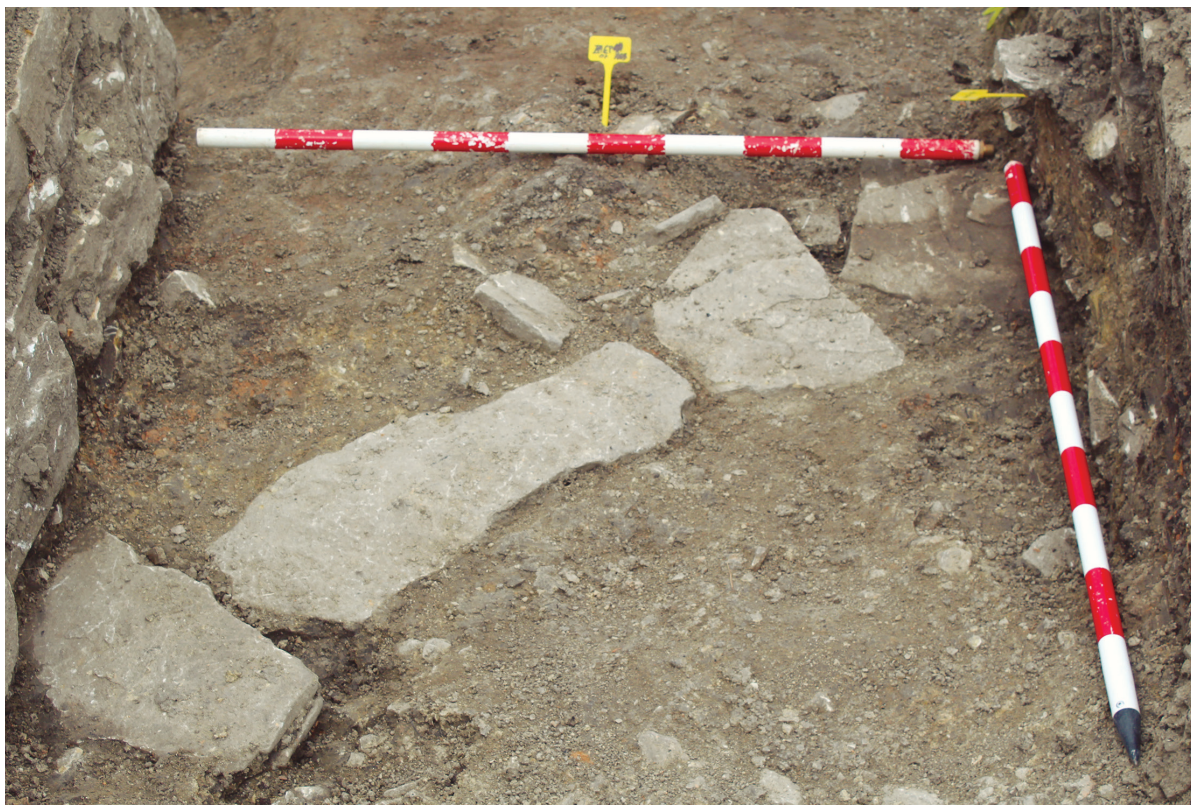
Figura 2. Imagen de la cata realizada.

adecuadamente conservado, ni en la vía principal, ni en la pequeña estrada entre las dos viviendas.