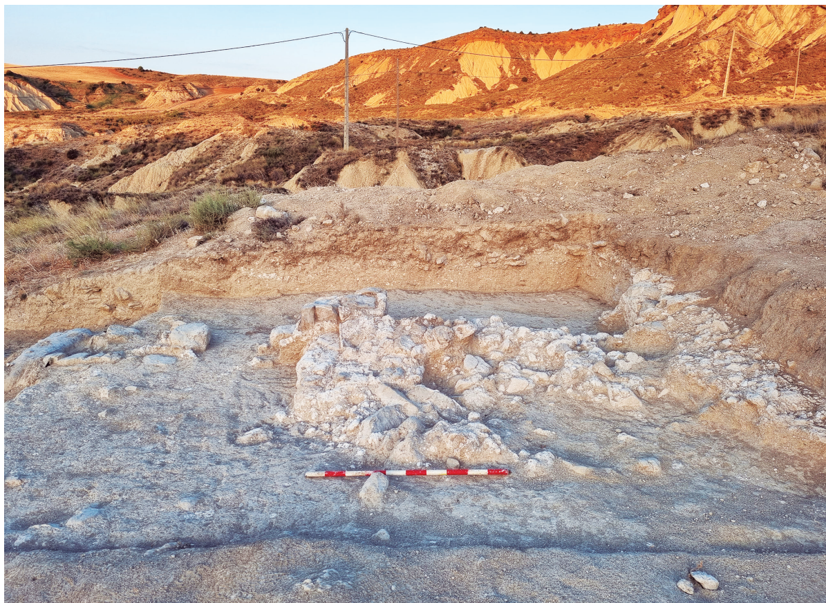
Figura 1. Fotografía del área abierta.

responder a la dificultad de encontrar arbolado lo suficientemente alto como para poder obtener vigas que realicen la función sustentante.