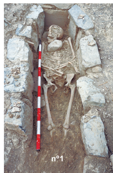
Figura 2. Espacio cementerial: tumbas amortizadas por la estructura mural UE 17.

En el relleno (UE 2) se han registrado abundantes lajas de piedra, de distintos grosores, tejas curvas de tonalidad amarillenta, nueve