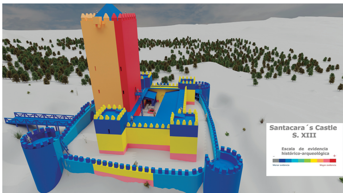
Figura 3. Escala de evidencia histórico-arqueológica de la recreación.

Más allá de contar con las cimentaciones para mostrar la planta, disponemos también de un gran número de sillares labrados correspondientes, al menos, a una puerta más o menos monumental y ventanas adinteladas con parteluz. Dichos elementos han sido recuperados en el interior del aljibe, pudiendo por tanto inferir que se trataría de elementos situados en las estancias interiores del castillo. En el foso menor situado frente al primer recinto se documentaron también una serie de almenas que formarían parte de esta estructura defensiva, pudiendo constatarse que son también en forma de diamante, al igual que las existentes en la torre del homenaje, aunque ligeramente más estrechas. Las propias cotas, así como la localización entre los niveles de escombros de fragmentos de bovedillas de yeso, permiten establecer la existencia de dos pisos en estas estancias del primer recinto. La situación de los accesos tanto al recinto exterior como interior se basa bien en la localización de la puerta, bien en su ubicación más lógica en