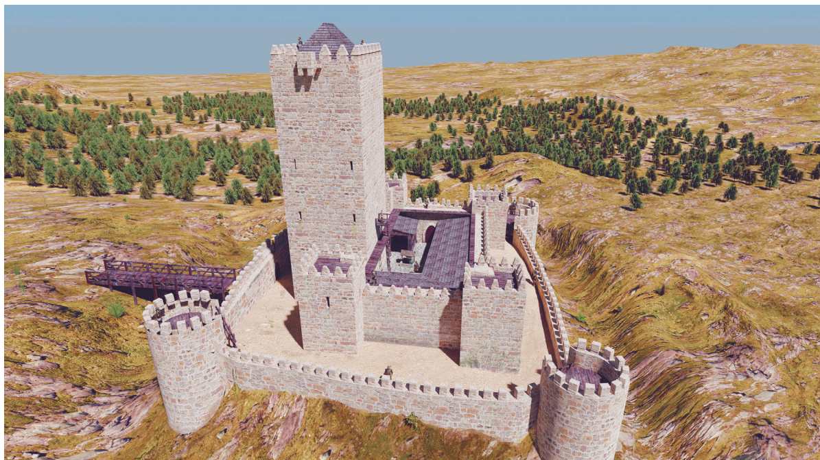
Figura 2. Recreación ideal del castillo en el momento de máximo esplendor.

Siguiendo este principio nos apoyamos en la escala de colores que plantean los autores y que se basa en el proyecto Byzantium 1200 3 . En el caso concreto de Santacara se cuenta con una serie de ventajas que permiten hacer una interpretación bastante sustentada del aspecto original del castillo. El principal es que la torre del homenaje conserva una mitad con el alzado completo, incluidas las almenas y las entregas de los forjados interiores, así como la puerta en altura. Son visibles además en la misma las entregas de los muros del primer recinto, lo que permite establecer la altura del mismo, de manera bastante fehaciente. Con la excavación arqueológica, por otro lado, se ha podido documentar la planta completa de este primer recinto muy regular y casi simétrico. También se conserva el foso principal que rodeaba toda