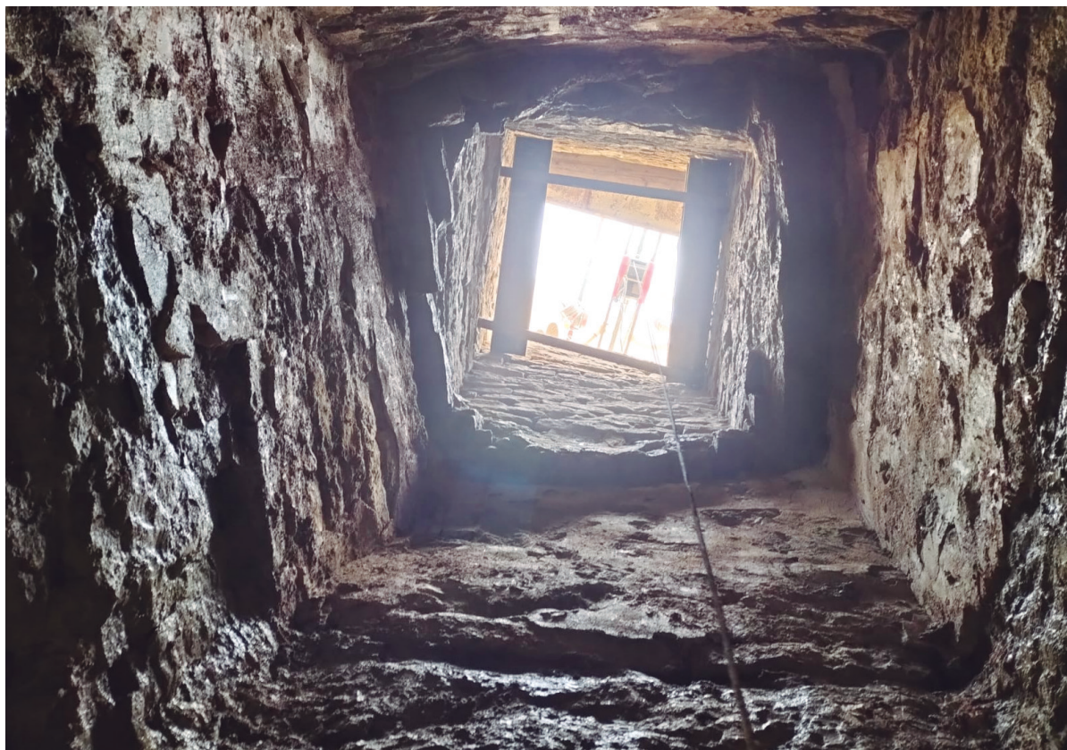
Figura 1. Vista del aljibe en proceso de excavación desde el interior.