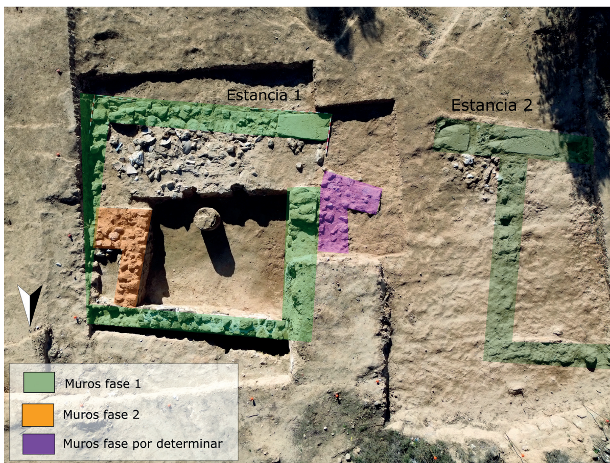
Figura 1. Estructuras localizadas en la campaña de 2023. Autoría: VICUS.

Una vez retirada la UE 0 de forma mecánica, continuó la excavación manualmente con cribado en seco de todo el sedimento extraído. Bajo la UE 0 en todo el sector se identificó la UE 6, de similares características en composición a la UE 0 pero muy compacta, que no había sido afectada por las labores de arado superficial anuales, sino que únicamente fue removida en las labores de arado profundo y desfonde de la finca