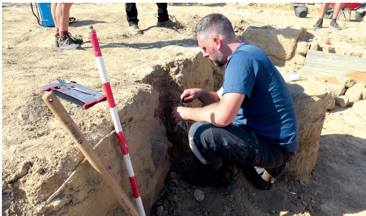
Figura 3. Toma de muestras polínicas de la Estancia 1.

La excavación del Sector 4 nos está aportando un horizonte de amortización de este espacio en el siglo III con una reforma del