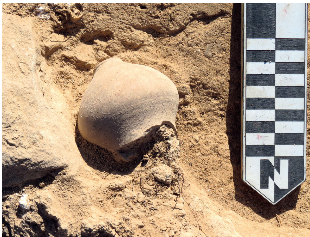
Figura 2. Vaso cerámico documentado en la Estancia 1. Autoría: VICUS.

espacio es de planta cuadrada de 4,60 metros de lado y unos 21,16 metros cuadrados y con una columna central de arenisca. La sucesión estratigráfica de este espacio muestra una acumulación estratigráfica horizontal, con sucesivas unidades sedimentarias superpuestas. Esta acumulación sedimentaria corresponde al momento de abandono del espacio, sin signos de destrucción violenta. Las unidades delimitadas a este espacio se componen de la UE 8, 10, 11, 13 y 14, correspondientes a la última fase de ocupación. Si bien las características de las unidades permiten diferenciarlas entre sí, los materiales cerámicos fragmentados documentados pegan entre las diferentes unidades pudiendo recomponer varias piezas con perfiles completos (fig. 2).