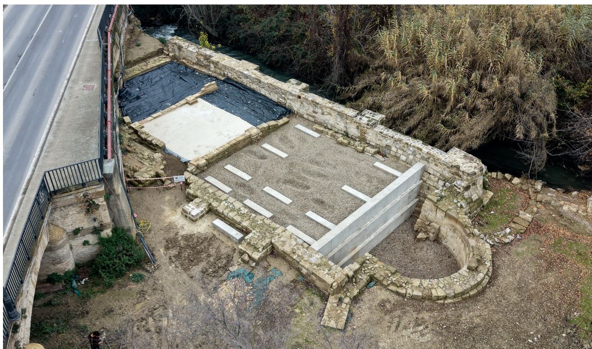
Figura 4. Estado de la ermita tras la primera fase de ejecución de la puesta en valor. (Autoría: Iosu Barragán).

El proyecto, revisado y aprobado por los técnicos de la SRBMA, está siendo ejecutado por la empresa Alpecons S.L. y la brigada municipal del Peralta con seguimiento arqueológico intensivo y continuo. La retirada de la grava del ábside se realizó tanto manual como mecánicamente hasta alcanzar la cota de finalización de la cimentación dejando a la vista la inscripción, inmediatamente después se realizó la instalación del muro escalonado con hormigón a través un encofrado con forjado de hierro. Parte de este hormigón se vertió también dentro del ábside con una inclinación hacia el este hasta un espacio en el cual la maquinaria realizó un sondeo a mayor profundidad que fue rellenado con gravas para favorecer el drenaje de las aguas que se acumulen tanto por lluvia como por inundación.