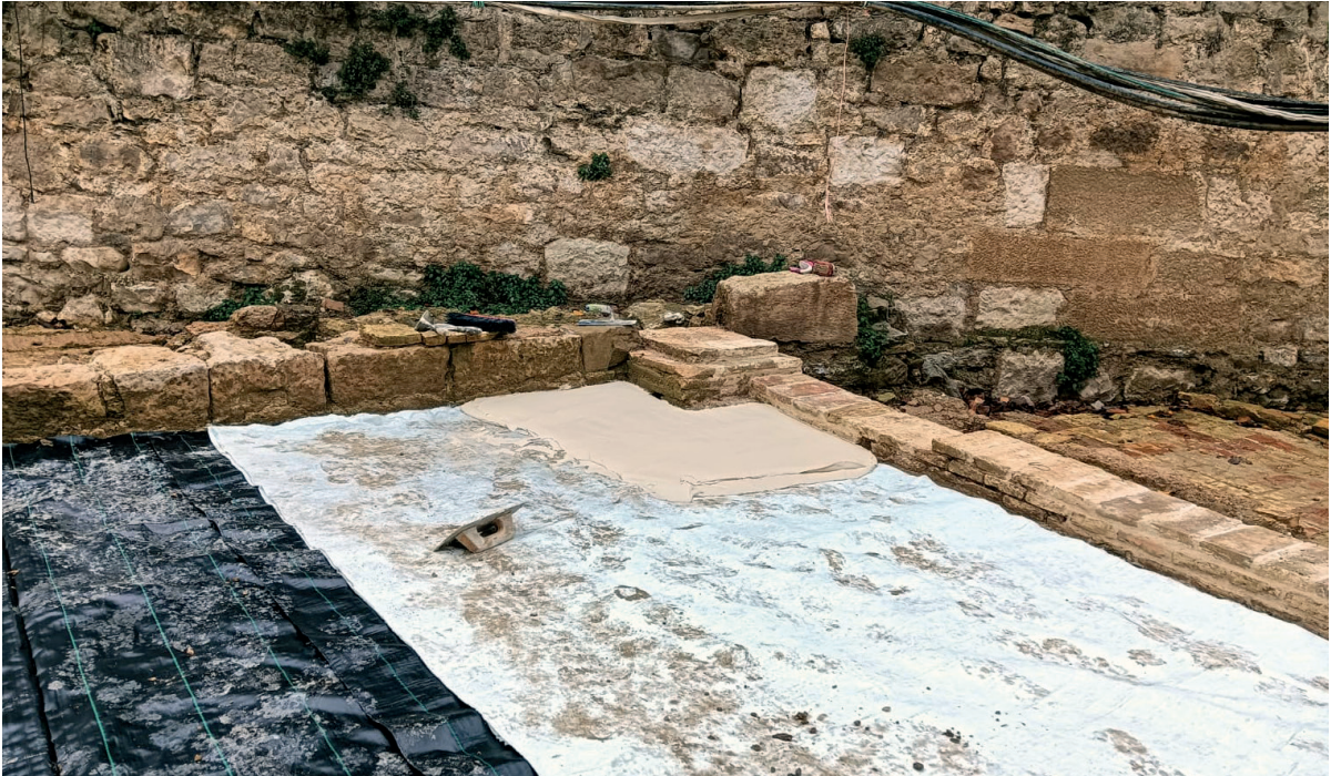
Figura 5. Proceso de la ejecución de la puesta en valor. Restitución de los suelos de cal en el matadero. (Autoría: M. a Rosario Mateo).