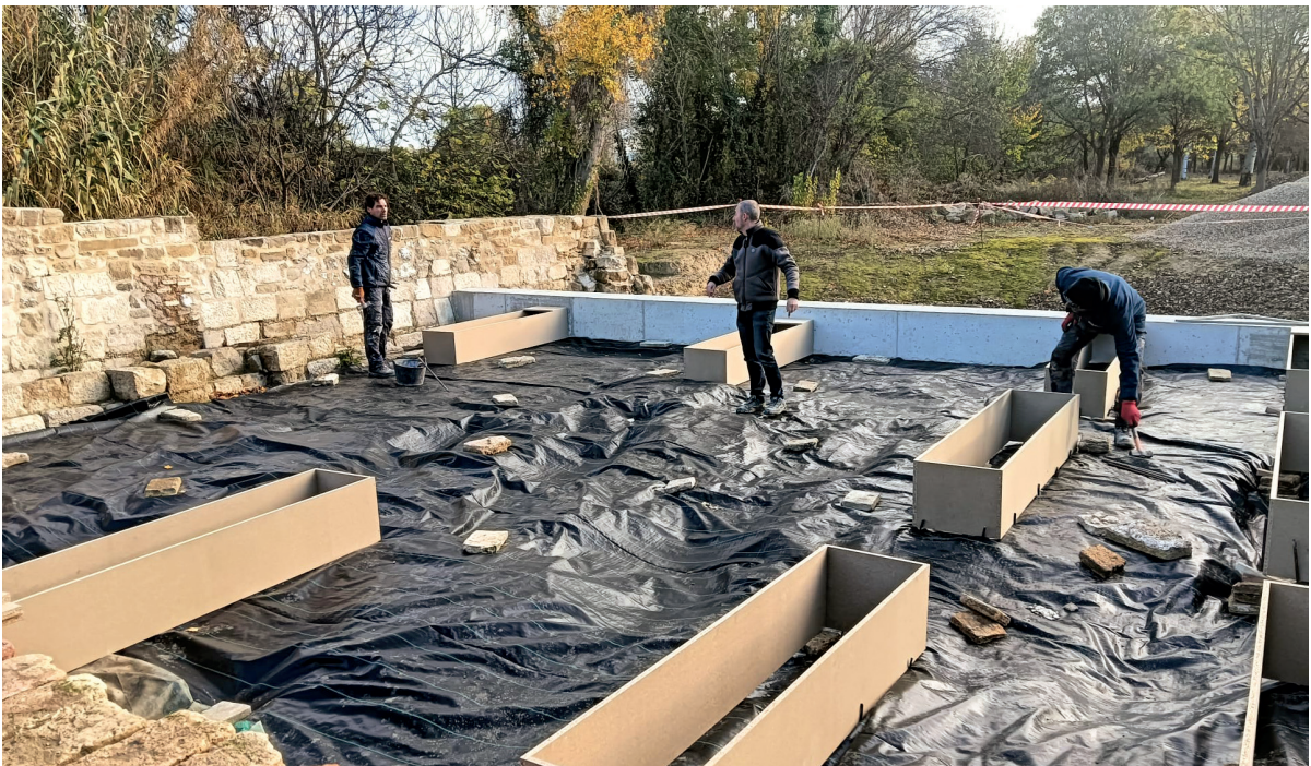
Figura 6. Proceso de la ejecución de la puesta en valor. Colocación de la base para la pasarela.