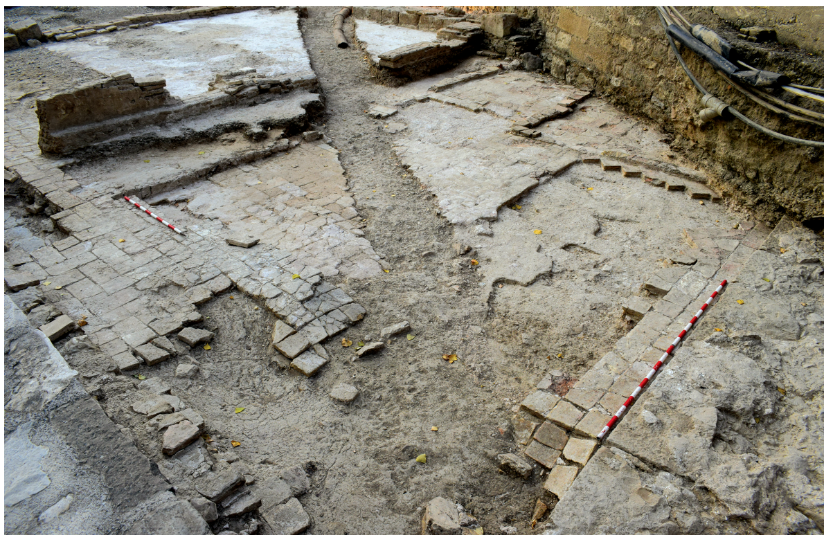
Figura 2. Detalle de la rotura de la zanja para la tubería en el interior del yacimiento.

La estancia que se conserva del matadero pertenecía a una estructura rectangular más compleja de aproximadamente 18 x 5 metros. Ésta se localizó, parcialmente, en las campañas de los años 2021 y 2022, terminándose de delimitar sus dimensiones completas y su excavación en el año 2023. A lo largo de la intervención de ese mismo año se documentaron los