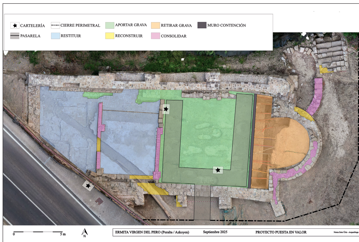
Figura 3. Plano del proyecto de puesta en valor. (Autoría: Nerea Soto).

De todas las medidas propuestas, parte de ellas se han podido ejecutar entre noviembre y diciembre del 2025 en una primera fase, estando prevista la finalización total de la puesta en valor en 2026. Hablamos de la retirada de gravas en el ábside y la construcción de un muro de hormigón de contención, el aporte de gravas en la zona de los enterramientos, el montaje de las bases de la pasarela para las visitas y la consolidación, reconstrucción y restitución de parte de los muros del matadero, el suelo de cal de esta estructura y uno de los contrafuertes dañados por la tubería. También se ha dejado protegido con geotextil y malla anti-hierba parte del espacio donde se restituirá el pavimento de ladrillos originales por otros de similares características actuales.