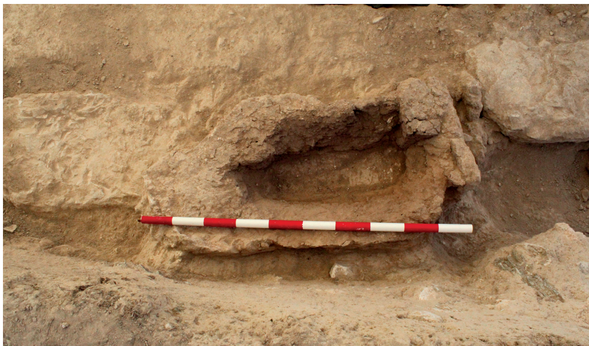
Figura 4. Vista del enterramiento infantil T05/2025.

Corresponde a un enterramiento de grandes dimensiones, adosado al muro norte del presbiterio. Consiste en una fosa antropomorfa de 2 metros de longitud por 60 cm de anchura, delimitada por el norte por un muro de sillares regulares de adobe unidos