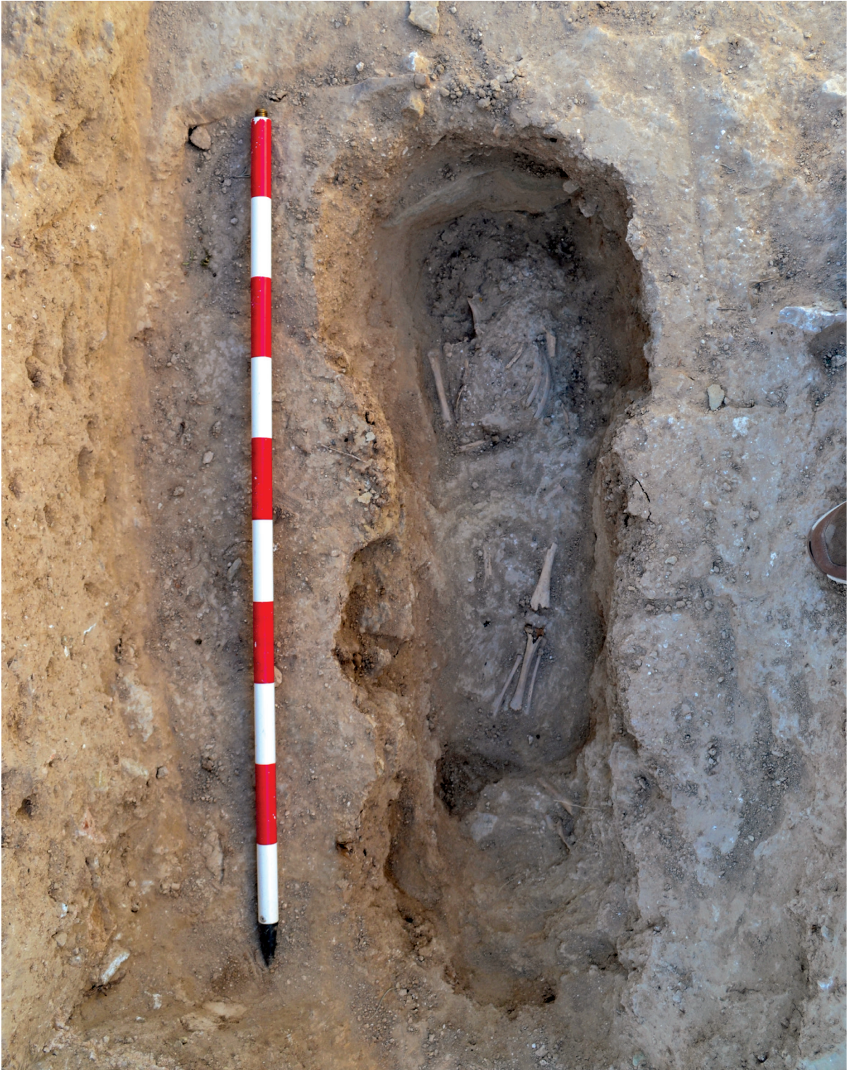
Figura 2. Vista del enterramiento infantil T02/2023.