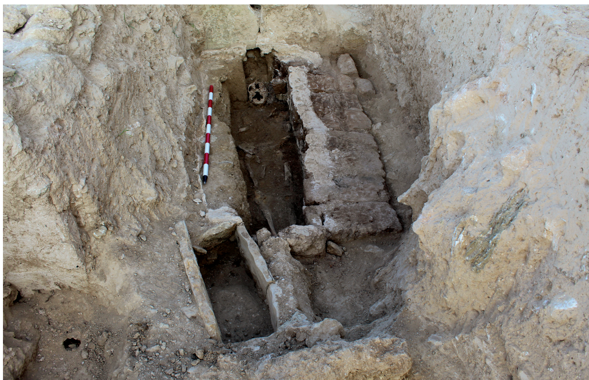
Figura 6. Vistas del enterramiento T02/2025.

Durante las labores de limpieza del sector con vistas a la documentación fotogramétrica de todo el conjunto, se pudo comprobar la existencia de estructuras murarias asociadas al lagar que no habían sido documentadas con anterioridad. En particular, se sacó a la luz un muro similar a los que delimitan la estructura en todos sus lados, pero situado en este caso en perpendicular a la pared sur del lagar, rodeando el depósito.