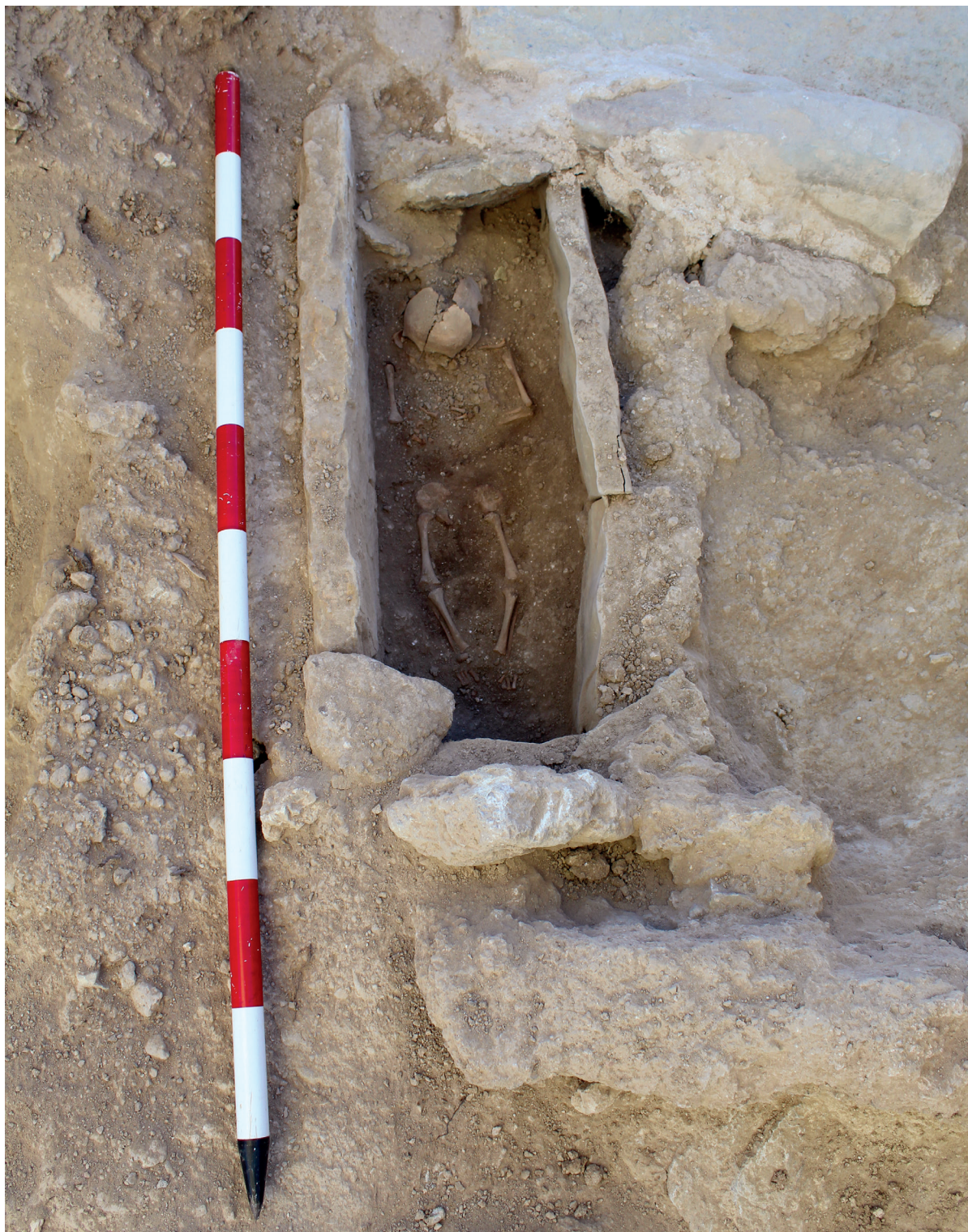
Figura 5. Vista del enterramiento infantil T03/2025.