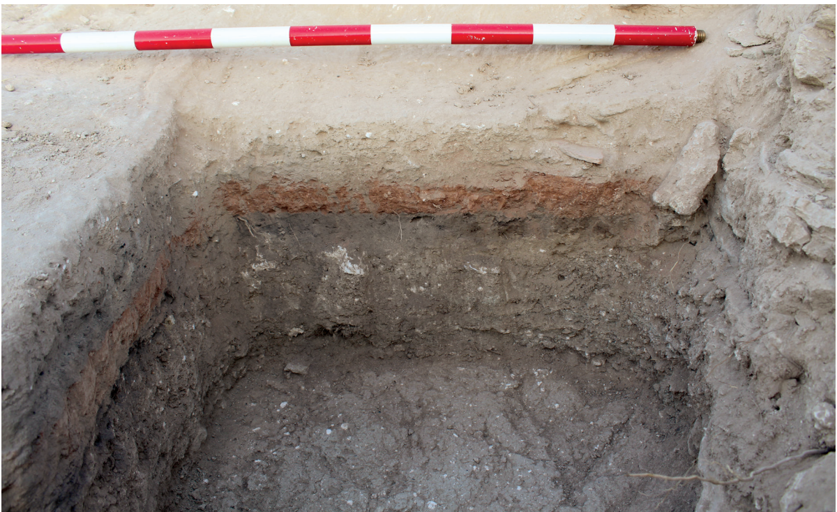
Figura 7. Sondeo estratigráfico practicado en la mancha de combustión que se localizó bajo la estructura del lagar.