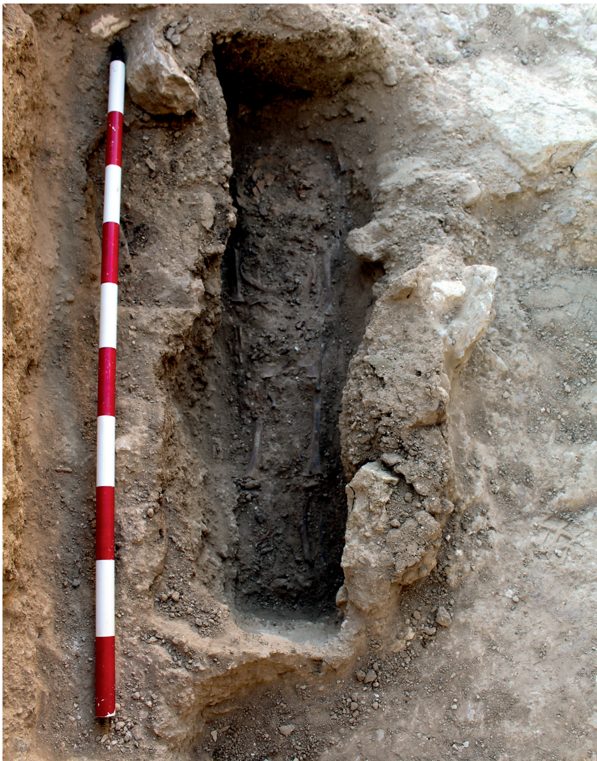
Figura 3. Vista del enterramiento infantil T01/2025.