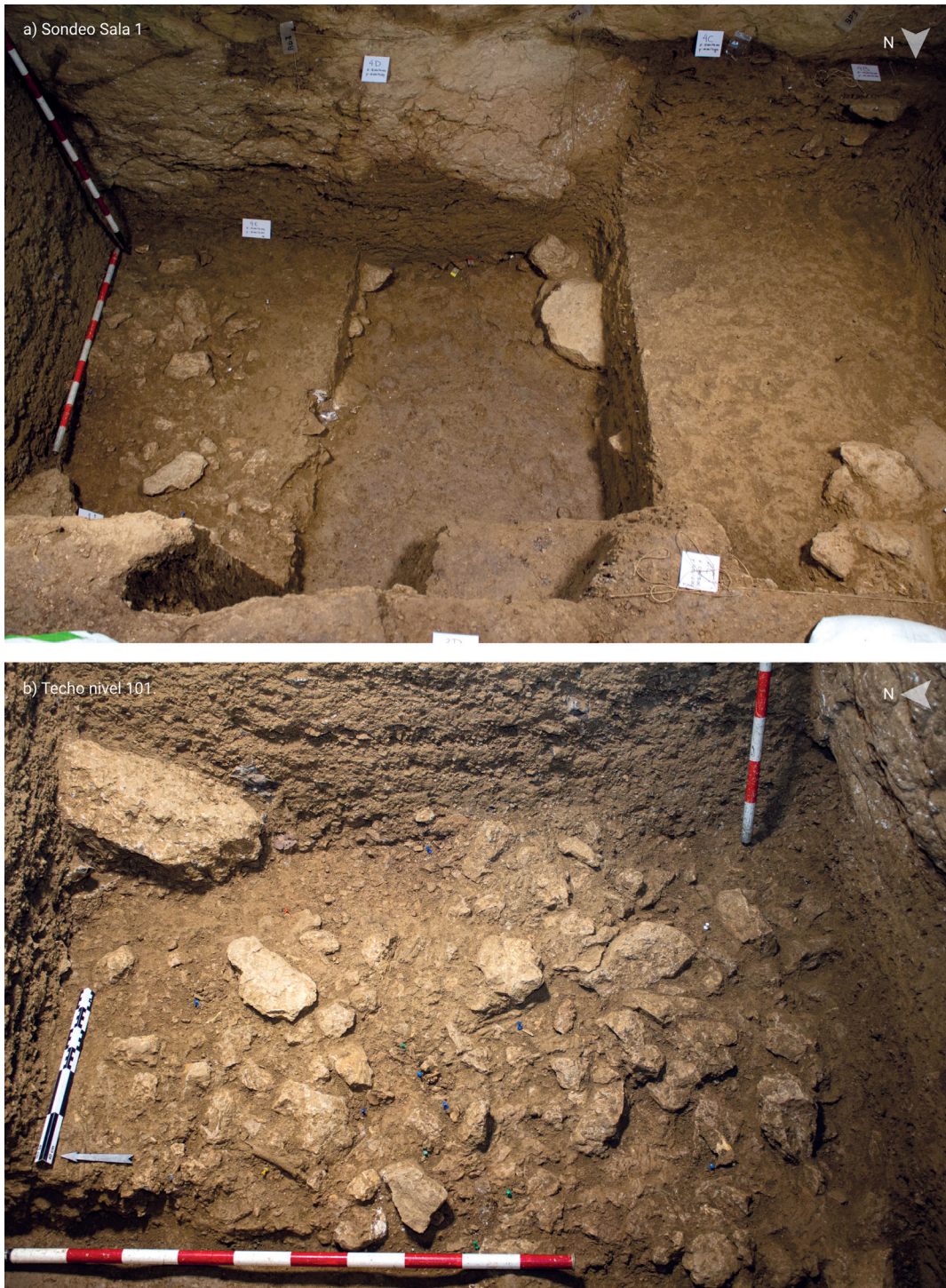
Figura 1. Imagen del sondeo de la Sala 1 y del techo del Nivel 101. a) Vista general del sondeo de la Sala 1 donde se pueden apreciar los tres sectores del mismo a diferentes niveles: E (izquierda), central y O (derecha). b) Detalle del sector oriental del sondeo, a techo del Nivel 101, con referencia de algunos de los restos coordinados.